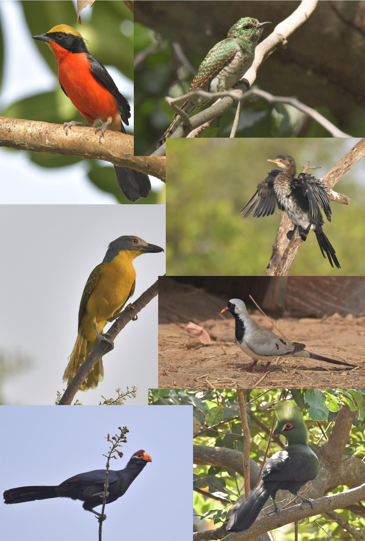
Foto's van Johan Verloop , deelnemer BB-reis Gambia februari 2020: