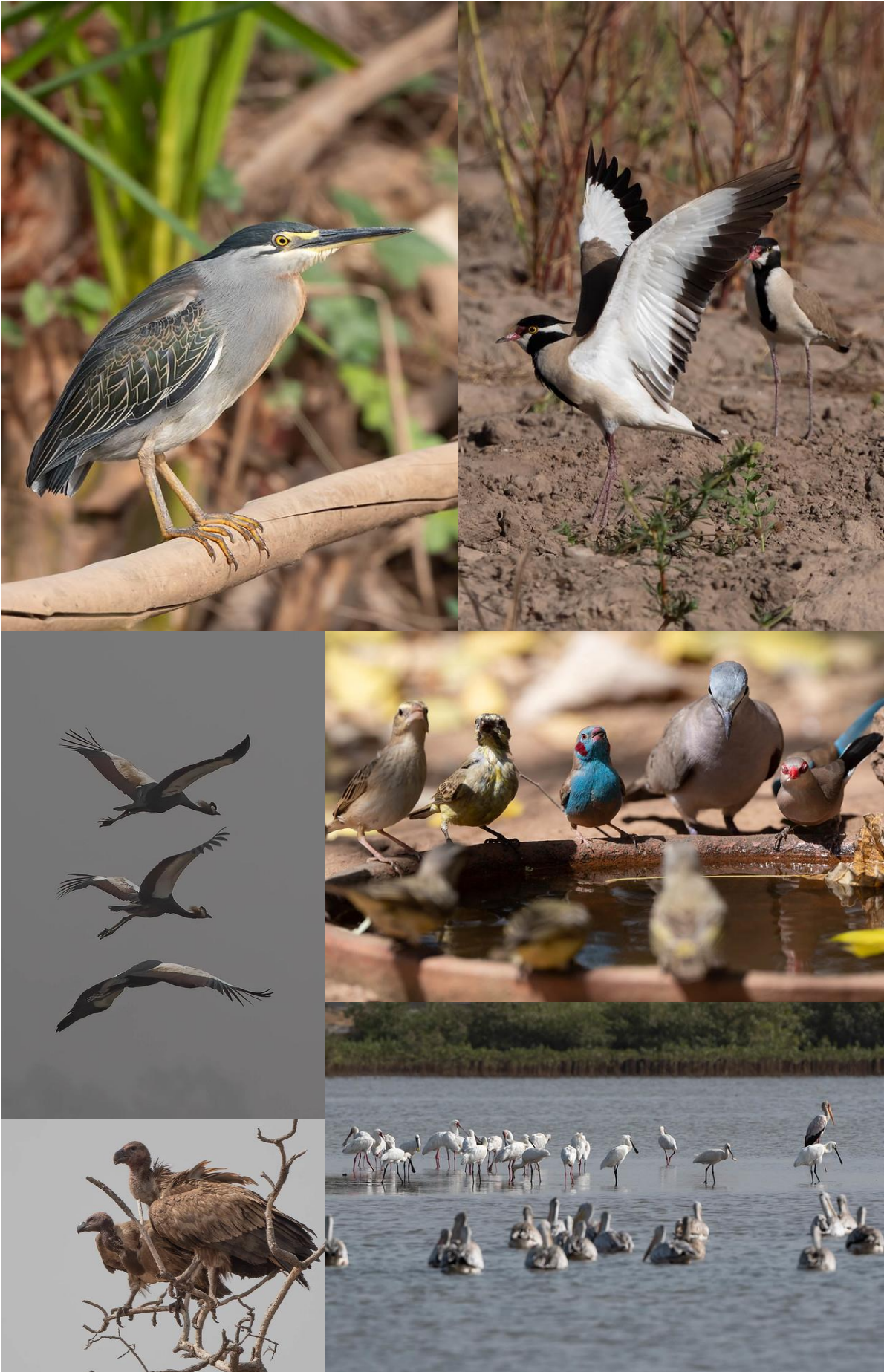
Gambia 4-17 februari 2020