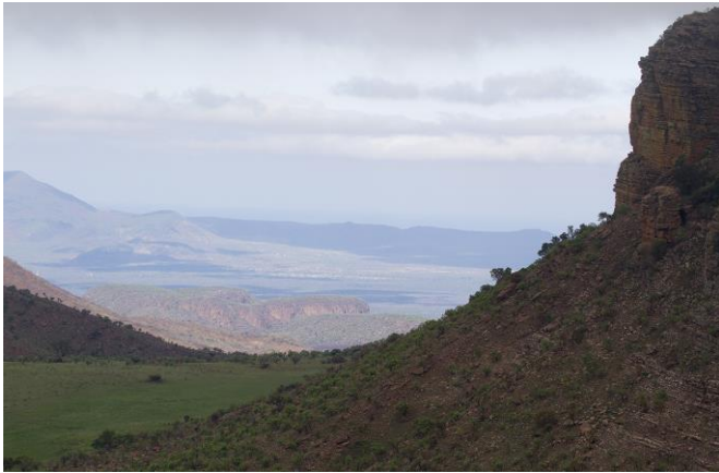
Een stukje landschap, 9nov17