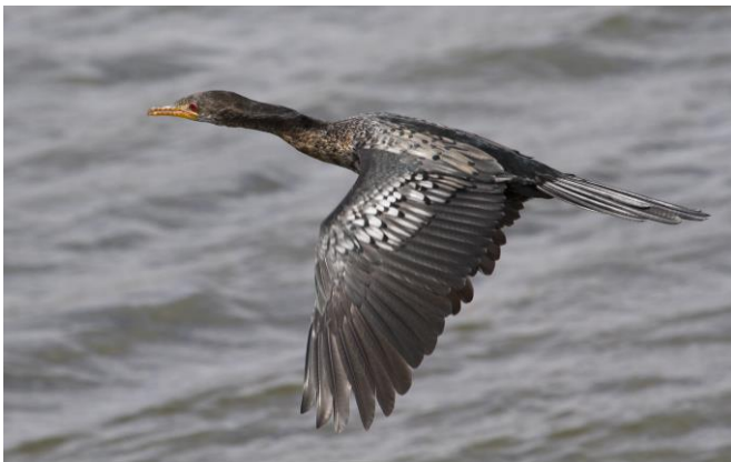
Reed Cormorant, 12nov17