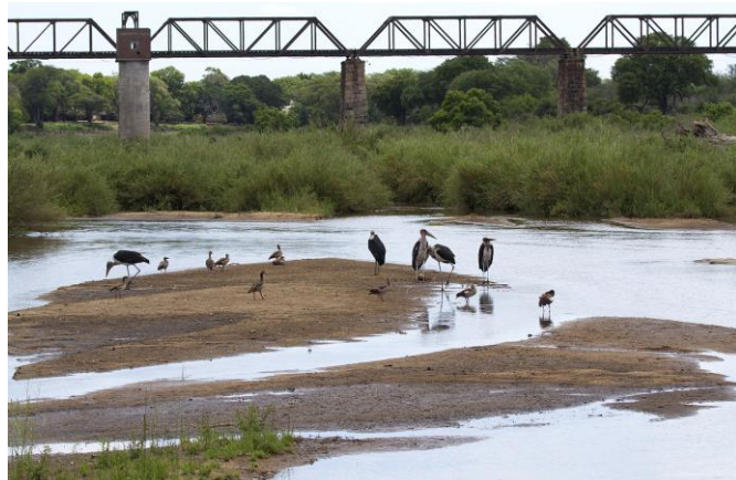
Maraboes bij de oude spoorbrug, 5nov17