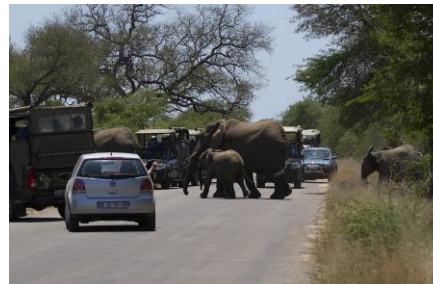
Olifanten zorgen voor opstopping, 6nov17