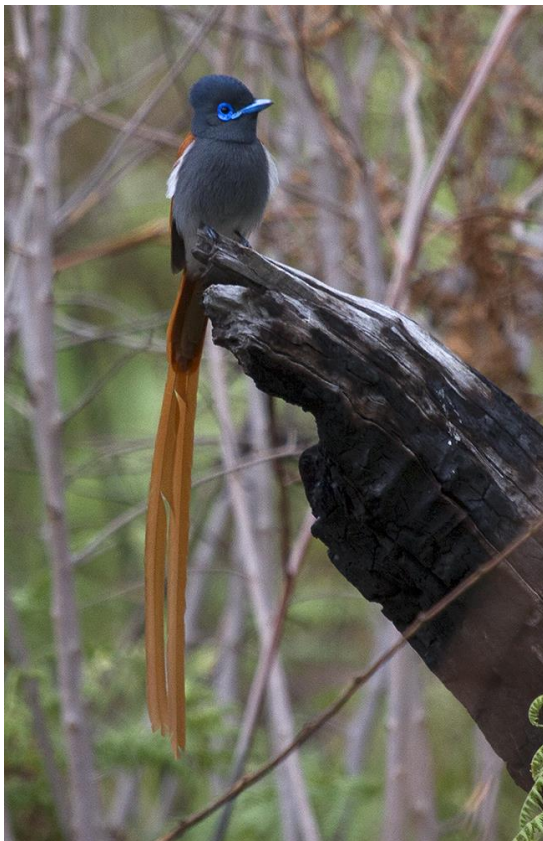
Paradise Flycatcher, 9nov17