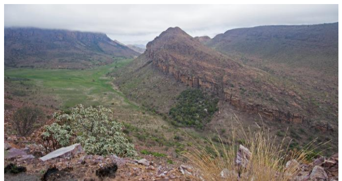
Een stukje landschap, 9nov17