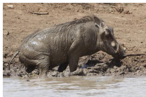
Wrattenzwijn in de modder, 12nov17