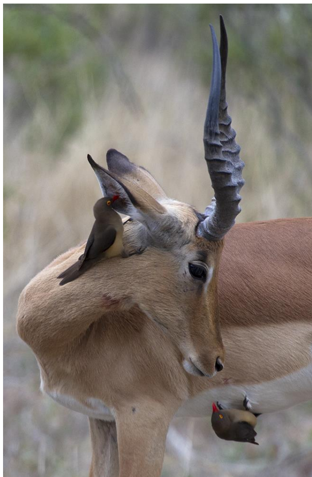
Impala met Geelsnavel Ossepikker, 3nov17