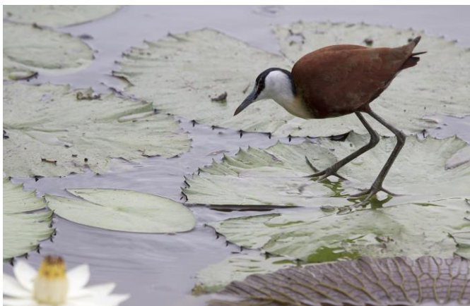
African Jacana op de waterlelies, 7nov17