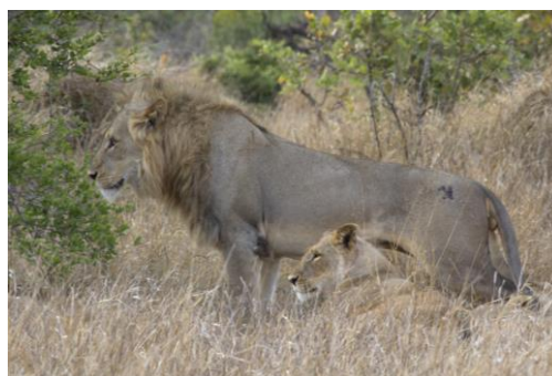
Leeuw en leeuwin, 4 nov17