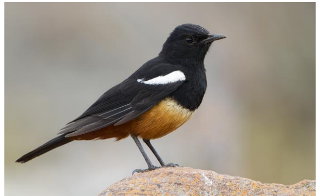
Mocking Cliff-chat man, 9nov17