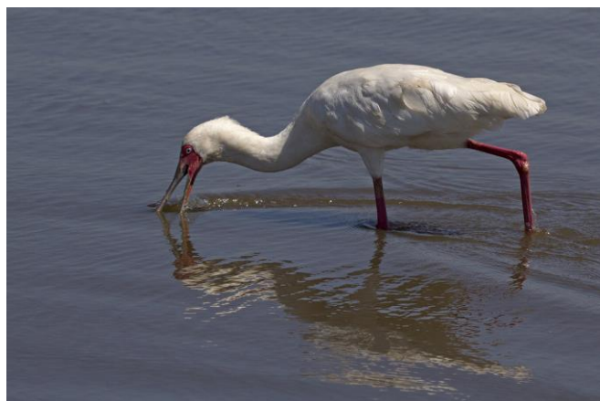
African Spoonbill, 6nov17