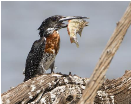
De ijsvogels bij de Mankwe dam hut; Giant,