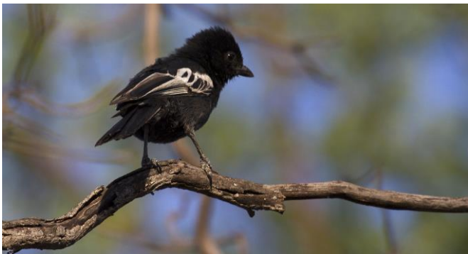
Southern Black Tit, 9nov17