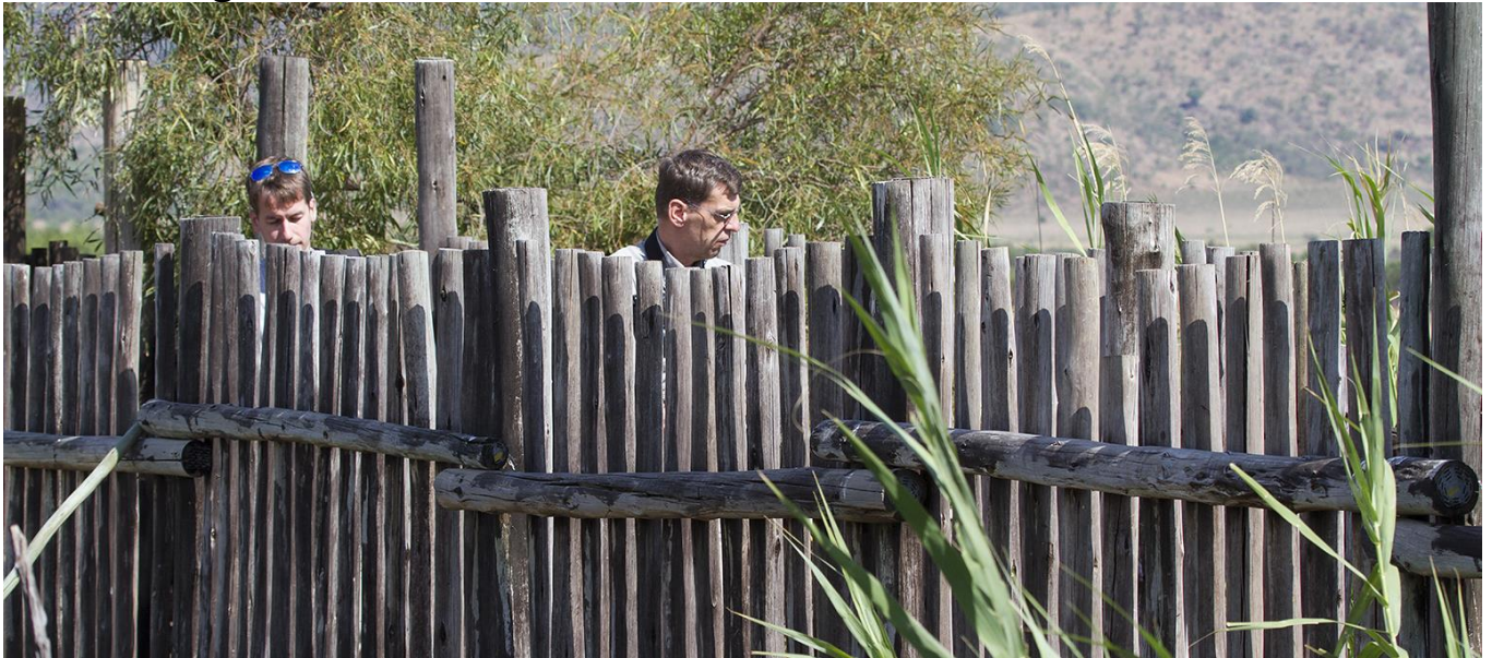
De opgang naar de Mankwe Dam hut