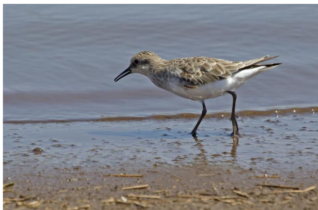
Kleine Strandloper in winterkleed, 6nov17