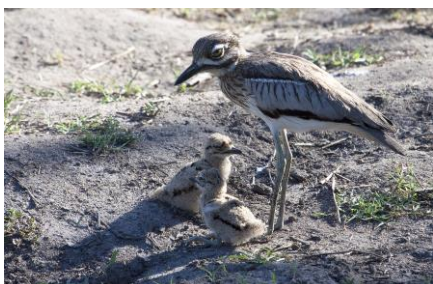
Water Thickknee met jongen, 7nov17