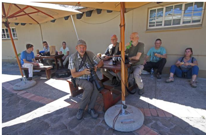
De deelnemers aan de lunch, Pretoriuskop, 1nov17