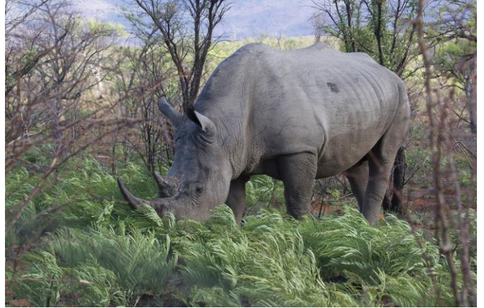
Witte Neushoorn tussen het groen, 9nov17