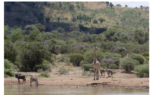
dieren bij de drinkplaats, 12nov17