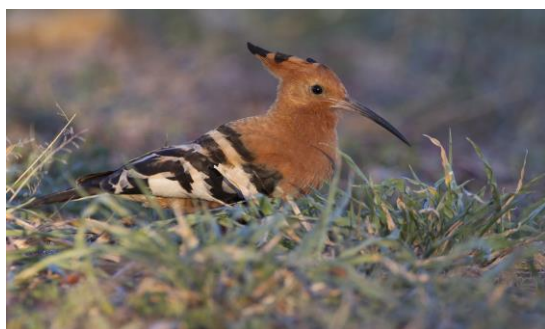
Afrikaanse Hop, 3nov17