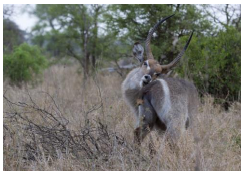
Waterbok met jeuk, 3nov17