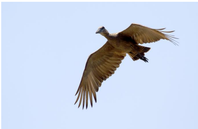
Hamerkop vliegt over ons heen, 6nov17