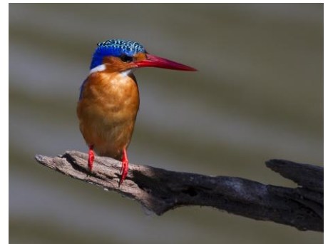
en Malachite Kingfisher