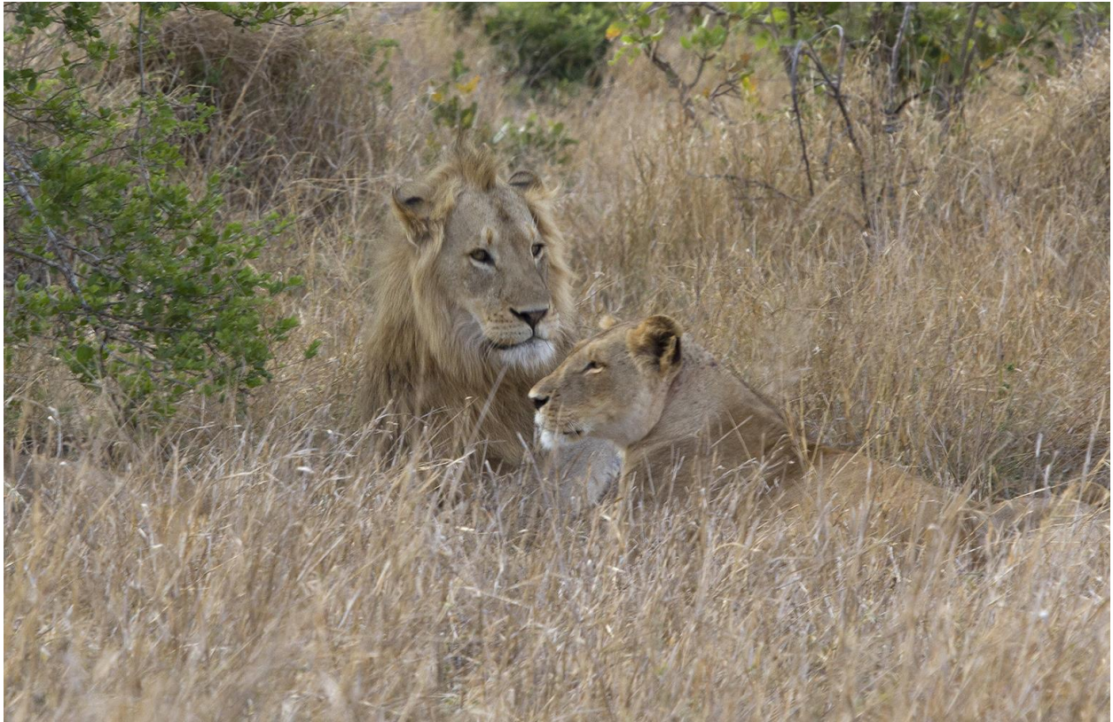
Leeuw en leeuwin, Girvana dam, 4nov17 (Karel Mauer)