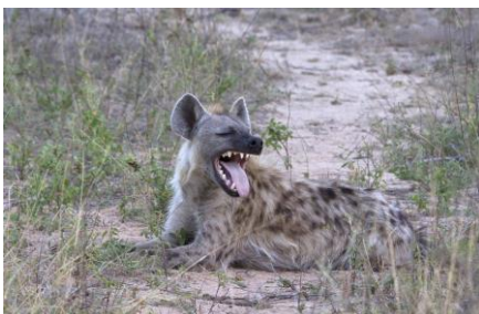
Spotted Hyena, 6nov17