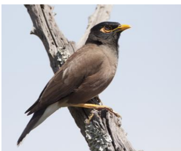
Common Mynah, 11nov17