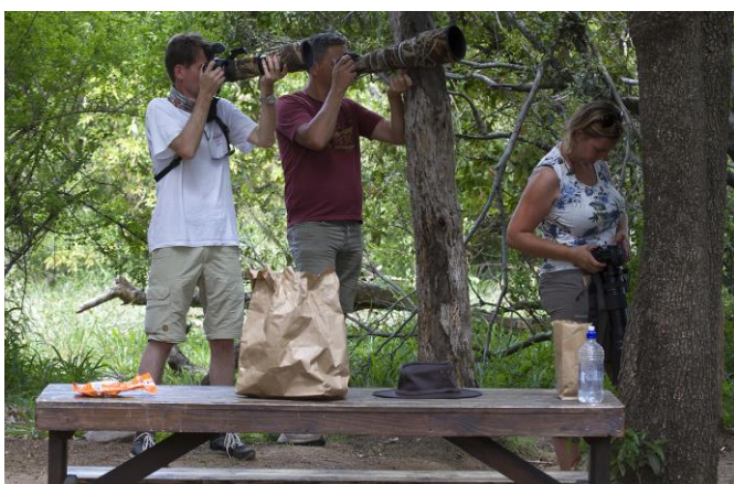
Actie in Afsaal, 7nov17