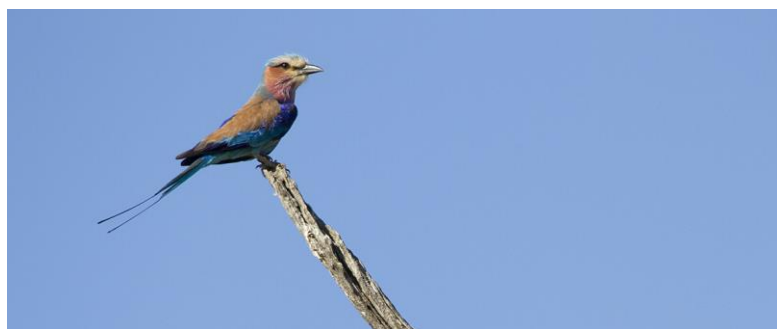
Lilac-breasted Roller, 3nov17