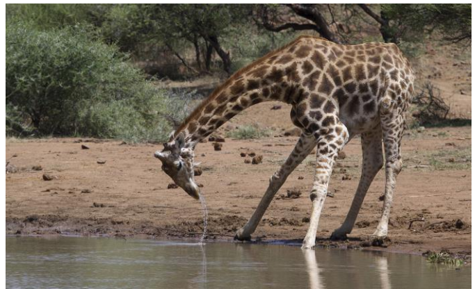
Giraf komt drinken, 12nov17