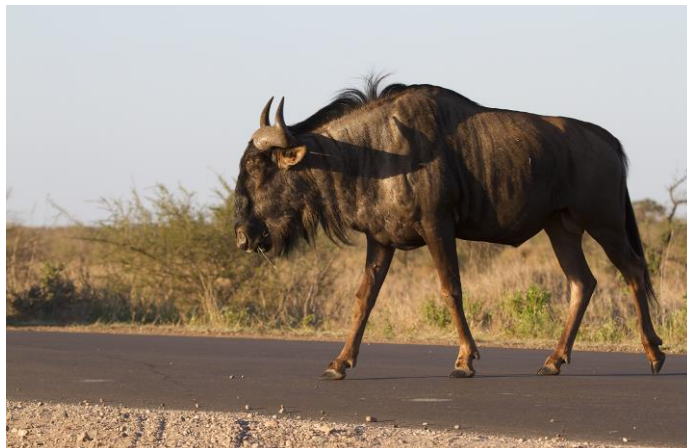
Gnoe in het late zonlicht, 2nov17