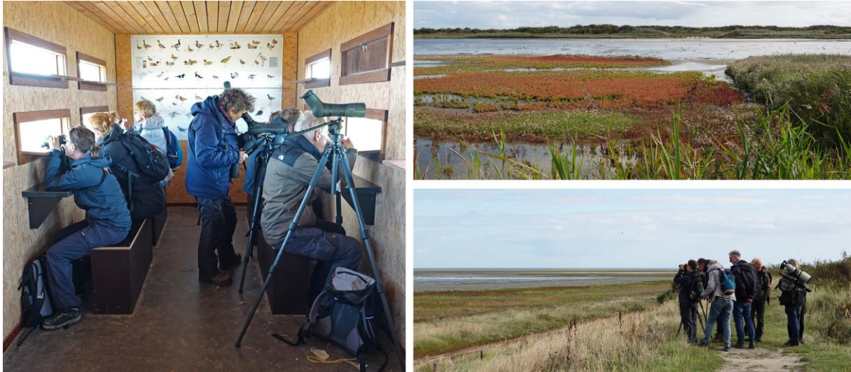
Binnen en buiten de Kroonspolders, Marian Haagsma

We vervolgen onze tocht naar de Kroonspolders. Hoewel het hoog water is staat een stuk wad tegen de dijk aan nog steeds droog. Hier worden naast de vele Tureluurs en diverse Wulpen wat Bonte Strandlopers gezien, Bontbekplevieren, een enkele Kanoet en een Kleine Strandloper. Rond de hut in de Kroonspolders staan wat steltlopers en een groepje Lepelaars het hoog water op het wad af te wachten.