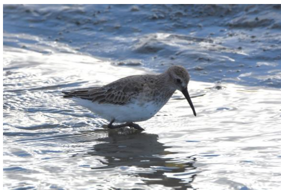
Bonte strandloper – Gerben Mensink

We zijn weer voor het ontbijt gestart met een vogelrondje in en rond het dorp. Er bleek flinke trek te zijn van koperwiek, zanglijster, keep en vink. De ene na de andere groep kwam over gevlogen. Prachtig om de vogeltrek zo direct en zichtbaar mee te maken. Al wandelend vonden we soorten als roodborst, vink, heggemus, winterkoning en pimpel- en koolmees. Het was ook erg leuk om alle verschillende roepjes van de vogels te horen en te ervaren dat deze weliswaar lastig zijn maar heel belangrijk bij het determineren van de soorten.