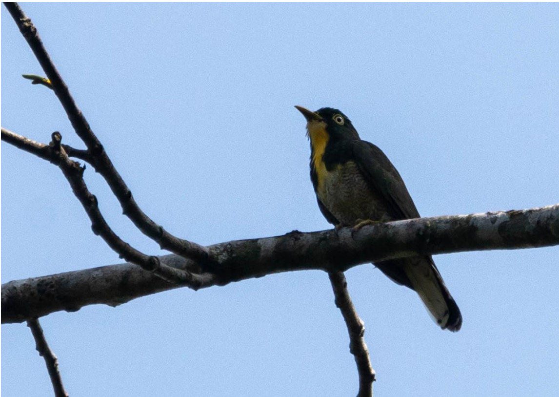
Yellow-throated Cuckoo, foto Arjen Boss

Vroeg gaan we de berg op. Het is een flinke wandeling (ca 7 km) de berg op om in het leefgebied van de Blue-moustached Bee-eater te komen. Een zeldzame soort die op bergruggen voorkomt. In dit biotoop zitten meer specialisten dus we hebben er zin in! Omdat we een drukke dag hebben lopen we in eerste instantie door naar boven en als we tijd hebben gaan we vogelend naar beneden. Het is een mooi bos en we doen het goed gezien onze conditie... Het lukt ons om twee Blue-moustached Bee-eaters te zien! Prachtige vogeltjes die mooi blijven zitten. Verder zien, horen of fotograferen we Blue-headed Crested Flycatcher, Maxwell's Black Weaver, Black-capped Apalis, Rufous-winged Illadopsis, Cassin's Honeyguide, Slender-billed Greenbul, Fraser's Forest Flycatcher, en Forest Scrub Robin. Bijzonder was de waarnemingen van een prachtige Yellow-throated Cuckoo en flyby van een Thick-billed Cuckoo.