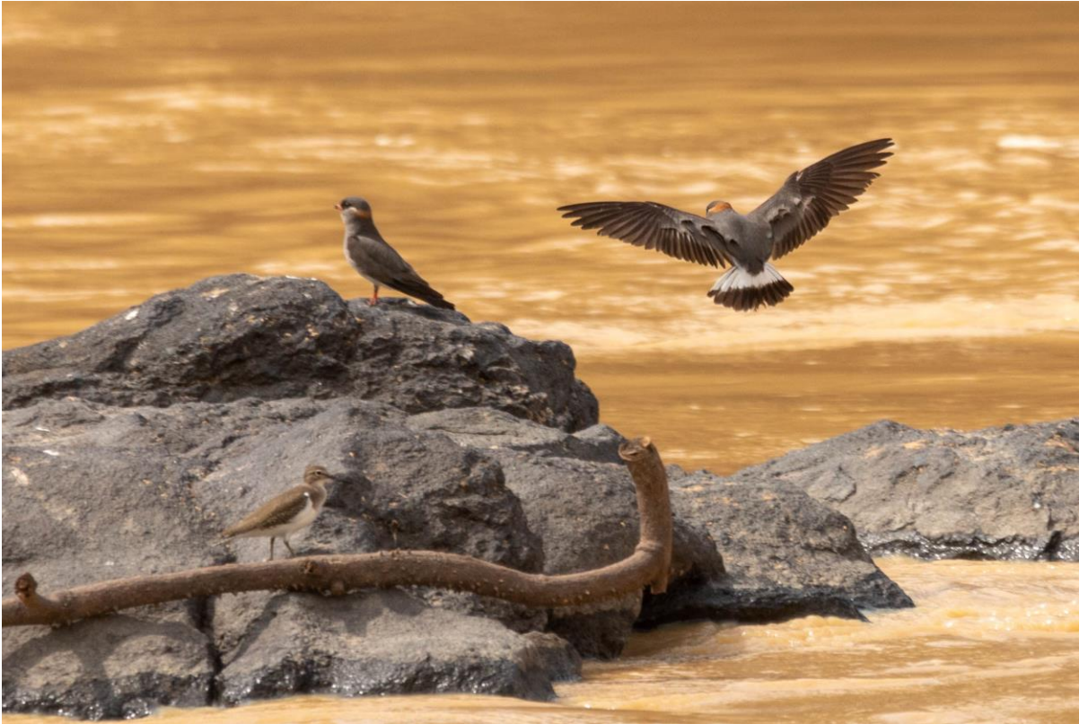
Rock Pratincole's, foto Arjen Boss

komen opdagen. Maar het is zo bijzonder om meerdere van deze prachtige vogels voor je te zien hippen, dat we de tijd vergeten. Hoewel we er geen genoeg van kregen moesten we tegen schemer teruglopen en rijden we de laatste drie uur naar Kumasi waar we in een fijne accommodatie de avond doorbrengen.