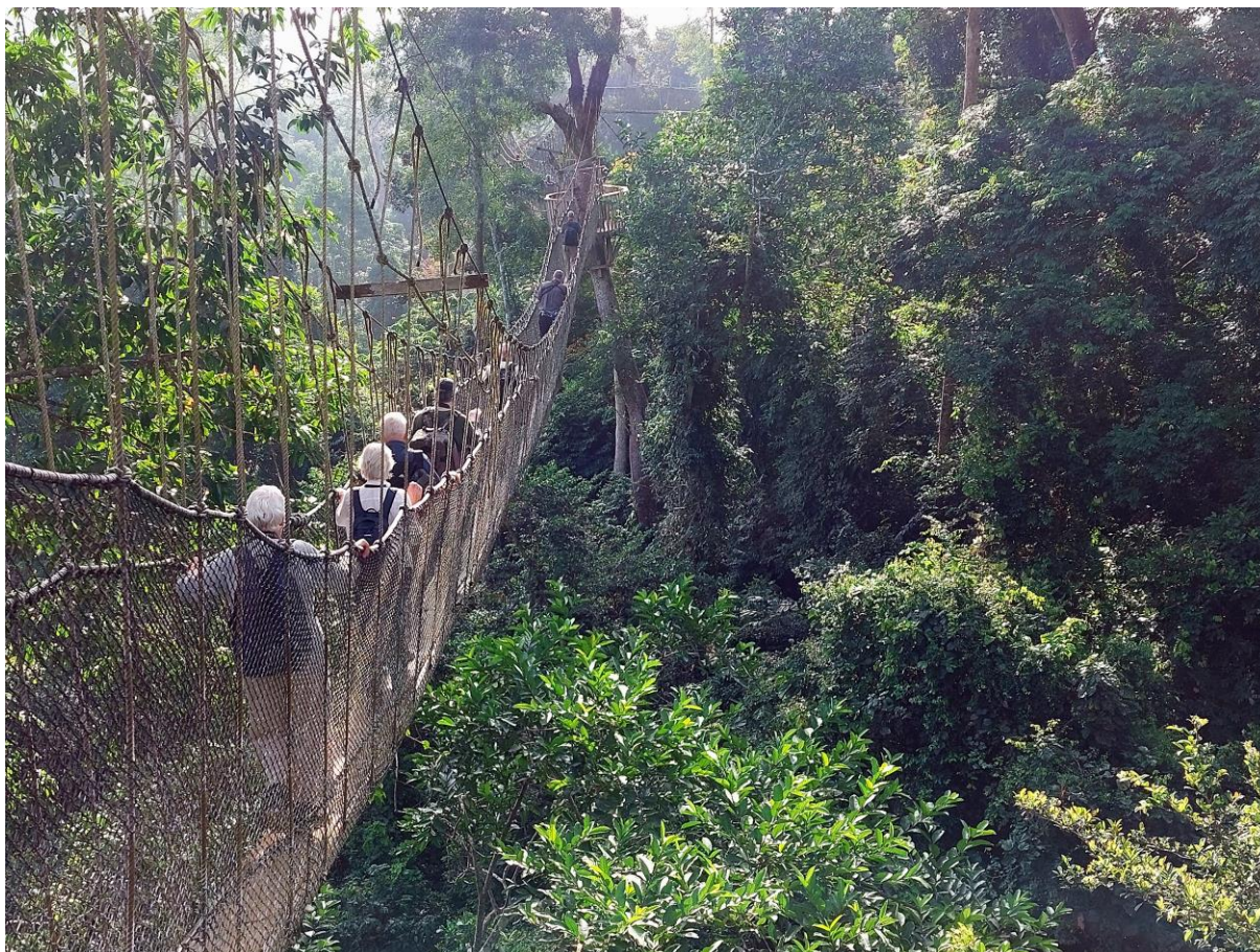
Kakum canopy walkways