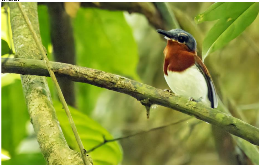
Red-cheeked Wattle-eye, foto Erik Fleur

Vandaag rijden we naar de andere kant van het park. Op de grens van het park en kleinschalige cultuurgronden is het goed vogelen. Na een uurtje rijden staan we te vogelen tussen grote bomen, cassave, cacao, rubberbomen, papaja's, palmoliebomen en bloeiende struiken. Onze lokale gids weet goed welke soorten we nog moeten en doet zijn best om ze voor ons allemaal in beeld te krijgen. Hiervoor moeten we twee keer met hem de bosjes in om White-spotted Fluftail bevredigend te zien. We rollen de volgende soorten op deze ochtend; Red-fronted Parrot, Purple Cuckoo shrike, Red-cheeked Wattle-eye, Blue-billed, Red-vented en Red-headed Malibe (alle drie binnen 15 minuten), Yellow-browed Camaroptera, Swamp Palm Bulbul, Blue-headed Coucal, Birstle-nosed Barbet. Zelfs de Red-chested Goshawk reageerde op de tape en liet zich mooi zien. Op de terugweg naar onze lunch werden we weer door de gids getraakteerd dit keer op bananen, bananenchips en lokale pinda's. Wie hoopte af te vallen deze trip, komt bedrogen thuis.