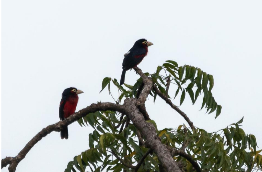
Double-throated Barbets in Shai Hills

Tijdens schemer komen we aan op ons hotel bij Kakum. Nadat we onze kamers kregen, hebben we de lijst opgemaakt en heerlijk gegeten. De halve liters Club bier zijn niet duur dus we laten ze graag onze dorst lessen.