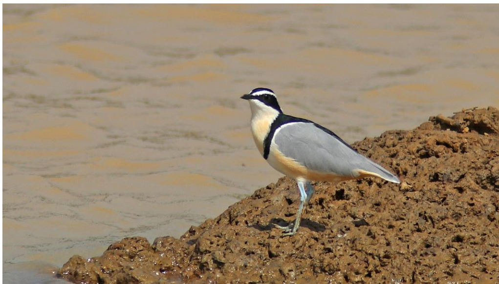
Krokodilwachter