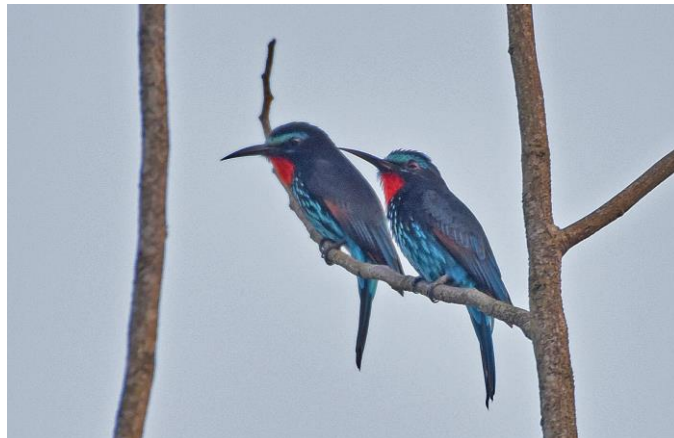
White-crested Hornbill en Black bee-eaters in Kakum NP