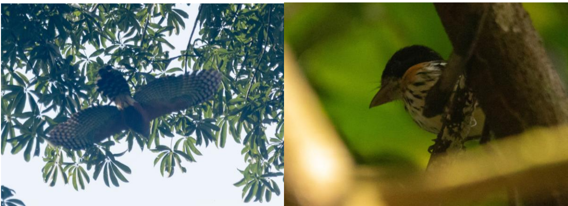
Long-tailed Hawk en Rufous-sided Broadbill, foto's Arjen Boss

We begonnen onze vogeltocht in een cultuurlandschap en liepen daarna door een groot stuk regenwoud. Het bleef gelukkig droog hoewel onze shirts door de drukkende warmte steeds kletsnat waren. Het was de beste ochtend in Kakum NP. We zagen die soorten die we nog misten en naar uitkeken. Bijvoorbeeld Naked-faced Barbet, Copper-tailed Starling, Emerald Cuckoo, Shining Drongo, Johanna's Sunbird en Forest Robin. Maar de echte knallers die we ook nog eens mooi te zien kregen waren; Red-billed Helmetshrike, Rufous sided broadbill en de Long-tailed Hawk. Deze laatste kwam een paar keer overvliegen en sommigen zagen hem nog even goed zitten in de scoop. Tussen de middag afkoelen in het zwembad zat er nu niet in. Na de lunch reden we richting Nsuta Forest. In de middag checken we in onze nieuwe hotel en gaan de namiddag op pad en bezoeken wat restanten van het regenwoud. We zien hier onze eerste Piping Hornbills, Cassin's Spinetail, Square-tailed Saw-wing en horen White-tailed Alethe en Little Greenbul. Als we in de schemer weer bij Erik en ons busje zijn, lukt het nog om een African Wood Owl aan het roepen te krijgen, een geslaagde dag!