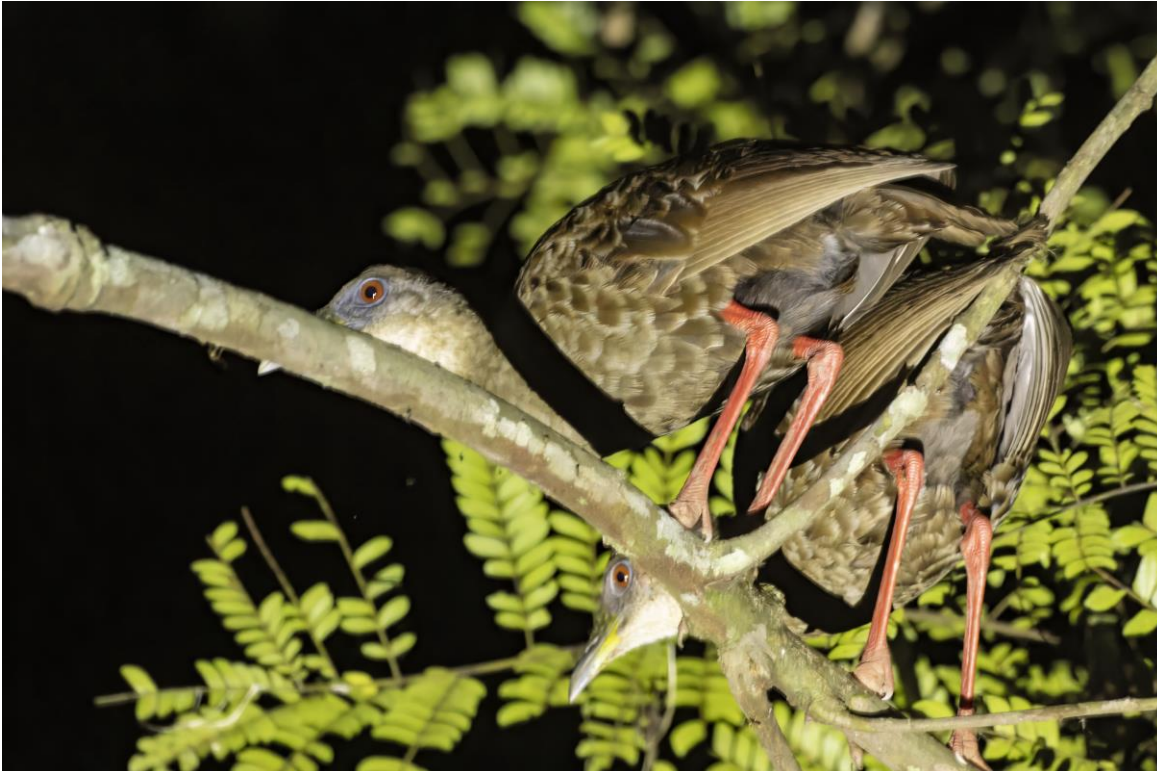
Nkulengu Rails in Ankasa

Waar we de lunch gebruikten bij de ingang van het park, zagen we ook Swamp Palm Bulbul, Red-bellied Paradise Flycatcher, Fraser's Forest Flycatcher en Western Bearded Greenbul. In de namiddag was het rustiger maar lukte het ons nog nieuwe soorten te zien in het bos. Pale-breasted Illadopsis, Western Bronze-naped Pigeon en Duskey-Bleu Flycatcher werd aan onze lijst toegevoegd. Het lukte ons ook om de Great Blue Turaco te zien. Maar de topper was de zichtwaarneming van de twee Nkulengu Rails. In het donker ging onze gids op zoek en vond een slapend stelletje. Bijzondere soort! Rond ons restaurant, bij de ingang van het park zagen we ook nog een kameleon en zeer grote kevers, lijkend op de Europese neushoornkevers maar dan 5 keer zo groot!