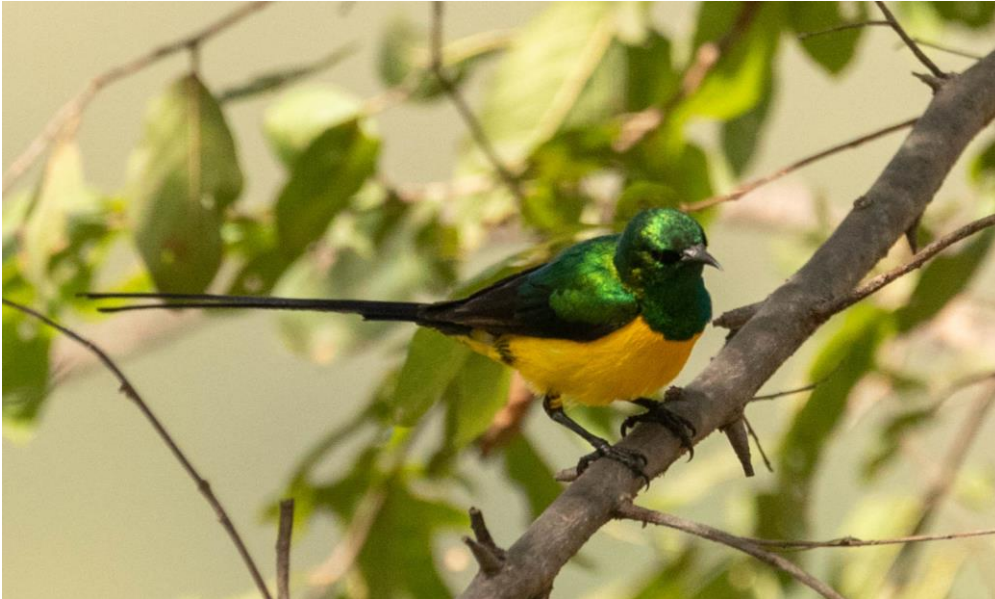
Pygmy Sunbird

De middag levert nog de volgende soorten op; Grey-headed en Striped Kingfisher, White-backed Vulture, Red-necked Falcon, Bateleur, Bruce's Green Pigeon, Oriole Warbler, Senegal Eremomela, Green Woodhoopoe en Black Scimitarbill. Het lukt ons niet om de Rufous-backed Lark te zien maar zien wel Sun Lark, Chestnut-backed Sparrow-Lark, Four-banded Sandgrouse en meerdere Forbes Plovers. Ook de onze Rock-loving Cisticola een bijzondere (zuidelijke) waarneming. De avond zorgt voor waarnemingen van meerdere Greyish Eagle-owls, Spotted Thick-knee en Long-tailed Nightjar.