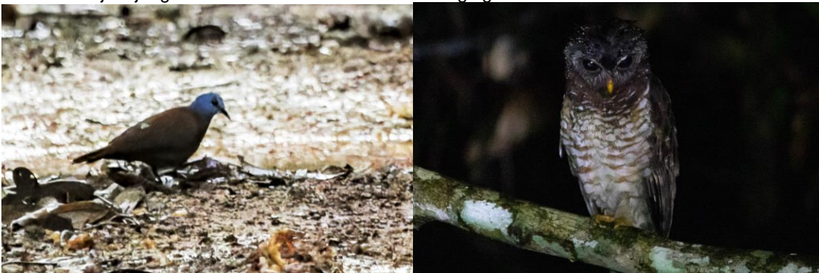
Blue-headed Wood Dove en African Wood Owl

Omdat Nsuta Forest ons weinig meer te bieden had, zijn we vroeg vertrokken richting Ankasa. Onderweg stopten we bij een mooi meertje waar we ondermeer; Malachite Kingfisher, African Pygmy Goose, Black Crake, Black-bellied Seedcraker, African Hobby en Orange Weaver zagen. Later hadden we nog een stop bij een rivier langs de kust waar we snel Mangrove Sunbird en Reichenbach's Sunbird inkopten. Na de incheck en lunch bij Ankasa, gingen we het park in. Het is het enige echte natte regenwoud van Ghana...en na een flinke bui kunnen we dat bevestigen. Door de regen hebben we alleen kunnen vogelen bij een open plek (bij een hoogspanningslijn) in het ongerepte regenwoud. Nieuw voor de lijst was Yellow-whiskered Greenbul, Blue-headed Wood Dove, Grey Parrot en de Chocolate-backed Kingfisher kregen we mooi in onze telescoop! De Great Bleu Turaco hoorden we alleen maar deze weigerde om in ons beeldveld te komen. We deden in de schemer nog een serieuze poging voor de Nkulengu Rail maar deze reageerde niet. Met de jeeps rijden en gleden we weer over de natte paden richting uitgang. Onderweg zat er een prachtige African Wood Owl boven de weg die zich zonder problemen door iedereen liet fotograferen. Onderweg hadden we al een paar keer de Akun Eagle-Owl afgespeeld maar geen respons. Daarom was onze vreugde groot toen er eentje bij tegenover het restaurant zat waar we gingen dineren! Deze zeldzame oehoe was mooi te zien.