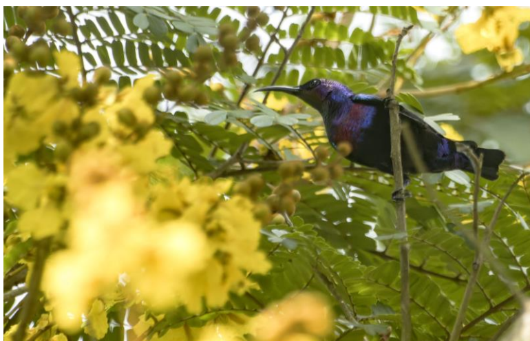
Splendid Sunbird

Wat betreft de vogels zijn de noemenswaardige of nieuwe soorten; Forest Francolin, Narina Trogon, Golden Greenbul, Plain Greenbul, Longtailed Hawk, Finsch's Rufous Thrush, Variable en Little Green Sunbird, Preuss's Weaver, Blue Cuckooshrike, White-throated Greebul, Black Cuckoo, African Piculet, Red-chested Goshawk en Narrow-tailed Starling.