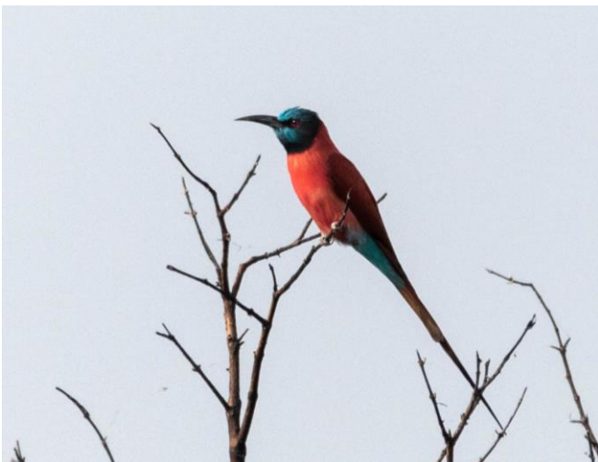
Northern Carmine Bee-eater

Bij Mole Hotel komen we eind van de middag aan en hebben we tijd tot het avond eten. Heerlijk genieten van de prachtige plek. Bij het uitkijkpunt vliegt een Chestnut-backed Sparrow-Lark weg en vliegende Red-throated Bee-eateres ons om de oren. Dat belooft wat voor morgen!