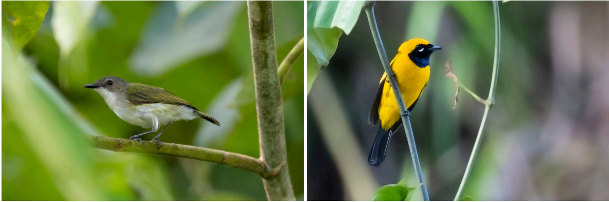
Green-backed Gerygone & Golden Monarch (SR)