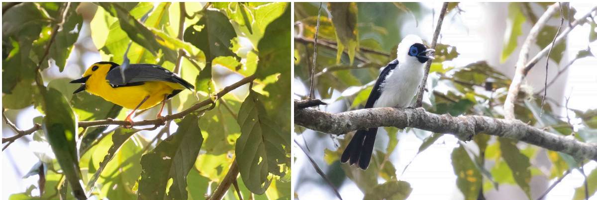
Goldenface & Frilled Monarch (SR)