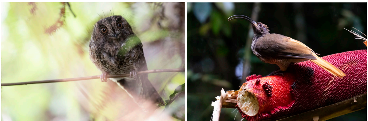
Mountain Owlet-nightjar & Black-billed Sicklebill (SR)

In de namiddag bezoeken we een schuilhut voor Black-billed Sicklebill en hoewel het snel begint te regenen, bezoeken aardig wat vogels het fruit dat hier voor ze is opgehangen. Achtereenvolgens zien we een man Crescent-caped Lophorina, een vrouw Western Parotia en een vrouw Black-billed Sicklebill op het stuk fruit afkomen. De Arfak Catbirds die het fruit bezoeken laten het afweten en het is al laat als we richting het dorp gaan. Hier wacht ons een welverdiende maaltijd, doen we de lijst en gaan slapen. Morgenochtend wacht ons opnieuw een nachtelijke wandeling voor een paradijsvogel.