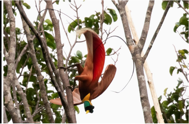
Papuan Frogmouth & Red Bird-of-Paradise (SR)

Bij aankomst in Sorong begeven we ons naar het hotel waar we overmorgen ook zullen slapen. Nu komen we er om te lunchen en onze bagage te herschikken. Omdat we een heel stuk door het oerwoud moeten lopen naar onze volgende accommodatie, laten we het merendeel van de bagage achter in Sorong en nemen we alleen het hoogstnodige in onze rugzakken mee. Omdat het nog twee uur rijden is en vervolgens nog een uur lopen, vertrekken we al snel na de lunch richting Malagufuk. Dit kleine dorpje ligt in het laaglandregenwoud ten noordoosten van Sorong en is sinds een jaar of 9 the place to be voor soorten als Red-breasted Paradise Kingfisher, Black Lory en Large Fig Parrot. Hoewel het de hele middag al droog is en nauwelijks bewolkt is, regent het bij aankomst. Gelukkig wordt het ook weer droog en beginnen we aan de 3 km lange wandeling naar het dorp. Onderweg horen we vooral veel, waaronder de gebruikelijke Yellow-billed Kingfisher, en zien we weinig. Drie Wompoo Fruit Doves laten zich leuk bekijken. Eenmaal in het dorp begint het te regenen en dat blijft het doen tot het donker. Na het avondeten en de lijst gaan we die avond opnieuw vroeg ons bed in.