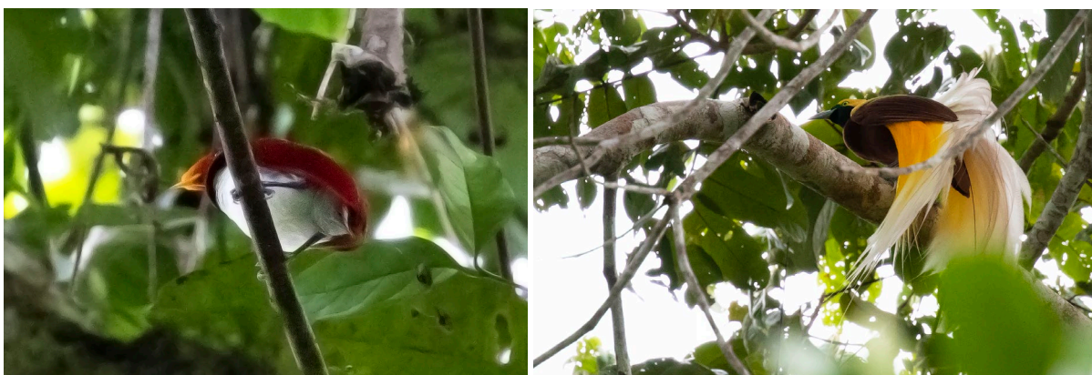
King Bird-of-Paradise & Lesser Bird-of-Paradise (SR)

We rijden door naar Nimbokrang en droppen onze tassen bij de accommodatie voor de komende twee nachten. Een half uurtje later begint het echte werk en gaan we het bos in. In een boom laten Moustached Treeswift, Metallic Starling en Black-browed Triller zich goed zien. Iets verderop verleiden we een White-bellied Thicket Fantail zich te laten zien en dat lukt zowaar, iets wat bij deze fantails niet gegarandeerd is. Vlak voor onze lunchplek laat een Rufous-bellied Kookaburra zich goed zien, maar Yellow-bellied Gerygone, Pygmy Longbill en Ochre-collared Monarch laten zich lastiger/korter zien. Tijdens de lunch vliegt onze eerste Sulphur-crested Cockatoo over. Dan is het tijd voor onze eerste paradijsvogel: King Bird-of-Paradise. Deze rood-met-witte paradijsvogel zit vaak net onder de boomkroon en dat is ook nu het geval. Toch laat hij zich in de telescoop goed zien, mooi! Een half uurtje later staan we naar onze tweede paradijsvogel te kijken: Lesser Bird-of-Paradise. Vijf baltsende mannetjes doen hun uiterste best om enkele vrouwtjes te versieren – wat een feest!