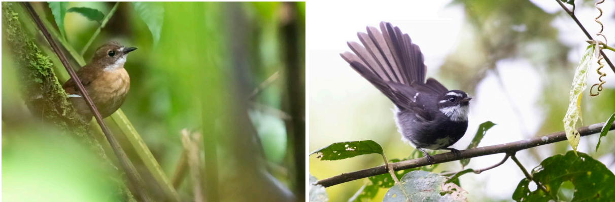
Lesser Ground Robin & Friendly Fantail (SR)

Op Nieuw-Guinea zitten een aantal endemische soorten in deze familie, waarvan dit één van de drie soorten is in dit gebied. Als we ons terug naar het pad begeven miegelt het ineens van de vogels. Ze zitten hoog en bewegen snel, maar het lukt een enkeling Canary Flyrobin, Rufous-naped Bellbird of Arfak Honeyeater bij te schrijven.