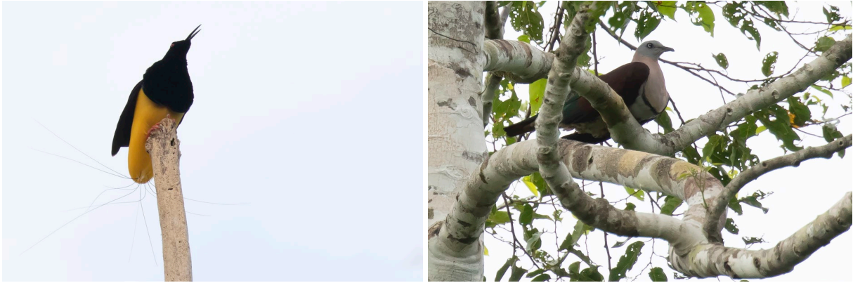
Twelve-wired Bird-of-Paradise & Zoe's Imperial Pigeon (SR)

Na de lunch bij onze accommodatie en een korte siësta, gaan we in de middag weer op pad. Het is echter een stille namiddag en op het moment dat we Emperor Fairywren horen, begint het ook nog te regenen. Het komt met bakken uit de lucht, maar gelukkig kunnen we ergens dichtbij schuilen en voor het donker wordt stopt het gelukkig. Als we teruglopen richting de auto's horen we opnieuw Emperor Fairywren en het lukt de meesten deze prachtige zwart-met-blauwe man in beeld te krijgen. Vlak voor de auto horen we onze eerste Dwarf Koel, maar deze soort is lastig te zien (maar wie weet...). Als de avond valt gaan we opnieuw op zoek naar de beide ijsvogels van vanochtend, maar de Shovel-billed Kingfisher werkt niet mee. Als het bijna donker is beginnen er echter wel twee Hook-billed Kingfishers te roepen. Met de hulp van de nachtkijker is één van de twee ijsvogels snel gevonden en deze laat zich in de scoop redelijk bekijken – mooi! We hebben inmiddels aardig honger gekregen en gaan terug naar de accommodatie voor een welverdiend diner, biertje en de lijst. Slapen!