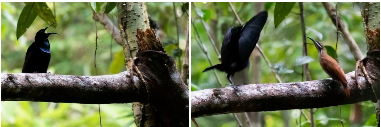
Magnificent Riflebird, man zingend en baltsend tegenover vrouw (SR)

Het is opnieuw erg vroeg (4 uur...), maar we hebben een duidelijk doel: Magnificent Riflebird. Voor deze schuwe paradijsvogel moeten we in het donker vertrekken om op tijd bij de schuilhut te zijn. Onderweg probeert Sjoerd volop Papuan Hawk-Owl in te tappen, maar die geeft niet thuis. Door bij die stops ook de nachtkijker te gebruiken vinden we willekeurig een Collared Brushturkey. Hoewel groot laten deze 'boskippen' zich overdag zelden bekijken en dit is dus een unieke waarneming! Als we even later in de buurt van de schuilhut voor de paradijsvogel komen, laat deze zijn luide zang al horen. Eenmaal in de hut is het mannetje al aanwezig en wachten we rustig tot een vrouwtje komt, want pas dan baltsen paradijsvogels. En we hebben geluk want even later is het zover: een vrouwtje laat zich kort zien en het mannetje gaat los! Vleugels gespreid, achteruitlopend en met 'wiebelende' kop probeert hij het vrouwtje te verleiden. Dat lukt niet echt en het vrouwtje is net zo snel vertrokken als ze verscheen. Jammer, maar wat was het fantastisch!