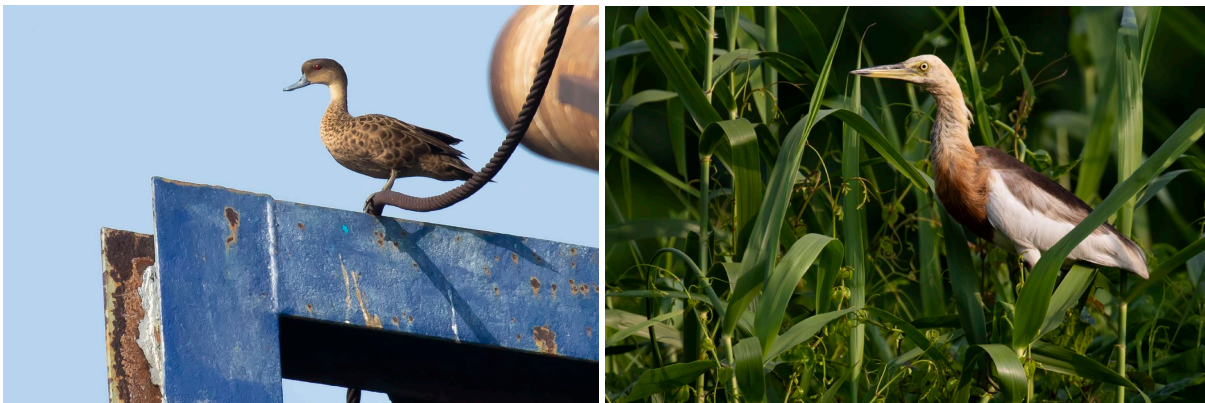
Sunda Teal & Javan Pond Heron (SR)

Eenmaal aangekomen bij de mangrove zien we vooral heel veel reigers: Great Egret (Grote Zilverreiger), Little Egret (Kleine Zilverreiger) en zeker 100 Javan Pond Heron. Ook zien we hier de eerste Long-tailed Macaques. Rustig langs het riet varend zien we achtereenvolgens nieuwe soorten als Scaly-breasted Munia, White-breasted Waterhen, Pink-necked Green Pigeon, Small Minivet, Yellow-vented Bulbul, Plain Prinia en – de target hier – Sunda Coucal! Deze soort is zeker niet gegarandeerd op dit tijdstip van de dag, dus we boffen. Helaas ziet niet iedereen de vogel, maar wie weet zien we er nog eentje... Het is inmiddels tegen vijven en het wordt tijd terug te varen, want we willen ook nog graag een tweede poging wagen voor Cerulean Kingfisher. Onderweg komen we een mooi groepje Javan Myna tegen, opnieuw een soort met een beperkte verspreiding. Ook Cerulean Kingfisher lukt en prompt vliegt er ook nog een Sunda Coucal langs. Iedereen ziet de vogel langs vliegen en zelfs even zitten, mooi! We sluiten de excursie af met een zestal Milky Storks die zich verzamelen om te gaan slapen. Dan is het echt tijd om af te meren en naar het vliegveld te gaan. Om 21:05 vliegen we dan naar Istanboel.