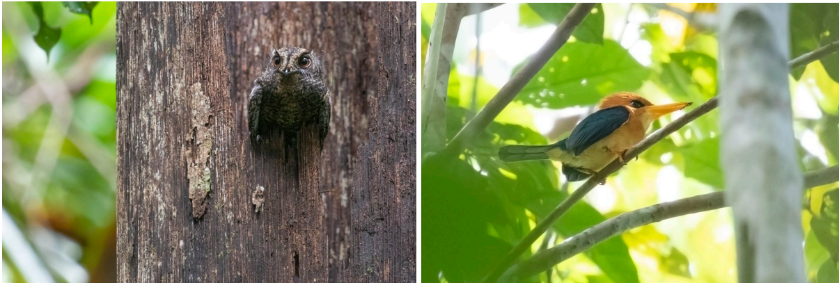
Wallace's Owlet-nightjar & Yellow-billed Kingfisher (SR)

wandelen terug naar de hoofdweg. Daar worden we opgewacht door onze chauffeurs en rijden we terug naar Sorong. Terug in het hotel worden we herenigd met onze tassen, genieten van een heerlijk diner en gaan slapen. Morgenochtend vliegen we terug naar Amsterdam.