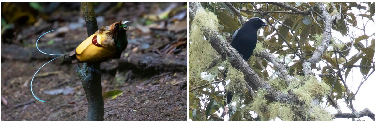
Magnificent Bird-of-Paradise & Black-bellied Cuckooshrike (SR)

Terug bij de weg besluiten we de laatste paar uur voor de lunch opnieuw beneden door te brengen. Dat levert opnieuw Mountain Peltops op, maar ook een paartje Black-bellied Cuckooshrike dat zich goed laat zien. Jeanette vindt doodleuk alsnog een mannetje Masked Bowerbird door de bomen heen en even later laat deze zich (door wat takken heen) goed bekijken in de telescoop. Iets verderop zien we in een fruitboom dezelfde set aan soorten als eerder: Mountain Myzomela, Red Myzomela en Fairy Lorikeet. Nieuw is Spectacled Longbill in deze boom, en een Mountain Honeyeater laat zich eveneens goed zien. Pacific Koels laten zich goed horen en kort zien; een Long-tailed Honey Buzzard vliegt laag over. Het is inmiddels bijna 1 uur en we besluiten te gaan lunchen. Na de lunch is het tijd om te vertrekken richting Manokwari. Daar checken we eind van de middag in en heeft iedereen nog even tijd om bij te komen van de dagen in de Arfak Mountains en zich voor te bereiden op het laatste deel van de reis: Malagufuk en Waigeo.