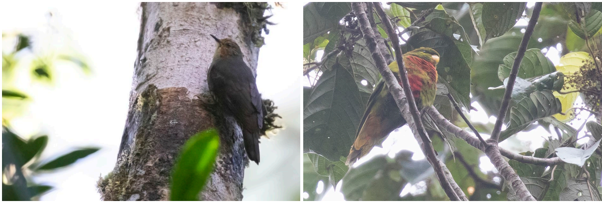
Papuan Treecreeper & Yellow-billed Lorikeet (SR)