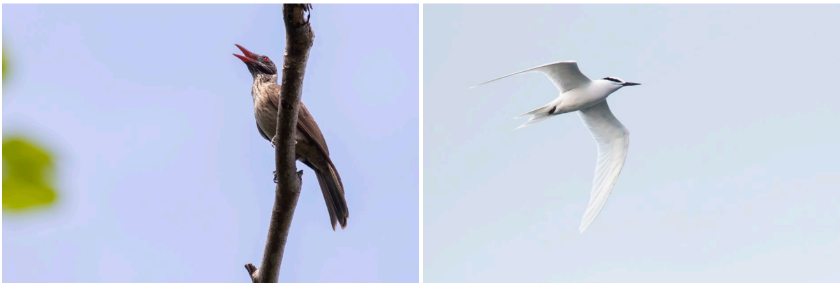
Brown Oriole & Black-naped Tern (SR)

In de namiddag wagen we een poging voor Great-billed Parrot, Violet-necked Lory en Spice Imperial Pigeon. We varen met een speedboot de Kubai Bay op, een soort binnenzee. Eenmaal aangekomen op de plek is het wachten tot de eerste vogels arriveren, maar naarmate de tijd verstrekt wordt het duidelijk dat de vogels een andere slaapplek hebben gekozen. We zien nog wel meerdere Spice Imperial Pigeons en hebben een mooie sessie met Black-naped Terns, maar het wordt snel donker en we varen in het donker terug naar ons resort. Het is jammer, maar we laten ons het bier en avondeten er niet minder om smaken. Omdat we morgenochtend heel vroeg nog een poging wagen voor Red Bird-of-Paradise, duiken we snel ons bed in na de lijst gedaan te hebben.