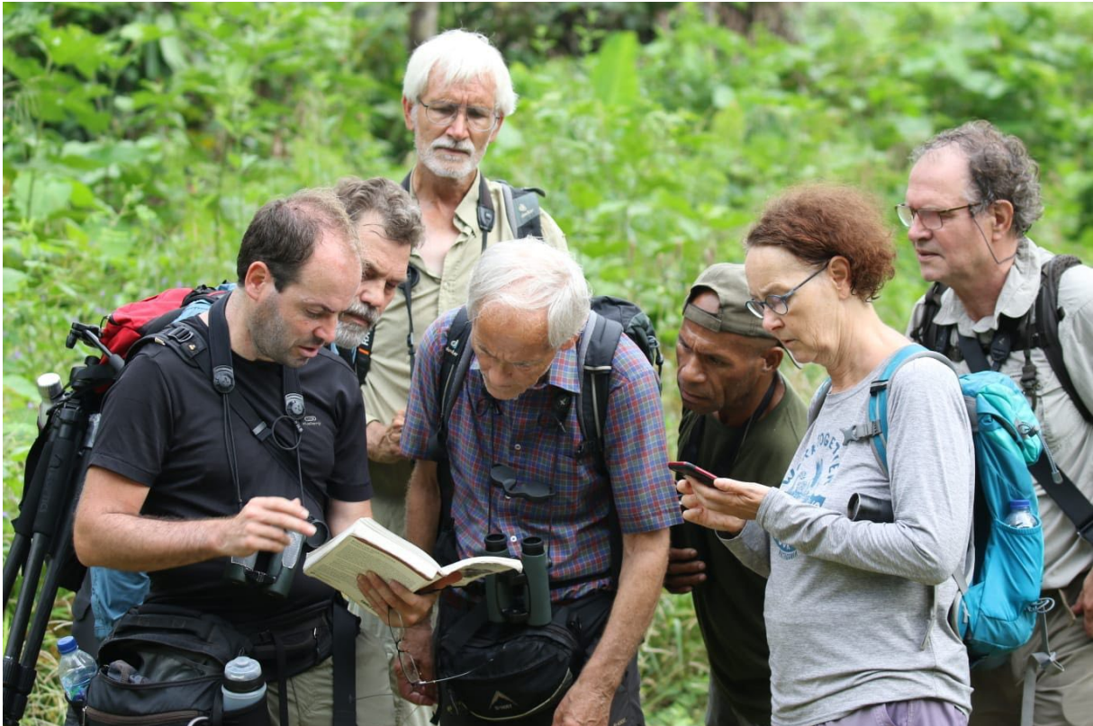
Vogels kijken op West-Papoea (MC)