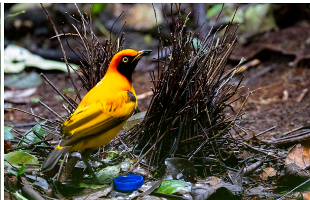
Masked Bowerbird (SR)

Eenmaal terug bij de weg blijkt dat de andere twee deelnemers onwijs hebben genoten van een show van Magnificent Bird-of-Paradise, iedereen blij! Fingers crossed dat beide vogels zich morgen ook weer laten zien, want dan zijn de rollen omgedraaid. Omdat lager ook weer andere soorten zitten, besluiten we naar beneden te rijden en daar tot aan de lunch te vogelen. Het begint rustig, maar even later zitten we midden in een flock met veel nieuwe soorten. Het begint met een mooie waarneming van een paartje Mountain Peltops, al snel gevolgd door Goldenface, Black-winged Monarch en Black-shouldered Cicadecbird. Een paartje Frilled Monarch laat zich in de telescoop goed zien. Vogelkop Whistler en Fairy Gerygone ziet alleen Sjoerd; vogelen blijft lastig op Nieuw-Guinea. Het is inmiddels lunchtijd, dus we besluiten terug te gaan naar het dorpje waar we verblijven. Lokale jongens vinden opnieuw een Feline Owlet-nightjar die door sommigen wordt bezocht. In de middag is het mistig en motregent het. In de namiddag wagen we nog een poging in de eerdere schuilhut voor Arfak Catbird, maar het regent hard en weinig vogels laten zich zien. Een paartje Crescent-caped Lophorina is het hoogtepunt die namiddag. We wachten tot na zessen (catbirds zijn laat), maar gaan dan terug om te eten, te lijsten en te slapen.