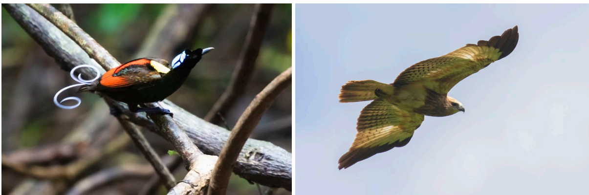
Wilson's Bird-of-Paradise (SR) & Pygmy Eagle (SR)