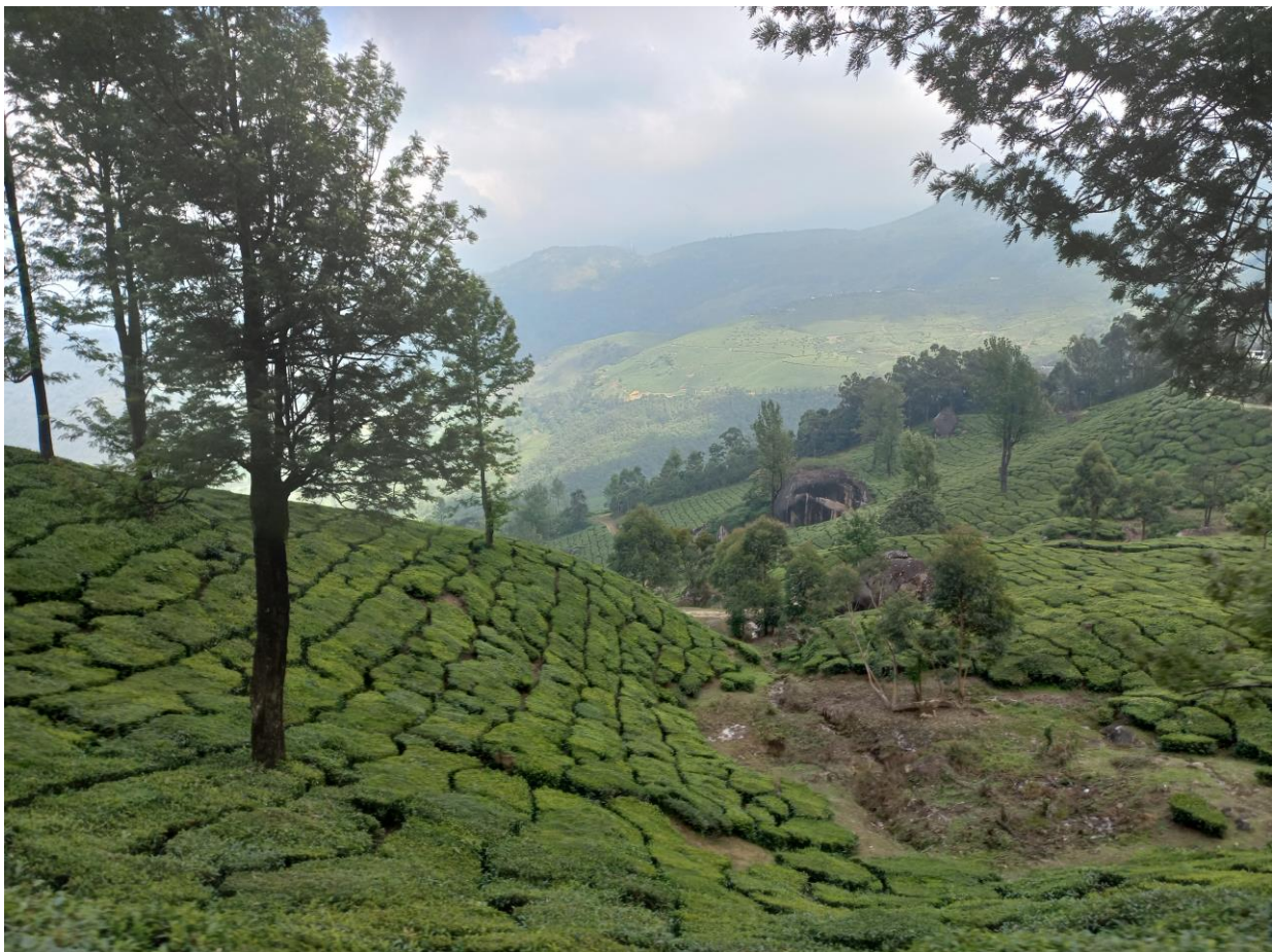
Figuur 19. Theeplantages in Kerala, op weg naar Munnar.