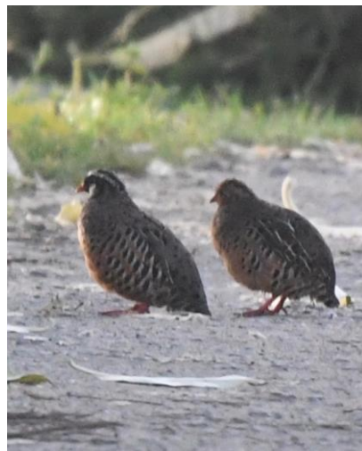
Figuur 15. Driemaal scheepsrecht! Een paartje Painted Bush Quails (Cees Koemans)