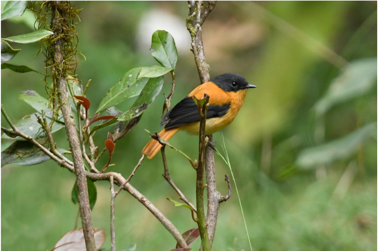
Figuur 12. Wat een soort! Mannetje Black-and-orange Flycatcher, uniek voor Zuid-India.