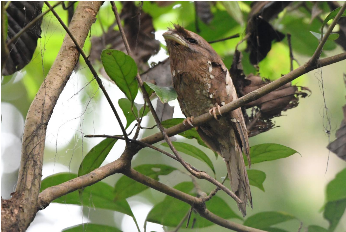
Figuur 25. Vrouwtje Sri Lanka Frogmouth, een publiekslieveling!

de schemer horen we het prachtige “jaWIEEER” van de Great Eared Nightjar, een nachtzwaluw bijna zo groot als een Grauwe Kiekendief. Een Jerdon's Nightjar laat zich mooi bekijken.