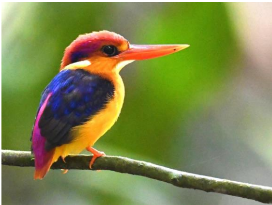
Figuur 29. Black-backed Dwarf-Kingfisher