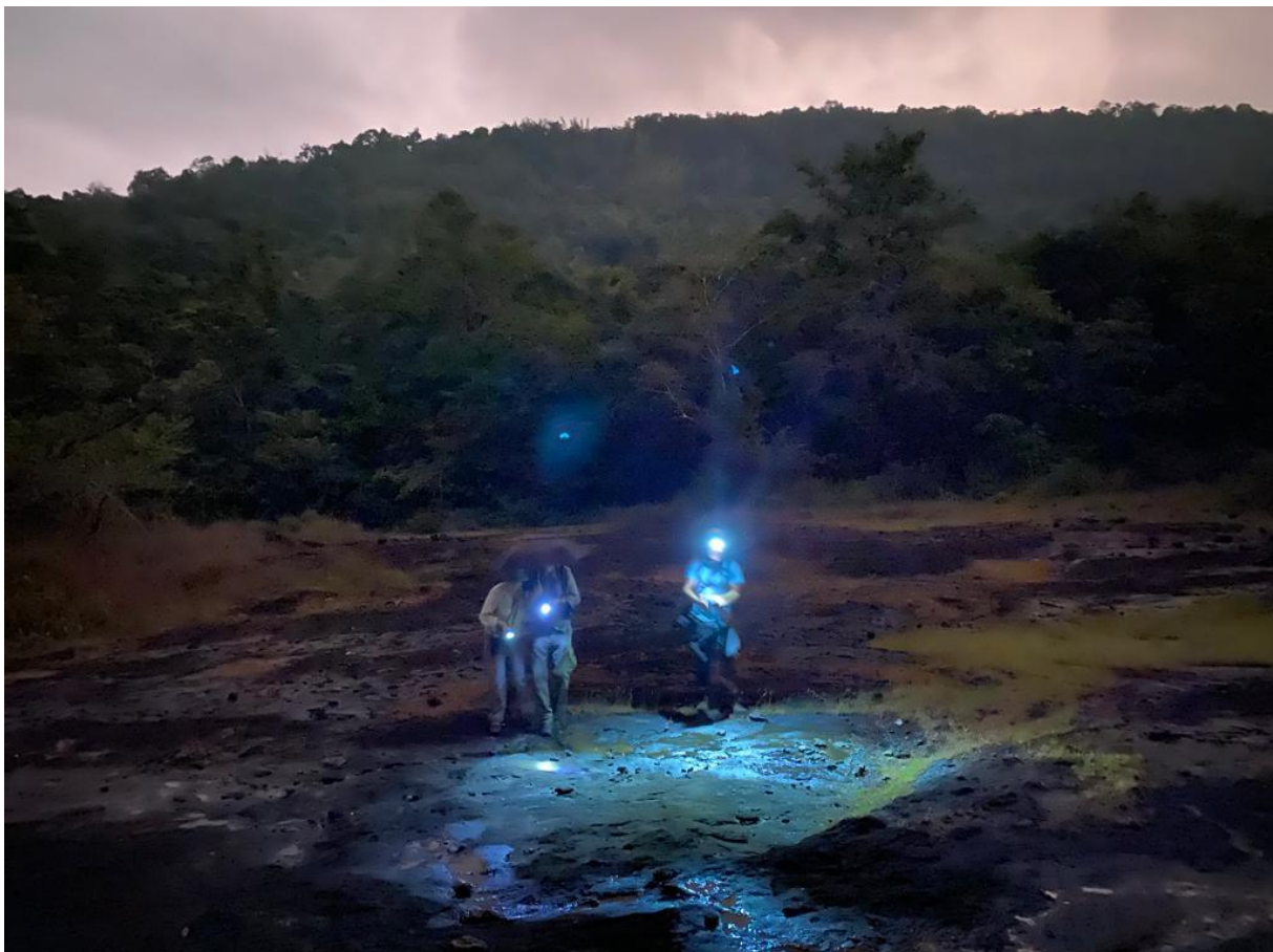
Figuur 28. Het begint te regenen tijdens een avondsessie voor nachtvogels (Jaap Gijsbertsen).