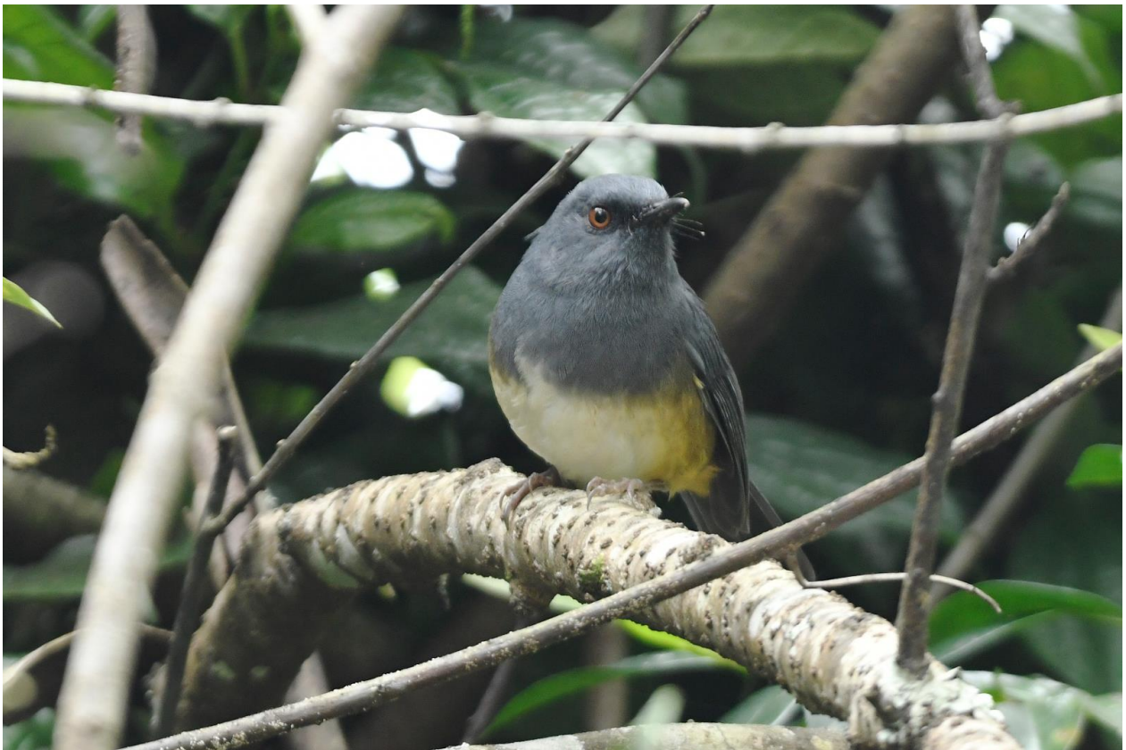
Figuur 13. Nilgiri Sholakili, Ooty. Sholakili is een endemisch vogelgeslacht in het zuiden van India. Er zijn twee soorten, die we allebei zagen.