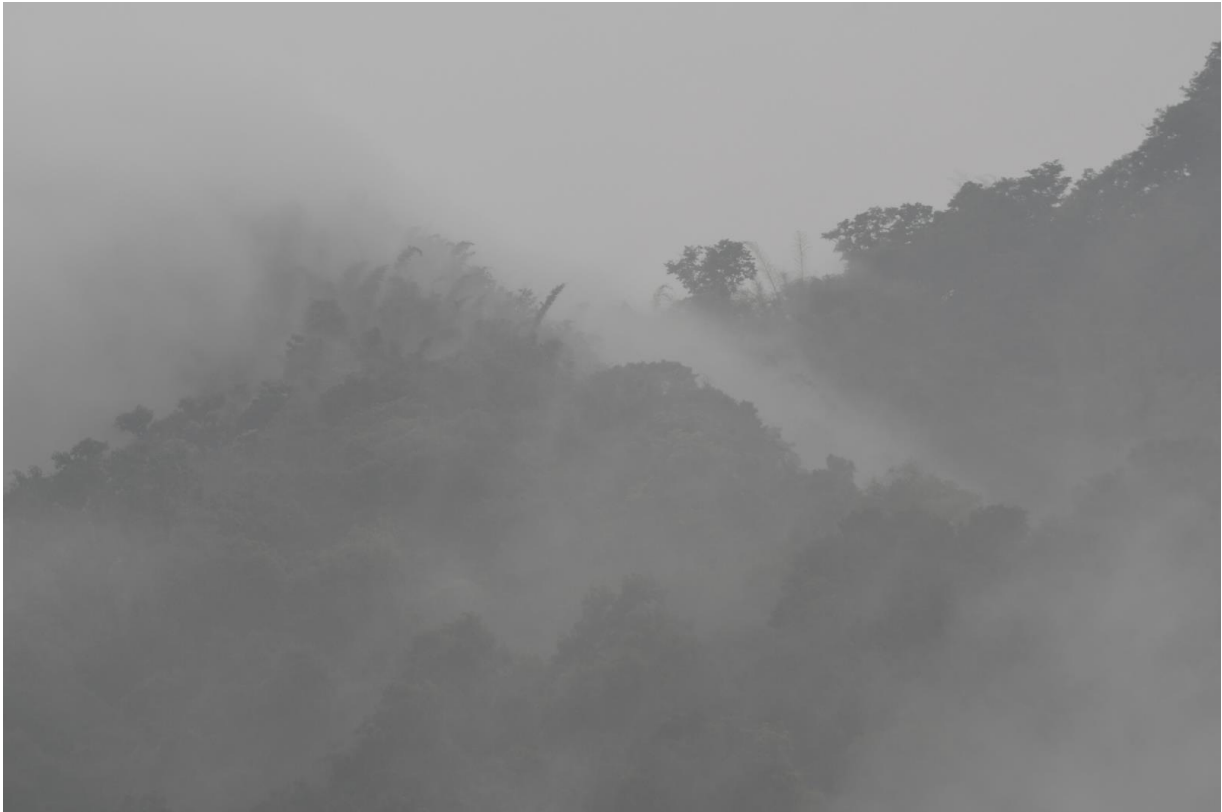
Figuur 26. Heilige ochtend in Thattekad. Zodra de zon tevoorschijn kwam, begon de actie.

uiteindelijk zien we niet één maar liefst drie Malabar Trogons. Wat een schitterende dieren! Wat een schitterende ochtend!