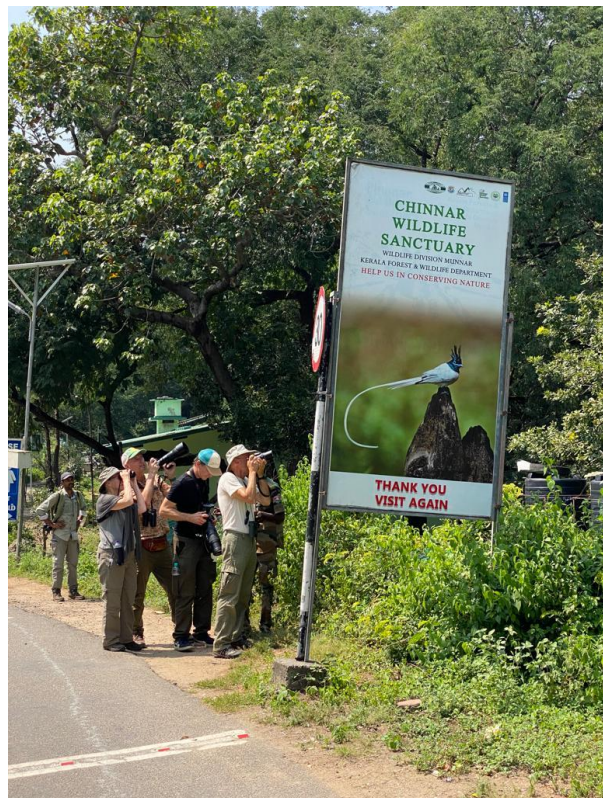
Figuur 18. Vogelen in Chinnar Wildlife Sanctuary (Jaap Gijsbertsen)

De reis, die ons door eindeloze theeplantages voert, duurt ook langer dan gedacht. Uiteindelijk komen we aan in Olive Brook, nabij Munnar waar we pas om 16.30 lunchen. Iedereen is moe en hongerig, maar we kijken buiten nog wat vogels in de vogelrijke tuin. We blijven hier drie nachten. De belangrijkste soorten die we hier moeten zien zijn Rufous Babbler, Palani Laughingthrush en White-bellied Sholakili, die laatste twee de tegenhangers van hun Nilgiri-verwanten. Vanwege het iets beter beschermde habitat zijn ze gelukkig wat minder bedreigd dan hun neven.