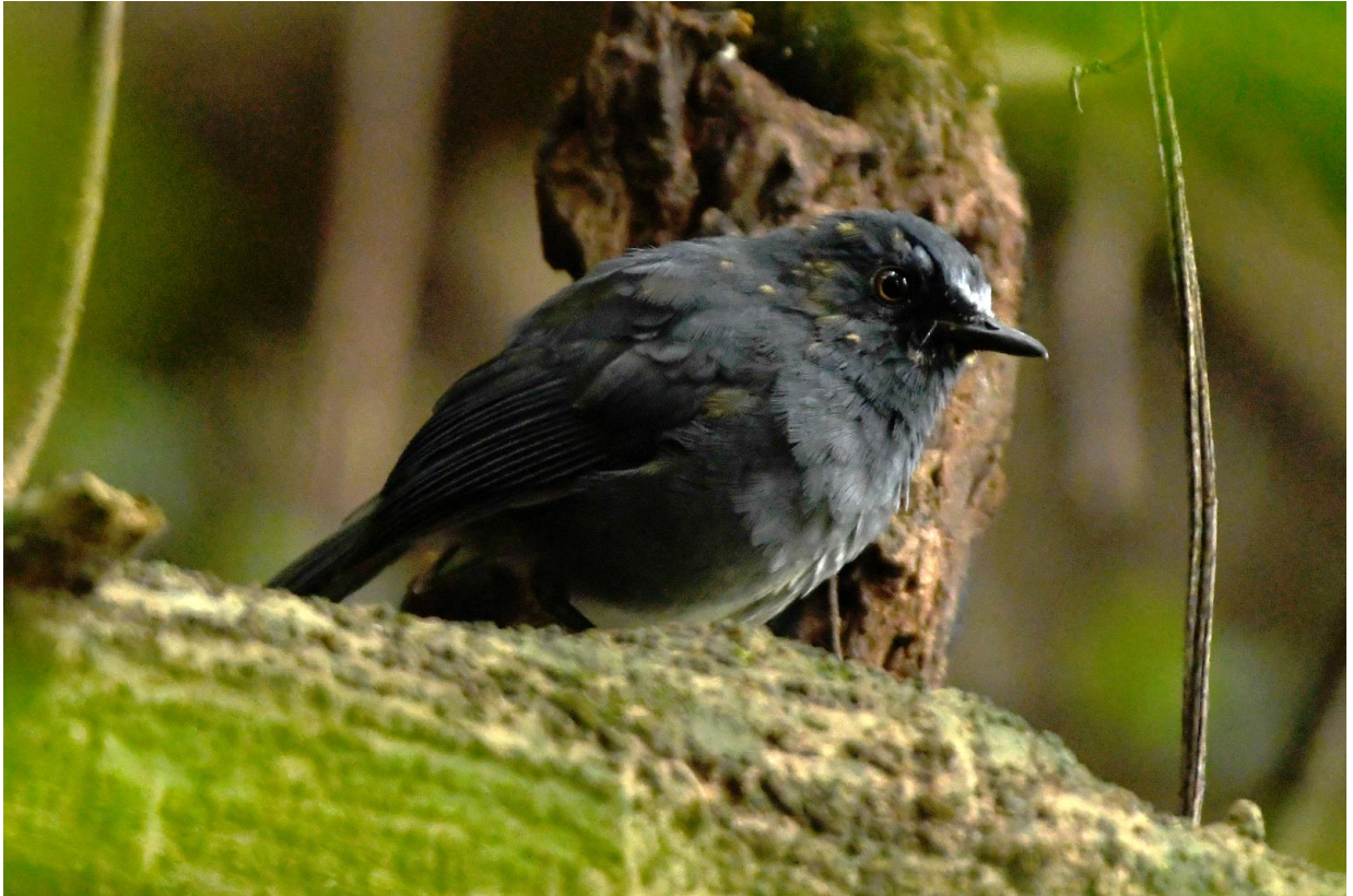
Figuur 22. White-bellied Sholakili.