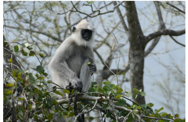
Crimson-backed Sunbird, Grey Junglefowl, Dhole, Indian Giant Squirrel, Grizzled Giant Squirrel, Malabar Sacred Langur.