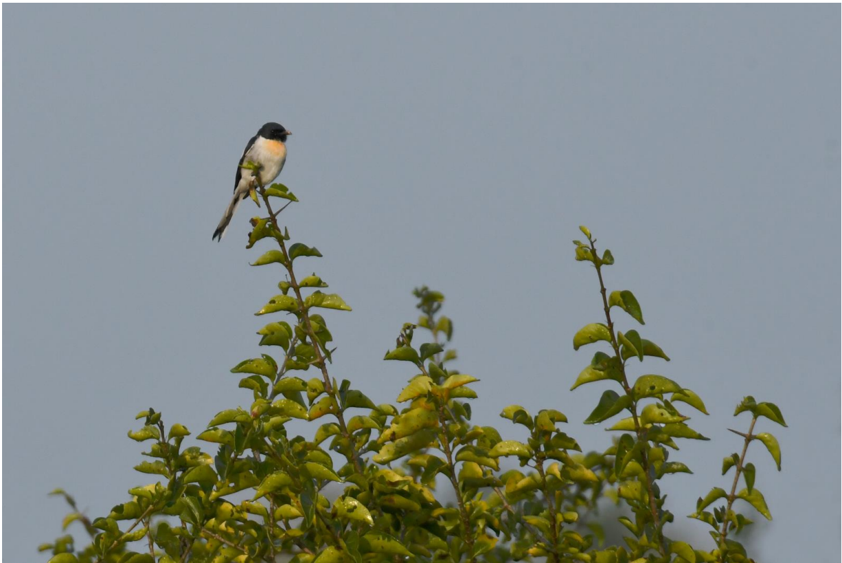
Figuur 7. Mannetje White-bellied Minivet, een echte 'prijssoort'.

tegenprestatie voor de weddenschap rap dichterbij, want liefst drie minivets hebben er zin in, vooral een adult en een jong mannetje laten zich prima zien.