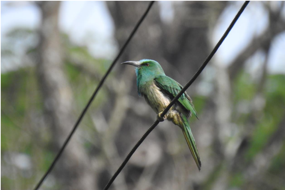
Figuur 4. Blue-bearded Bee-eater (Jan van de Leur).

Onze ontbijtpakketten verorberen we in een bushalte langs de doorgaande weg (stoelen en schaduw) tussen het opgestapelde vuilnis en naast het drukke verkeer. Na een uur of drie rijden (met de beste koffiestop van de reis, in the middle of nowhere langs de weg troffen we een volleerde barista ) komen we aan in Mudumalai, waar Jaap twee spectaculair grote Blue-bearded Bee-eaters, de enige van de reis, op een draad ziet zitten. We zouden deze vakantie alle vier de mogelijke bijenetersoorten zien.