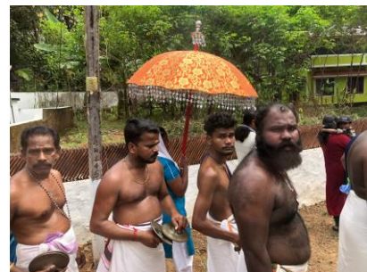
Figuur 24. Processie in Thattekad