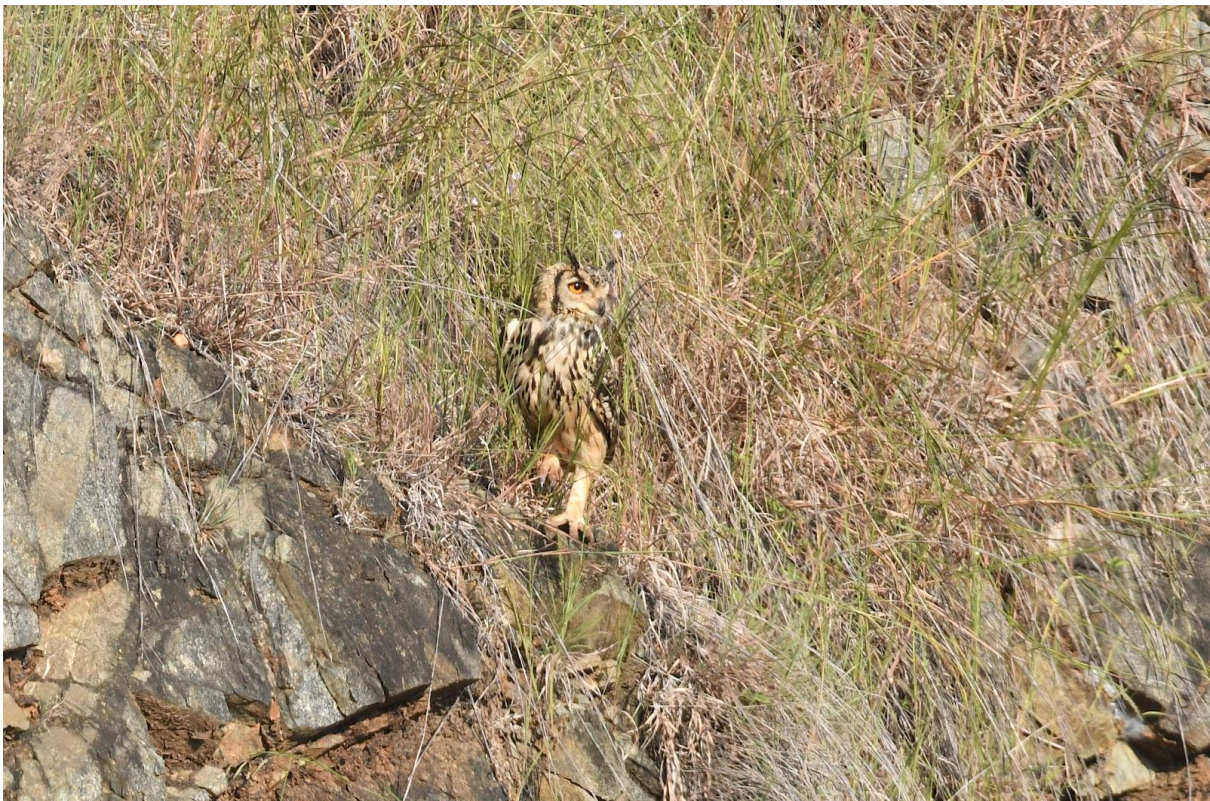
Figuur 3. Indian Eagle Owl, een cadeautje tijdens de eerste vogeldag. Nauw verwant aan 'onze' Oehoe, maar kleiner (hoewel nog altijd flink aan de maat), sterker getekend en met een andere roep.

De eerste stop is in een cultuurlandschap nabij Mysuru. Dat levert heel wat unieke soorten voor de reis op, zoals prachtige Red Avadavats, Tricoloured Munias, Jungle Prinia, een heuse Boompieper en ook nog onze tweede en meteen laatste Blue-faced Malkoha. Het hoogtepunt is de Indian Eagle Owl die zich geweldig laat zien langs een hoge, steile oever van een met beton gekanaliseerd stroompje. De ontwikkeling rukt hier zichtbaar op en de vraag is hoe lang dit gebiedje nog productief blijft.