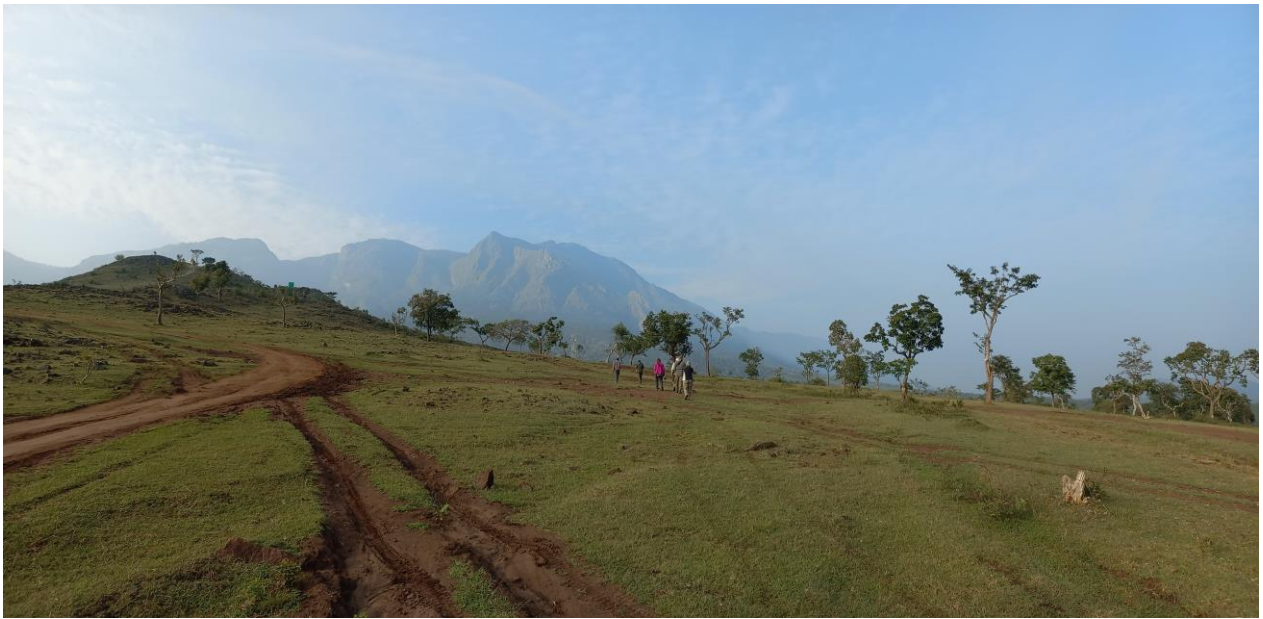
Figuur 5. Wandelen in de bufferzone rond Mudumulai National Park.

zien zowel Jungle als Savanna Nightjar in het licht van onze zaklampen – ondanks dat hij met de speaker aan onophoudelijk gebeld wordt.