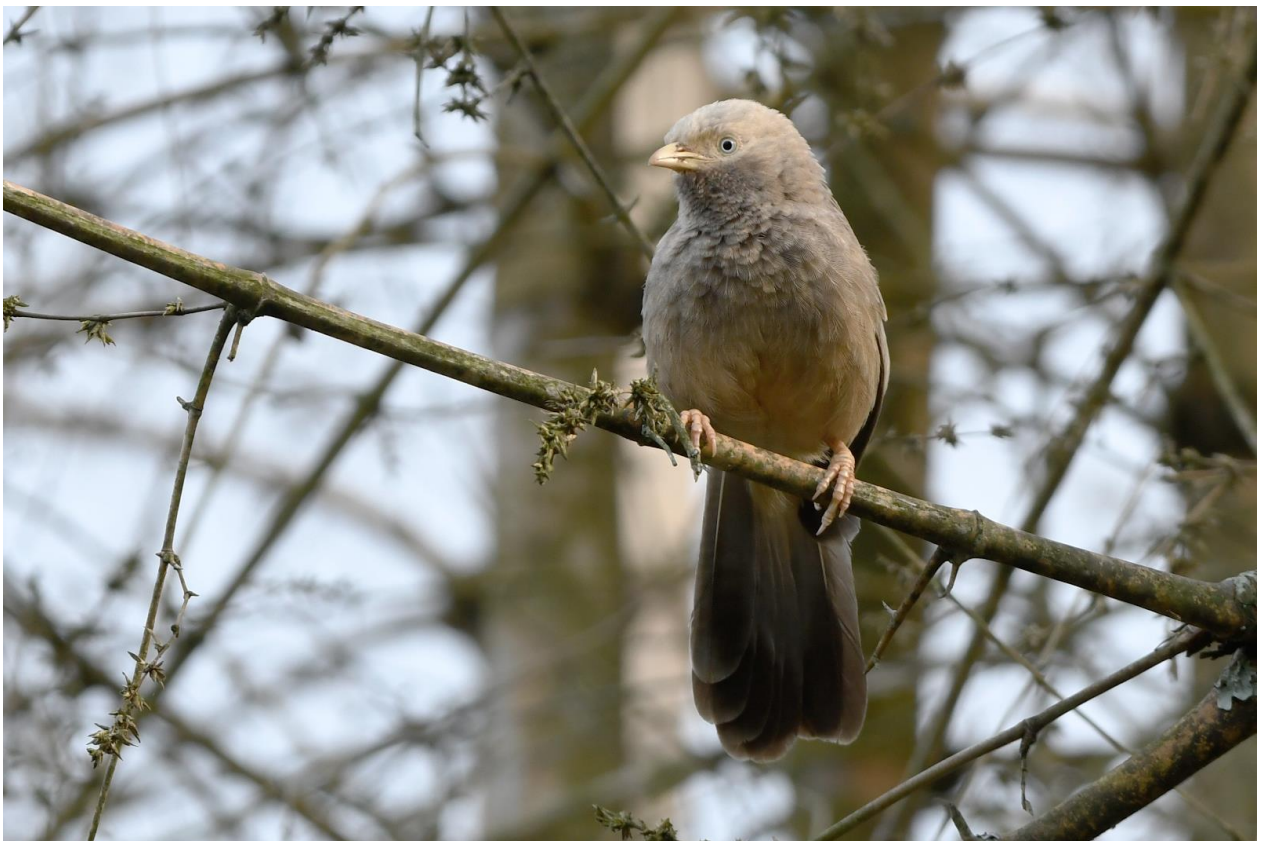
Figuur 6. Babblers, zoals deze Yellow-billed, trekken in luidruchtige groepen door de vegetatie.