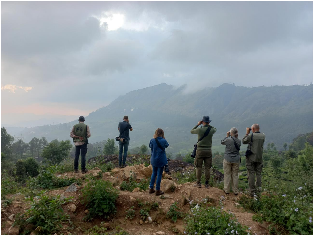
Figuur 23. Vogelen rond Munnar.