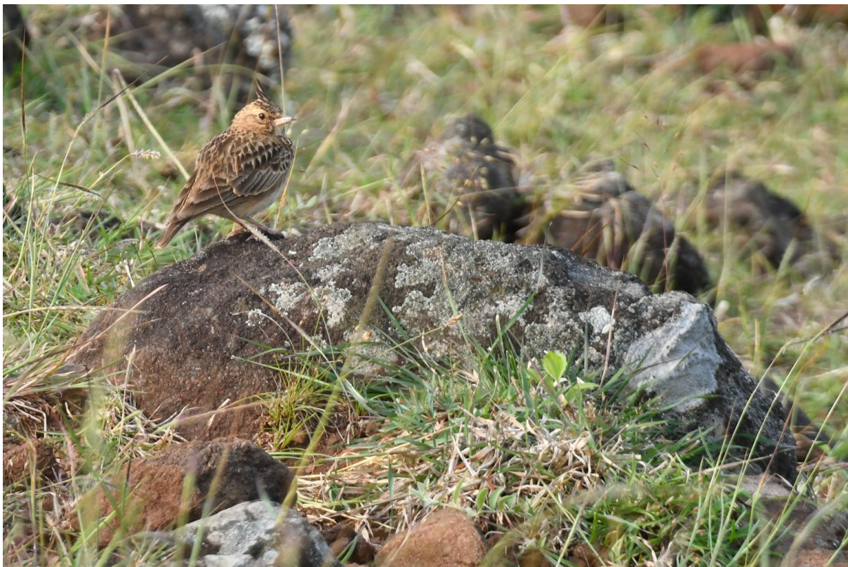
Figuur 8. De endemische Malabar Lark in Mudumalai NP.