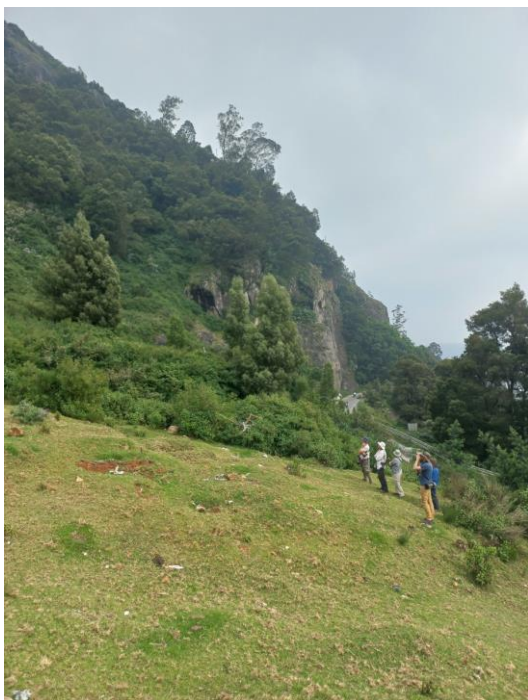
Figuur 9. Zoeken naar Nilgiri Pipit in Ooty.

Het is alweer tijd om Mudumalai en de heerlijke Jungle Hut te verlaten. Na een laatste wandeling door de tuin gaan we via een prachtige rit de bergen in. De bestemming is Ooty, dat eigenlijk Udthagamandalam heet, maar de afkorting is zo ingeburgerd dat zelfs GoogleMaps daar de voorkeur aan geeft.