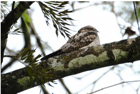
Figuur 20. Jungle Nightjar