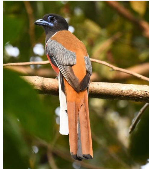
Figuur 27. Mannetje Malabar Trogon (Jaap Gijsbertsen).

In Zuid-India kan het altijd regenen. Vandaag is de enige dag dat we wat pech hebben met het weer. In de vroege ochtend regent het en daardoor vertrekken we pas laat. We zien allerlei mooie soorten, met zelfs nog een trogon. Het lukt om een aantal soorten mooier te fotograferen, maar een nieuwe vakantiesoort blijft uit. En dat is gezien het geweldige gebied waarin we verblijven een verrassing. Het contrast met gisteren is daarmee groot. In de avond, bij een geplande sessie voor uilen, nachtzaluwen en de intrigerende primate Slender Loris, gebeurt hetzelfde. Net als het begint te schemeren en we aan het duelleren zijn met een Jungle Owlet en een Brown Boobook (toch nog een nieuwe soort), gaat het weer regenen. Twee keer dus neerslag op hét cruciale moment van de dag. Maar daar zou het deze reis wel bij blijven: het weer was verder uitstekend.