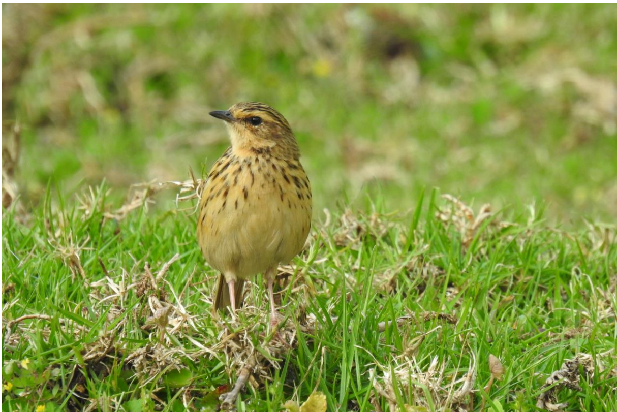
Figuur 10. De begdreigde endem Nilgiri Pipit, die maar een klein verspreidingsgebied heeft, liet zich geweldig zien in Ooty (Jan van de Leur).