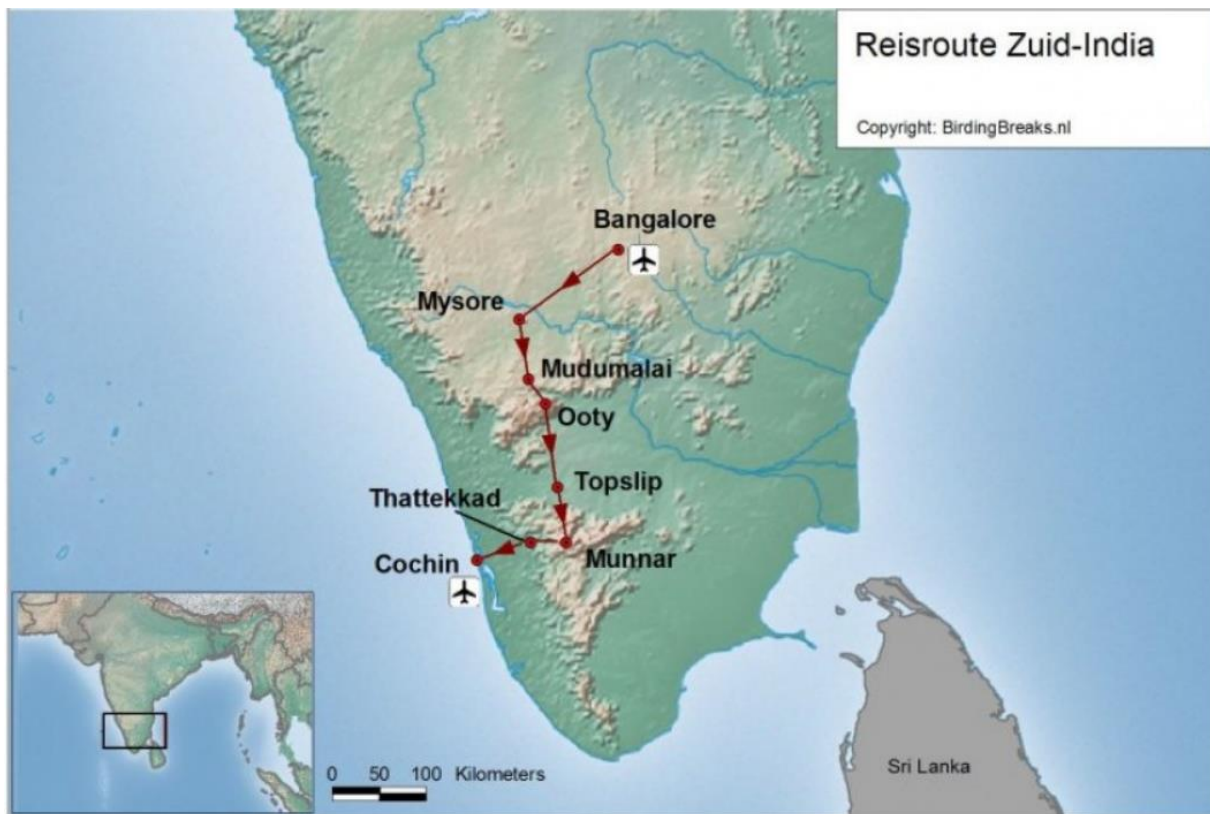
Figuur 1. Afgelegde route tijdens de vogelreis naar Zuid-India in 2022.