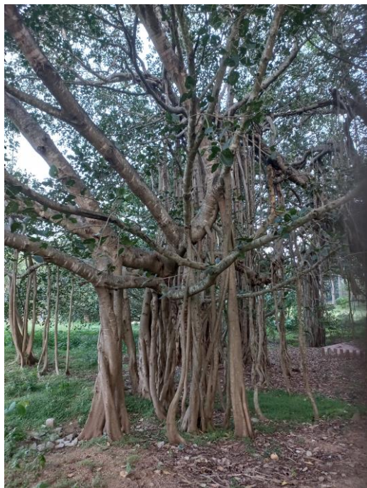
Figuur 16. De Banyan Tree bij de ingang van het hotel.

Ons hotel is vernoemd naar een Banyan Tree bij de ingang. Dat is de boomsoort waaronder Budha volgens de overlevering zijn verlichting bereikte. Niet alleen cultureel, maar ook ecologisch is het een bijzondere boom: uit de takken groeien wortels die aarden in de grond en daar weer dikker worden, stammen op zichzelf. Die zorgen niet alleen voor ondersteuning van die dikke takken, maar ook voor verjonging. De boom verjongt zichzelf daarmee. Bij het uitstappen van de bus zien we de enige Stork-billed Kingfisher van de reis (een tweede zouden we alleen horen). Bij ons onderkomen voor de nacht staat alweer een heerlijk buffet op ons te wachten. Na een paar uur rijden en ook morgen een halve reisdag voor de boeg, besluiten we te vogelen op de plantage in plaats van in het nabijgelegen nationale park Topslip, wat nog drie kwartier rijden is. De eerste Grey-fronted Green Pigeons van de reis laten zich niet mooi zien. In een flockje zit een Taigavliegenvanger. Abilash wordt zenuwachtig als hij mij dat heel relaxt hoort zeggen. Dit blijkt net als Humes Bladkoning een soort die te ver is doorgesloten en daarmee voor hem alweer een nieuwe soort! Uiteindelijk lukt het om wat matige bewijsplaatjes en geluidsopnamen te maken die we op eBird kunnen zetten als bewijs.