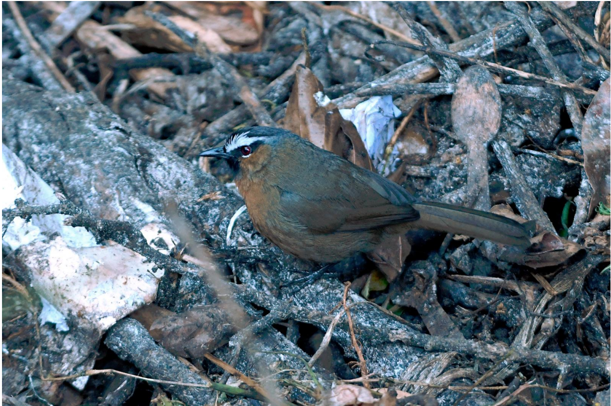
Figuur 11. Nilgiri Laughingthrush in Ooty. Zie de wegwerplepel en het papiertje op de achtergrond: een sterk bedreigde vogel die leeft tussen het afval...

onder een eindeloos geel zeil), entree bij de top en daar staan kraampjes die het uitzicht – waar het om te doen is – per saldo belemmeren. In de bermen achter de stalletjes ligt het afval opgestapeld. En daar zitten de loeizeldzame Nilgiri Laughingthrushes. Een herdefiniëring van de term trash bird lijkt nodig!