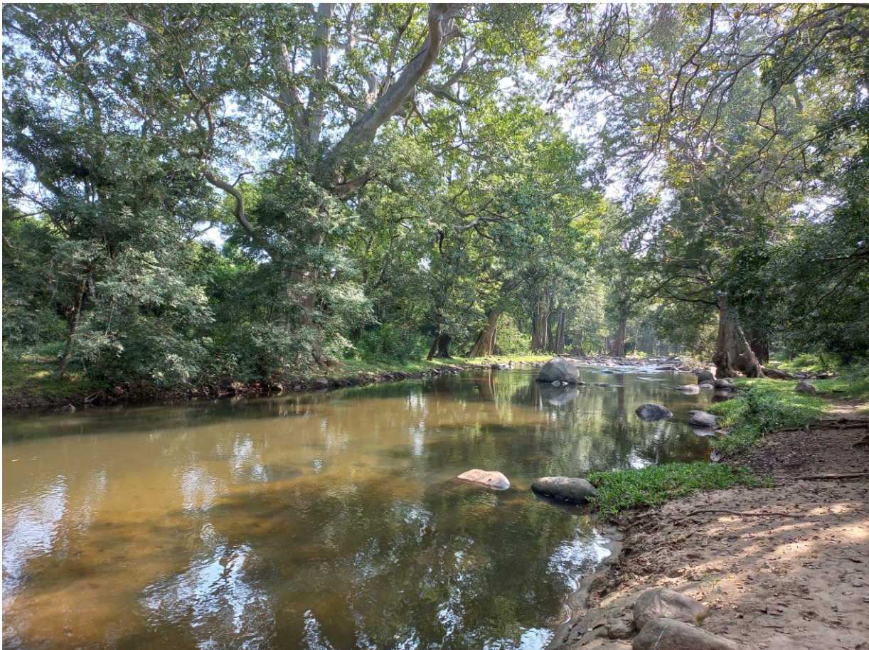
Figuur 17. De rivier in Chinnar.

Tijdens de reis naar de bergen van Munnar staat een fijne tussenstop op het programma. Chinnar, onderdeel van tigerspark Anamalai, ligt net over de grens in de provincie Kerala. Langs de weg in Anamalai staat een vrouwtjesolifant met jong. Ongeloof en teleurstelling als we de mededeling krijgen dat we niet mogen stoppen. Het is de chauffeur nog expliciet meegedeeld door rangers toen we het park binnenreden. Een nationaal park met beesten waar je niet mag stoppen voor de beesten... als de dood voor een incident blijktbaar.