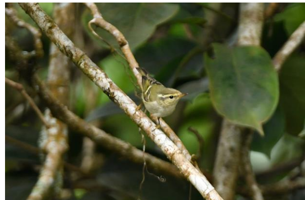
Figuur 21. Bladkoning, een heuse zeldzaamheid hier.