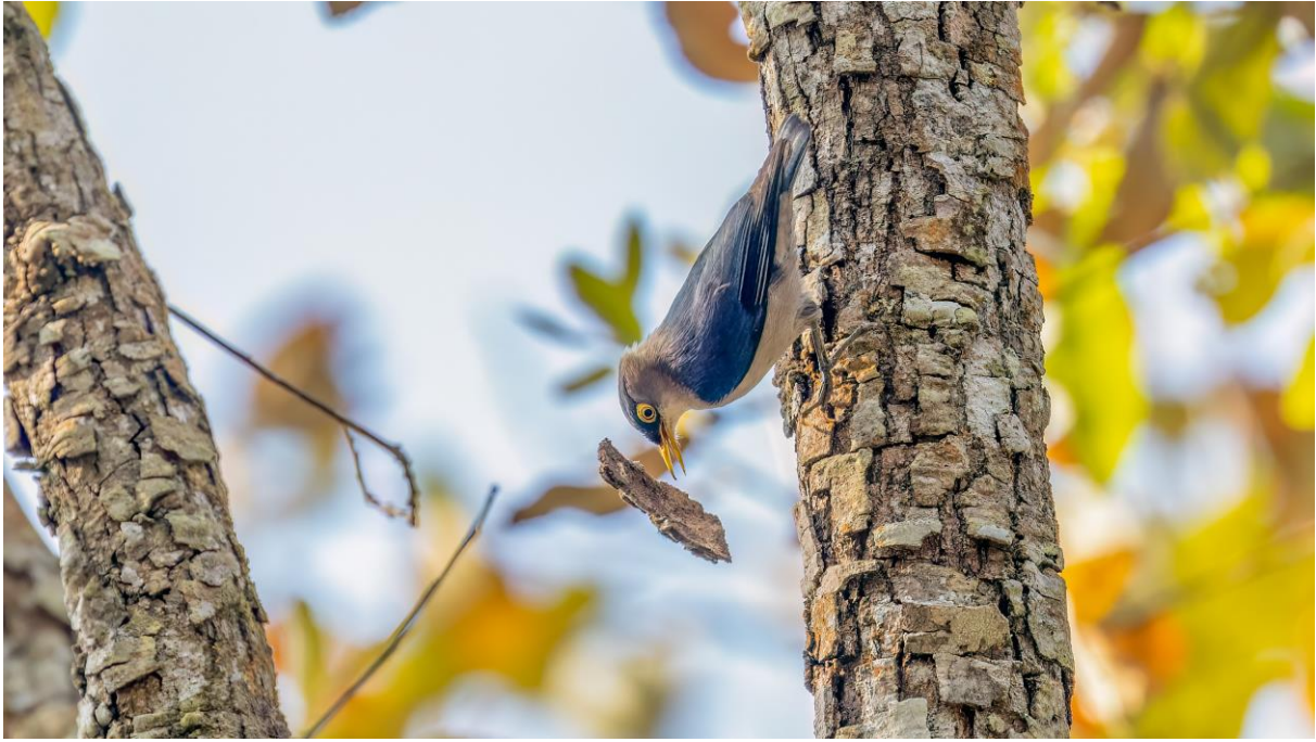
Yellow-billed Nuthatch (Toy Janssen)