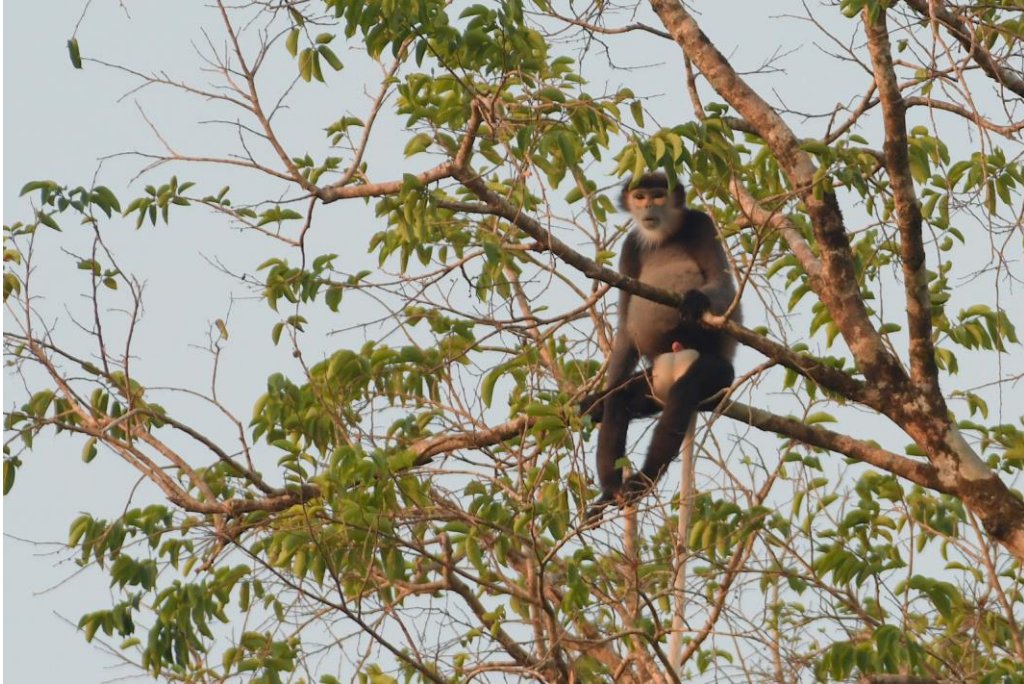
Mannetje Black-shanked Douc (boven) en mannetje Yellow-cheeked Gibbon (onder)