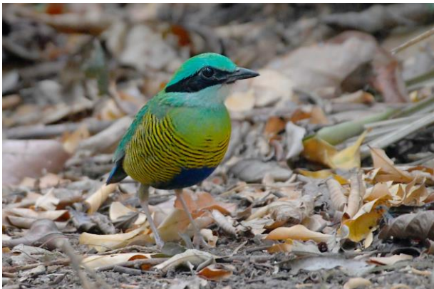
Figuur 13. Mannetje Bar-bellied Pitta