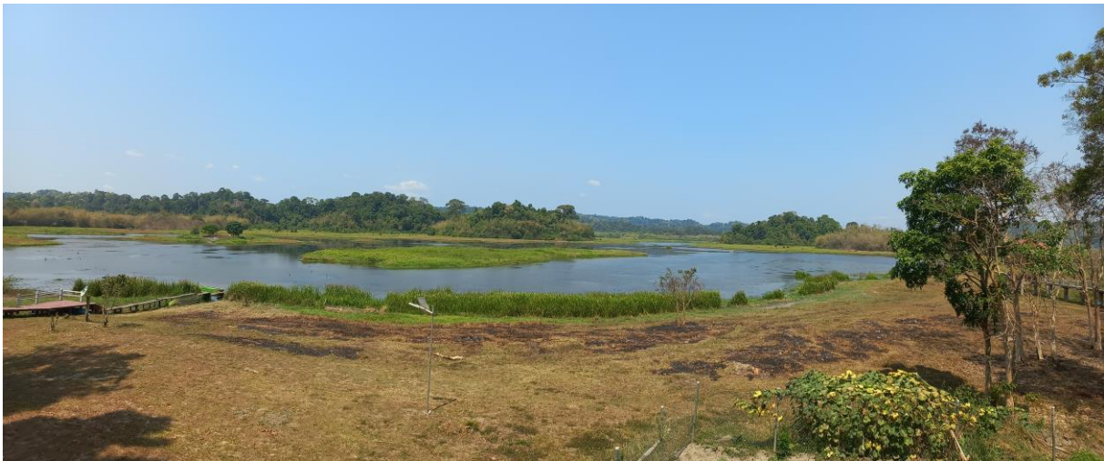
Figuur 7. Crocodile Lake, Cát Tiên.

kleur, een vrouwtje Violet Cuckoo zit boven ons hoofd, en we horen Banded Kingfisher en Banded Broadbill, maar verder is rustig in het snel opwarmende landschap. De lokale ondersoort van de Black Giant Squirrel – een onvoorstelbaar grote eekhoorn – is hier helemaal niet zo black , hij is eerder blond. Dan bereiken we ons doel: Crocodile Lake, een schitterend meer, een open gebied in een verder dicht bos.