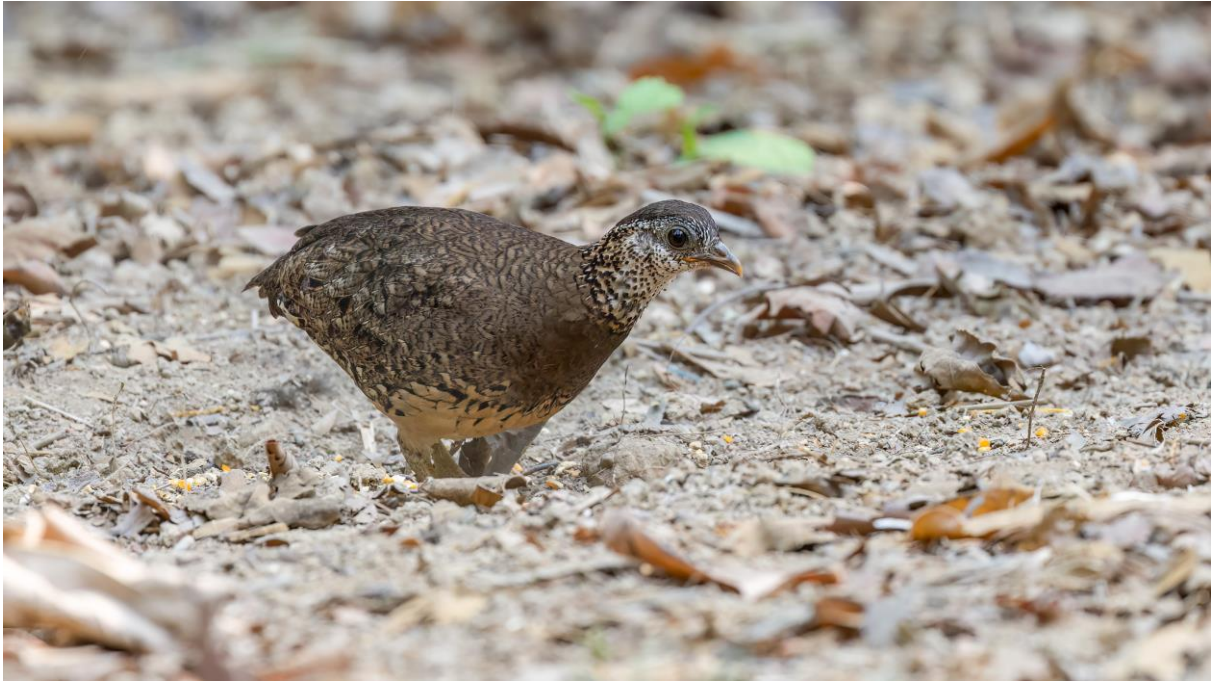
Green-legged Partridge (Toy Janssen)