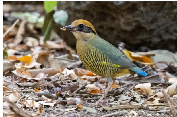
Figuur 14. Vrouwtje Bar-bellied Pitta (Toy Janssen)