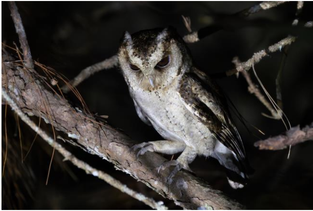
Figuur 19. Collared Scops Owl bij Ho Tuyen Lam, Đà Lat (Toy Janssen)

Owls laat zich geweldig zien, maar vooral een Collared Scops Owl geeft een show weg, op slechts een paar meter.