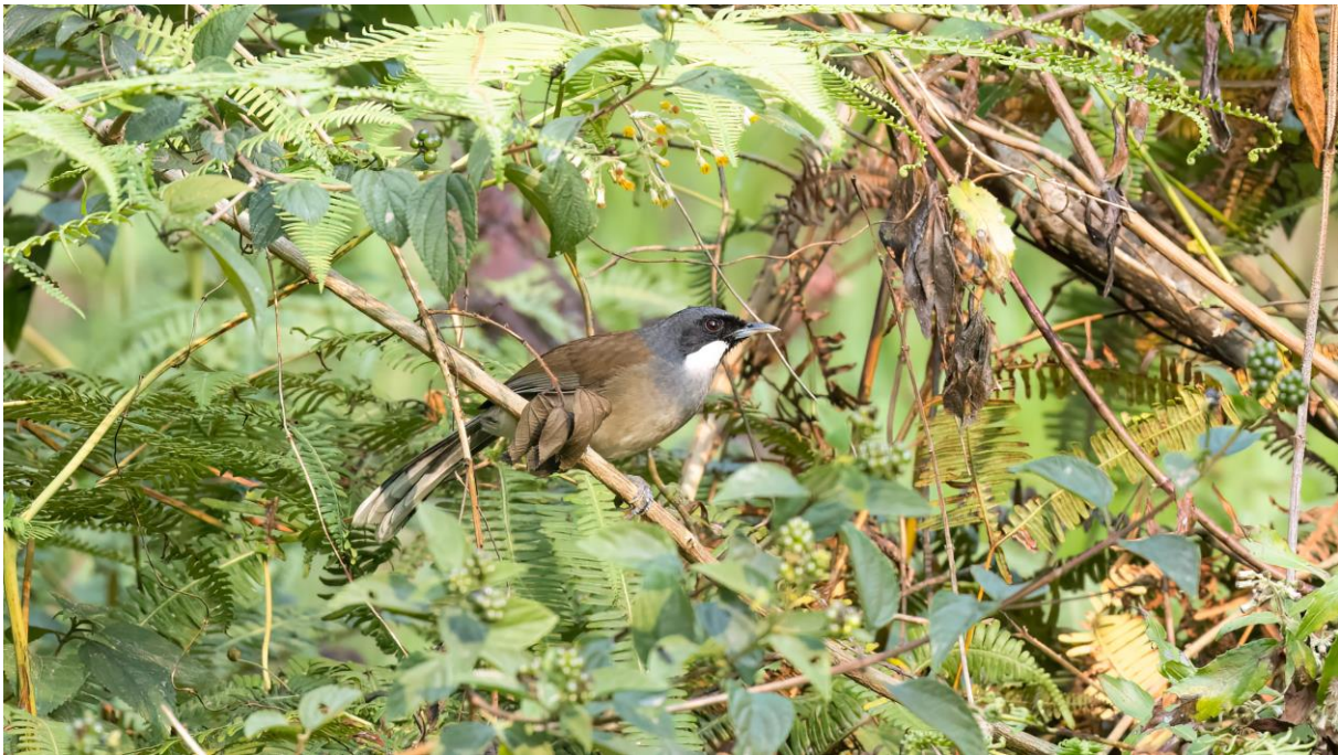
White-cheeked Laughingthrush (Toy Janssen)