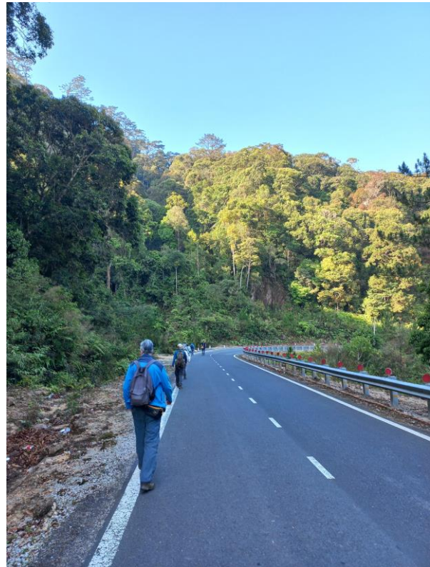
Figuur 18. Vogelen langs de weg bij Mt. Bidoup, nadat ons toegang tot een zijweg is ontzegd.

Zoals het ritueel voorschrijft, ontbijten we om 5.30 en vertrekken we om 6.00 – alleen de laatste ochtend wijken we daar vanaf. Het is weekend, dus Minh en ik puzzelen op een programma waarbij we niet worden overlopen door dagjesmensen. We kiezen voor Mt. Bidoup, dat 45 minuten van Đà Lạt ligt. Daar is het rustig. We stuiten alleen op een ander onvoorzien probleem: een voormalige gravelzijweg door het bos is geasfalteerd. Er staat een hek voor. De nieuwe weg is betaald door een houtkapbedrijf. Ondanks dat de weg ook door de beschermdede delen van een nationaal park voert, mogen we van de bewaker de weg niet betreden, een nogal opgewonden standje. Hij staat naar ons te schreeuwen omdat wij – nog vóór het hek – op het begin van de weg staan. Stel je voor dat die weg slijt van onze wandelschoenen! Om 'm op de kast te jagen, werp ik nog een handkusje naar de schreeuwende man toe als we onverrichter zake afdruipten. Kinderachtig, maar wel effectief. Dit is wel balen, want een zijweg vogelt toch veel lekkerder dan de hoofdweg, waar toch af en toe verkeer langskomt. En dit kost ons zeker meer verborgen levende soorten. We vermaken ons evengoed met de endemische ondersoorten van Long-tailed (Annam) Minivet en White-browed (Dalat) Shrike-babbler (tot voor kort als aparte soort beschouwd).