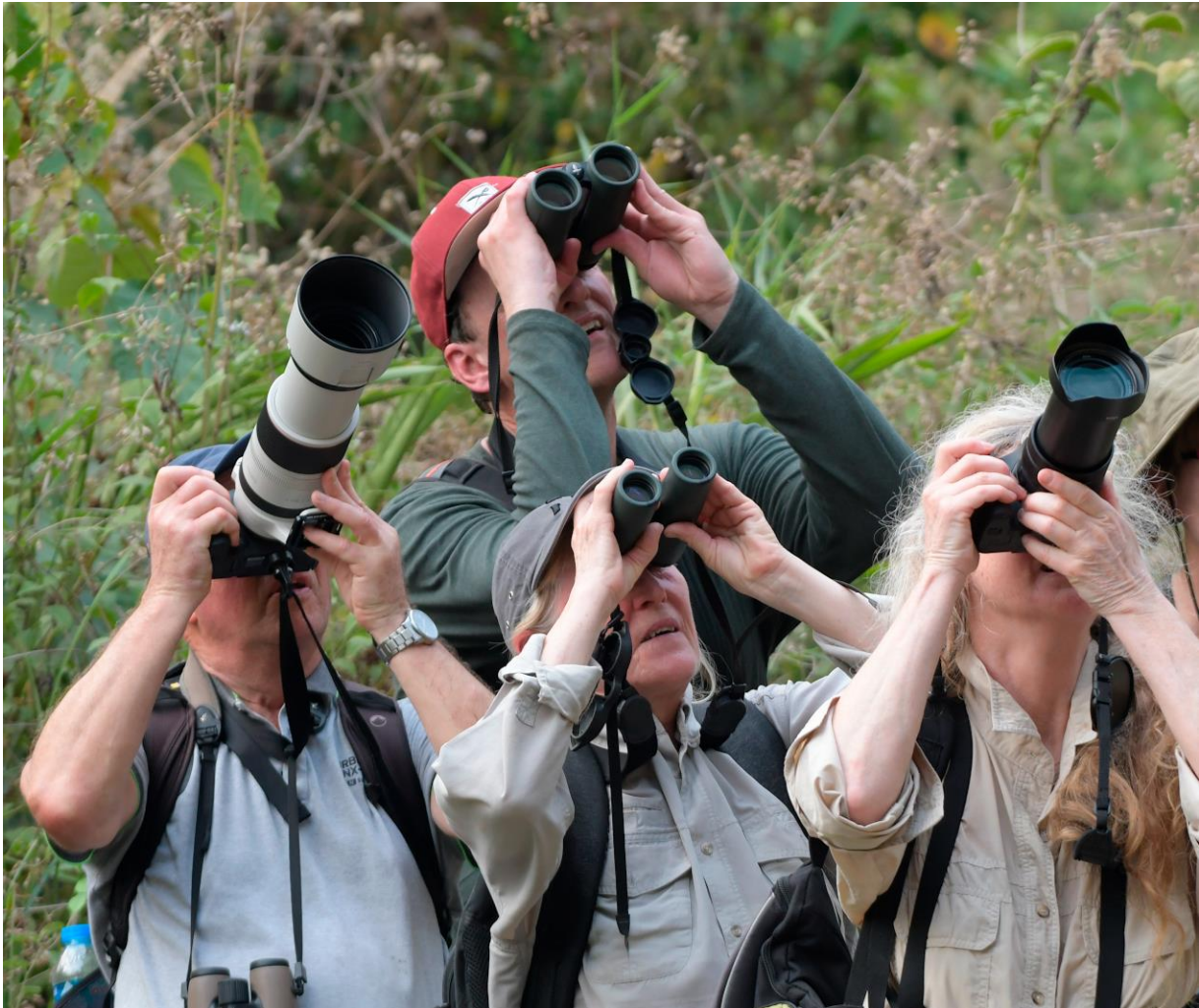
Figuur 2. Vogelen in Cát Tiên, 20 maart 2023.

Het was een endemenfeest, met Black-crowned Fulvetta, Grey-crowned Crocias, Collared Laughingthrush en Vietnamese Greenfinch als soorten die alleen in Vietnam voorkomen. Daarnaast zagen we liefst 21 bijna-endemen, waaronder zeer beperkt verspreide als Germain's Peacock-pheasant, Bar-bellied en Blue-rumped Pitta, Black-hooded Laughingthrush, Vietnamese Cutia en Yellow-billed Nuthatch. Ook zagen we nog eens 21 ondersoorten die endemisch zijn voor de regio, of alleen op het Đà Lạt plateau voorkomen. Sommige daarvan, zoals Plain Minla, Grey-crowned Bushtit en Dalat Shrike-Babbler worden soms als aparte soort beschouwd. Wijder verspreide goede soorten waren onder andere Groene Pauw, Siamese Fireback, Blyth's Frogmouth, Chinese Egret, White-faced Plover, Malaysian Plover, Nordmann's Greenshank, Black-tailed Gull, Spot-bellied Eagle Owl, Banded Kingfisher, Collared Falconet en vijf soorten broadbills. We determineerden 14 soorten zoogdieren (excl. onbekende vleermuizen), waaronder de zeldzame en bedreigde primaten Yellow-cheeked Gibbon en Black-shanked Douc, en een koningscobra was bijzonder.