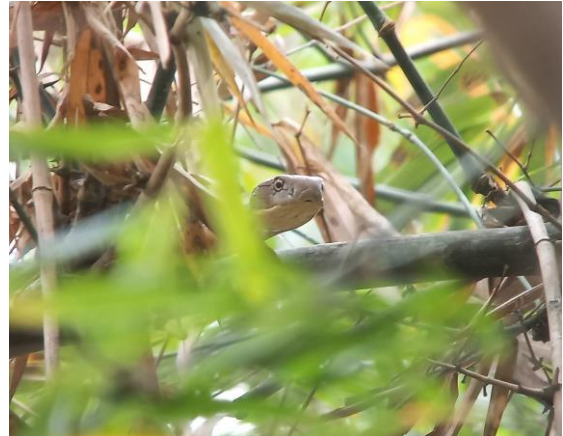
Figuur 10. Een Koningscobra was één van de vele hoogtepunten van deze dag.