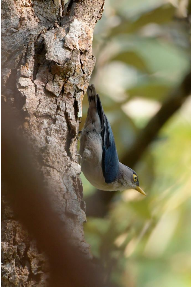
Figuur 22. Yellow-billed Nuthatch, die een beperkte verspreiding heeft in Vietnam, Laos en Hainan (China).

Vandaag pakken we de westzijde van Ho Tuyen Lam. Eerst vogelen we langs de weg. Voor we het weten hebben we een geweldige waarneming van een paartje Grey-crowned Crocias, die we veel beter zien dan eergisteren. Nauwelijks bekomen van zoveel geluk laat een groepje White-cheeked Laughingthrushes zich goed zien. Twee Vietnamese Cutia's vechten om onze aandacht, maar in de verte zit ook een Black-headed Parrotbill. Dichtbij in een den is echter ook een Orange-headed Thrush van de lokale ondersoort te bewonderen. We komen de spreekwoordelijke ogen tekort. Als we richting een trail lopen, zien we een paartje Bay Woodpecker, een soort die we tot dan alleen gehoord hadden. Op de trail gaat het feest volop door. Er zijn mooie, flinke flocks . Veel hebben we eerder al gezien, maar er zijn ook nieuwe soorten, zoals enkele fraaie Yellow-billed Nuthatches – die buiten Vietnam alleen voorkomen in kleine delen van Laos en op het eiland Hainan, China. Er zitten meerdere Yellow-cheeked Tits en twee Red-billed Scimitar-babblers laten zich goed zien. Indochinese Green Magpie laat zich alleen horen, maar de doorzetters die een smal bospaadje aflopen met Minh zien Rufous-backed Sibia (die in Đà Lạt juist een zwarte rug heeft). Kortom: een ochtend van hoogstaande kwaliteit en kwantiteit!