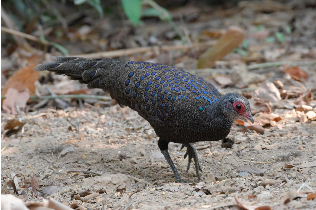
Figuur 12. De bijna-endemische Germain's Peacock-pheasant (die nog nét ook in Cambodja voorkomt) werd regelmatig gehoord, maar zien bleek lastig. Een schuilhut bracht uitkomst, Cát Tiên, 23 maart 2023.