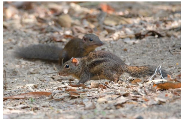
Figuur 16. Indochinese Ground-squirrel (voorground) en Northern Treeshrew (achtergrond).