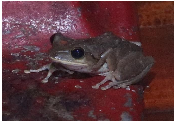
Met de klok mee, vanaf linksboven: Long-tailed Sun Skink, Moustached Lizard, Brown Tree Frog, Clouded Monitor en Bronze Skink, Cát Tien (Frans Koop, minus Moustached Lizard)