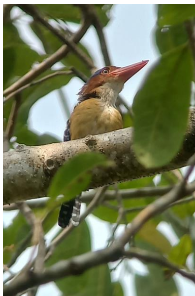
Figuur 3. Mannetje Banded Kingfisher.