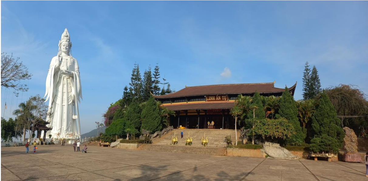
Figuur 24. Het spontane bezoek aan een tempel met enorm Boeddhabeeld was een hoogtepunt tijdens de reisdag op 28 maart 2023.