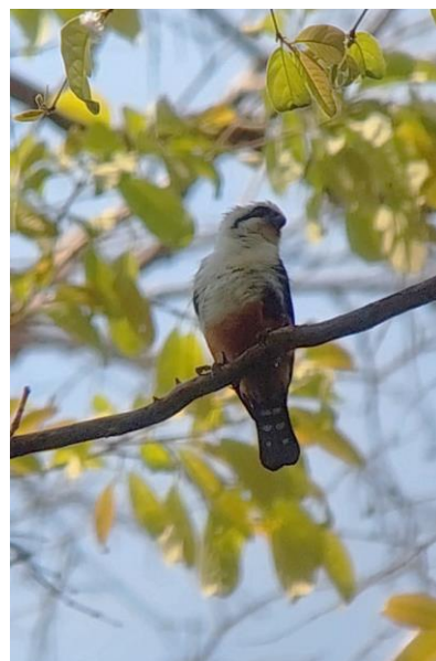
Figuur 5. Collared Falconet, (René Lieverse).