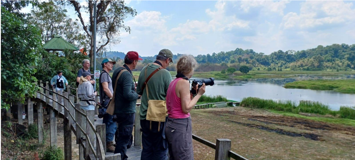
Figuur 8. Vogelen vanaf de board walks bij Crocodile Lake, Cát Tiên (Le Quy Minh).