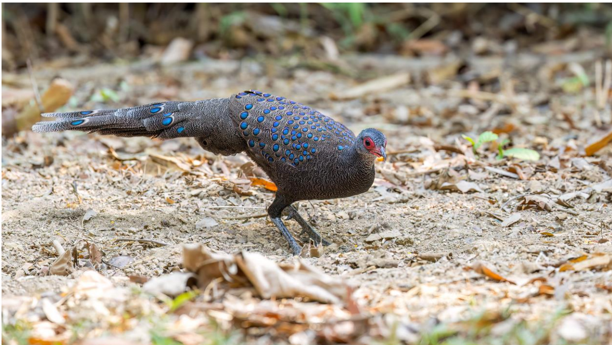
Germain's Peacock-pheasant (Toy Janssen)