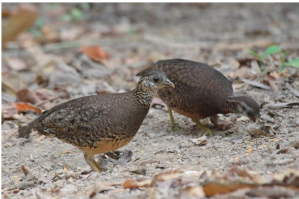
Figuur 15. Green-legged Partridges