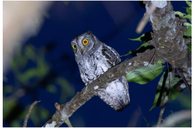
Figuur 20. Oriental Scops Owl bij Ho Tuyen Lam, Đà Lat (Toy Janssen)