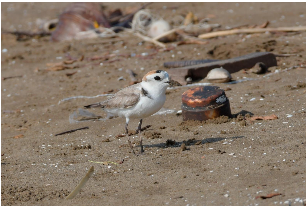
Figuur 25. Mannetje van de recent (her)ontdekte White-faced Plover, tussen de angespoelde troep op het strand van Go Cong.