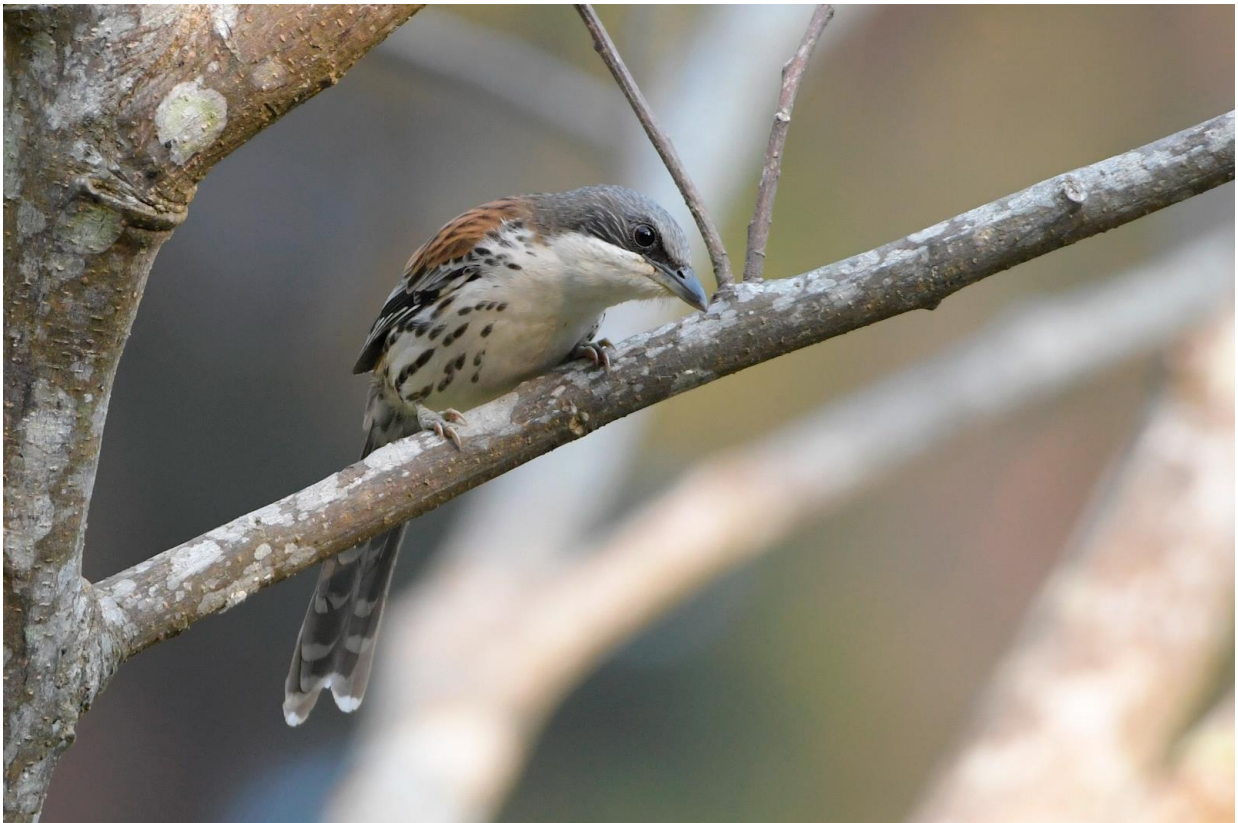
Figuur 21. De bedreigde endem Grey-crowned Crocias bij Ho Tuyen Lam, Đà Lat.