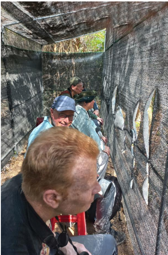
Figuur 11. Wachten op de Germain's Peacock-pheasant in de schuilhut, Cát Tiên, 23 maart 2023.