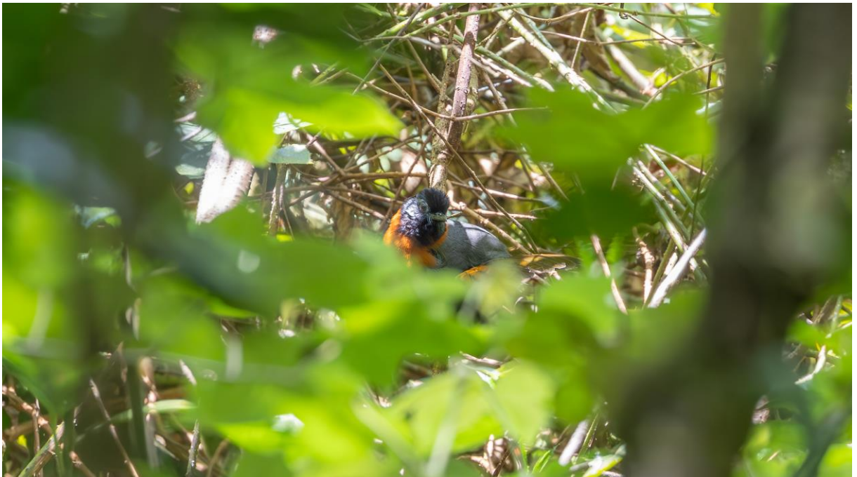
Endemische (onder)soorten van Đà Lạt. Met de klok mee, vanaf linksboven: Rufous-backed ('Black-backed') Sibia (Toy Janssen), Blue-winged ('Plain') Minla, Black-throated ('Grey-crowned') Tit (Toy Janssen), Collared Laughingthrush (Toy Janssen) en White-browed ('Dalat') Shrike-babbler.