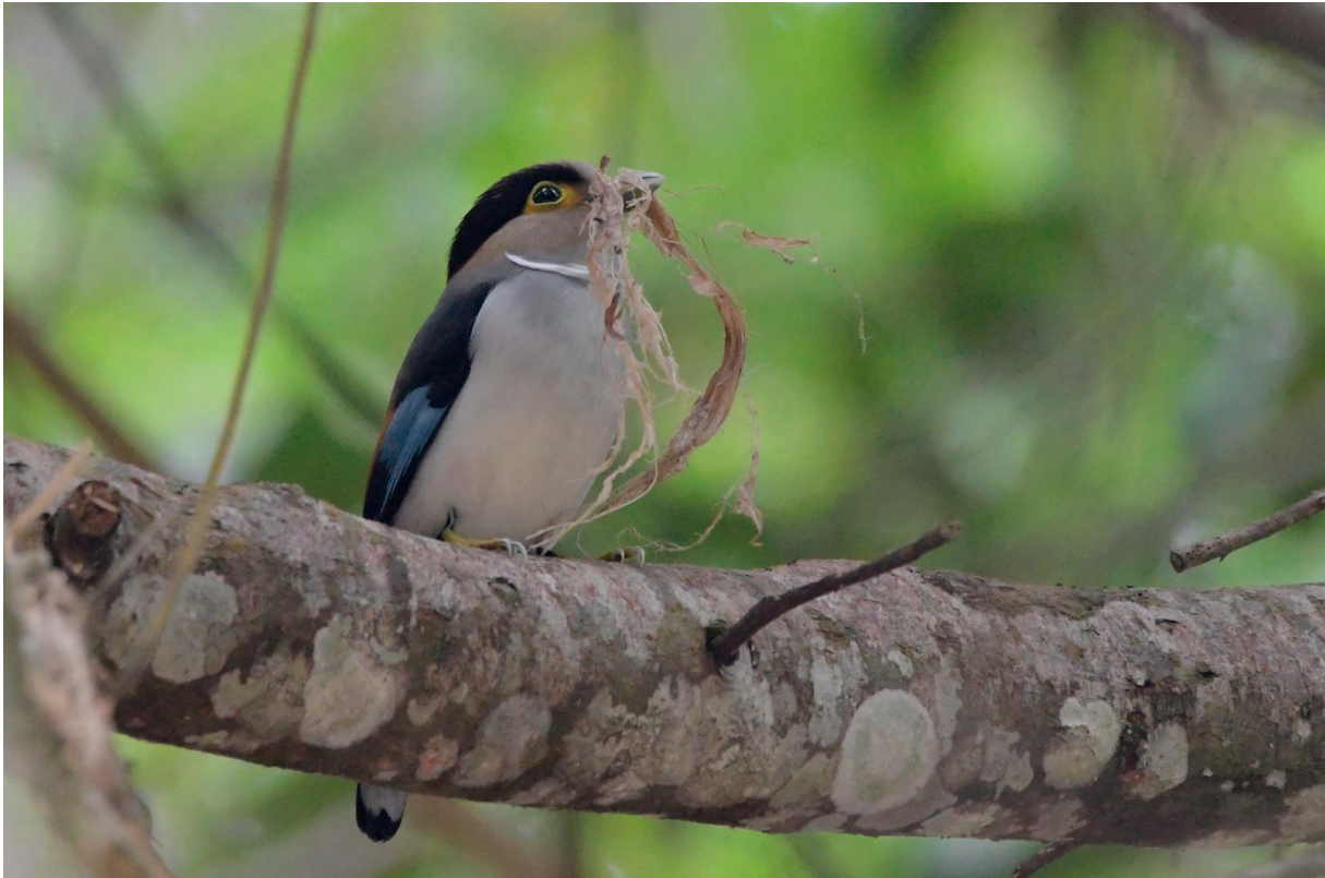
Figuur 17. Nestbouwend vrouwtje Silver-breasted Broadbill. Mannetjes van deze soort hebben geen zilver lijntje in de nek. We Zagen alle vijf de in Vietnam voorkomende broadbills.

In de middag rijden we naar het nabijgelegen Di Linh, een heuvelbos langs de weg dat ze vergeten zijn te kappen. Onderweg maken we een tussenstop op een vuilnisbelt (incl. asbest) voor de recentelijk van Brown afgesplitte, bijna endemische Annam Prinia. Zonder succes. De avifauna op Di Linh is totaal anders dan in Cat Tien. Grote aantallen Germain's Swiftlet vliegen voorbij, een steekproef van Toy en mij levert geëxtrapoleerd ca. 1500 vogels per uur op. Af en toe zitten er Silver-backed Needletails, House Swifts en Asian House Martins tussen. We zien en horen de eerste Indochinese (Annam) Barbets. We vogelen langs de weg, af en toe gehinderd door het verkeer. Voorbij racende Pin-tailed en Wedge-tailed Green Pigeons zijn maar voor enkelen van ons weggelegd. De altijd geliefde, kleurrijke Long-tailed Broadbill is een welkome aanvulling op de soortenlijst, enkele Black-chinned Yuhina's blijken achteraf exclusief voor de reis, maar het hoogtepunt is de bijna-endemische Black-headed Parrotbill. Daarvan zou nog maar één andere zichtwaarneming volgen. De laatste waarneming van betekenis is een nestbouwend paartje Silver-breasted Broadbill, waarmee we de lijst van alle vijf de mogelijke broadbills compleet maken!