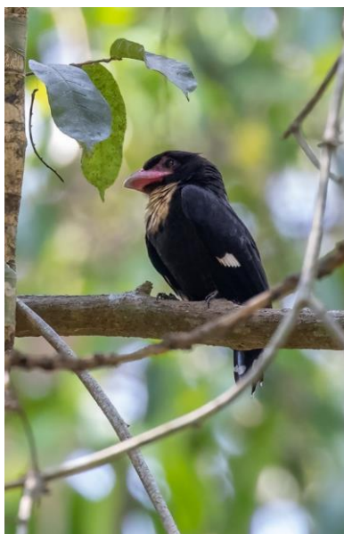
Figuur 4. Dusky Broadbill.