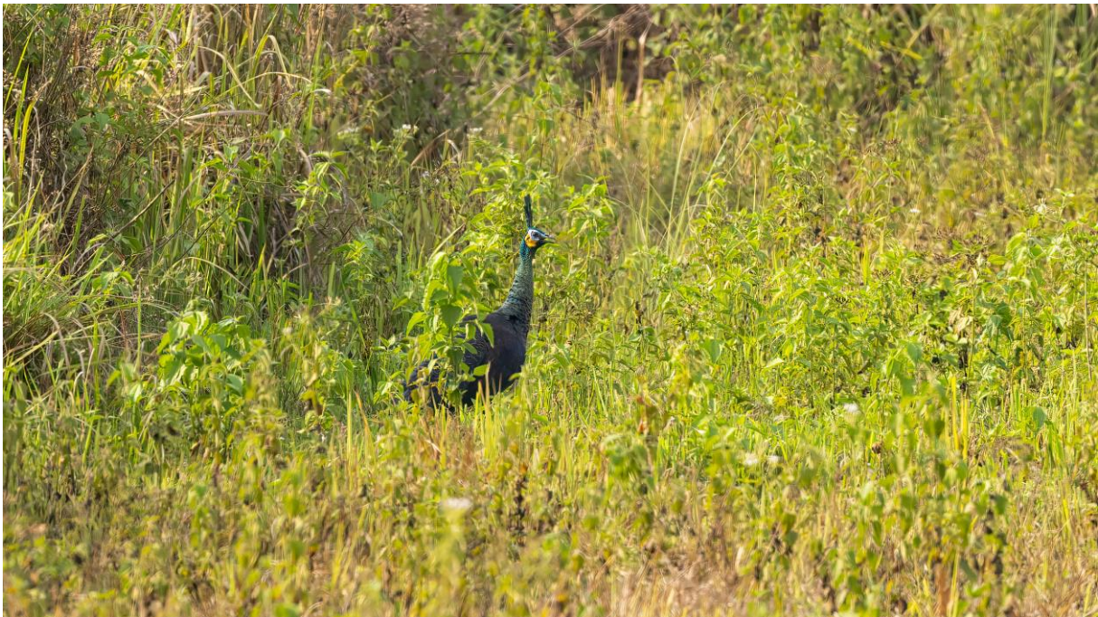
Green Peafowl (Toy Jansen)