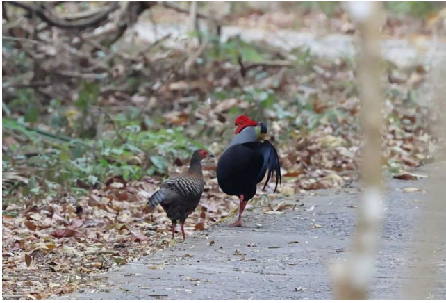
Figuur 9. Paartje Siamese Fireback, Cát Tiên, 22 maart 2023