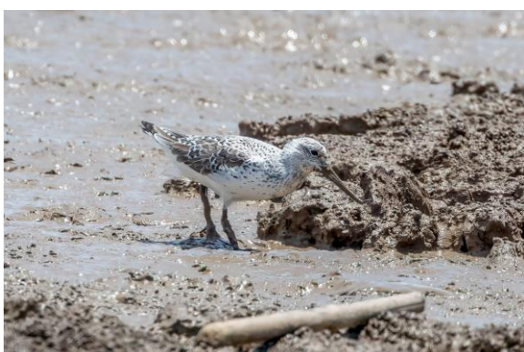
Figuur 26. De laatste toevoeging aan de lijst was de wereldwijd bedreigde Nordmann's Greenshank (Toy Janssen).

Als ik ter illustratie het melancholische geluid van de Golden-bellied Gerygone afspreek (de enige vertegenwoordiger in ZO-Azië van deze Australische vogelfamilie), die ik wil zoeken in de mangroven, komt er tot mijn verrassing reactie uit de bomenaanplant. De vogel laat zich geweldig zien. In de mangroven voegen we nog een Bruine Boszanger aan de lijst toe. Toy en ik bijten ons tijdens de laatste blikken over de steltlopers vast in een kandidaat Nordmann's Greenshank, een bedreigde verwant van de Groenpootruiter. De snavel- en pootkleur kunnen door modder niet beoordeeld worden, maar de structuur is overtuigend. Een bijzondere soort om de reis mee te eindigen!