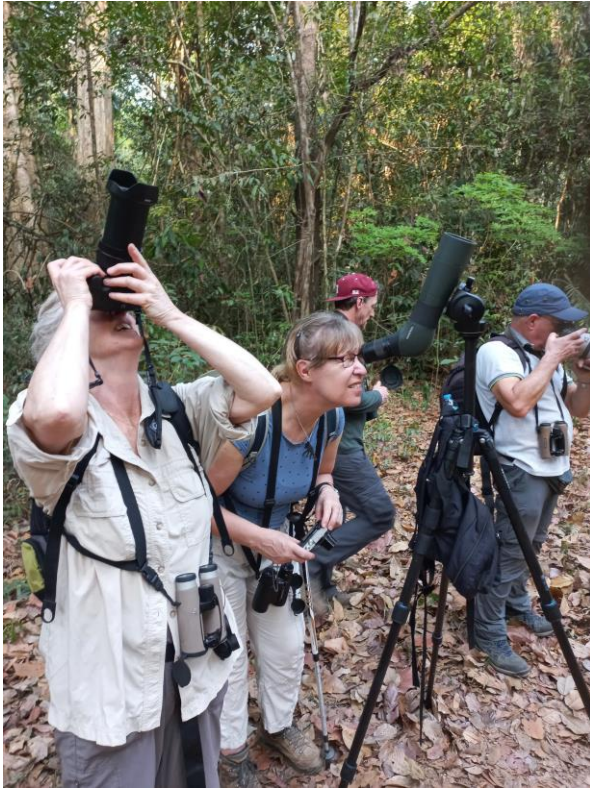
Figuur 6. Kijken naar een Banded Kingfisher.

Met de eerste middag, drie volle dagen en een ochtend op dag vijf, hebben we opgeteld vier dagen om Cát Tiên leeg te vogelen. Die heb je met zo veel diversiteit ook wel nodig. Een prettige bijkomstigheid is dat het veel rust geeft om zoveel nachten op dezelfde plek te verblijven. Langs de oostrand van het gebied loopt een tientallen kilometers lange weg. Een legertruck van het nationaal park brengt ons vanaf het hoofdkwartier naar bospaden die langs die weg liggen. Wat een luxe, de vorige keer dat ik er was heb ik die stukken gefietst en gelopen! In de ochtend verkennen we de brede Heaven Rapid's trail. We starten met de (verrassend enige) Yellow-bellied Warbler. Al snel lopen we aan tegen de grootste wenssoort van Ad: Banded Kingfisher. Ad 'spaart' alle ijsvogels van de wereld, en 'moet' deze ondersoort nog (op Borneo zien ze er heel anders uit). De vogel zit hoog in de boom, maar laat zich met de telescoop goed zien. Het is een voorbode voor een productieve wandeling met spectaculaire soorten. De eerste broadbill van de reis is de moeilijkste: het enige paartje Dusky van de vakantie laat zich mooi zien, kort daarna gevolgd door een paartje Banded. Ook Blue-bearded Bee-eater laat zich mooi zien.