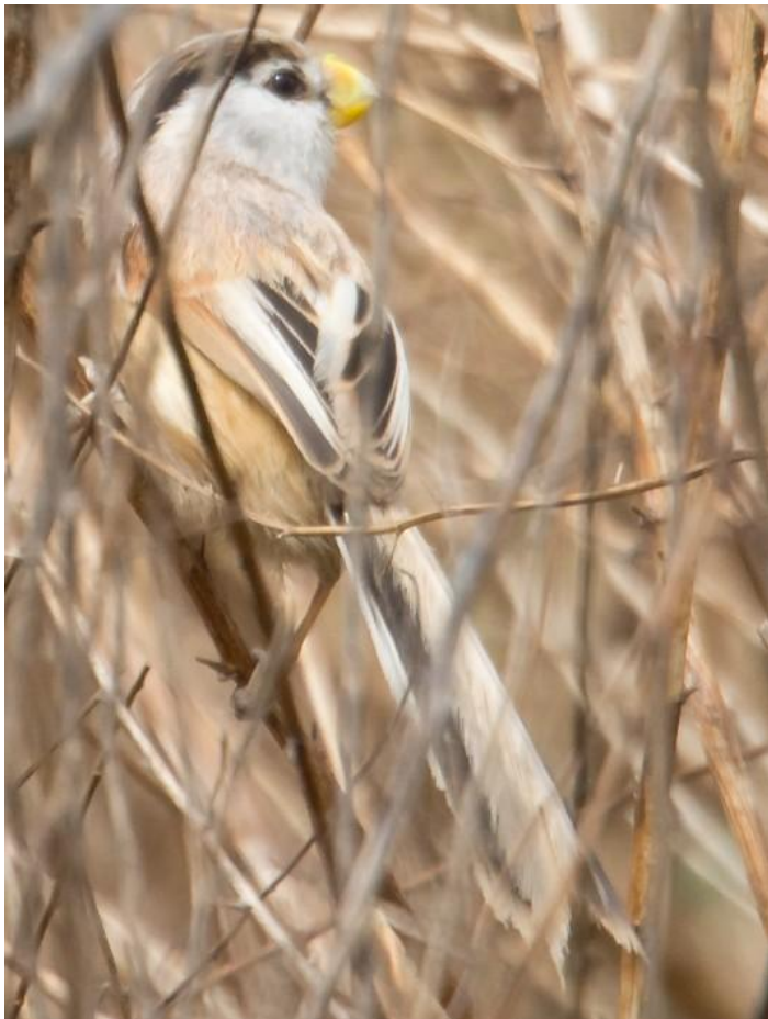
Reed Parrotbill (Gerard de Jong)