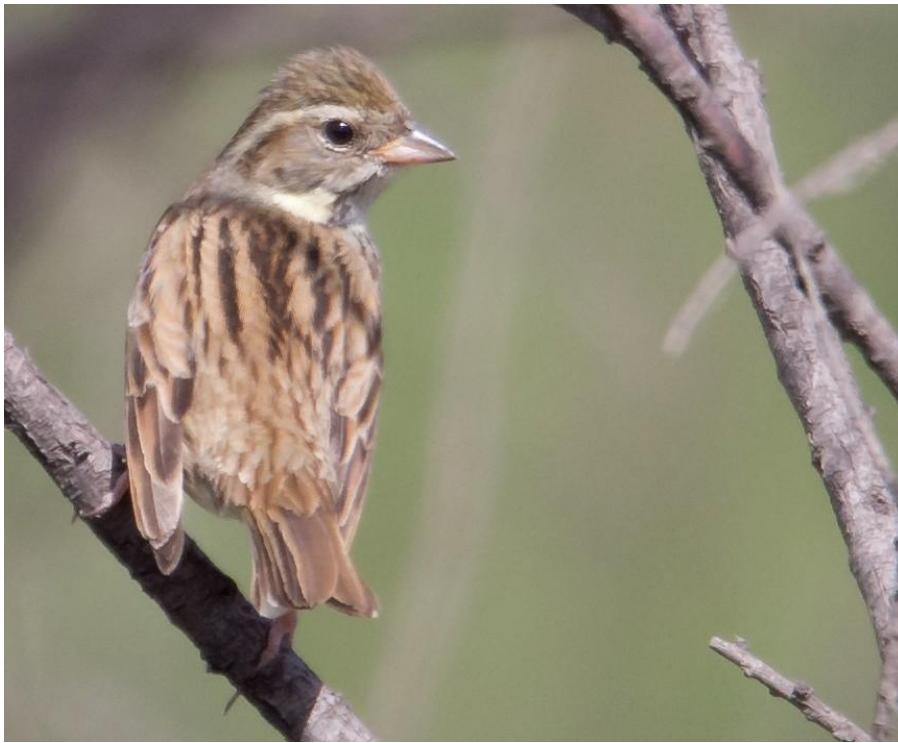
Maskergors vrouw (Gerard de Jong)