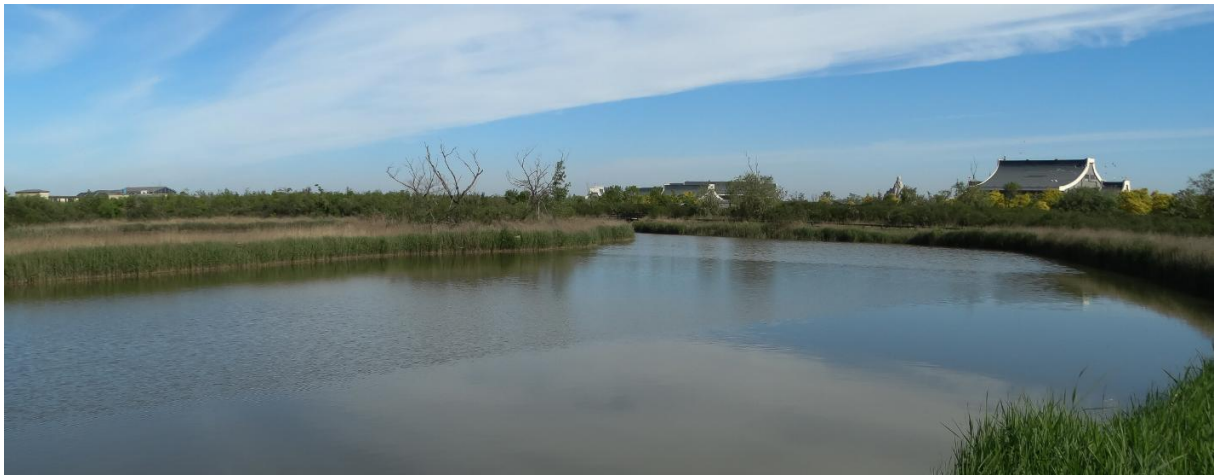
Happy Island (Wil Makkinje)