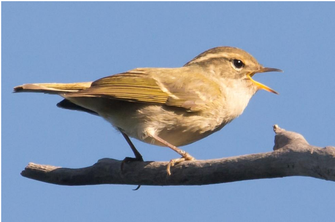
Chinese Leaf-warbler