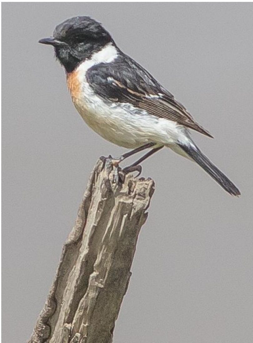
Stejneger's Roodborstapuit man (Wil Makkinje)