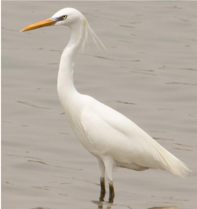
Chinese Egret (Gerard de Jong)