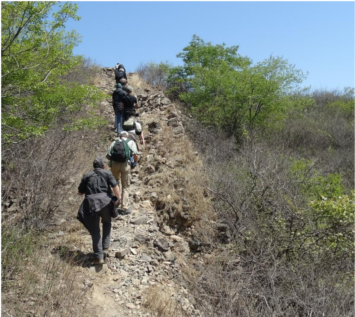
Restanten van de Chinese Muur (Wil Makkinje)