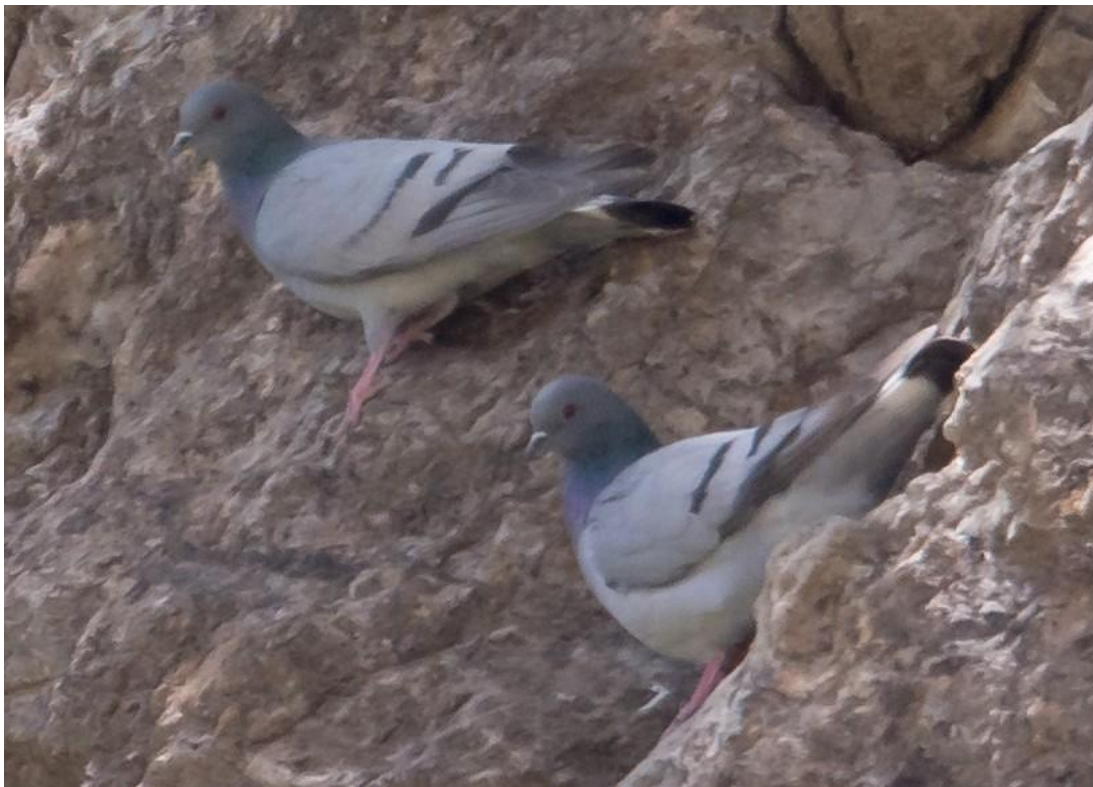
Hill Pigeon (Gerard de Jong)

Na het mogelijk voorgoed wegvallen van Ibisbill blijft dit 1 van de specialiteiten van Quinlong River, naast Hill Pigeon en Crested Kingfisher.