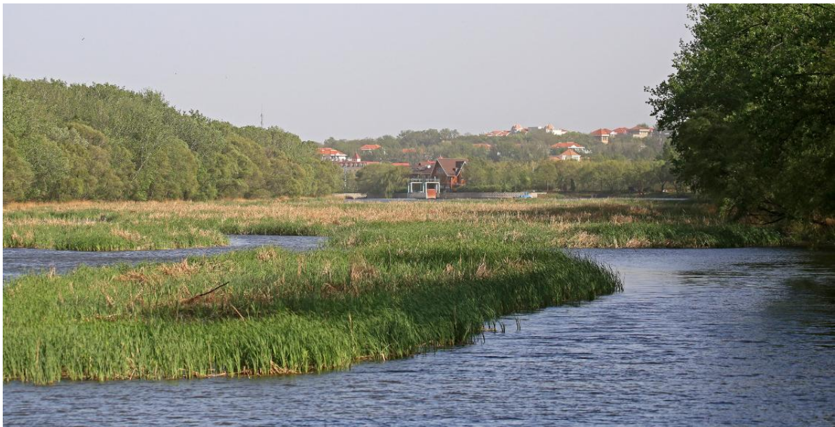
Wetlandpark, Beidaihe

(Geen aankomst, goed weer voor wegtrek, vrijwel lege bosjes): Swan Goose, 3 ad met 15 jongen en 1 Kolgans in een qua zangvogels vrijwel leeg Wetlandpark. Op de saltflats: 25 Roodkeelstrandlopers, 3 Taigastrandlopers, 1 Siberische Strandloper, 1 Heuglin's Meeuw ( taimyrensis -type) en ruim 10 ocularis Witte Kwikstaarten. Een Chinese Grey Shrike langsvliegend bij Light House Point was een wel heel onverwachte waarneming!