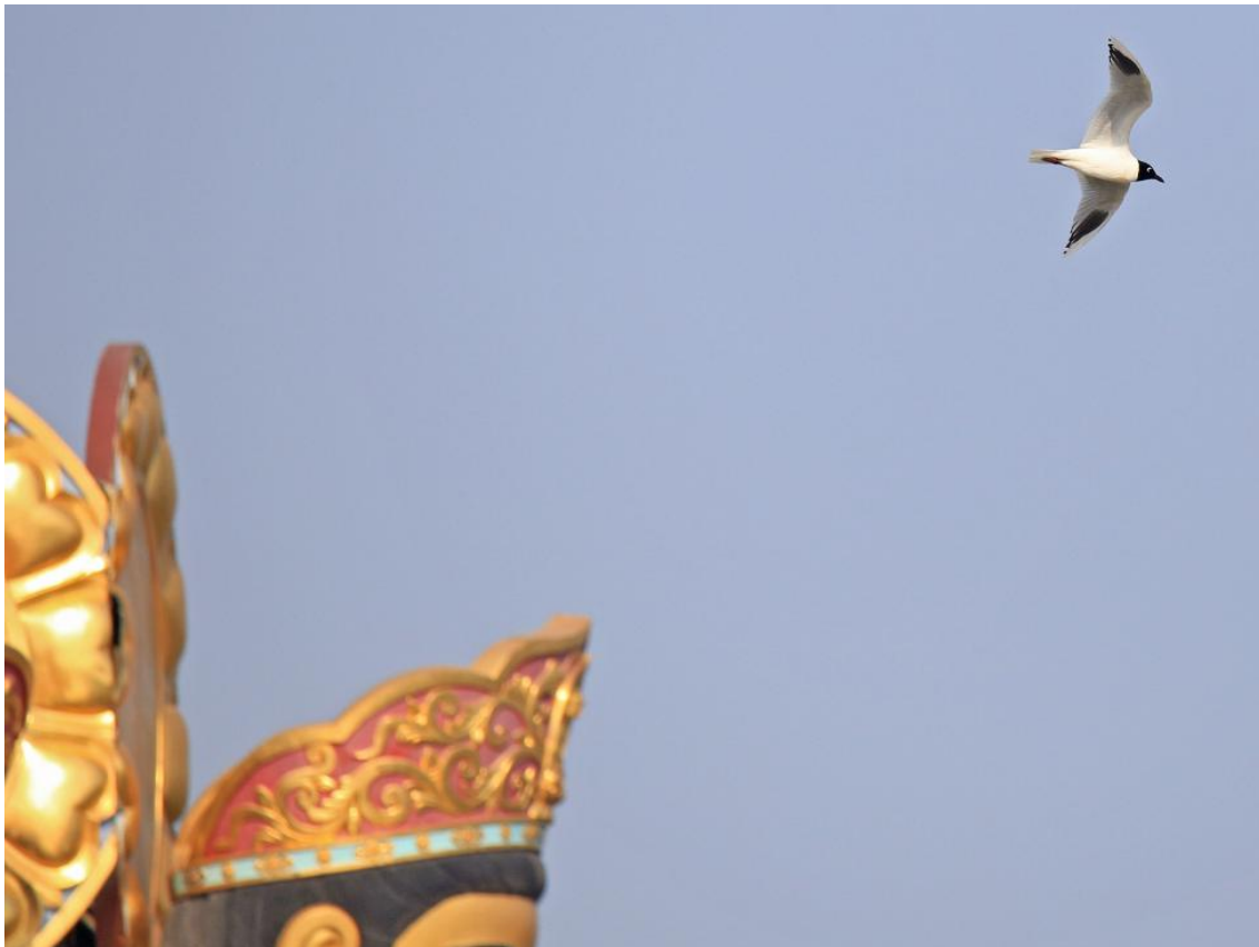
Saunders's Meeuw adult bij de tempel op Happy Island (Nils van Duivendijk)