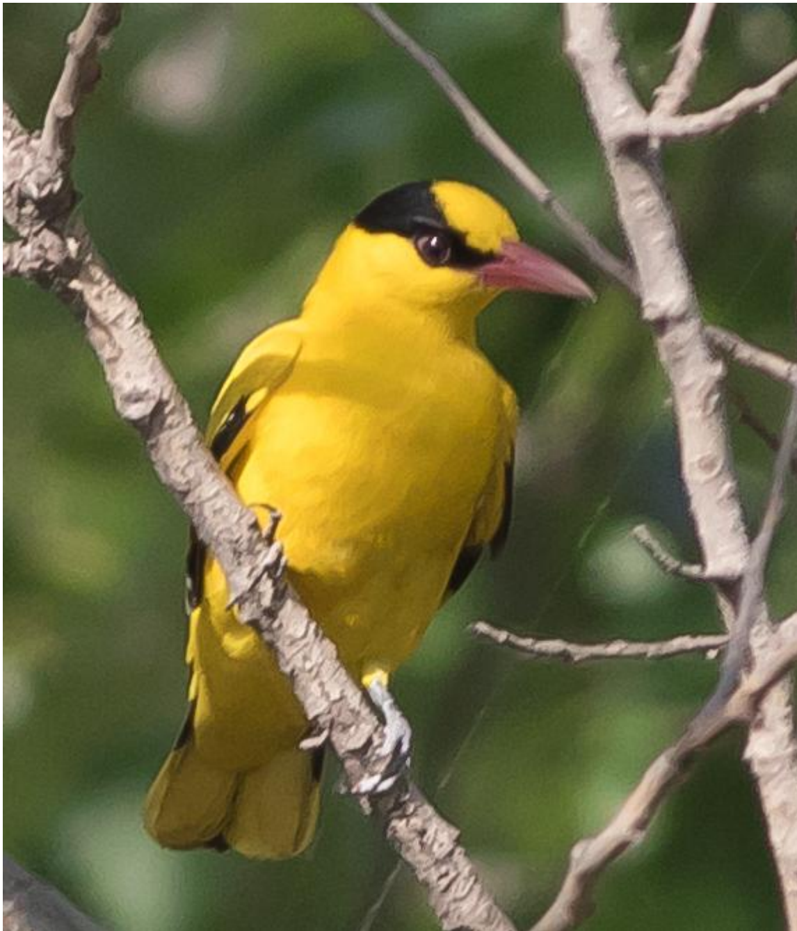
Black-naped Oriole (Wil Makkinje)