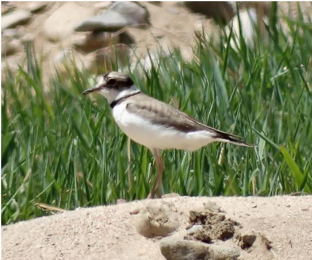
Long-billed Plover (Wil Makkinje)

Na het mogelijk voorgoed wegvallen van Ibisbill blijft dit 1 van de specialiteiten van Quinlong River, naast Hill Pigeon en Crested Kingfisher.