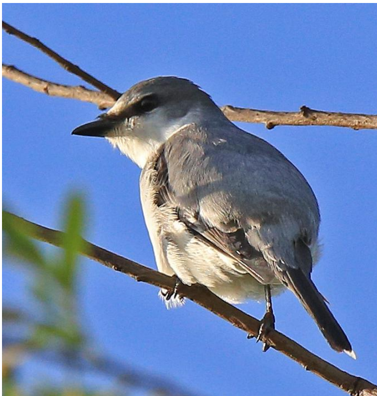
Ashy Minivet (Nils van Duivendijk)

(enige aankomst op Happy Island) 2 Ashy Minivet, 2 Kleine Sprinkhaanzanger (alleen gehoord), 1 Elisae's Flycatcher (noordpunt Happy Island), eerste Dark-sided Flycatcher. Old Peak: een kleine 10 Manchurain Bush Warbler, 5 Chinese Leaf-warbler, 2 Claudia's Leaf-warbler, veel Yellow-bellied Tit, 2 Rotswaluw, een kleine 10 Chinese Boomklever, 4 Godlewski's Bunting.