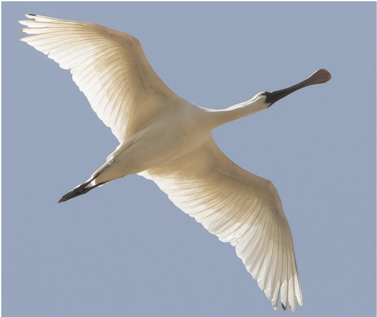
Black-faced Spoonbill 3e kj (Wil Makkinje)