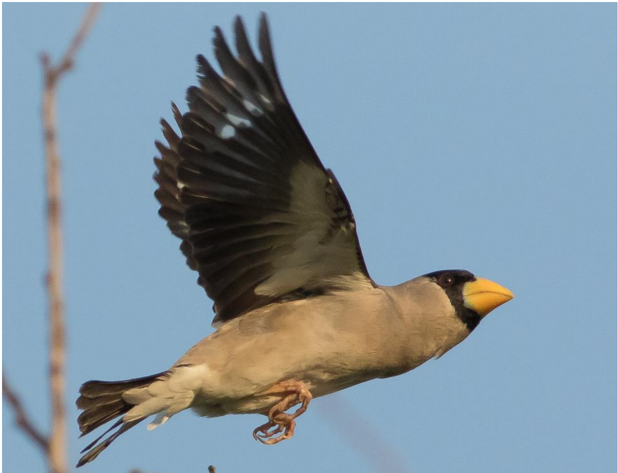
Japanese Grosbeak in onze tuin op Happy Island (Wil Makkinje)