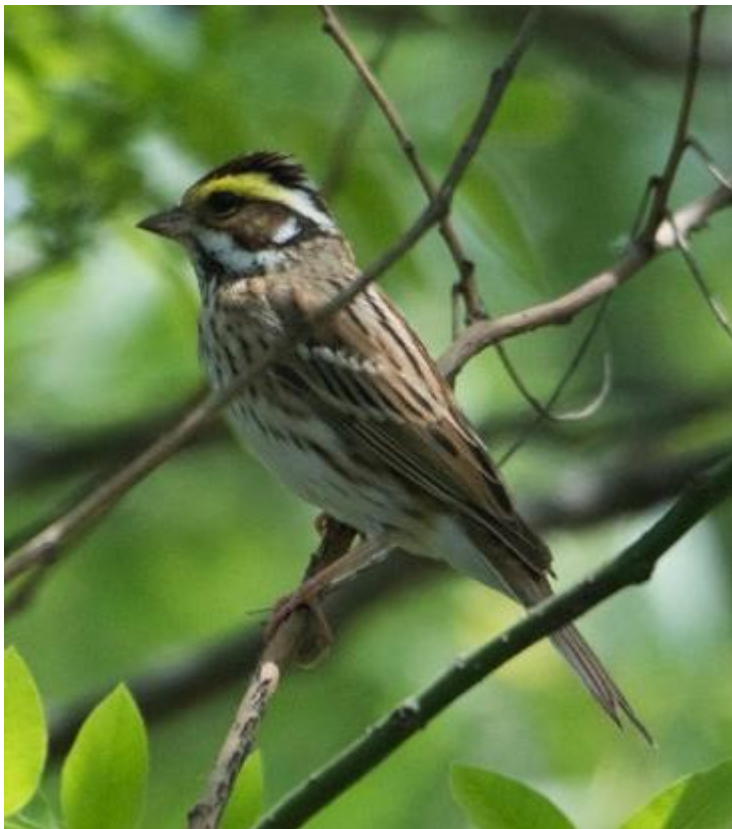
Geelbrauwgors (Jan Mulder)