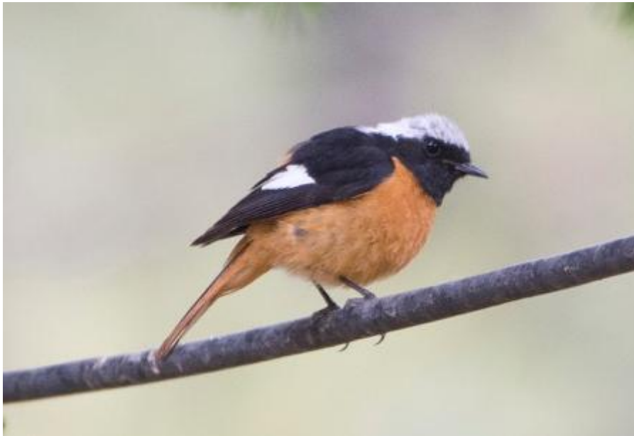
Daurische Roodstaart (Jan Mulder)