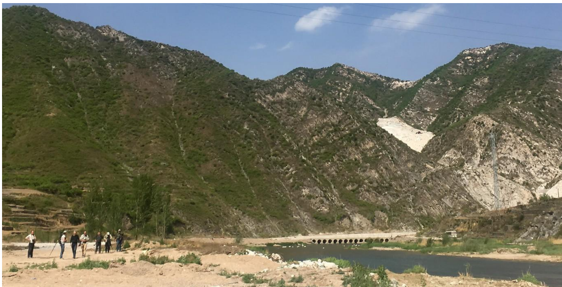
Quinlong River (Gerard de Jong)

(Zichtbare trek in de ochtend, beperkte aankomst) Quinlong River was goed voor 1 Mandarijneend, 3 Mangrove Reiger, meerdere Amoervalken dichtbij, 4 Long-billed Plover, 6 Hill Pigeon, 3 Crested Kingfisher, 3 Alpenkraai. Een Pale Thrush werd gehoord (zang) in de hoteltuin. 3 White-cheeked Starling, eerste Swinhoes en Kroonboszanger, ruim 10 Amoerkwikstaart, 10 Weidegors, 2 Steenarend, 2 Rotswaluw vormde verder het beeld van de dag. De Ibisbills waren al vanaf afgelopen november niet meer gezien en deze plek moet waarschijnlijk als verloren worden beschouwd voor de soort.