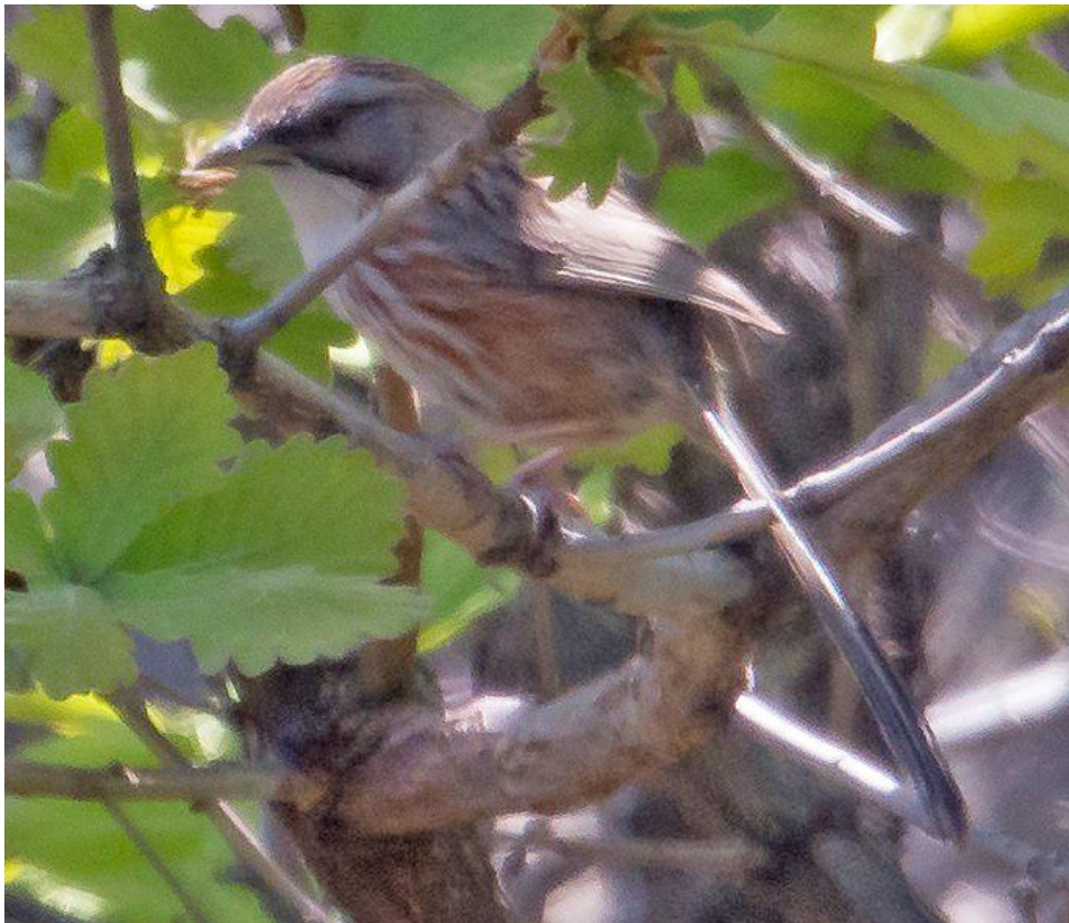
Chinese Hill Warbler (Gerard de Jong) Een taai soort om te zien te krijgen, maar een paartje werkte bij ons uiteindelijk goed mee.