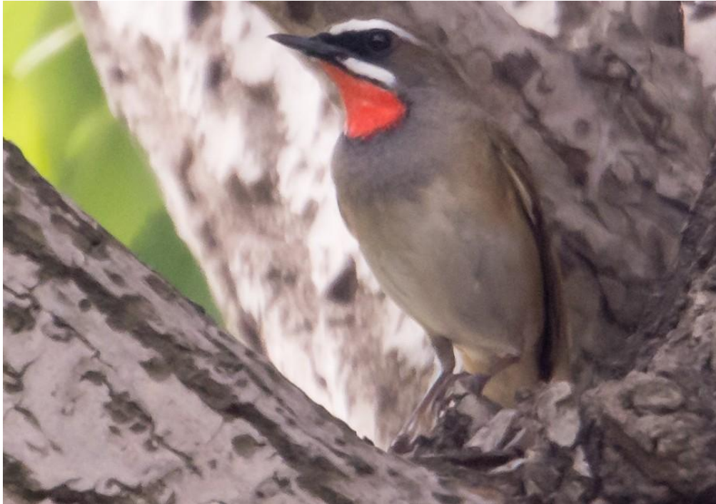
Roodkeelnachtegaal (Gerard de Jong)

Porpoise bij Light House Point, die zich langdurig maar uiteraard slechts gedeeltelijk lieten bekijken.