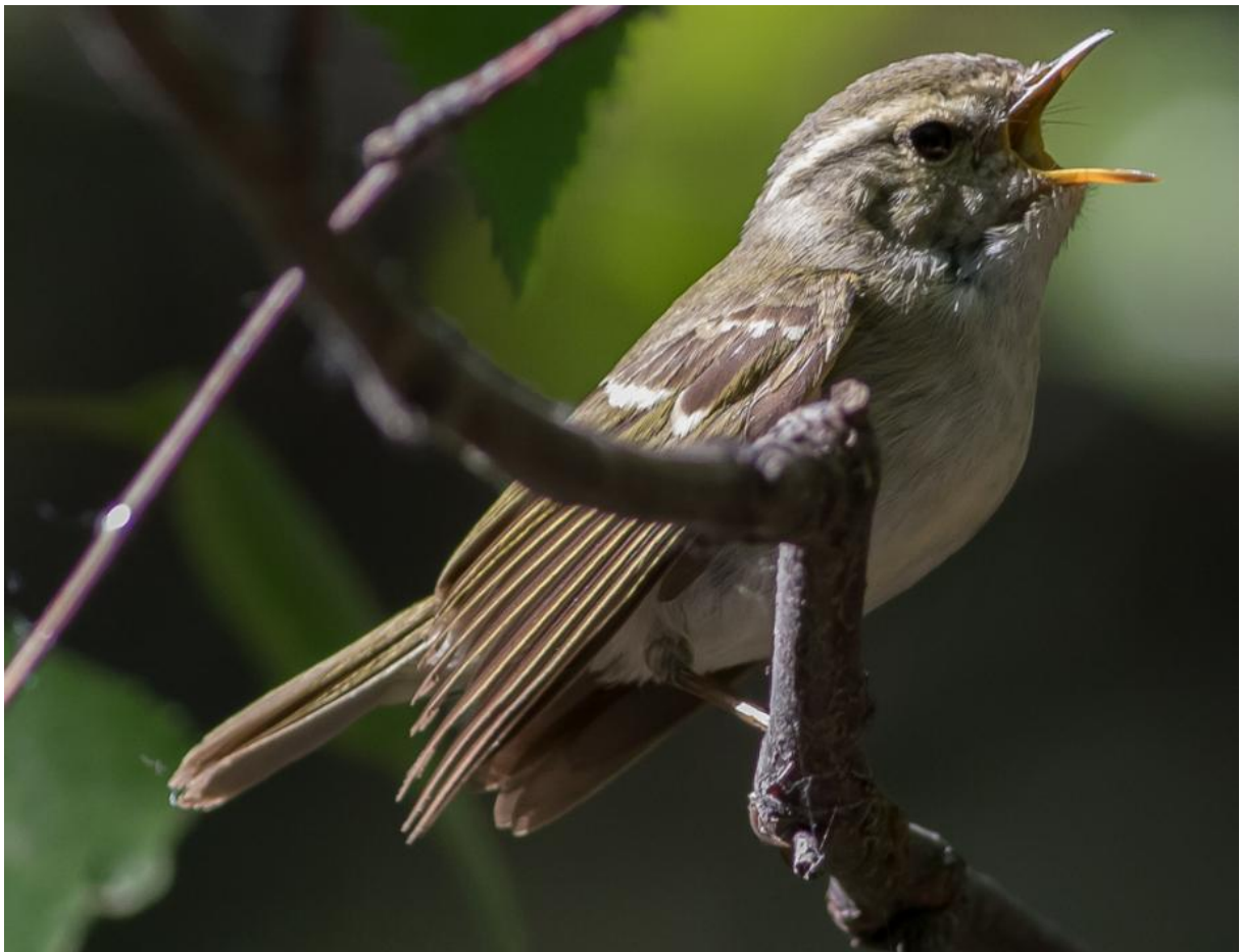
Humes Bladkoning (Wil Makkinje) Old Peak: Phylloo Walhalla!