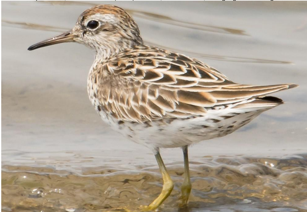
Siberische Strandloper (Gerard de Jong)

(Wat nieuwe soorten duidend op nachtelijke aankomst, maar overdag geen beweging) 3 Chinese Egret, 3 Breedbekstrandlopers, 1 Eastern Waterrail, 1 Grey-headed Lapwing (overvliegend), eerste Boskoekoek, 1 Goudlijster, ruim 10 Daurische Spreeuwen, eerste Chinese (Grote) Karekiet, 1 Blauwstaart, 1 Wilgengors man zingend.