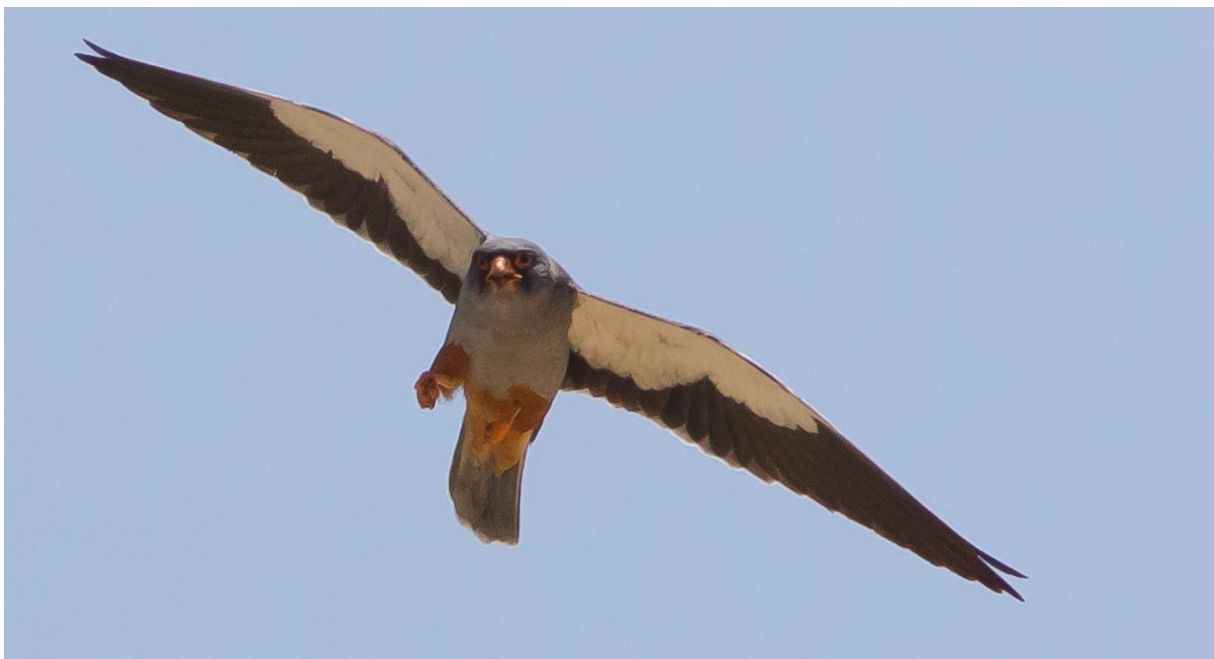
Amoenvalk adult man (Wil Makkinje)