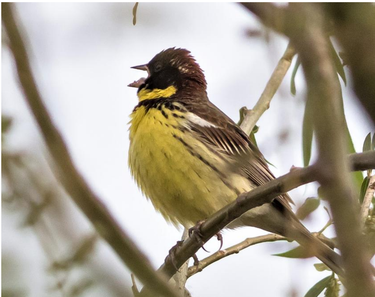
Wilgengors man (Wil Makkinje), zwanenzang van de soort....? Nog geen 15 jaar geleden de algemeenste gorzensoort op Happy Island met soms 100+ per dag, deze reis 6 ex totaal.