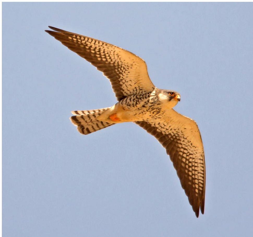
Amoervalk adult ♀ (Gerard de Jong)