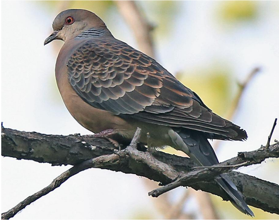
Oosterse Tortel (Nils van Duivendijk)