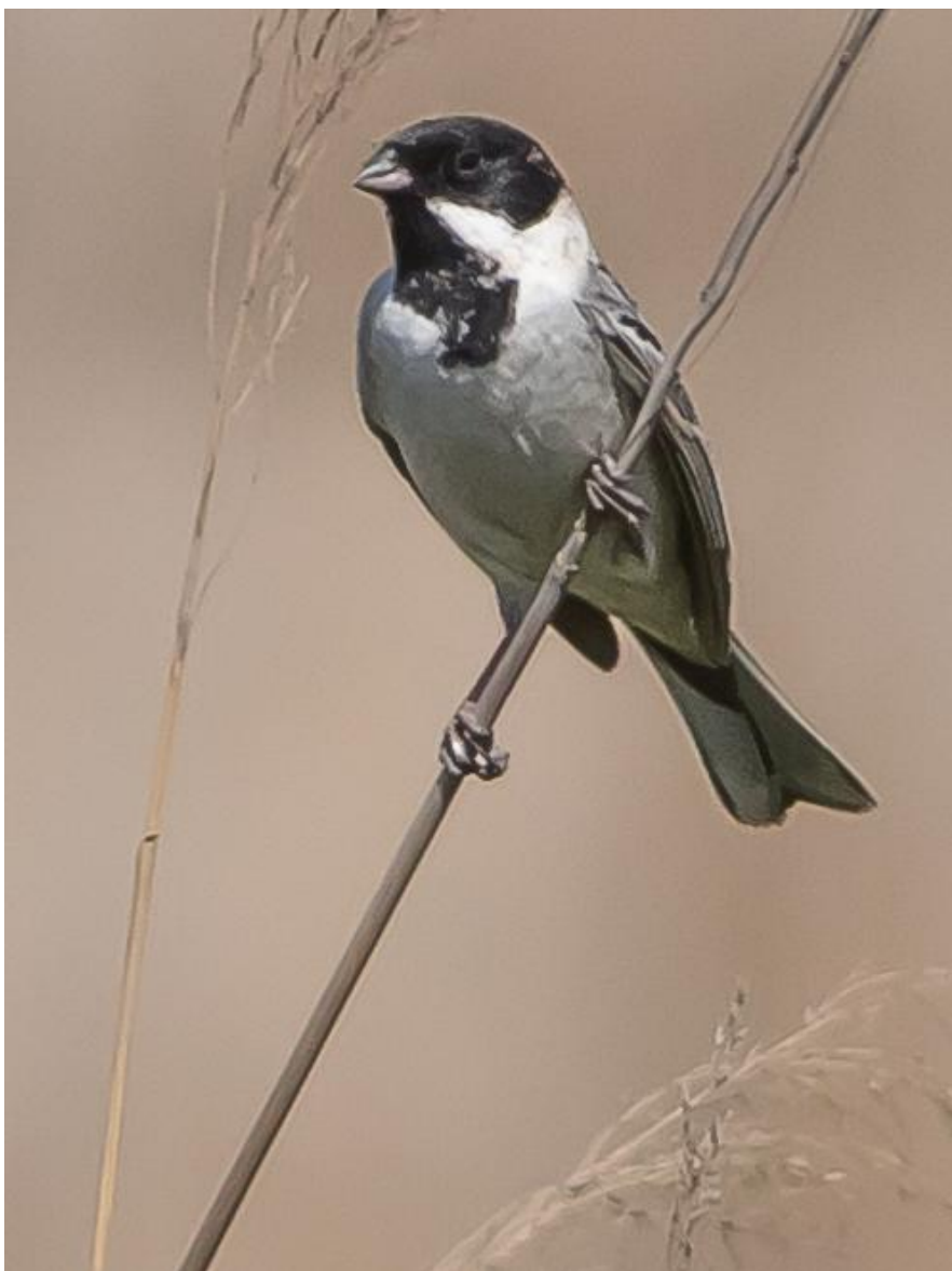
Pallas' Rietgors (Wil Makkinje)