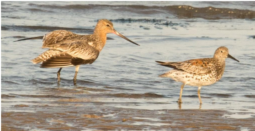
Oostelijke Rosse Grutto en Grote Kanoet (Gerard de Jong)