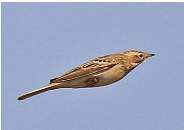
Mongoolse Pieper (Nils van Duivendijk)

(een goede aankomstdag op Happy Island, maar wij profiteerden daar weinig van gezien onze aankomst in de namiddag) 2 Chinese Egret, 3 Far Eastern Curlew, 10 Siberische Strandloper, de eerste 2 Grey-streaked Flycatcher, 1 Blauwe Rotslijster ( philippensis ), 1 Citroenkwikstaart, 2 Mongoolse Pieper, 2 Chinese Grosbeak, 1 Geelkeelgors.