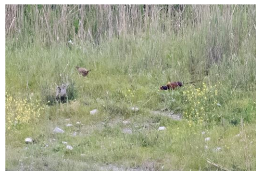
Een paartje Fazanten laat zich van afstand goed bekijken

Na de lange en warme dag van gister slapen we vandaag iets uit en ontbijten rustig. We gaan daarna eerst naar Eagle Gorge, waar we broedende gieren en Zwarte Ooievaars hopen te zien. Als we richting de Gorge lopen zien we een Slangenarend overvliegen, het blijkt onze enige Slangenarend van de trip. Hoewel het aantal soorten wat lager is dan gister genieten we toch van de laag overvliegende Vale Gieren en Zwarte Ooievaars , zien we een paartje Blauwe Rotslijster bij hun nest en zingen onderaan de vallei verschillende Groene Fitissen . Toot en Christian zien nog een Maskerdwergslang . In de middag gaan we naar een klein watertje in de hoop op steltlopers of eenden. Helaas zien we geen van beide (afgezien van een paartje Casarca's ) maar we zien we een mooie Ransuil . Bij een tweede watertje is het wel raak en zien we een groepje Grauwe Franjepoten , verschillende Steltkluten en Kleine Plevieren . Jan ontdekt nog een Kleine Strandloper en Patrick merkt wederom scherp een Menetries' Zwartkop op. In dit gebied zitten ook nog echte (wilde) Fazanten en we horen er af en toe een roepen. Zien is volgens Nika zo op de dag 'onmogelijk' en groot is dan ook de verrassing als Christian een