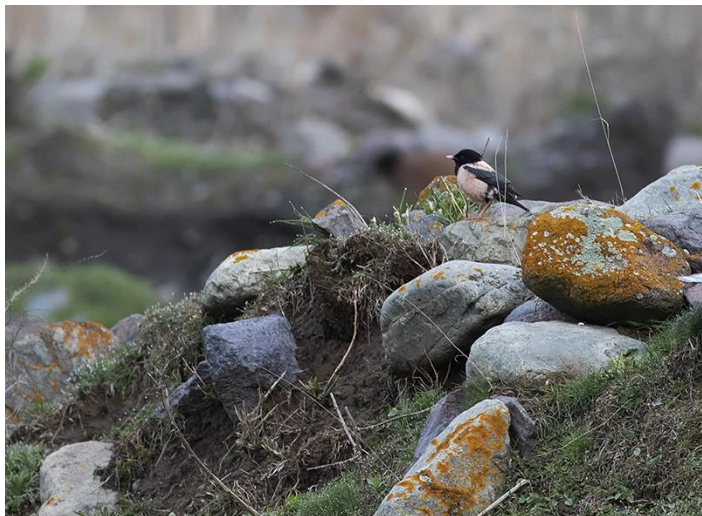
De eerste van vele Roze Spreeuwen deze reis

Eigenlijk een reisdag maar een groepje kan het niet laten om op dezelfde plek als gister te kijken. Het aandeel klauwieren is vergelijkbaar maar we zien ook al snel een mooie Roze Spreeuw! Er lijkt wat beweging in de roofvogels te zitten en we zien binnen mum van tijd Balkansperwer, Wespendif, Dwergarend en uiteindelijk ook een verre Steenarend! Helaas komt ook aan deze prachtige plek een eind en rijden de valleien van de Kaukasus uit, op naar het zonnige zuiden. Op de lunchlocatie vlakbij Tbilisi komt nog een fraaie Schreeuwarend overgevlogen, verder zien we onderweg een Aasgier . We stoppen nog op een plek op een paar plekken voor Balkanvliegenvanger maar helaas geeft die nergens thuis. Op de laatste plek lopen we naast de weg een waar paradijsje in met prachtig uitzicht en zingende Sperwergrasmussen, Zwartkopgorzen, Bijeneters, Wielewalen en een langsvliegende Grauwe Kiekendief . Verderop zijn we getuige van hoe grote kuddes schapen vanuit de laaglanden van Georgië de hoogtes van Tusheti in worden gedreven, een mooi schouwspel dat voor de herder 1.5 week hard werken is. 's Avonds horen we vanuit het hotel in Dedoplistskaro nog een Dwergooruil roepen.