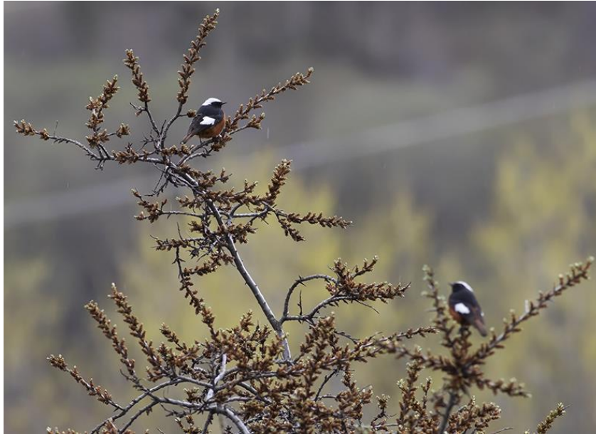
Twee mannetjes Witkruinroodstaart laten zich prachtig zien

De regen begint weer en we doen een poging bij een klein parkje in het centrum van Kazbegi. Hier zitten flink wat vogels, waaronder veel Grauwe Klauwieren en Grauwe vliegenvangers . Een Oostelijke Vale Spotvogel is slechts voor enkele weggelegd. We sluiten de dag af met een enorme groep Oost-Kaukasische Toers .