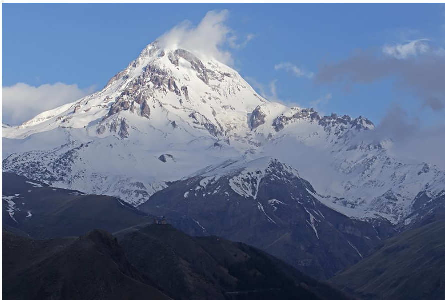
De berg Kazbek torent hoog boven Kazbegi uit