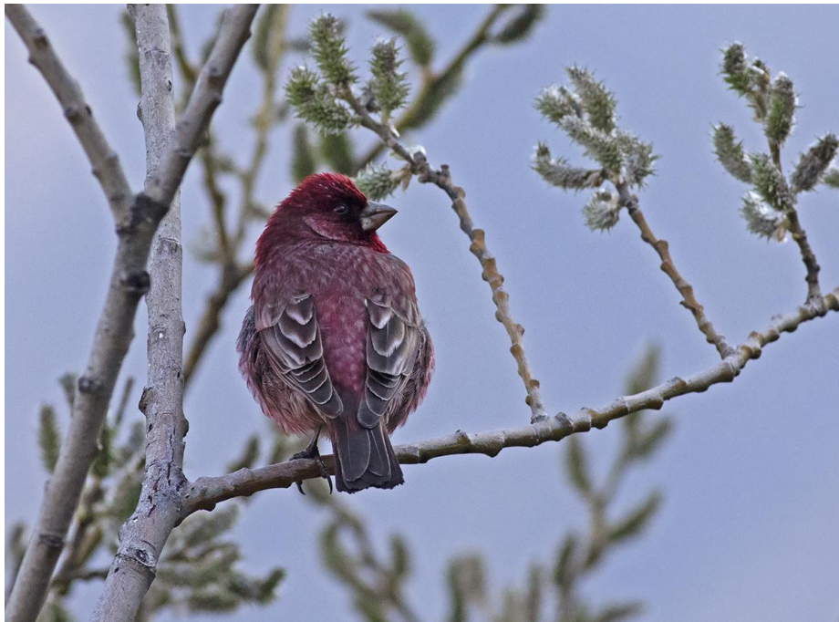
Dit mooie mannetje Grote Roodmus is wel een kers op de taart van deze dagen Kazbegi