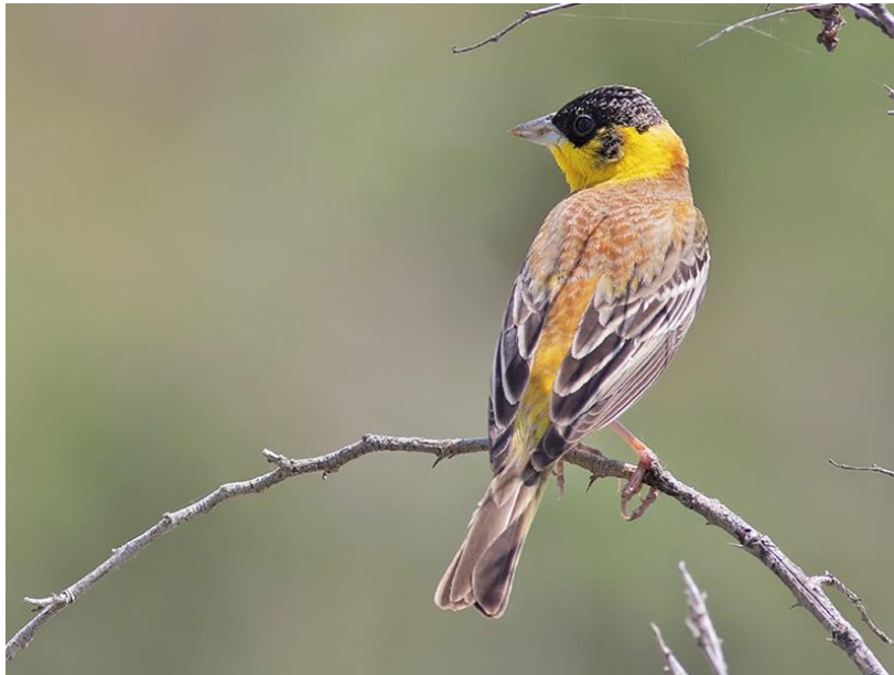
Hoewel ze algemeen zijn blijft het genieten van de Zwartkopgorzen