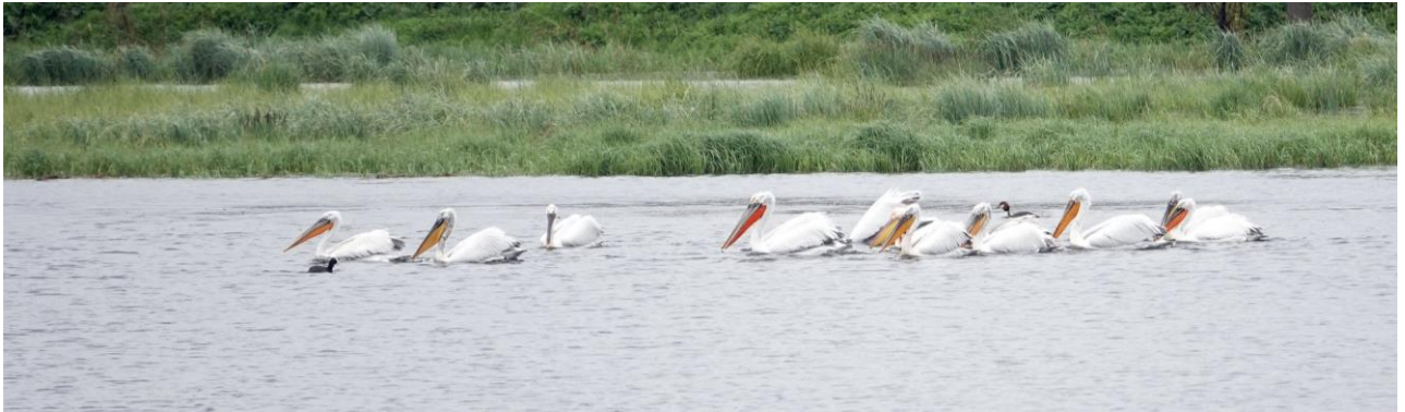
Op de steppemeren van Javakheti broeden Kroeskoppelikanen, hier een mooie grote groep met één Roze Pelikaan

en we zijn er niet weg te slaan, maar er zijn ook nog andere fraaie meertjes. Als we naar het Kartsakhi meer (op de grens met Turkije) rijden zien we vanuit de auto wat Grauwe Kiekendieven vliegen, als we stoppen om deze beter te bekijken zien we ook twee Velduilen! Een leuke en onverwachte waarneming. Boven het Kartsakhi meer vliegt een grote groep sterns, waaronder een enkele Witwangstern . Op het eiland (in Turkije) broeden grote aantallen pelikanen, we wagen ons er maar niet aan deze op die afstand te tellen. Bij de bus zit een fraai Paapje . Bij het Sulda reservaat eten we de meegenomen lunch terwijl we genieten van twee paartjes Kraanvogel , een roepende Roerdomp en een rondstruinende Vos . Vooral de Kraanvogels zijn erg bijzonder, er zitten er nog maar enkele op de meren hier. Helaas is dit ook de laatste plek waar we echt kunnen stoppen, we moeten vanavond in Tbilisi zijn en de weg is lang. Onderweg vliegen nog wat groepen pelikanen langs. Als we bijna bij Tbilisi zijn is er nog de mogelijkheid om even te stoppen. We horen een Turkse Boomklever maar het hoogtepunt hier is dat nu, op deze laatste dag, het eindelijk iedereen lukt om goed een Groene Fitis te zien. Beter laat dan nooit!