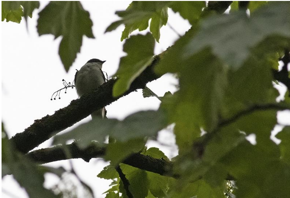
Balkanvliegenvangers laten zich meestal beter horen dan zien