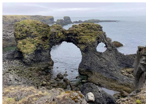
Kliffen bij Arnarstapi