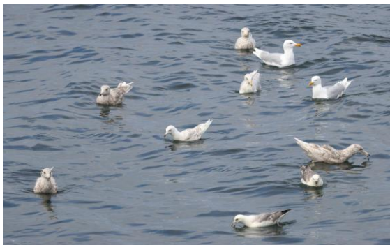
Kleine Burgemeester (in het midden)

Doorgereden naar Ólafsvík, waar we bij een rivier naast een visverwerkingsbedrijf de daar aanwezige meeuwen hebben bestudeerd. Naast de vele Grote Burgemeesters, zagen we ook een Kleine Burgemeester.