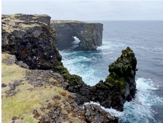
Kliffen bij Svörtuloft

Daarna zijn we door het Snaefellsjökull Nationaal Park naar de kliffen van Svörtuloft gereden, waar ook weer een zeevogelkolonie is. Bij de vuurtoren zagen we o.m. de Kortbekzeekoet, Zeekoeten, Alken, Noordse Stormvogels, Grote Burgemeester én Orka's.