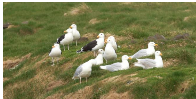
Grote Burgemeesters en -Mantelmeeuwen

Stroomopwaarts vonden we een groepje Harlekijneenden. Een Scholekster, die waarschijnlijk zijn nest dichtbij had, was niet zo blij met onze aanwezigheid en liet dit duidelijk horen.