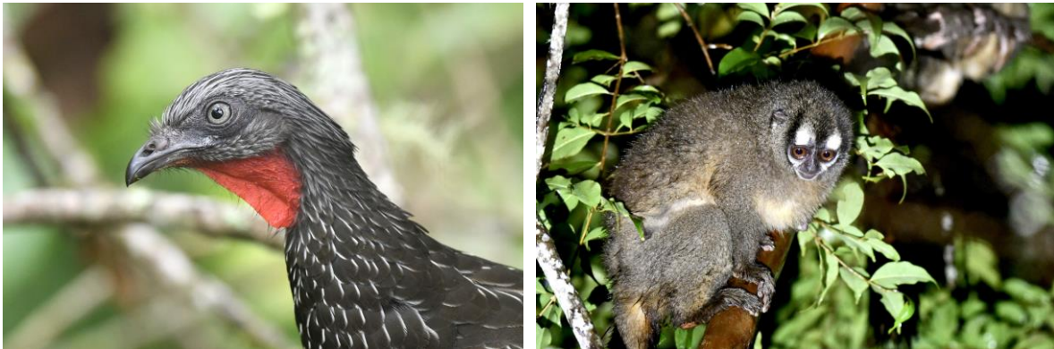
Band-tailed Guan en Night Monkey

Na het diner doen we een poging voor Santa Marta Screech Owl, maar we horen alleen een vogel roepen. De Night Monkeys werken wel goed mee, wat een schattige diertjes zijn dit!