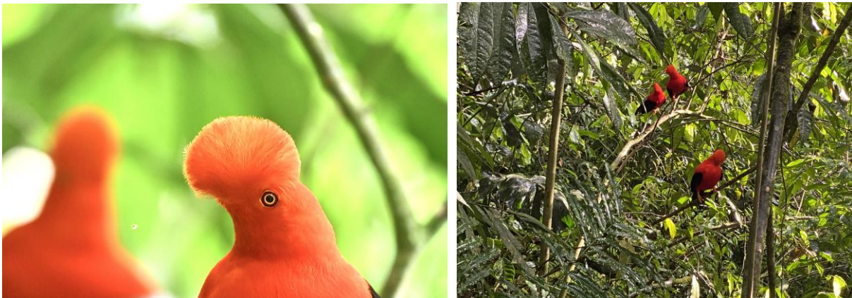
Andean Cock-of-the-rock. Jardin moet wel de beste plaats ter wereld zijn om deze schitterende vogels te zien!

We rijden vervolgens langzaam terug naar het prachtige Andesstadje Jardin waar we een late lunch hebben. De rest van de middag is voor een ander hoogtepunt hier: aan de rand van Jardin ligt dé beste baltsplaats voor Andean Cock-of-the-rock, misschien wel ter wereld. De vogels hier zijn niet alleen heel talrijk en zichtbaar, ze baltsen ook in de middag als het licht perfect is! Een uitgelezen gelegenheid dus voor fantastische waarnemingen en beeldvullende foto's. Als we bij het hek staan horen we de vogels al roepen en binnen enkele minuten zien we al een 10-tal fraaie mannetjes baltsen. Wat een bijzonder gave vogels! Maar we zien hier nog meer leuks met onder meer Colombian Chachalac en Crested Ant-Tanager. We sluiten de dag af in een gezellig restaurantje bij de prachtige 'plaza mayor' van Jardin, wat een heerlijke dag!