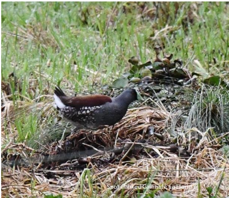
Spot-flanked Gallinule, La Florida

We vertrekken vandaag vroeg vanuit Bogota om op weg te gaan naar het vogelgebied La Florida. Dit park bevindt zich aan de randen van Bogota, en ook hier kunnen we Bogota Rail zien. We hebben het ontbijt weer mee en terwijl we aan onze yoghurtjes zitten zien we al Yellow-backed Oriole, wat een prachtige soort! We kunnen enkele vogels fraai in de telescoop zien. Bij La Florida zien we verder Spot-flanked Gallinule, Blauwvleugeltaling, Dikbekfuut, Masked Duck (zeldzaam) en opnieuw Bogota Rail. Bare-faced Ibises vliegen af en aan en de rietkragen worden soms versierd met prachtige Yellow-hooded Blackbirds. Dit is ook een goede plek voor overwinterende Amerikaanse zangvogels en we zien al snel Roodoogvireo, Swainsons Thrush, Northern Waterthrush, Yellow Warbler, Mourning Warbler en Blackburnian Warbler wat één van de algemeenste Amerikaanse overwinteraars is in de Colombiaanse Andes.