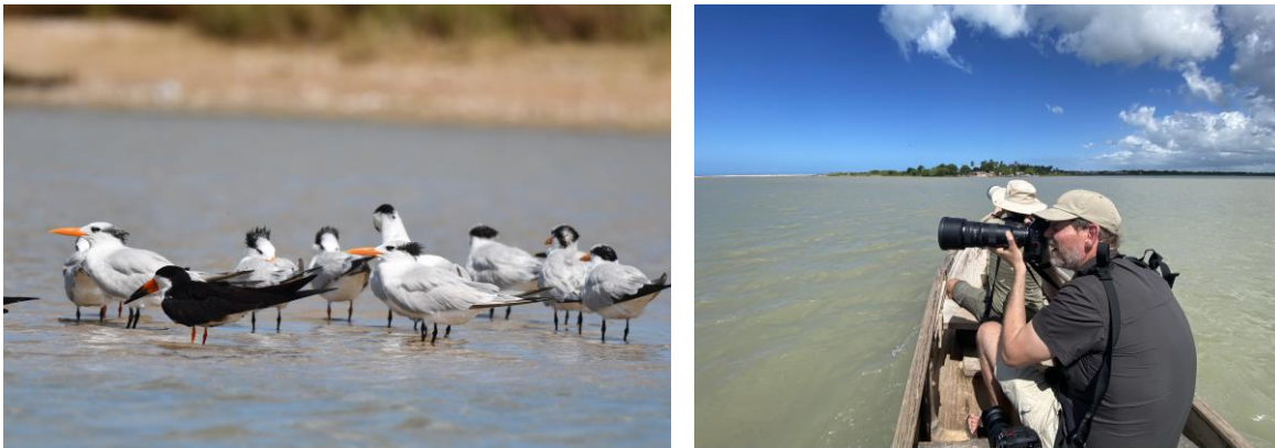
Royal Terns en Black Skimmer die we vanaf de boot fraai konden fotograferen

De Guajira Desert kent een totaal andere setting met cactussen, doornige struiken en zand. Vanwege de warmte proberen we op tijd op onze locatie te zijn en zo hebben we een heerlijk veldontbijt in de vroege ochtend. Tijdens het ontbijt zien we al snel soorten als Bare-eyed Pigeon, Grey Kingbird en Slender-billed Tyrannulet. Dan wandelen we het struikachtige gebied in waar we letterlijk de ene na de andere specialiteit zien: Vermillion Cardinal, Pearly-vented Tody-tyrant, Pale-tipped Tyrannulet en Orinocon Saltator. Een groepje Brown-throated Parakeets landt fraai bovenin een lage boom en even later kunnen we uitgebreid genieten van een Ferruginous Pygmy Owl. Dan lopen we wat meer de begroeiing in over smalle paadjes en zien we Tocuayo Sparrow, Chestnut Piculet, White-whiskered Spinetail, Grey Pileated Finch, Brown-crested en Northern Scrub Flycatcher. Twee Crested Bobwhites scharrelen door de begroeiing. Wat een ochtend! En we zijn nog maar 2 uur bezig! Misschien wel de bijzonderste soort van de ochtend zijn twee Grey-capped Cuckoo's die verstoppertje spelen en zich alleen kort aan de groep laten zien.