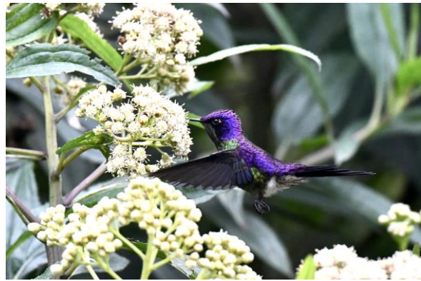
Crescent-faced Antpitta en mannetje Purple-backed Thornbill

De middag zoeken we het hogerop en gaan we naar de Termales del Ruiz waar je bij de warm waterbronnen nog wat hoogtesoorten kunt zien bij de feeders. Hoewel het wat nevelig is, zien we al snel Viridian Metaltail, Golden-breasted Puffleg en Great Sapphirewing. Ook andere soorten doen mee met Lacrimose en Scarlet-bellied Mountain-Tanager en Pale-naped Brushfinch. We wandelen vervolgens langs de weg en zien nog een paar goede soorten waaronder Black-thighed Puffleg en Rainbow-bearded Thornbill waarna er een einde komt aan een prachtige dag.