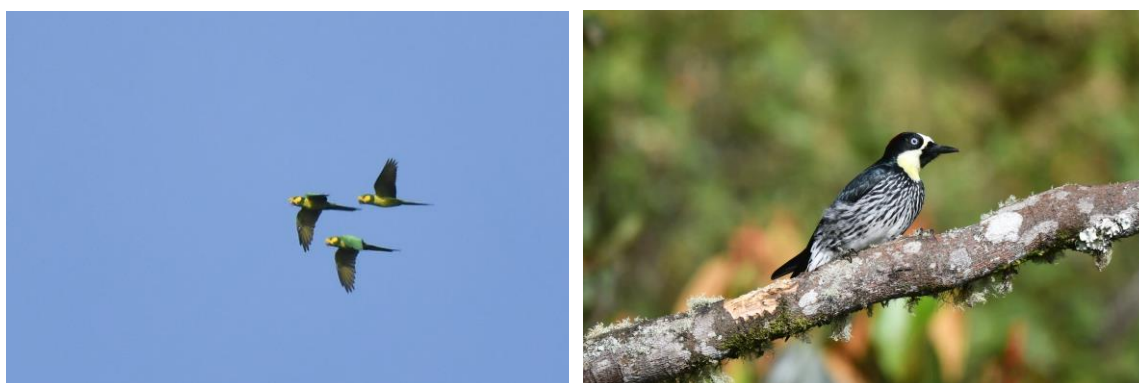
Yellow-eared Parrots en Acorn Woodpecker

Dan gaan we lopen naar een andere feeder, dieper in het bos, dé plek voor het zien van de lokale en endemische Chami Antpitta. Als we aankomen is de vogel al zichtbaar en als de gids de wormen pakt zit de vogel al op enkele meters, geweldig! We genieten van het bijzondere moment als de vogel bijna op de voeten van de deelnemers de wormen wegvangt. Op de terugweg zien we nog een tamme Green-and-black Fruiteater en langs de weg pakken we een mooie flock mee met Beryl-spangled, Saffron-crowned en Grey-hooded Tanager en White-tailed Tyrannulet. In het dal roepen White-capped Tanagers, maar de vogels blijven verborgen in het dichte bladerdak.