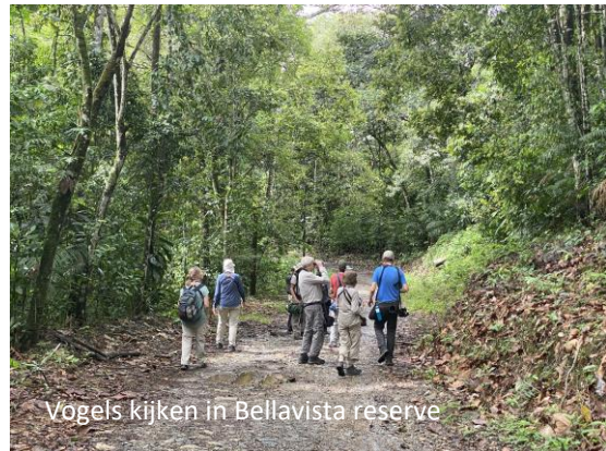
Vogels kijken in Bellavista reserve

Als we dichterbij de plek komen lijken we de vogel te horen, een geluid wat we de afgelopen dagen veel geprobeerd hebben en waar we inmiddels goed mee bekend zijn. En het is niet te geloven, maar het blijkt inderdaad van een Beautiful Woodpecker te komen! Al snel hebben we de vogel in beeld en kunnen we hem prachtig in de telescoop zien. Heerlijk! Een mooie einde van onze wandeling. We proberen nog een plek voor Magdalena Antbird, een andere soort die we misten bij Rio Claro, en deze werkte ook goed mee. Op dus naar Manizales waar we de komende dagen verblijven.