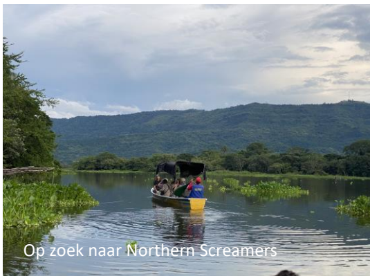
Op zoek naar Northern Screamers

We hebben nog een paar uur in de ochtend om te zoeken naar gemiste soorten voordat we vertrekken naar La Victoria, een andere plek in de Magdalena Valley waar de specialiteiten huizen. Maar eerst worden we gewekt door Spectacled Owl die we nu ook fraai kunnen zien vanaf ons dakterrass! Geweldig! De volgende doelsoort is Antiquia Bristle-tyrant die we gisteren hadden gemist, en ook deze - wat saai ogende – eendeem kon met enige moeite worden gezien in de boomkruinen. Andere soorten van de ochtend waren Tawny-crested Tanager, Yellow-throated Toucan en twee fraaie White-whiskered Puffbirds. Dan wordt het tijd om te ontbijten, spullen te pakken en te rijden naar de volgende plek. En die volgende plek is een verrassing. Onderweg naar La Victoria is namelijk een plek voor Northern Screamer die je vanaf een bootje kunt zien. Geen garanties maar er zitten ook andere soorten die zich vanaf een boot vaak goed laten bekijken. We komen er in de middag aan en de bootmannen staan al klaar om ons al peddelend in twee bootjes te vervoeren. Maar eerst scannen we het moerasgebied vanaf de kant af. We zien Yellow-chinned Spinetail en Black-capped Donacobius en een Russet-throated Puffbird blijkt vlak boven ons in de boom te zitten. Tijdens de boottocht zien we Spot-breasted Woodpecker, Purple Gallinule, Least Bittern en 4 soorten ijsvogels (Ringed, Amazon, Green en American Pygmy). In de waterlelies zitten Pied Water Tyrants.