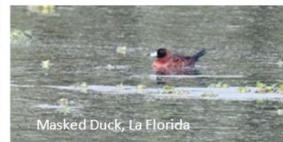
Masked Duck, La Florida