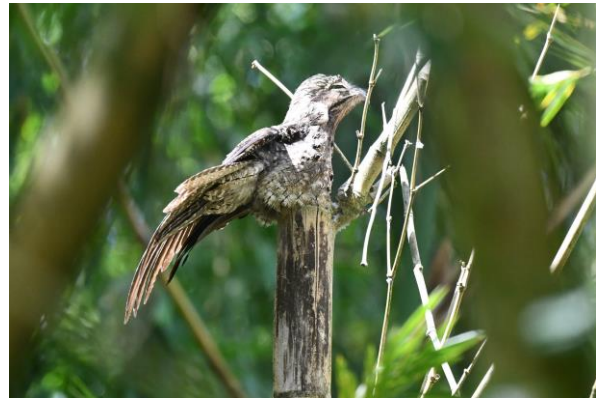
Moustached Puffbird en Common Potoo