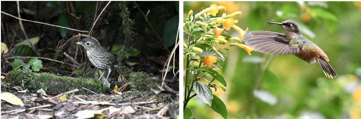
Sta Marta Antpitta en Sta Marta Blossomcrown, twee van de meer dan 20 endemen van dit berggebied

allemaal nog voordat we de koffers uit de auto hadden! De lodge zelf is prachtig gelegen midden in het weelderige regenwoud hier, en de temperatuur is zonder meer aangenaam te noemen.