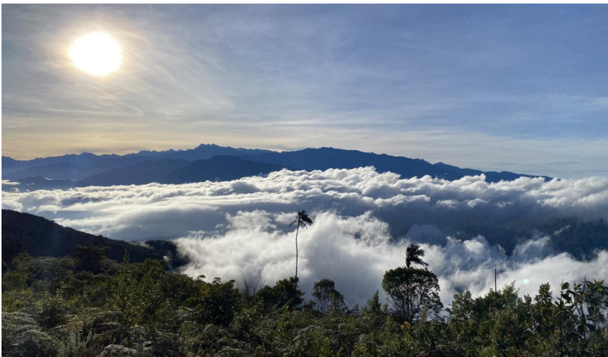
Uitzicht vanaf het hoge deel van de Sta Marta mountains

Vandaag vertrekken we vroeg om met het eerste licht op het hoogste punt te zijn voor de beste kans op de bedreigde Santa Marta Parakeet. Als we boven zijn is het wat winderig en best fris, maar wat een geweldig mooi uitzicht! De activiteit is nog niet zo groot maar we zien toch al enkele hoogte specialiteiten zoals Santa Marta Warbler en Streak-capped Spinetail. We wandelen verder omhoog en zien dan gelukkig enkele Santa Marta Parakeets vliegen. Het lijkt wel elk jaar moeilijker te worden om de soort te zien te krijgen. Vervolgens doen we een geslaagde poging voor Hermit Woodwren, leuk! Hier zien we ook Santa Marta Mountain Tanager.