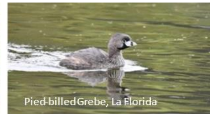
Pied-billed Grebe, La Florida