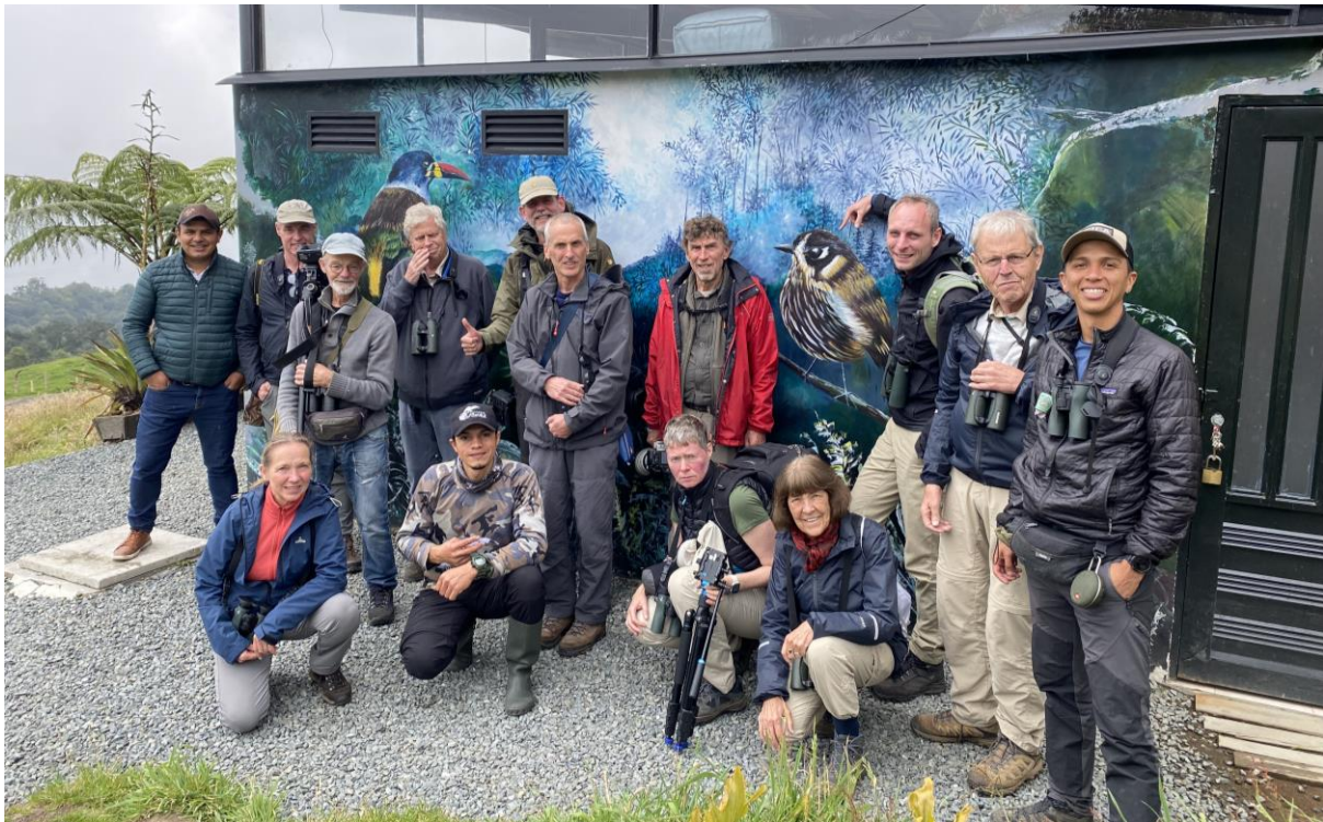
De groep bij Hacienda el Bosque in de Andes bij Manizales, Colombia