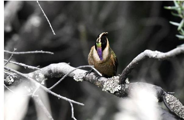
Buffy Helmetcrest, een spectaculaire kolibrie die boven de 4000m voorkomt

Na al dit moois rijden we weer terug naar ons hotel voor de lunch en zien we het Nederlands elftal zowaar twee keer scoren tegen Senegal tijdens de WK wedstrijd in Qatar! Daarna rijden we naar de Montezuma Road in de zogenaamde Chocó regio, het natste gebied van Colombia, en de plek met vele endemen. In het begin van de avond komen we aan in de lodge hier. Benieuwd wat de komende dagen gaan brengen hier.