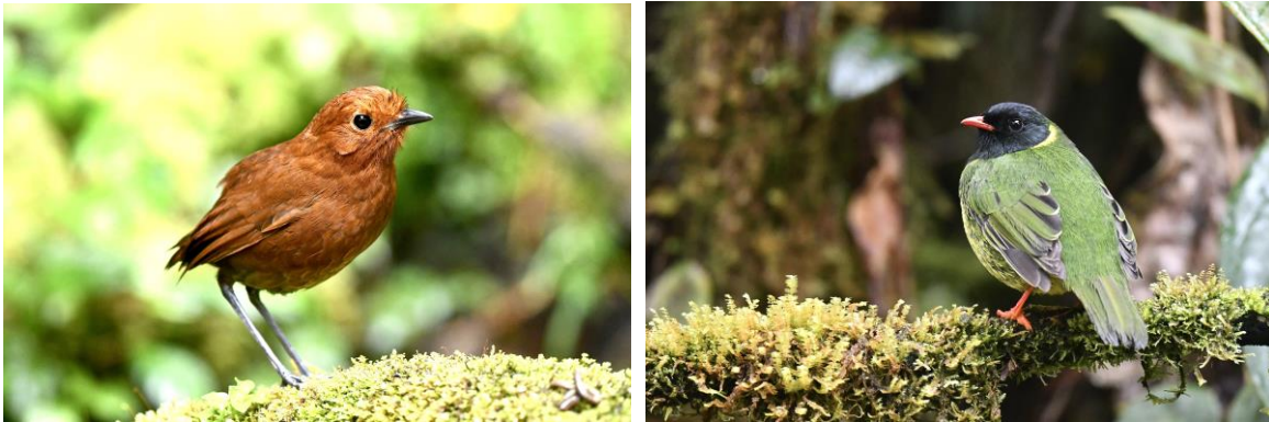
Chami Antpitta en Green-and-black Fruiteater

We rijden vervolgens langzaam terug naar het prachtige Andesstadje Jardin waar we een late lunch hebben. De rest van de middag is voor een ander hoogtepunt hier: aan de rand van Jardin ligt dé beste baltsplaats voor Andean Cock-of-the-rock, misschien wel ter wereld. De vogels hier zijn niet alleen heel talrijk en zichtbaar, ze baltsen ook in de middag als het licht perfect is! Een uitgelezen gelegenheid dus voor fantastische waarnemingen en beeldvullende foto's. Als we bij het hek staan horen we de vogels al roepen en binnen enkele minuten zien we al een 10-tal fraaie mannetjes baltsen. Wat een bijzonder gave vogels! Maar we zien hier nog meer leuks met onder meer Colombian Chachalac en Crested Ant-Tanager. We sluiten de dag af in een gezellig restaurantje bij de prachtige 'plaza mayor' van Jardin, wat een heerlijke dag!