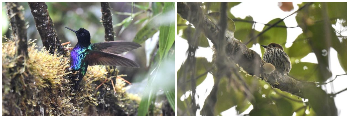
Velvet-purple Coronet en Lanceolated Monklet