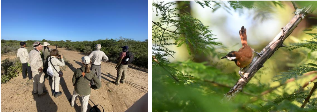
Vogels kijken in de Guajira Desert met oa White-whiskered Spinetail