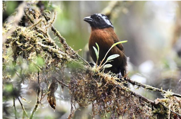
Northern Tamandua (Noordelijke Boommiereneter) en Tanager Finch

Dan begint het te regenen en dat blijft het een tijd doen, het is tenslotte de meeste vochtige plek van Colombia. Vanuit een droge uitzichttoren konden we ons echter prima vermaken met Violet-tailed Sylphs en Velvet-purple Coronets.