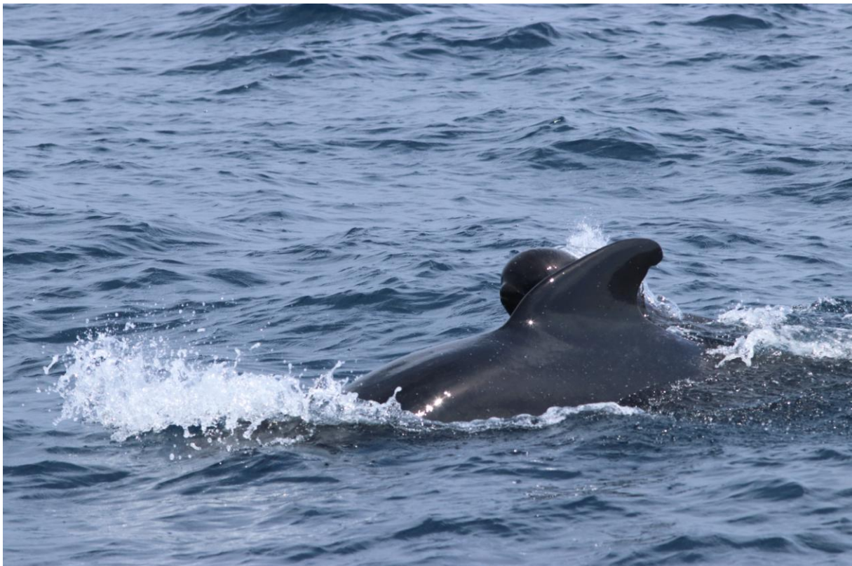
Griend, moeder met kalf