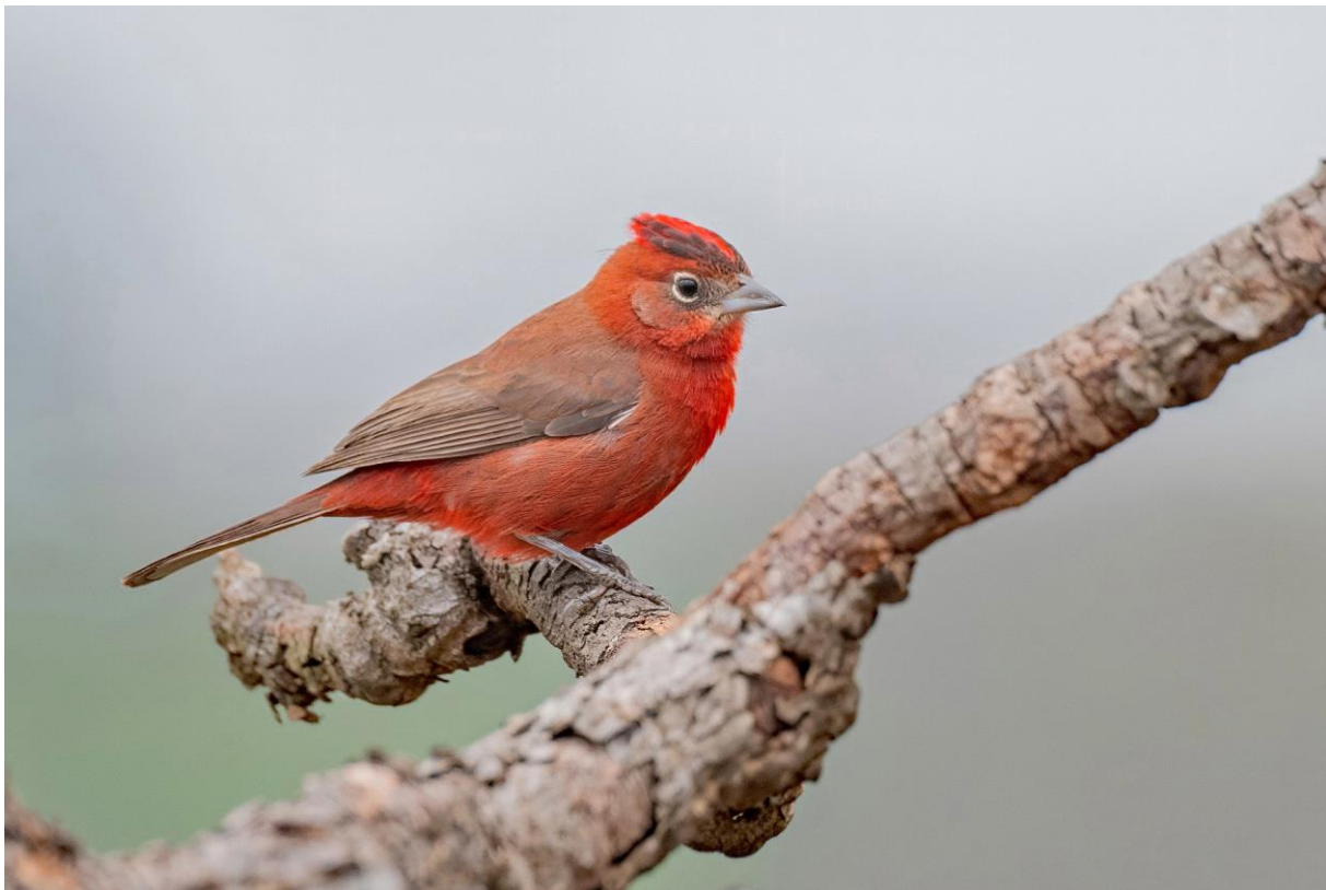
Red-crested Finch, foto: Rob Nagtegaal

Net voor de lodge stoppen we in de regen nog even voor een lokale soort – de Red-cowled Cardinal, welke zich mooi, maar nat, laat zien.