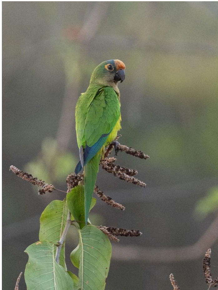
Peach-fronted Parakeet