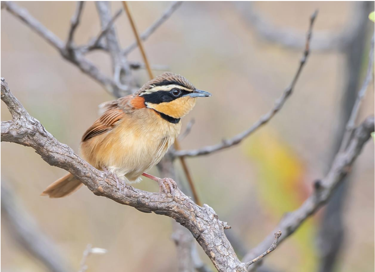
Collared Crescent-Chest

Chapada, Pantanal & Atlantisch Regenwoud 23 augustus – 7 september 2023