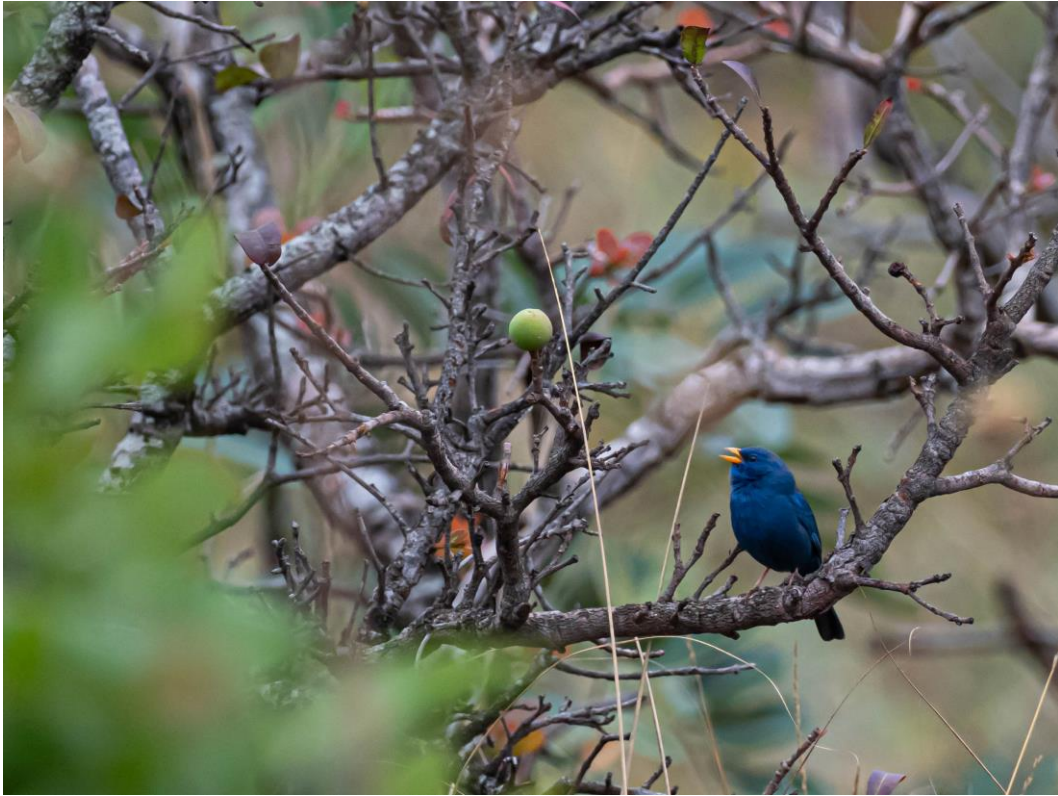
Blue Finch