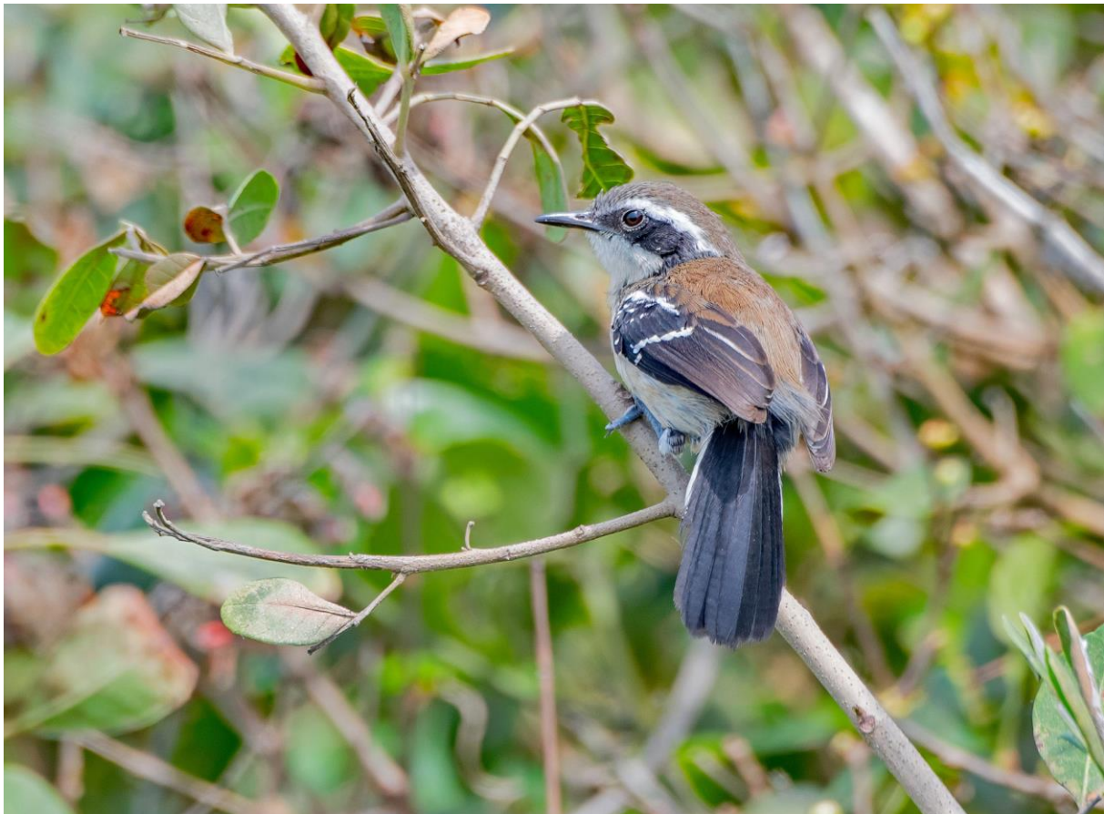
Restinga Antwren

In de namiddag wandelen we op het begin van de Waldenoor Trail, waar na wat tapen onze eerste target snel binnen is: Frilled Coquette! Wat hogerop het pad vinden we een fruitboom, die na wat tapen van een Pygmy-Owl al snel eruit ziet als een kerstboom: onder de vele vogels in de boom ook Chestnut-bellied Euphonia! Enkele groepen gierzwaluwen lijken naar hun slaappleats te vliegen en we zien ook Sooty Swift en een tweetaal van de schaarse White-thighed Swallow. Bij terugkeer naar de auto weten we nog enkele White-shouldered Fire-eyes van de helling naar ons toe te lokken.