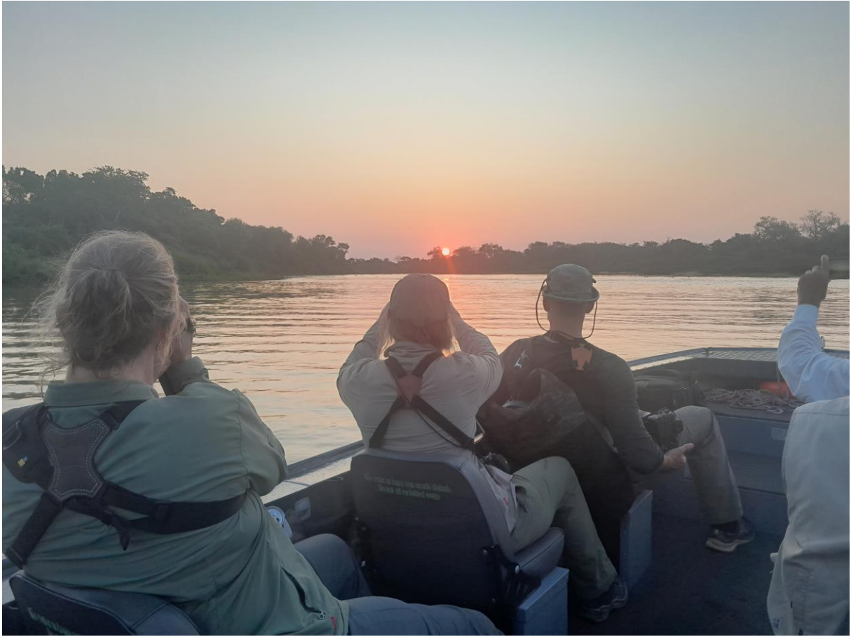
Cuiabá Rivier, foto: Paul van Els