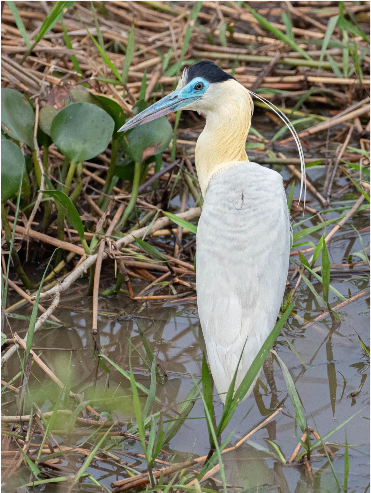
Capped Heron