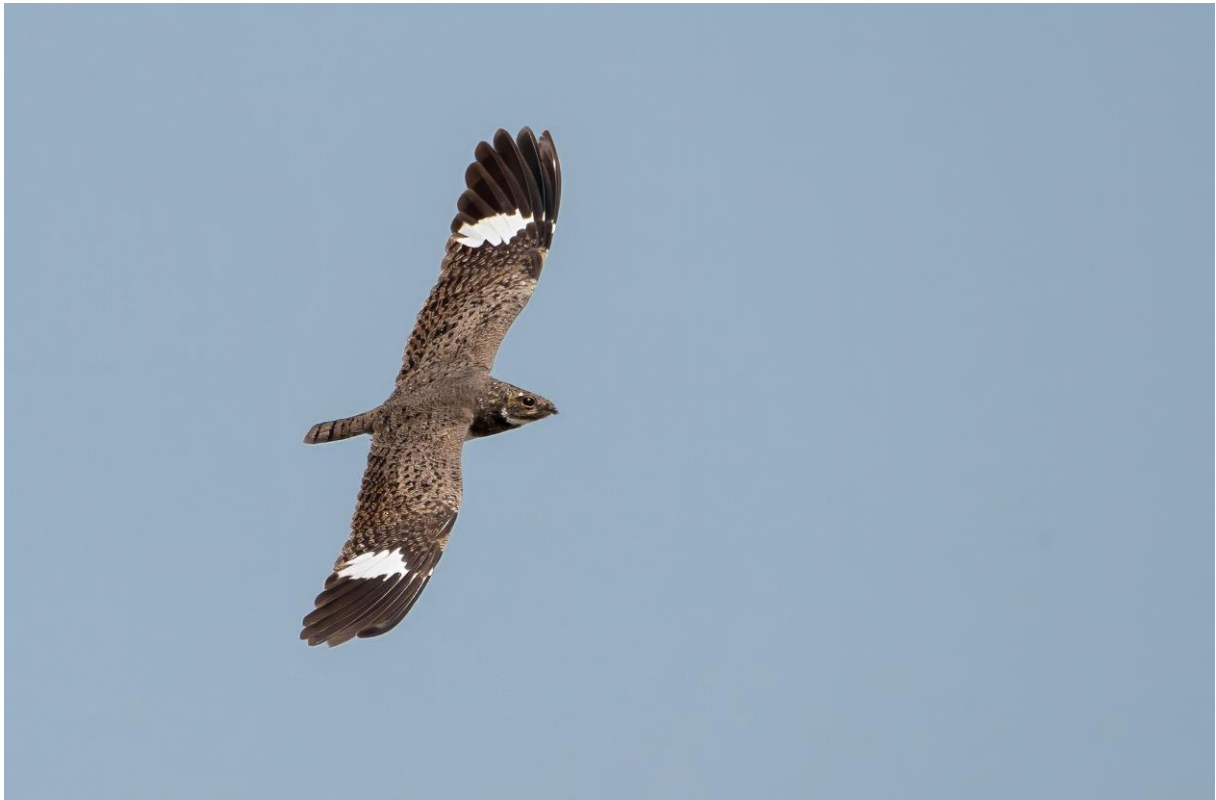
Nacunda Nighthawk