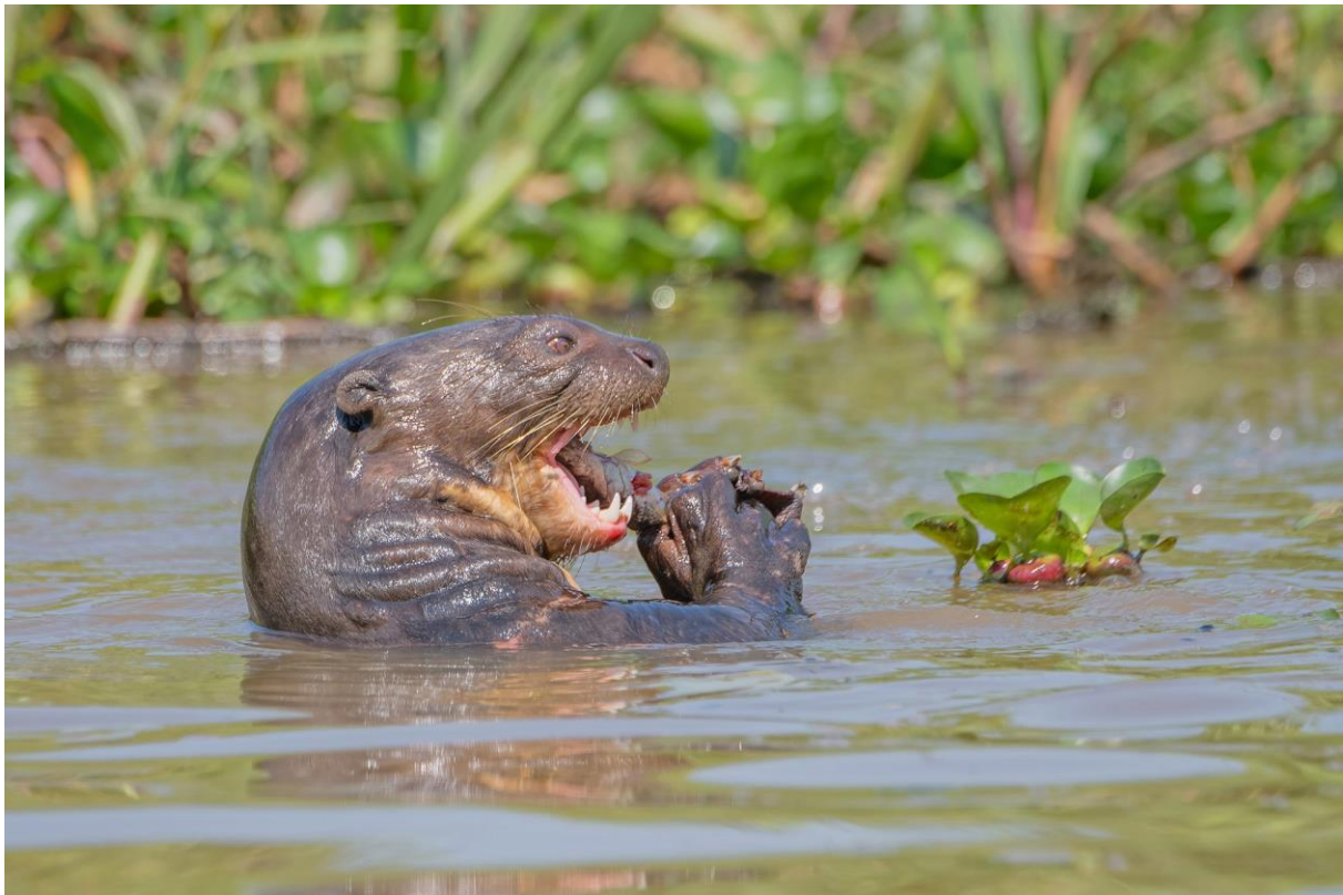
Giant Otter

In de middag varen we met onze boot de Jaguar de rivier de Cuiabá stroomafwaarts naar onze ligplaats voor de komende dagen. Onderweg zien we al Black Skimmers, Pied Lapwings en Collared Plover. In de namiddag hebben we bovendien onverwacht snel onze eerste Jaguar te pakken, een volwassen individu dat we eerst opmerken doordat de grassen langs de rivier heen en weer deinen; even later loopt het indrukwekkende beest omringd door alarmerende Yellow-billed Terns over een strandje langs de rivier.