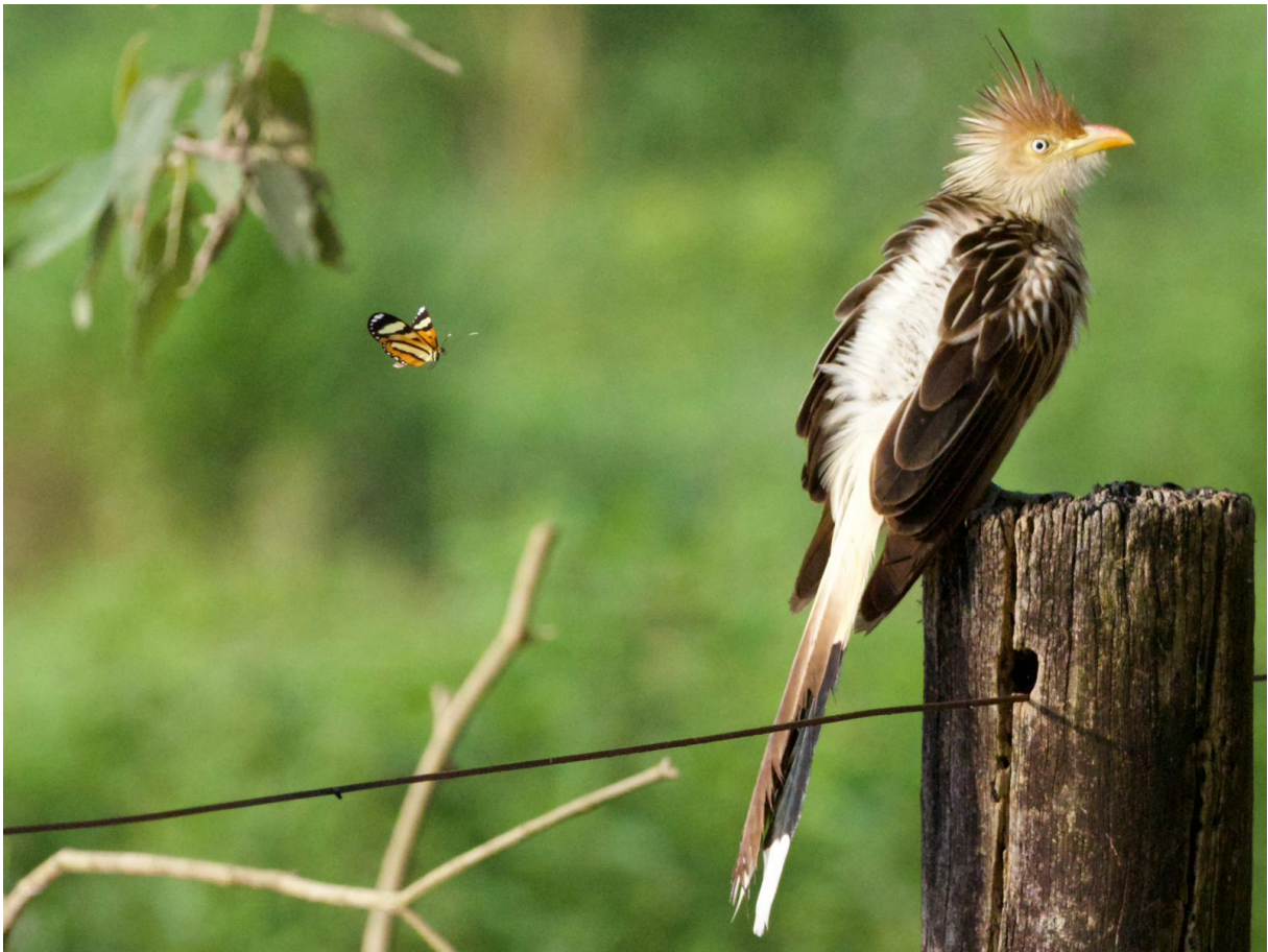
Guira Cuckoo