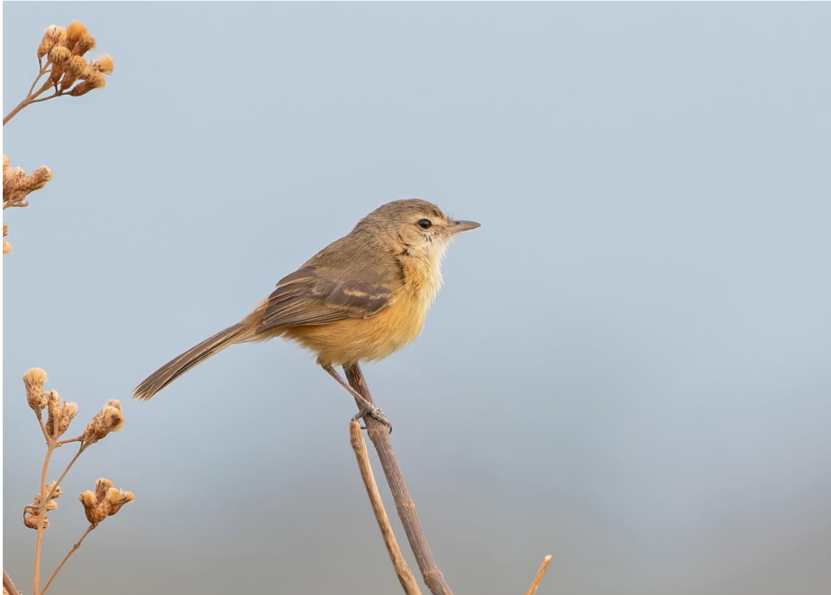
Rufous-sided Scrub-Tyrant

In de namiddag rijden we een flink stuk weg, dwars door enorme velden, waar eerder in het seizoen katoen op heeft gegroeid. We komen uit bij een ranch, waar een andere vogelgroep onze doelsoort al voor ons heeft gelokaliseerd; het is één van de weinige gebieden waar Yellow-faced Parrot voorkomt en we zien al snel enkele individuen in de telescoop. Het wordt langzaam donker en we zien bij een mooie ondergaande zon ook nog een paartje Red-legged Seriemas over het veld rennen. Een mooi einde van een mooie dag!