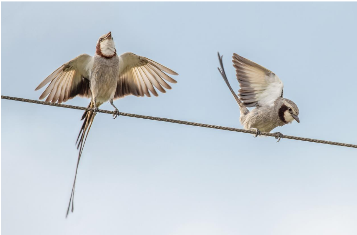
Streamer-tailed Tyrant, foto: Rob Nagtegaal

In de avond zien we met gemak Tawny-browed Owl en met heel wat meer moeite (en op een uitdagend bergpaadje) Black-capped Screech-Owl!