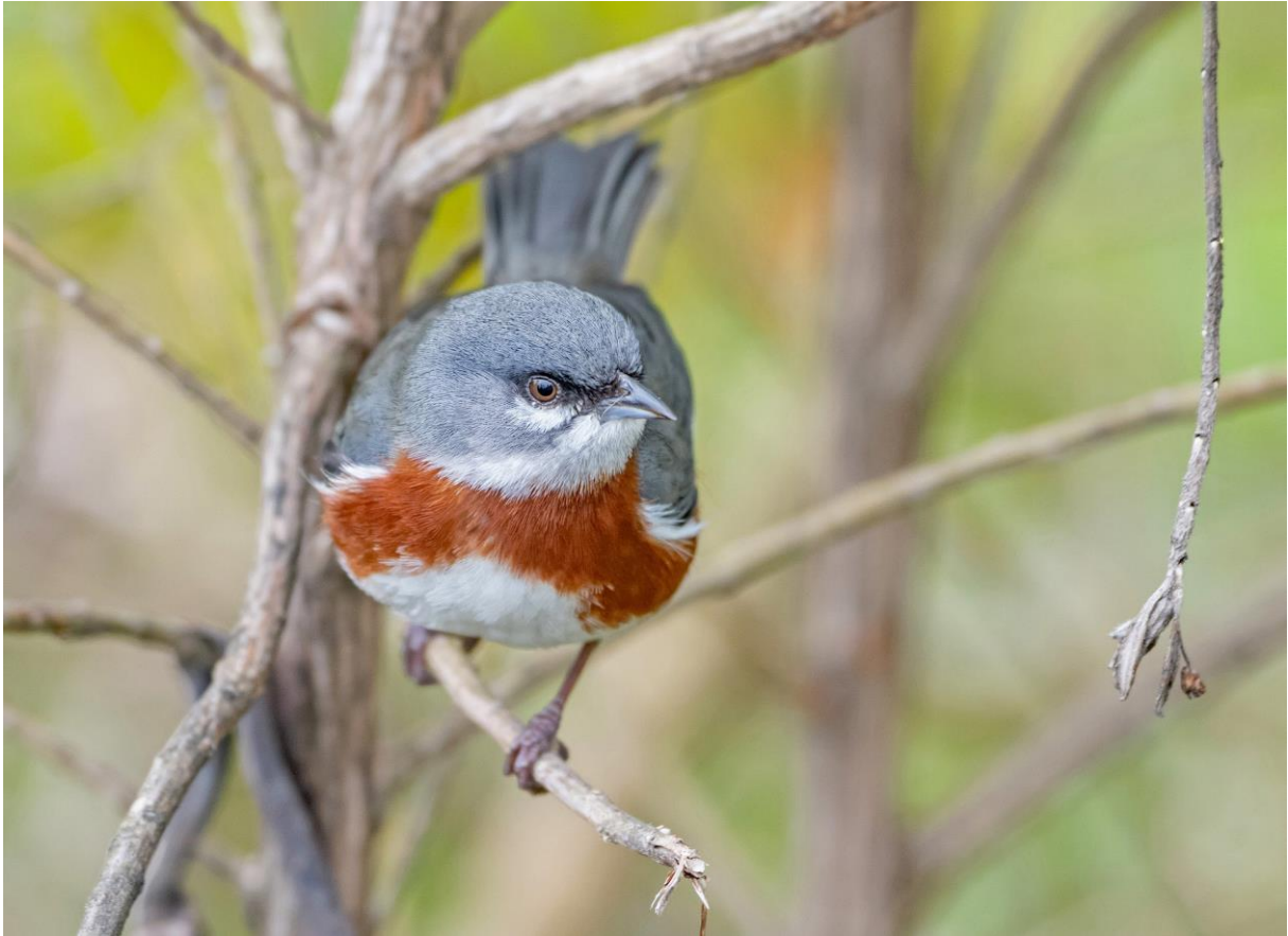
Bay-chested Warbling-Finch