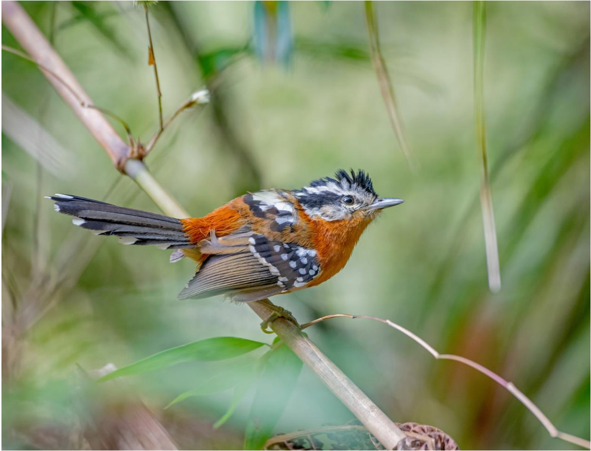
Bertoni's Antbird