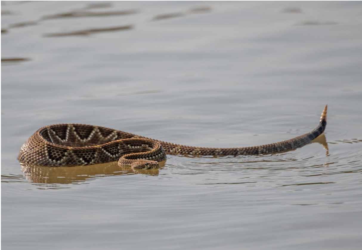
Tropical Rattlesnake, foto: Rob Nagtegaal

met beter ontwikkeld bos. Dit is ook te zien aan de lijst soorten die bij de lodge voorkomen. Al snel zien we Olivaceous en Straight-billed Woodcreepers. Bij een opdrogende poeltje zien we Gray-headed Tanager en Saffron-billed Sparrow.