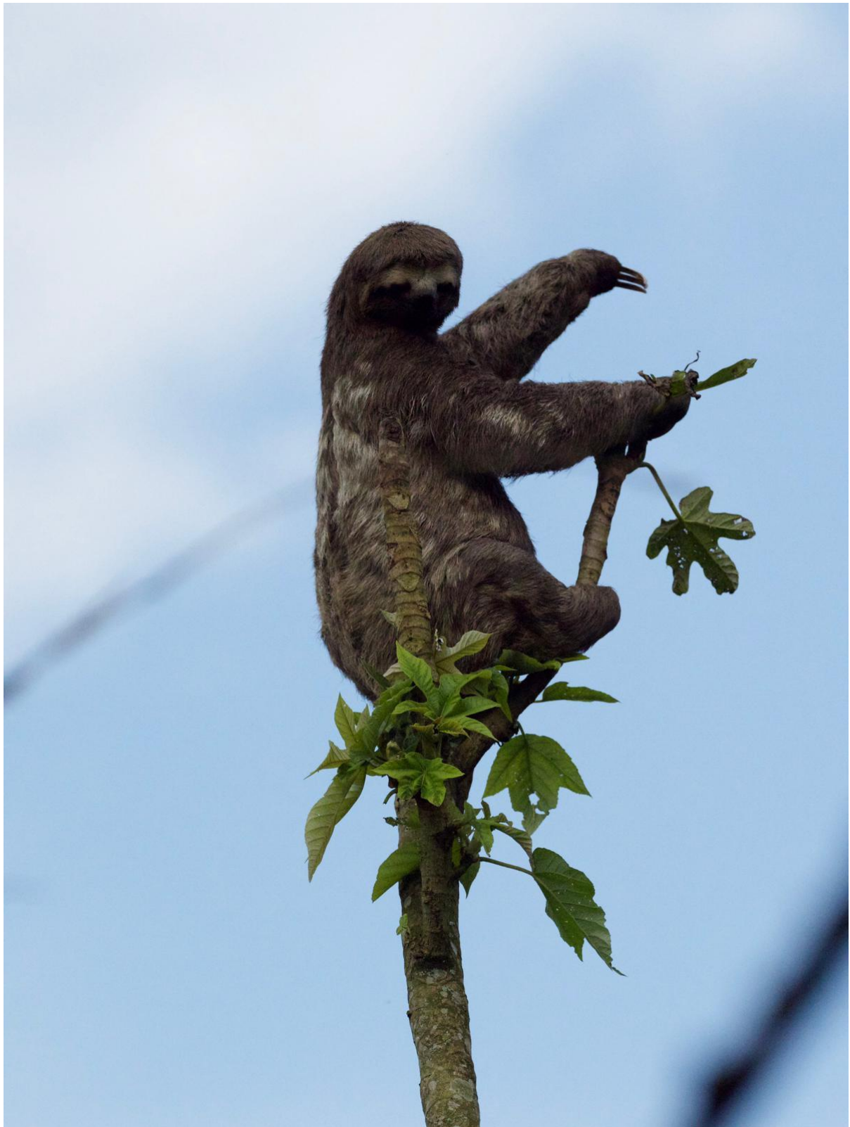
Brown-throated Sloth