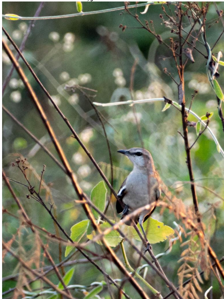
White-banded Mockingbird