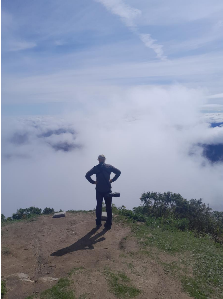
Pico Caledonia, foto: Paul van Els