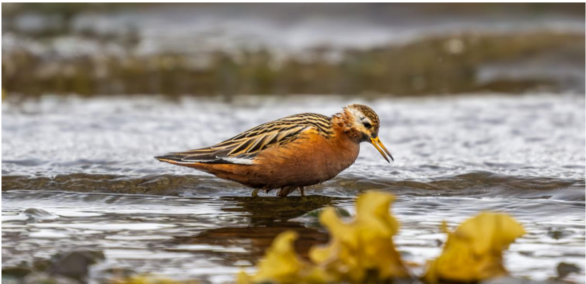
Rosse franjepoot