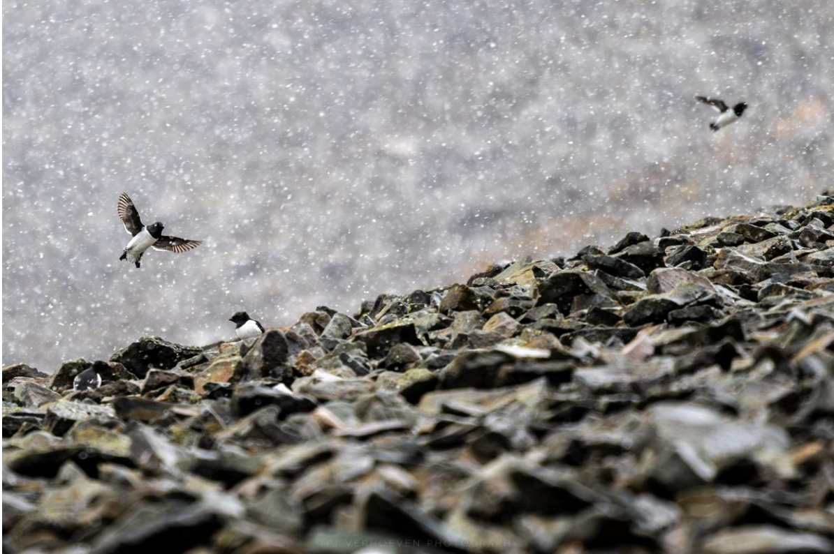
Kleine alken

Tijdens het avondeten worden leuke verhalen afgewisseld met het tonen van de mooiste foto's van de dag. Hoewel Longyearbyen niet groot is, zijn er tal van cafe's en restaurantjes waar je prima kunt eten. We zullen de meeste deze week wel bezoeken 😊.