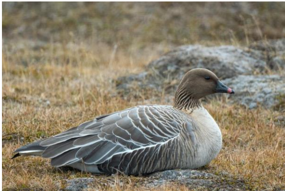
Kleine rietgans