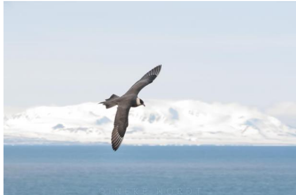
Kleine jager