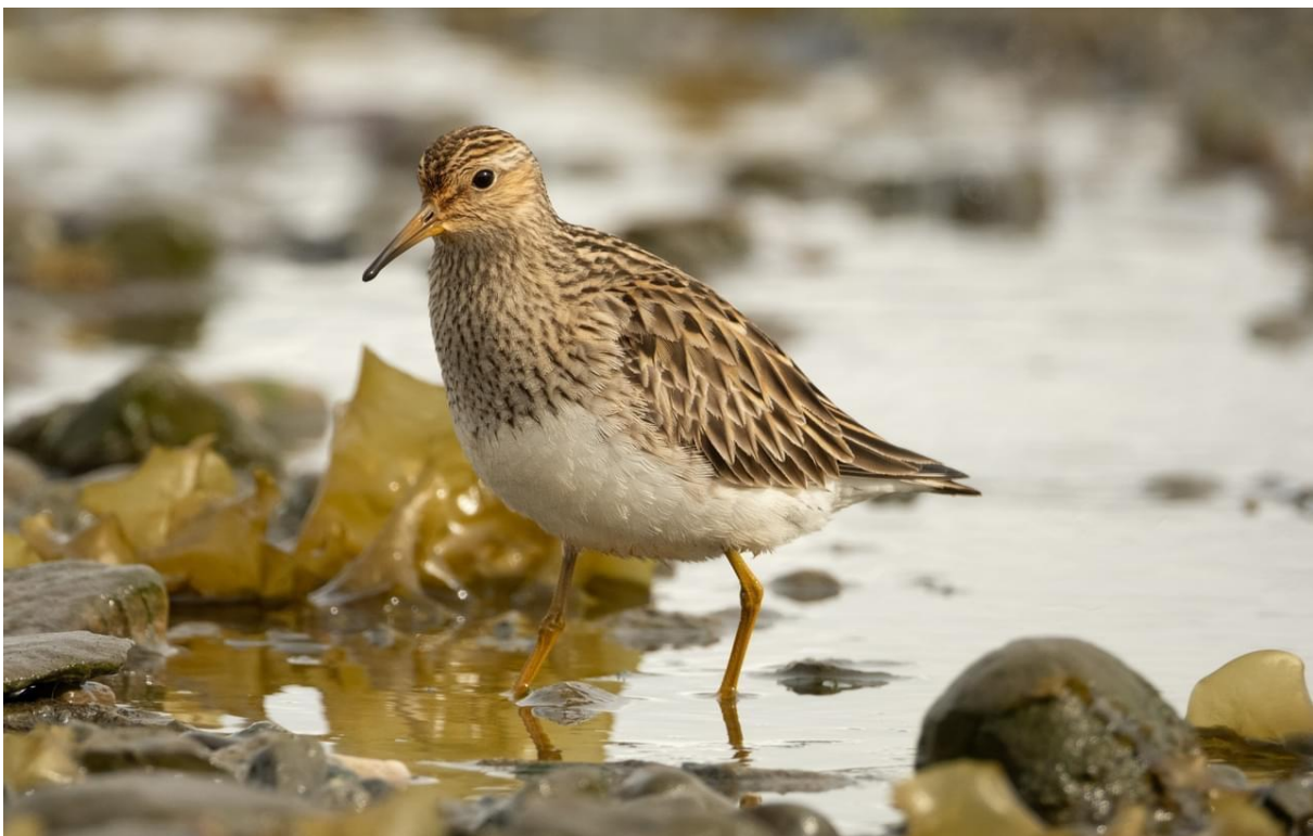
gestreepte strandloper

Bij de plek van de kleine alkenkolonie zien we ook twee poolvossen, waarvan er eentje een gps zender draagt.