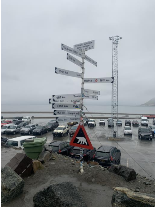
Aankomst om 01:00 op Spitsbergen