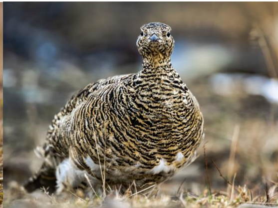
en vrouw