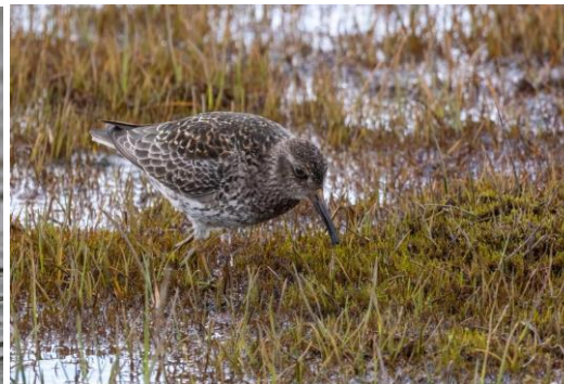
paarse strandloper

's Middags gaan we op zoek naar de kleine alk. Maar eerst maken we een stop in de haven waar we een fraaie zwarte zeekoet van dichtbij kunnen zien foerageren. Prachtig hoe de vogel in en rondom de steentjes op zoek is naar voedsel. Hoewel de vogel erg dichtbij is, stoort hij zich niet aan ons. We kunnen gewoon blijven zitten terwijl de vogel meerdere keren voorbij komt zwemmen. Daarna gaan we door naar de kleine alken. Deze bij ons zeldzame wintergast is op Spitsbergen de meest algemene broedvogel. Buiten de broedkolonies zijn ze vaak lastig te zien, maar als je in de buurt van zo'n kolonie komt vliegen er vaak honderden over. En als je eenmaal het geluid van deze soort hebt gehoord vergeet je het nooit meer. Bij de kolonie is het belangrijk niets te verstoren: de alken broeden net onder losliggende stenen op de helling. Oppassen om daar niet tussen te komen!