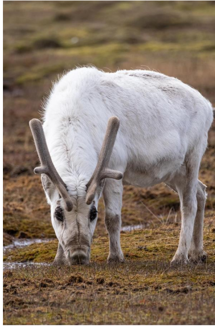
Spitsbergen rendier