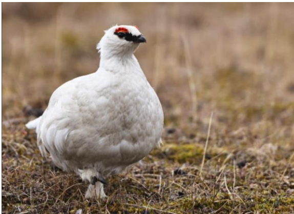
Spitsbergen sneeuwhoen man

We kiezen voor een rustige avond en zien 's avonds voor het slapen gaan nog twee sneeuwhoenders voor de ramen voorbij lopen; ook zij moeten er aan geloven en gaan op de foto. Een voordeel dat het hier 24 uur licht is.