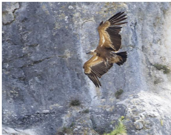
Vale Gier in Foz de Lumbier