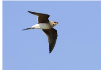
Kwak, Dwergstern en Vorkstaartplevier in de zuidelijke Ebro-delta