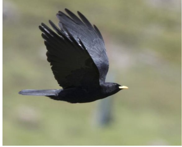
De deelnemers en Alpenkauw bij Candanchu