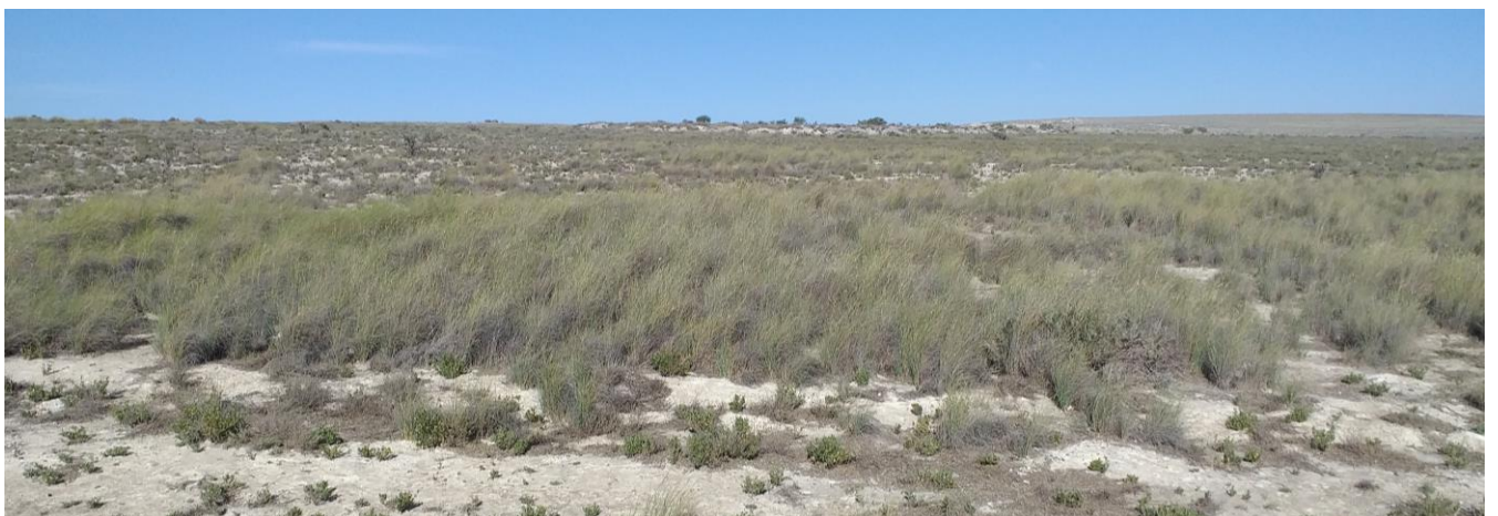
El Planeron, Monegros