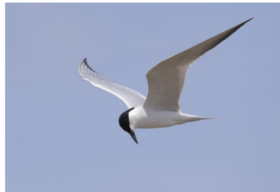
Europese Flamingo's en Lachstern in de noordelijke Ebro-delta