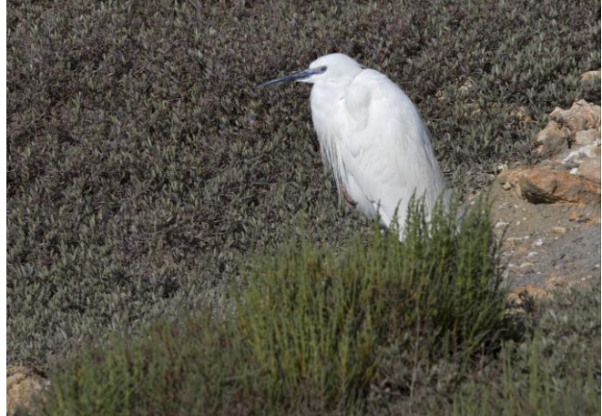
Steltkluut en Kleine Zilverreiger in de zuidelijke Ebro-delta

Na de lunch genuttigd te hebben rijden we richting de oostpunt van de delta. Langs een vertakking van de Ebro ligt een strook waar Buidelmezen zich zouden moeten ophouden. Ondanks een tijd te hebben geluisterd en de strook te zijn afgelopen blijft de soort voor ons verborgen. Aan het eind van de aftakking beklimmen we de uitkijktoren. De toren kijkt uit over het natte en het drogere deel van het natuurgebied en richting strand en zee.