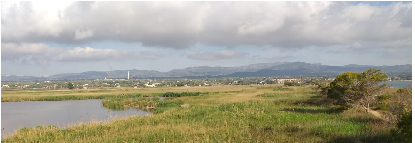
Bassa de les Olles, Ebro delta