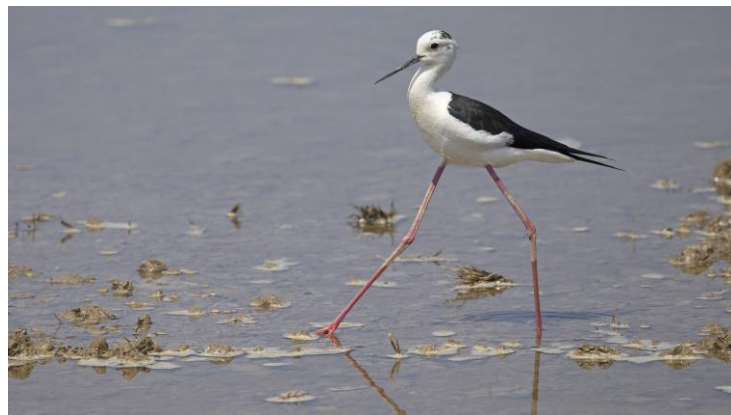
Dunbekmeeuw en Steltkluit in de noordelijke Ebro-delta

De volgende stop biedt uitzicht op de monding van de lagune waar natuurlijk de Flamingo's niet mogen ontbreken. Hier en daar zijn er slikranden en liggen er slikplaten. Diverse steltlopers, ongetwijfeld energie opslaand voor de reis verder noordwaarts, worden ontdekt waaronder Krombekstrandlopers, Drieteenstrandlopers, Zilverplevieren en Steenloper. De eerste Dunbekmeeuw vliegt langs en achter ons zijn twee Iberische Kwikstaarten druk met elkaar bezig. Langs het water van de lagune verder rijdend pikken we er nog meer soorten uit als Rosse Grutto, Wulp en Ralreiger.