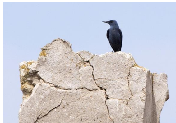
Kalendarleeuwerik, Bijeneter en Europese Kanarie in de Monegros en de Blauwe Rotslijster van Belchite

We keren terug naar Belchite en maken een wandeling langs de rand van het dorp waar nog restanten van gebouwen staan die tijdens de Spaanse Burgeroorlog werden beschadigd. In de verte doet een Dwergarend zijn verkenningsrondje en dichterbij zijn een paar Hoppen druk in de weer met elkaar. Verrassend is een man Blauwe Rotslijster die zich hoog in de overgebleven kerktoren laat zien.