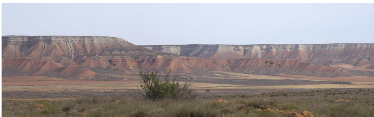
Paapje, Kalanderleeuwerik en een stukje Monegros