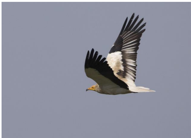
Aagier bij Foz de Binies

We vervolgen onze route naar onze eerst kloof. Voordat we Foz de Binies inrijden wordt onze aandacht getrokken door een roofvogel hoog in de lucht. Het blijkt een (lichte vorm) Dwergarend te zijn even later bijgestaan door een tweede individu. Vanaf het bruggetje waar we staan pakken we onder andere Oeverloper, IJsvogel en Cetti's Zanger mee. Vale Gieren zien we langzaam de lucht in komen. In de kloof kijken we naar wat Vale Gieren in de rotswanden en een enkele die vlakbij voorbij komt vliegen. Dan wordt hoog op de kloofrand een Blauwe Rotslijster ontdekt. Ondanks de afstand is iedereen daar uiterst content mee. Nadat we zijn weg gereden zien we een adulte Aagier die over de weg vliegt en even landt bij een boerenschuur. Zowel zittend als vliend kan hij schitterend bekeken worden.