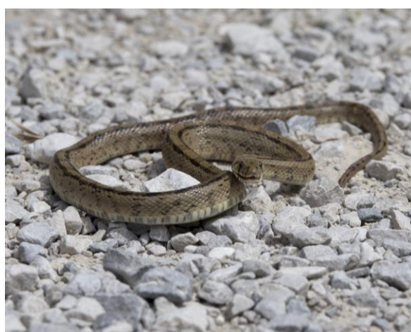
Laddertrapslang in Foz de Lumbier

Voor we bij Foz de Lumbier aankomen rijden we langs het grote stuwmeer Embalse de Yesa. De lijst wordt aangevuld met een paar soorten die je niet zo snel in het berglandschap aan denkt te treffen; Aalscholver, Fuut en Wilde Eend. Maar de Slangenarend die aan komt vliegen trekt toch meer de aandacht.