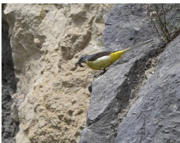
Grote Gele Kwikstaart in Foz de Lumbier