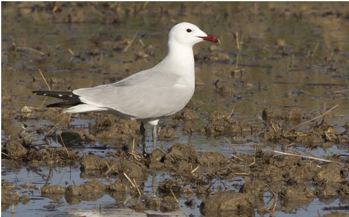
Audouins Meeuw nabij L'Eucaliptus

Het deel ten zuiden van de Ebro is het doel van deze dag. Ook hier zijn rijstvelden maar het aandeel natuurlijker biotopen is wat groter.