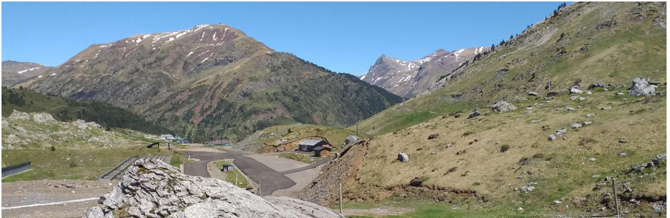
Pyreneeën bij Candanchu