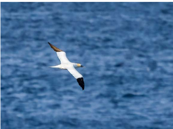
Jan van Gent