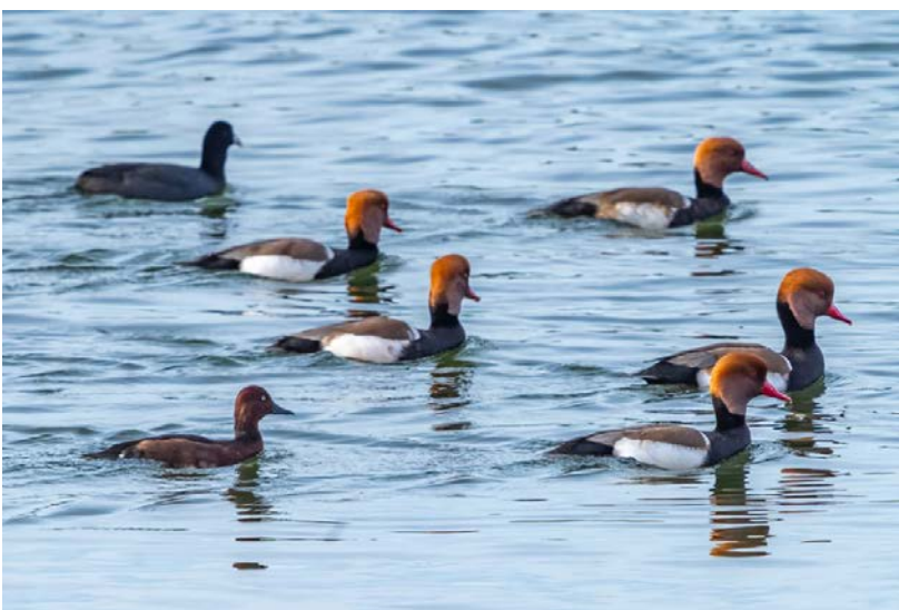
Krooneenen en een witoogeend

We vervolgen onze weg langs de zoutpannen in de omgeving van vliegveld Faro. De Flamingo's staan daar mooi te wezen. Aan het eind van het lange pad valt de schemering al in en zien we nog wat vleermuizen vliegen. Fokko haalt ons op met het busje, het was een prachtige dag met heel veel vogelsoorten en mooie waarnemingen.