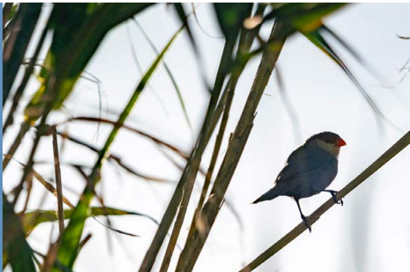
Sinthelenafazantje lijkt niet op een fazant