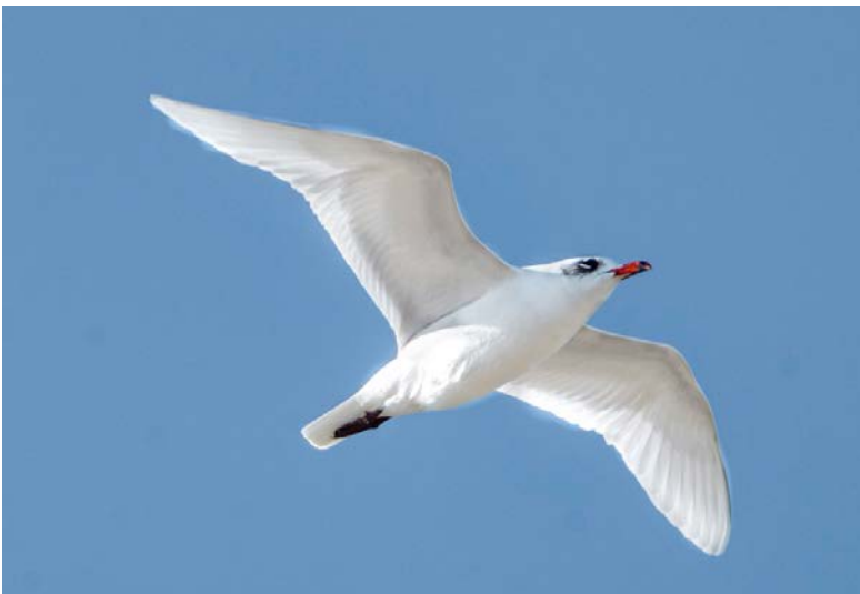
Volwassen zwartkopmeeuw (winterkleed)

We zien de 1 e van heel veel roodborstapuiten, tjiftjaffen en Iberische tjiftjaf en sluiten de dag af met een hele groep flamingo's, waaronder een paar Audouins meeuwen Om 17.00 uur zijn we weer terug in het hotel, als het buiten al donker begint te worden. Het was een hele mooie en zonnige 2 e dag. Hopelijk volgen er meer!