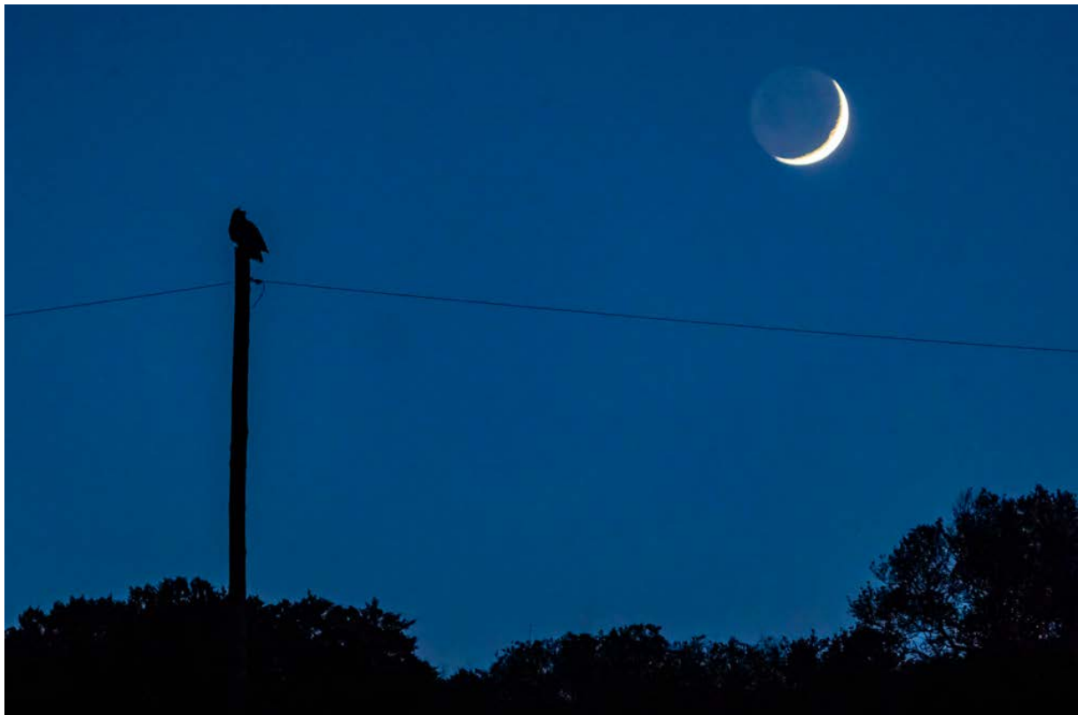
Oehoe bij maanlicht