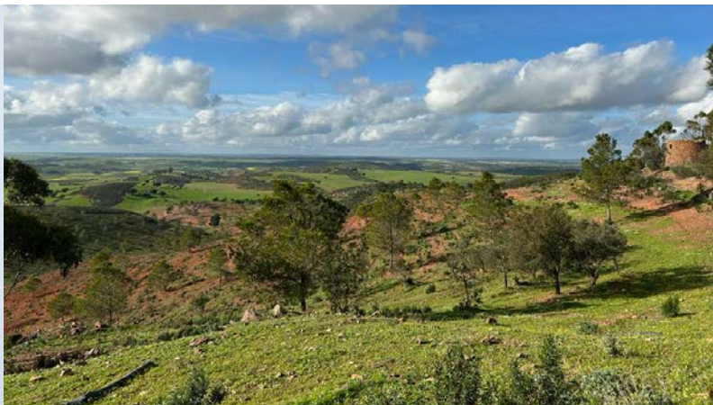
Landschap Baixo Alentejo