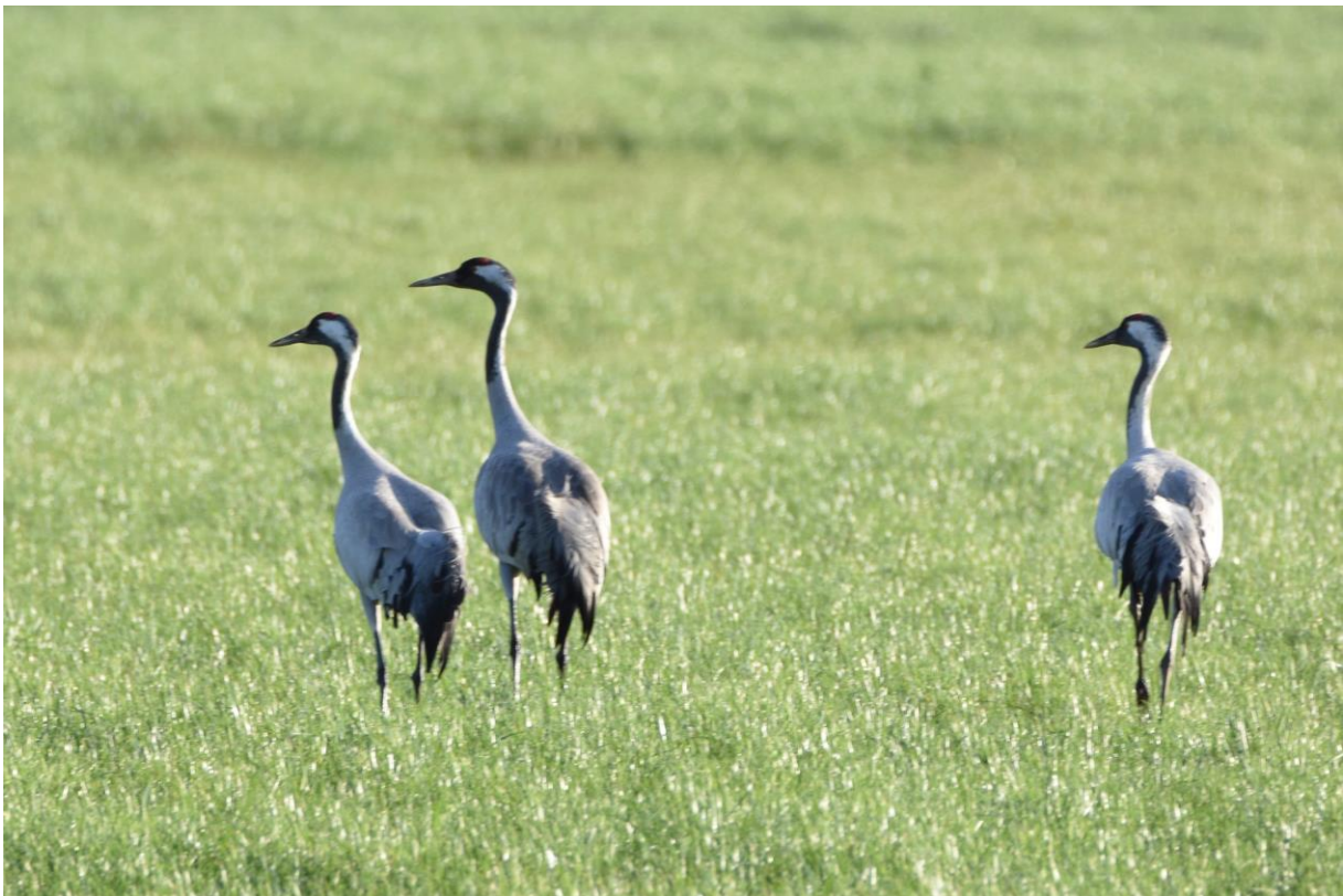
Kraanvogels – Gerben Mensink

Op vrijdagmorgen reden we met twee auto's naar Rahden, waar ons hotel stond. Een vanuit Noord-Brabant en een vanuit Friesland. Helaas zorgden files onderweg voor wat vertraging, zodat we wat later dan gepland bij het hotel arriveerden. Nadat we daar de bagage hadden afgeleverd en nog wat extra warme kleren hadden aangetrokken vertrokken we richting Oppeweher Moor. Onderweg zagen we de eerste kraanvogels foeragerend op akkers. Tot dan toe had het vrijwel de hele tijd geregend maar toen we bij het Oppeweher Moor aan kwamen was het gelukkig droog. Hier maakten we een korte wandeling. Er zaten echter niet heel veel vogels en de grote stille heide deed hier zijn naam eer aan. Wel zagen we hier nog een mooie klapekster. Daarna reden we naar de bekende plek in het Rehdener Geestmoor waar zich elke avond de kraanvogels verzamelen om te gaan slapen.