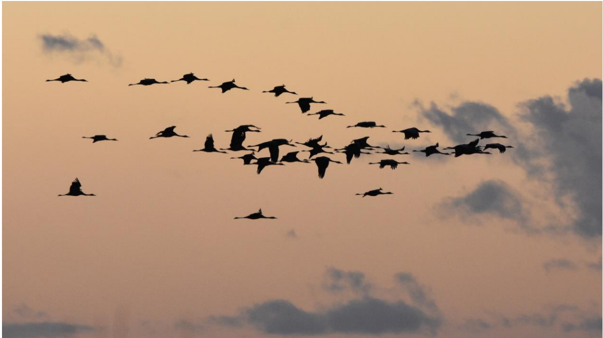
Kraanvogels Rehdener Geestmoor – Gerben Mensink