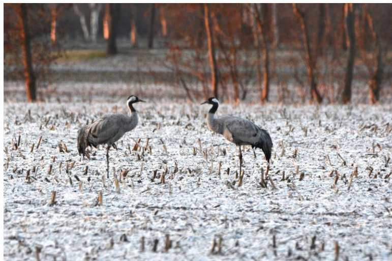
Kraanvogels – Gerben Mensink