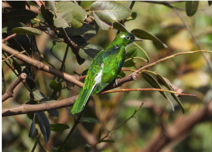
Klaas's Cuckoo

Het hoogtepunt van de ochtend was het zien van de beide turaco-soorten van Gambia, in één boom: Violet Turaco en Guinea Turaco. Van de laatste zagen we er twee bij elkaar, erg mooi!