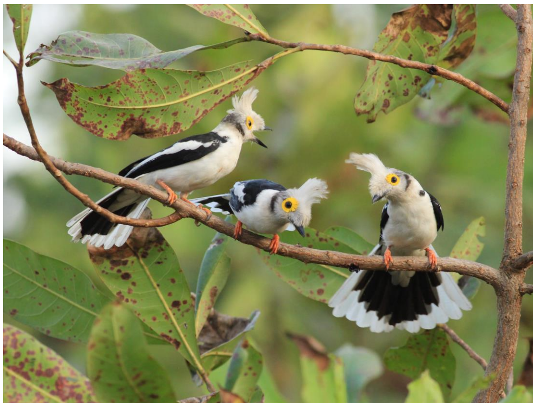
White-crested Helmetshrike