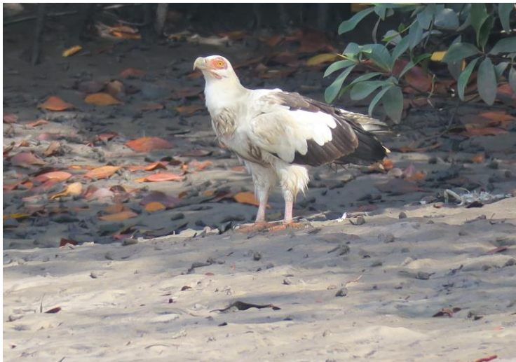
Palm-nut Vulture

De lunch gebruiken we weer op de lodge, waarna we voor de liefhebbers een korte siësta hebben. Maar iedereen scharrelde wat rond of zat rustig in een luie stoel over de kreek uit te kijken. Dat leverde enkele deelnemers wel een mooie waarneming van een Palm-nut Vulture op! Wat ook erg mooi was: enkele bomen op de lodge zijn afgeladen met Gambian Epauletted Fruit Bats, die zich prachtig laten bekijken.