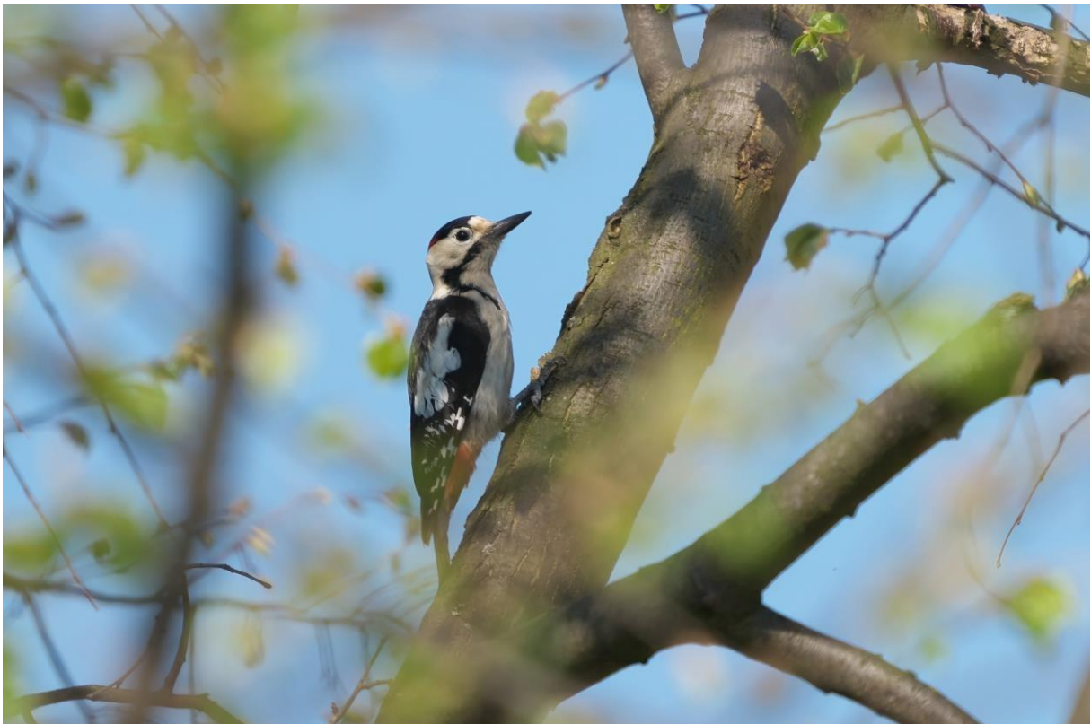
Syrische bonte specht