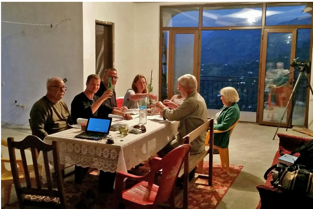
Lijsten onder het genot van een biertje, de home-stay gemaakte wijn (niet ieders 'cup of tea';-)), of koffie en het geluid van de huilende Jakhalsen uit de vallei.