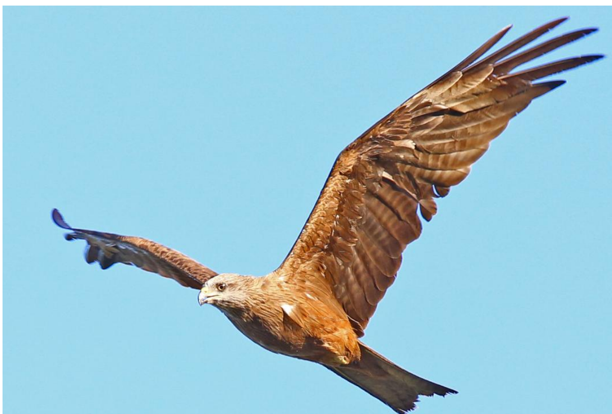
Zwarte Wouw adult