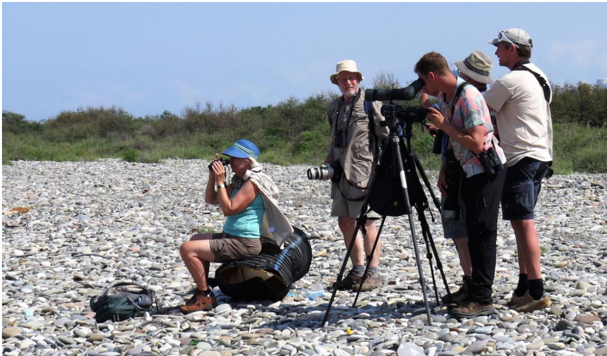
De Chorokhi delta is ook een prima plek om over zee te kijken