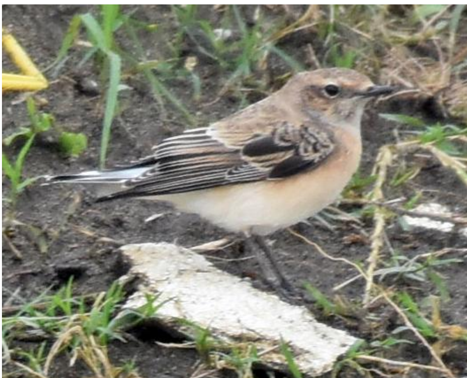
Bonte Tapuit 1 e winter man