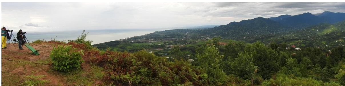
Panorama telpost 1

2 Draaihalzen, 3 Kleine Klapeksters, 2 Grote Karekieten, 2 Kleine Spotvogels, 4 Oostelijke Vale Spotvogels.