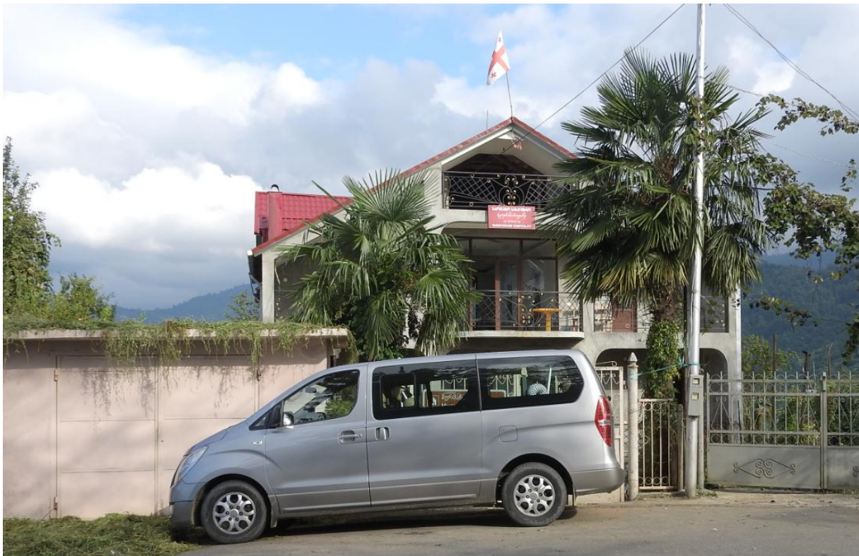
Onze meestal betrouwbare bus voor onze altijd betrouwbare home-stay