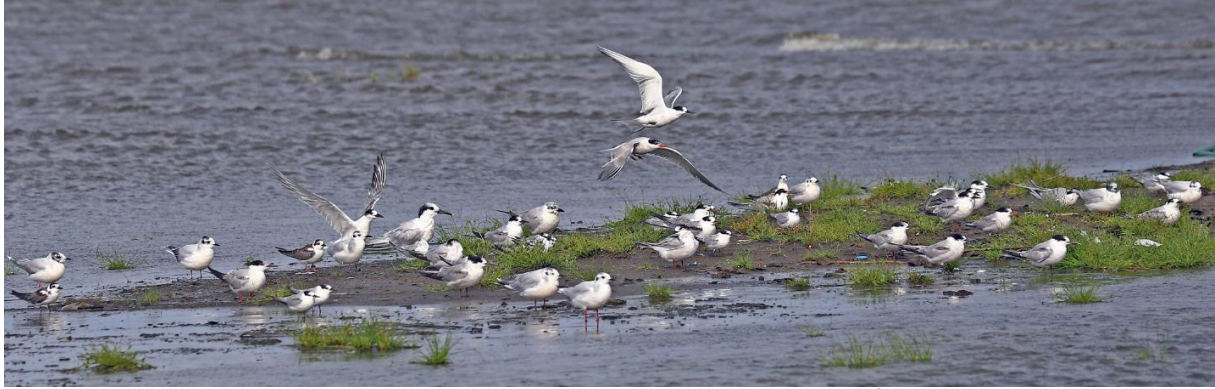
6 soorten sterns (Zwarte, Witvleugel, Lach, Grote, Dwerg en Visdief); de 7 e , Reuzensterne wilde niet met de rest op de foto