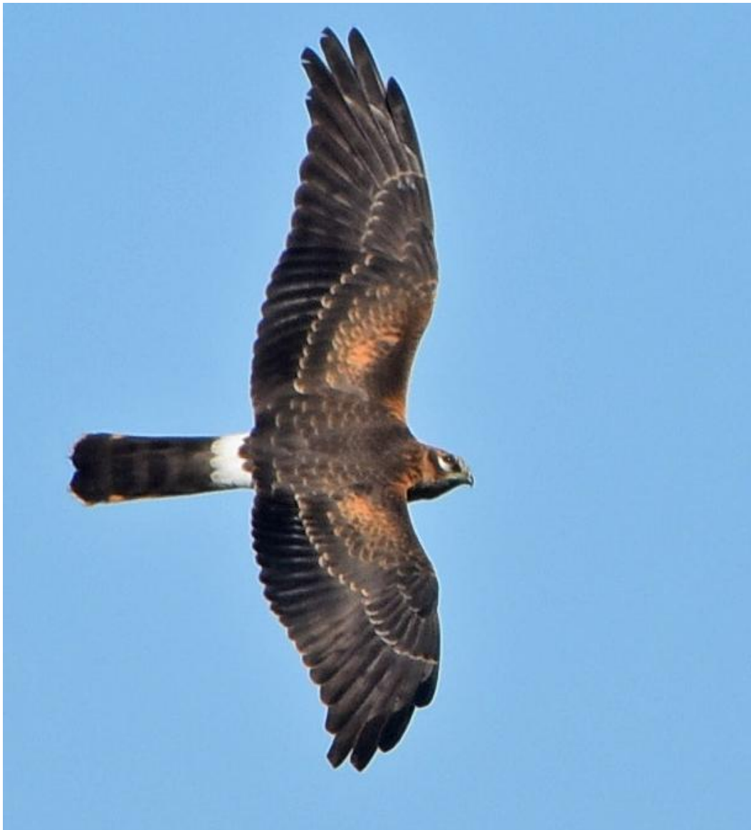
Grauwe Kiekendief, juv vrouw Studiemateriaal genoeg!