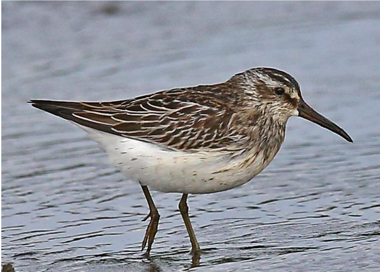
Breedbekstrandloper juveniel