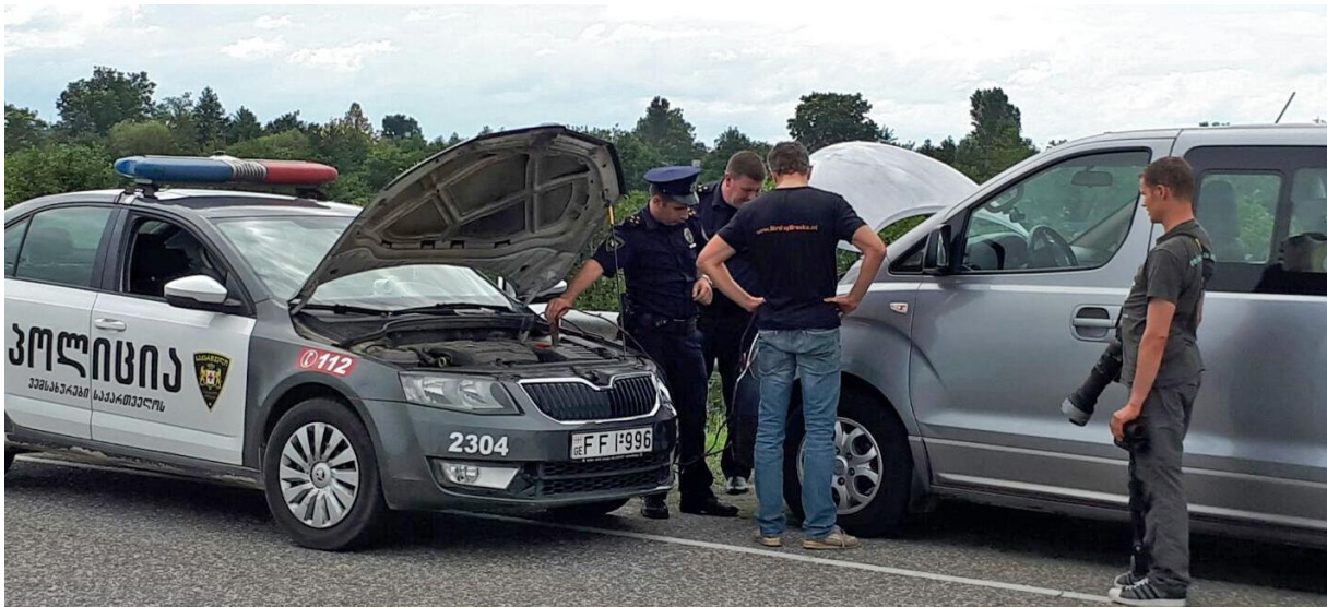
Aanduwen lukte niet, dus met grote dank aan de politie werden we weer op gang geholpen!.