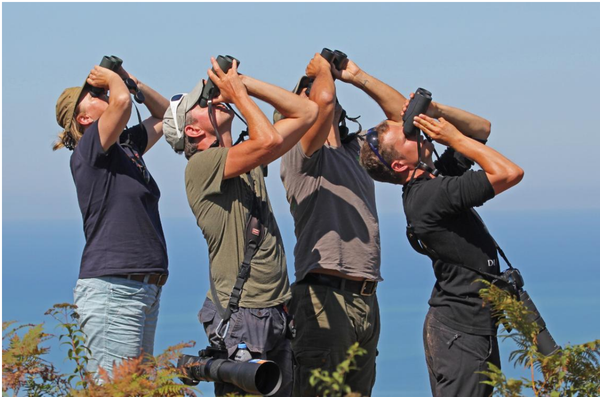
andere zitten hoger....