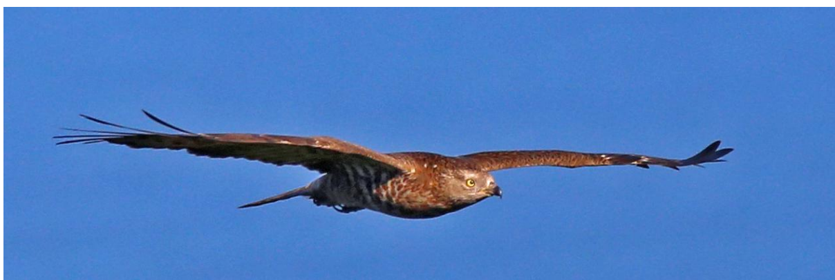
Wespendief adult man Velen konden we deze dag recht in de ogen kijken.