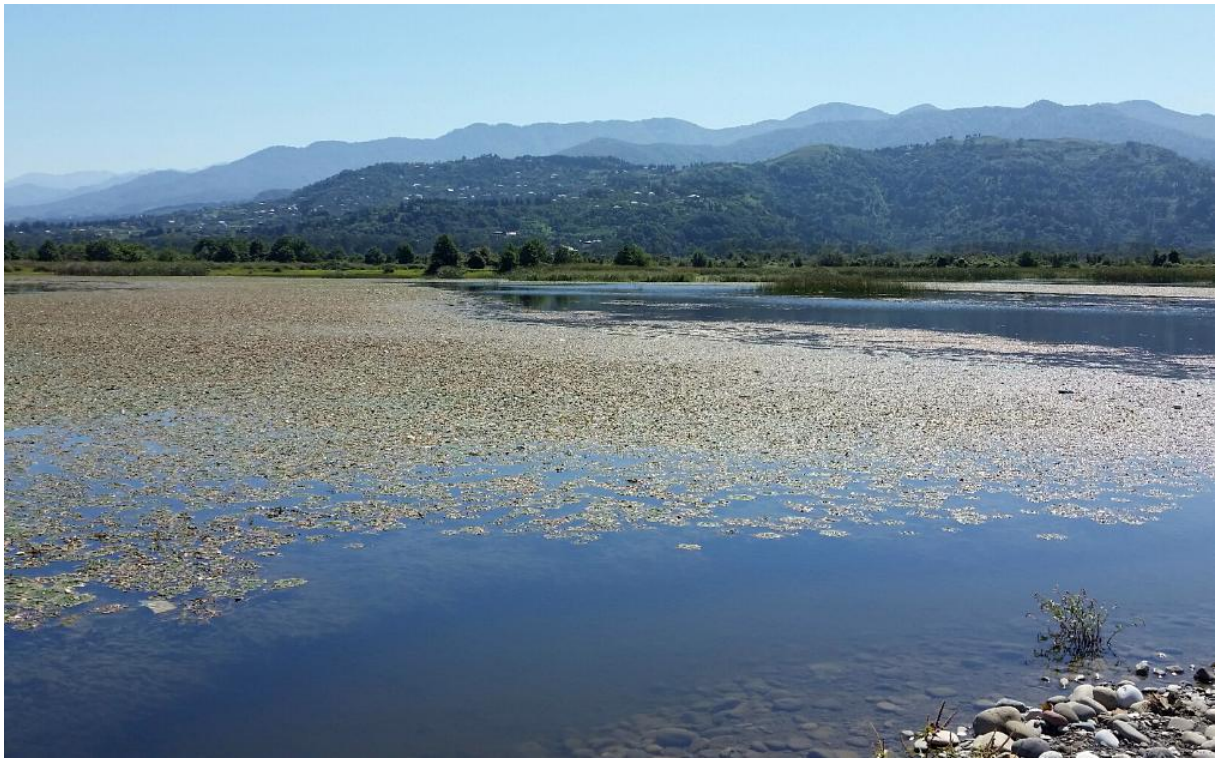
Poelen in de Chorokhi delta