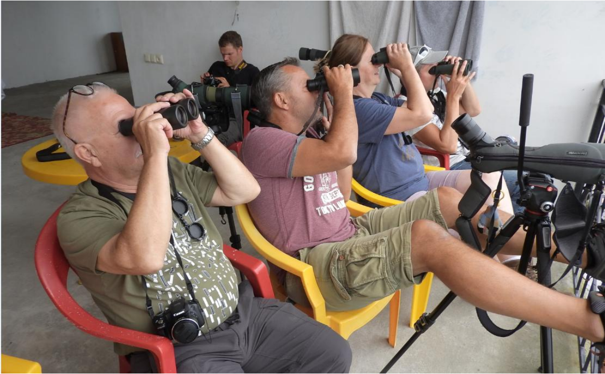
Home-stay birding, easy birding!