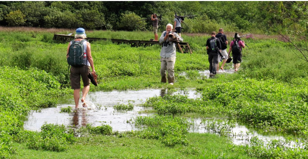
De toegang tot de uitkijktoren in Kubuleti NP heeft wat onderhoud nodig...