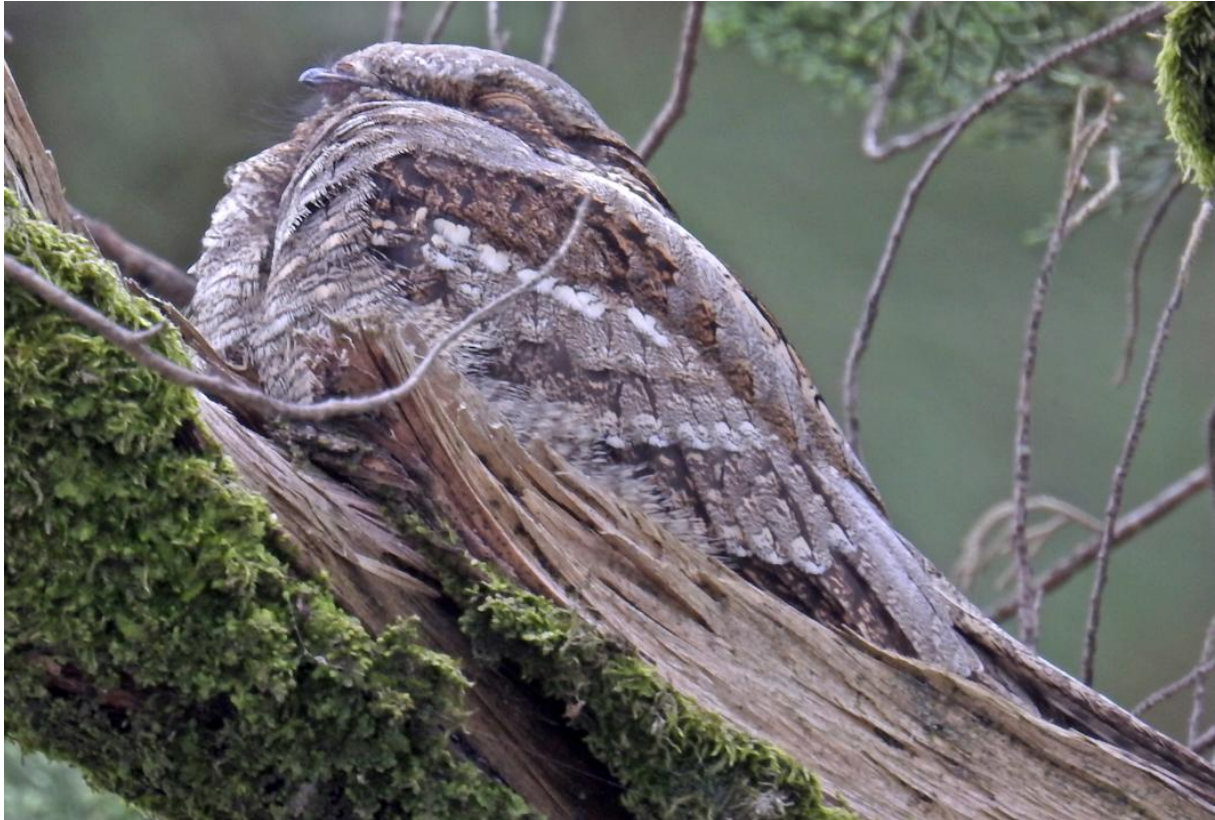
Nachtzwaluw (een vrij bleek ex met vrijwel uniform lichtgijze schouderveren en kruin, mogelijk duidend op een intergrade met de Aziatische unwin )