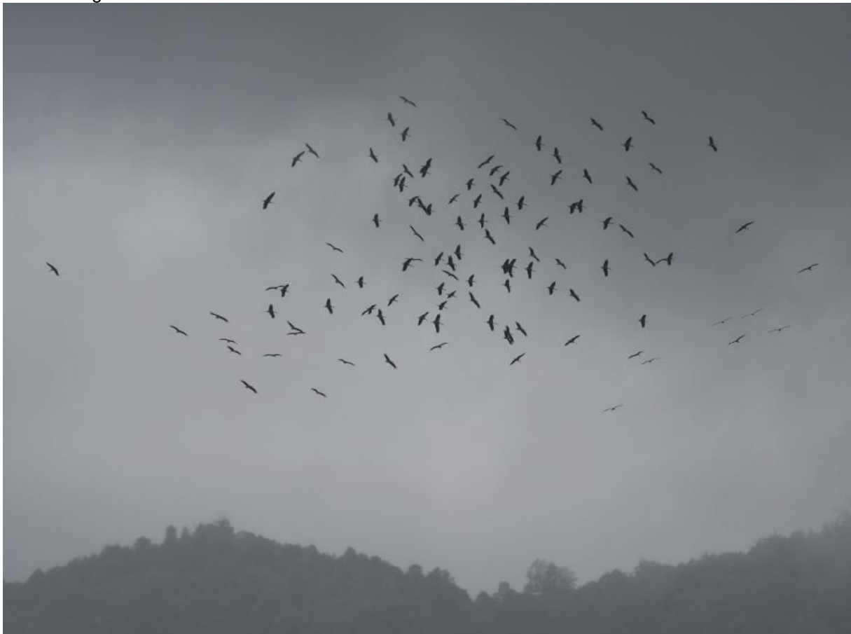
Ooievaars opdoemend uit de mist

De groep die Poti bezocht had een fraai schouwspel op de sandpit die deels onder water lag maar nog wel berijdbaar was. Een uitstekende vondst was een 1 e winter man Bonte Tapuit door Jules. De sandpit zat verder vol met steltlopers, meeuwen (grote aantallen Dwergmeeuwen), 1 Armeense Meeuw en grote aantallen sterns in 7 soorten.