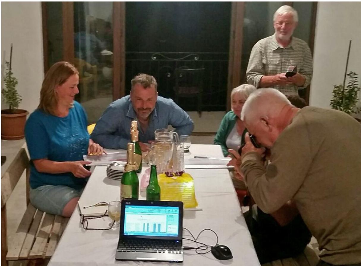
'Bonte avond' in de home-stay; de familie had een taart voor ons gemaakt en deze werd gepresenteerd compleet met champagne!