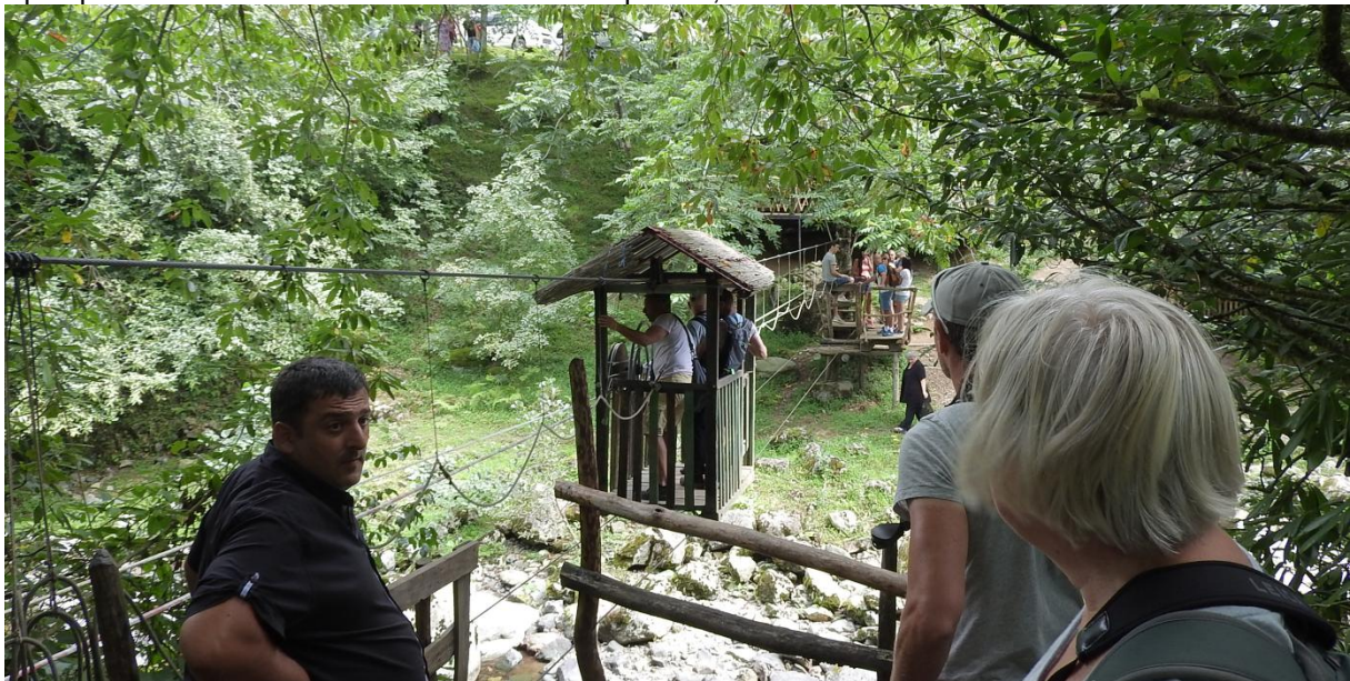
'Pondje' over de rivier, Mtrala NP

Op telpost 2 mooie trek van het bekende roverspakket, met toenemende aantallen Zwarte Wouwen.