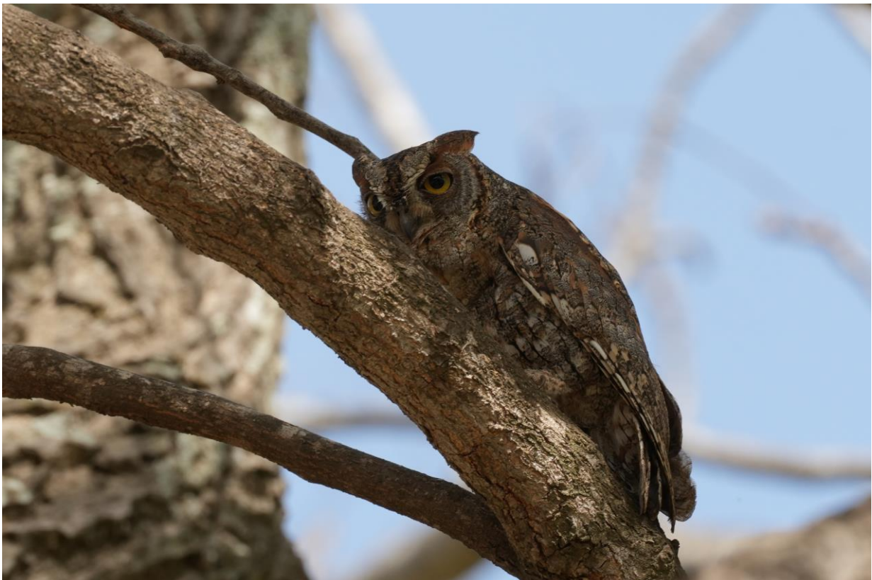
African Scops Owl (Tim Werdler)

We komen hier echter niet alleen voor een lekkere lunch, maar ook voor een soort die goed te doen is op dit kleine eiland omringd door mangrove. Modou draait het roepje van de African Scops Owl , die binnen enkele seconden terugroept en niet veel later in een grote boom voor ons komt zitten. We kunnen het uiltje fantastisch bekijken en de fotografen onder ons gaan los. Wat een heerlijke waarneming!