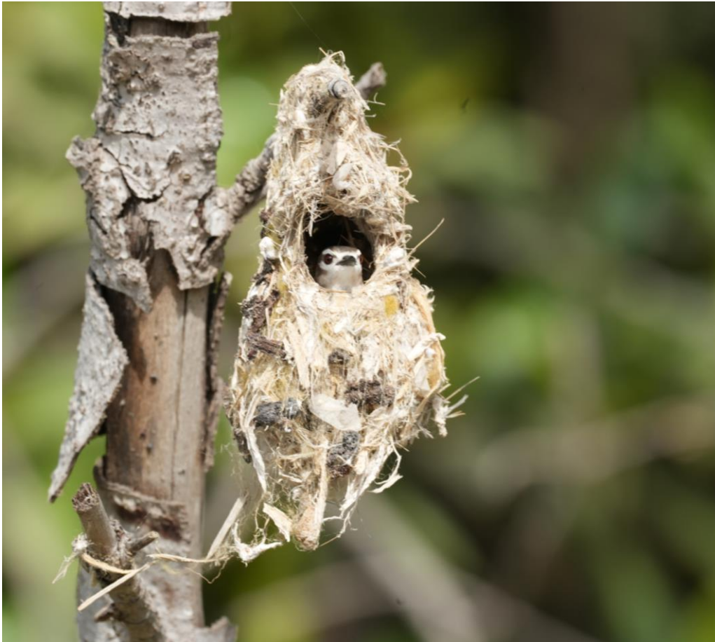
Mangrove Sunbird

Tegen de klok van drie maken we ons klaar voor misschien wel het hoogtepunt van deze reis. De boottocht door het Baobolong Wetland. We steken met ons bootje de Gambia rivier over en onze schipper manoeuvreert behendig door het wetland en de mangroves. De aantallen watervogels als African Darter , White-breasted Cormorant , Pied Kingfisher en vele andere zijn enorm en het is dan ook genieten. We vinden een bezet nestje van Mangrove Sunbird wat een prachtig plaatje oplevert.