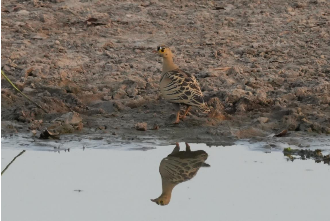
Four-banded Sandgrouse (Tim Werdler)