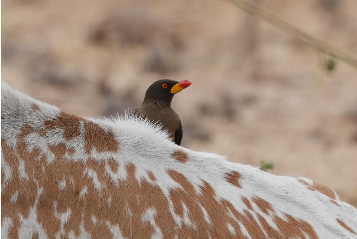
Yellow-billed Oxpecker in actie! (Tim Werdler)

Op bestemming aangekomen zoeken we onze kamers op en kunnen we aan het strand genieten van een koud drankje uitkijkend over zee terwijl de Pink-backed Pelicans voorbij vliegen en af en toe landen in het water voor ons in zee. We worden voorzien van een buffet, wat vanaf vandaag de standaard zal worden voor de komende week aangezien we richting het binnenland gaan. Restaurantjes kennen ze hier niet. We zijn immers steeds verder weg van het toeristische Serrakuda en zullen steeds meer het echte Gambia te zien krijgen.