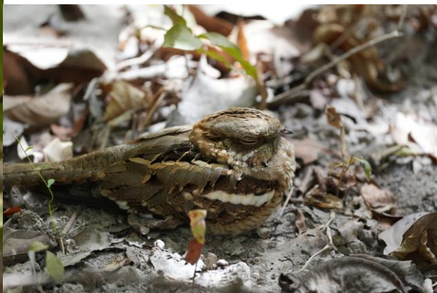
Long-tailed Nightjar (Tim Werdler)

Tijdens onze uitgebreide lunch kijken we uit over een drinkplaats, die Modou zelf heeft aangelegd. Het is een komen en gaan van vogels en de perfecte setting voor de lunch. Hoewel het vaak dezelfde soorten zijn bij de drinkplekken die we bezoeken leent het zich de perfecte mogelijkheid om de verschillen te bestuderen en natuurlijk mooie plaatjes te schieten.