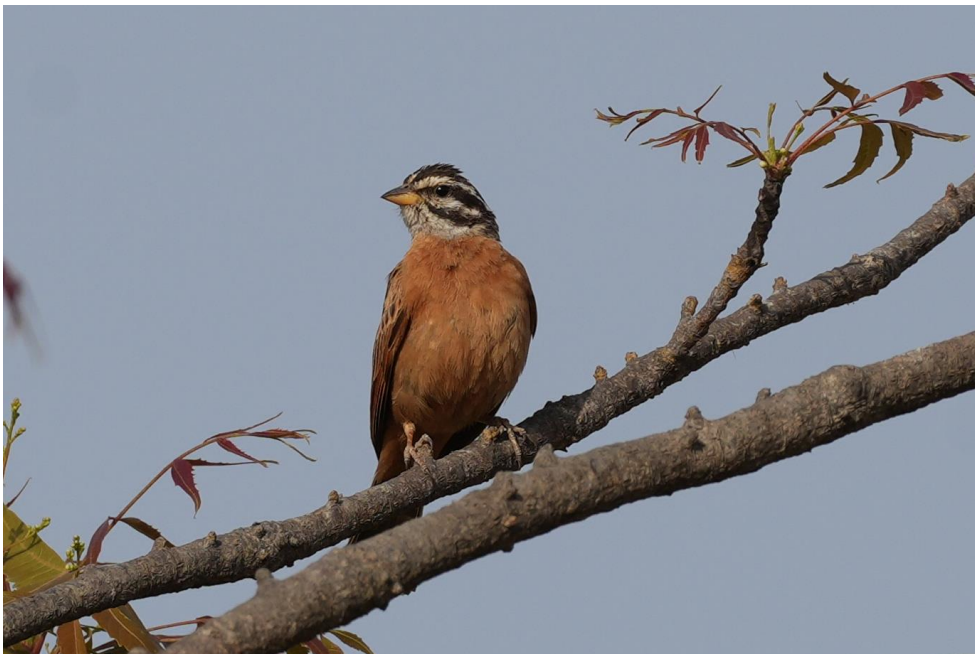
Gosling's Bunting