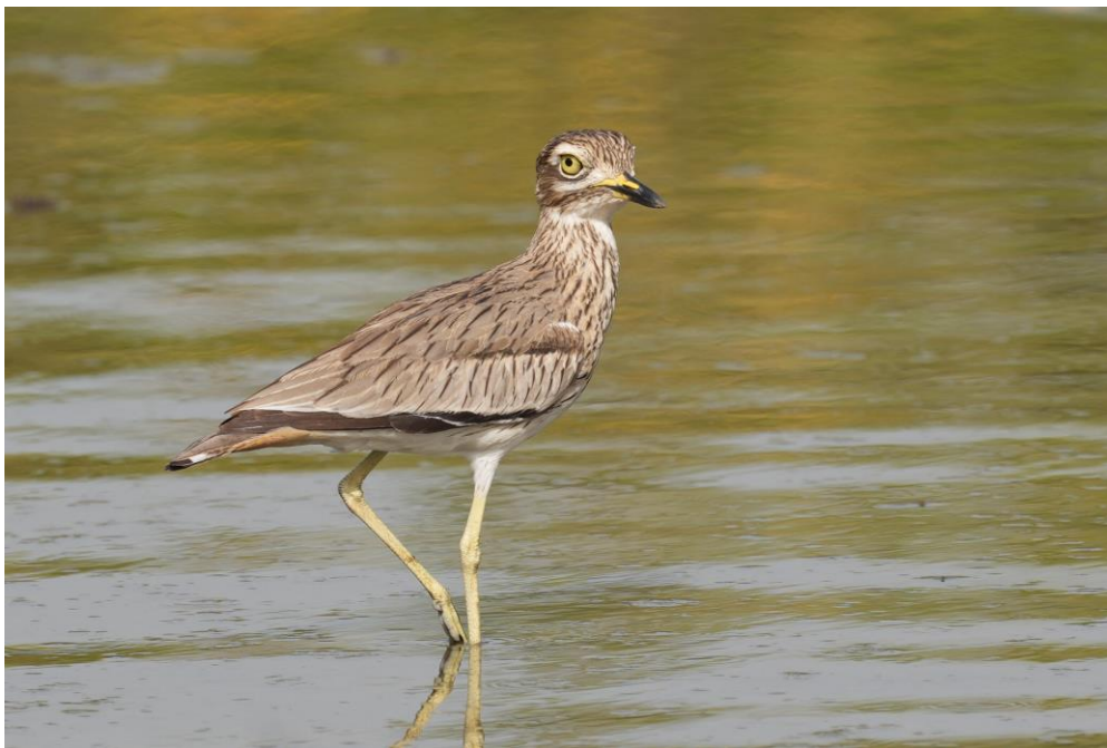
Senegal Thick-knee (Tim Werdler)

In januari is het erg heet in Gambia met temperaturen vanaf 30 graden, dus besluiten vooral in de middag uren de schaduw op te zoeken en uitgebreid te tijd te nemen voor de lunch. De vogelactiviteit is op dat moment erg laag en dus kiezen we eieren voor ons geld. Als het 15:00 is geweest vertrekken we wederom naar Kotu Creek. Het valt direct op dat het water is gezakt en zien een stuk of vijftien Senegal Thick-knees erg goed en er worden mooie plaatjes geschoten.