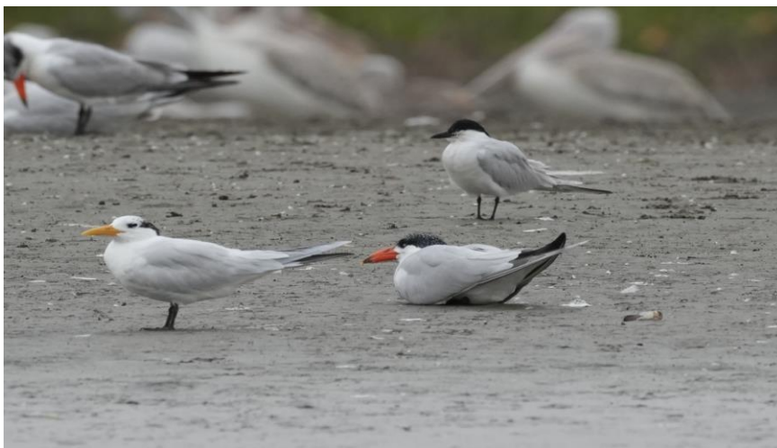
Alle drie de Sterns op 1 foto! (Tim Werdler)

Na een heerlijke lunch met Baobab sap als specialiteit en wat muziek maken we ons op voor een boottocht. De boottocht heeft twee doelsoorten die iconisch zijn voor het vogelleven in Afrika; Goliath Heron en African Fish Eagle . Vanaf de lodge waar we hebben gegeten stappen we in een bootje en varen een stuk langs de mangrove. We komen als snel langs een zandbank die vol zit met enorme hoeveelheden watervogels. We zien wederom beide soorten pelikanen, maar de aandacht gaat vooral al naar de verschillende soorten sterns waarvan we er drie zien, namelijk Reuzenster, Lachster en African Crested Tern .