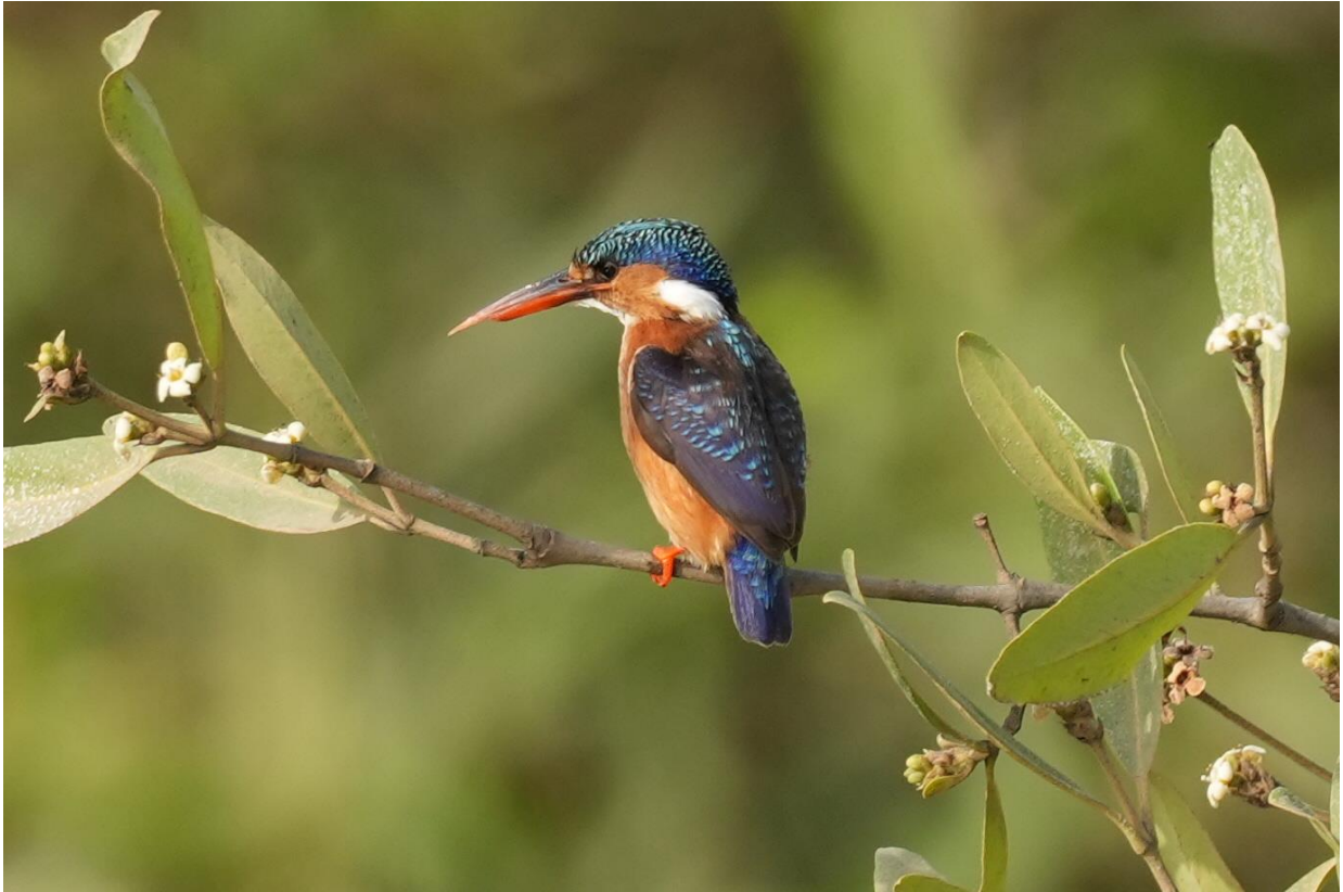
Malachite Kingfisher