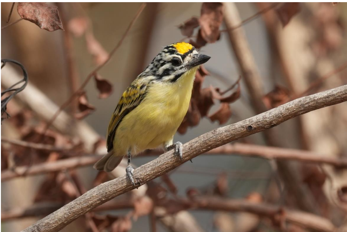
Yellow-fronted Tinkerbird (Tim Werdler)

Na een goede nacht slaap zijn we er vroeg bij. Ook vandaag hebben we weer een mooi gevarieerd programma met wandelingen in de ochtend en een mooie boottocht in de middag. We gaan als eerst richting een halfopen bosgebied om opzoek te gaan naar Bronze-winged Courser . Een van de twee soorten renvogels waar we kans op maken tijdens onze reis. Het is een lastige soort en door middel van het lopen op linie proberen we de vogel op het spoor te komen. Helaas horen we al snel dat het beest de afgelopen dagen niet is gezien, omdat veel boeren met hun vee door ditzelfde gebied lopen en de vogel wellicht hebben opgeschrikt. Toch is ons bezoek aan het gebied niet voor niets want we krijgen onder andere Fine-spotted Woodpecker , Yellow-fronted Tinkerbird , Swallow-tailed Bee-eater en Hop erg goed te zien.