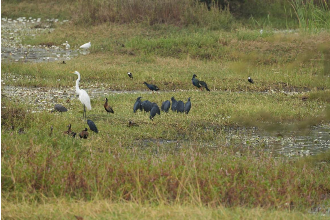
Kartong Ponds; o.a. White-faced Whistling Duck & Black Heron (Tim Werdler)

Hoewel het strand vol ligt met plasticsoep maken we een kleine wandeling in de warme zon. Dit is namelijk dé plaats voor een lokale specialiteit. Om de 50 meter zetten we de telescoop op om de vloedlijn af te speuren tot dat het raak is. Vier kleine strandlopers foerageren tussen al het plastic op het strand. White-fronted Plovers . Duidelijk een familie, want we herkennen al snel twee jonge vogels. Na deze wederom goede soort lopen we nog iets door, want van afstand hebben we een grote groep steltlopers gespot. Onder andere Scholekster, Wulp, Zilverplevier, Drieteenstrandloper en Steenloper zijn aanwezig. Als we terugkeren rijden we richting onze lunchplek.