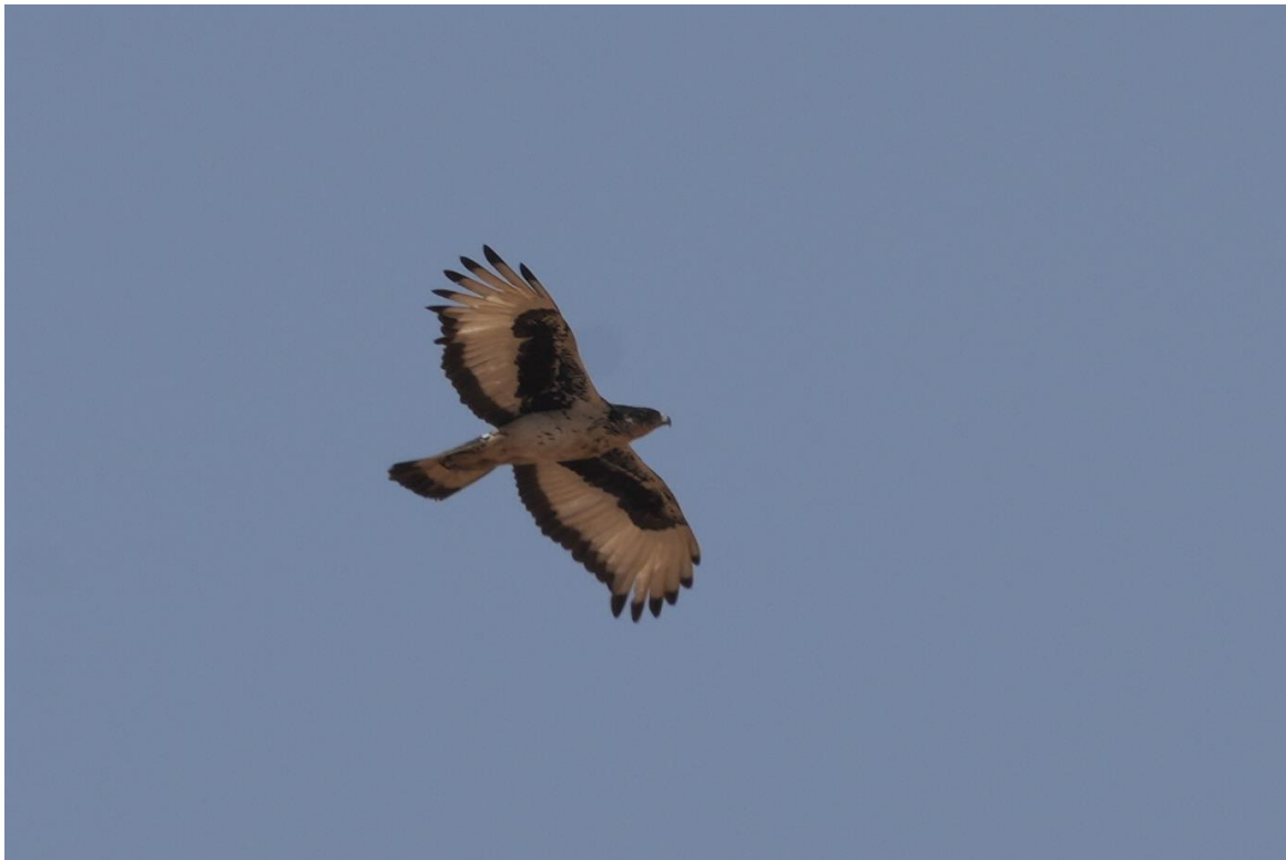
African Hawk Eagle, wat een beest! (Tim Werdler)

Onderweg stoppen we om proviand in te slaan en verzorgd Fanta heerlijke broodjes. We hebben keuze uit sardines, canned beef en zelfs pindakaas. Dit in combinatie met een vers gemaakte koolsla achtige salade gaat er goed in. We zetten onze reis voort en eenmaal in de buurt van onze accommodatie maken we nog wat stops. Als eerst bezoeken we een gebied waar Collared Pratincole vaak wordt gezien en ook vandaag zien we er een stuk of twintig beesten. Dit kan heel relaxed vanuit de bus en dit zorgt ervoor dat we snel weer doorkunnen. Even later eenzelfde stop voor een nest waar African Hawk Eagle broedt en ook deze soort is thuis en krijgen we mooi te zien. Dat gaat lekker zo!