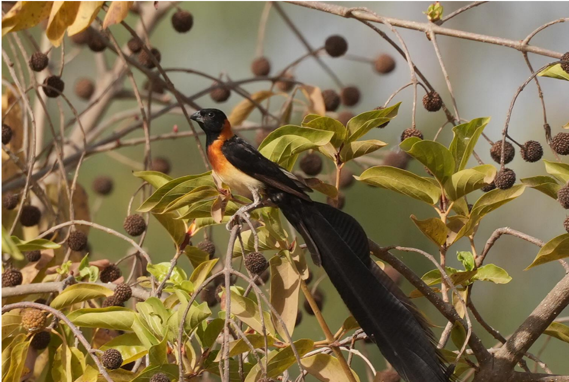
Exclamatory Paradise Whydah (Tim Werdler)

Whydah maakt zijn entree en wat een gaaf beest is dit! De vogel komt een paar keer aan de grond om te drinken op nog geen 15 meter bij ons vandaan. De camera's ratelen eens te meer en mooie platen worden geschoten. Voldaan stappen we de bus in als de vogel uit beeld is.