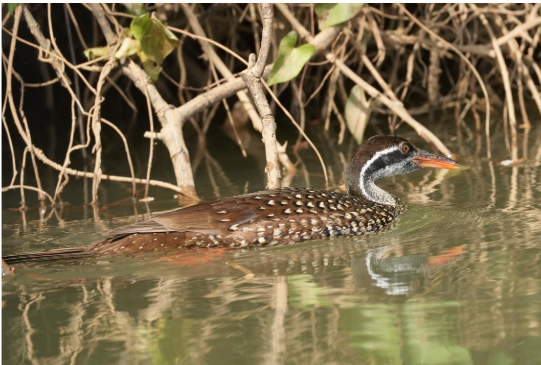
African Finfoot (Tim Werdler)

Enmaal op het water speuren we de oevers van de Gambia rivier af. De Finfoot manoeuvreert zich altijd tegen de oevers aan onder de mangrove door. Gelukkig zijn we met 13 paar ogen, dus deze soort gaan we niet missen! Langs de oevers foerageren vele Broad-billed Rollers , Little Bee-eaters en een Square-tailed Drongo , die we allemaal goed te zien krijgen. Dan opeens doemt daar de African Finfoot op. Het beest laat zich twee keer prachtig zien en door het troebele water zien we zelfs de knalrode potten die zo kenmerkend zijn. Wat een gave waarneming!