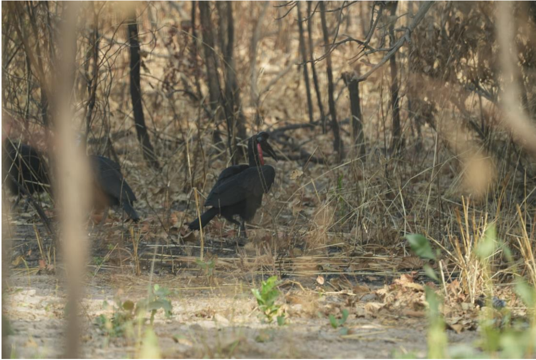
'Northern' Abyssinian Ground Hornbill (Tim Werdler)