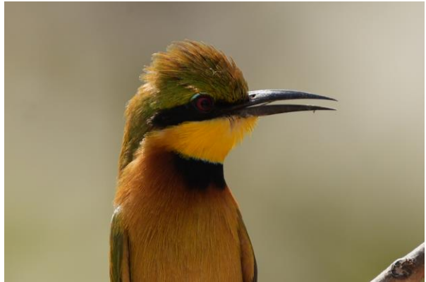
Little Bee-eater (Tim Werdler)

Na onze veldlunch bij de hide vertrekken we richting onze accommodatie. Het is rond de klok van 14:00 en spreken weer af om 17:00. Iedereen heeft mooi de tijd om tijdens het heetste moment van de dag zich even terug te trekken en te genieten van de zon in plaats van te zwoegen in diezelfde zon.