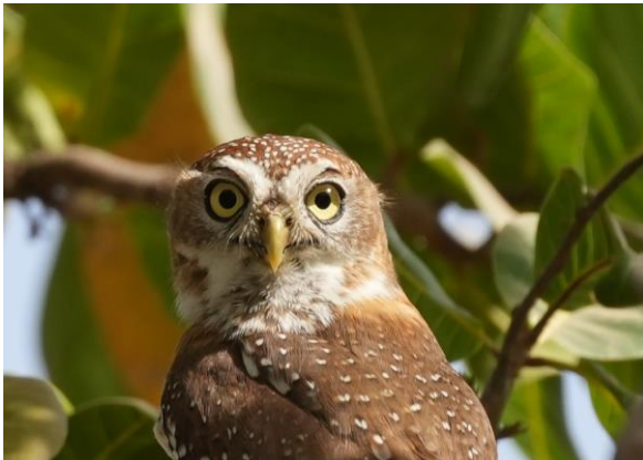
Pearl-spotted Owlet