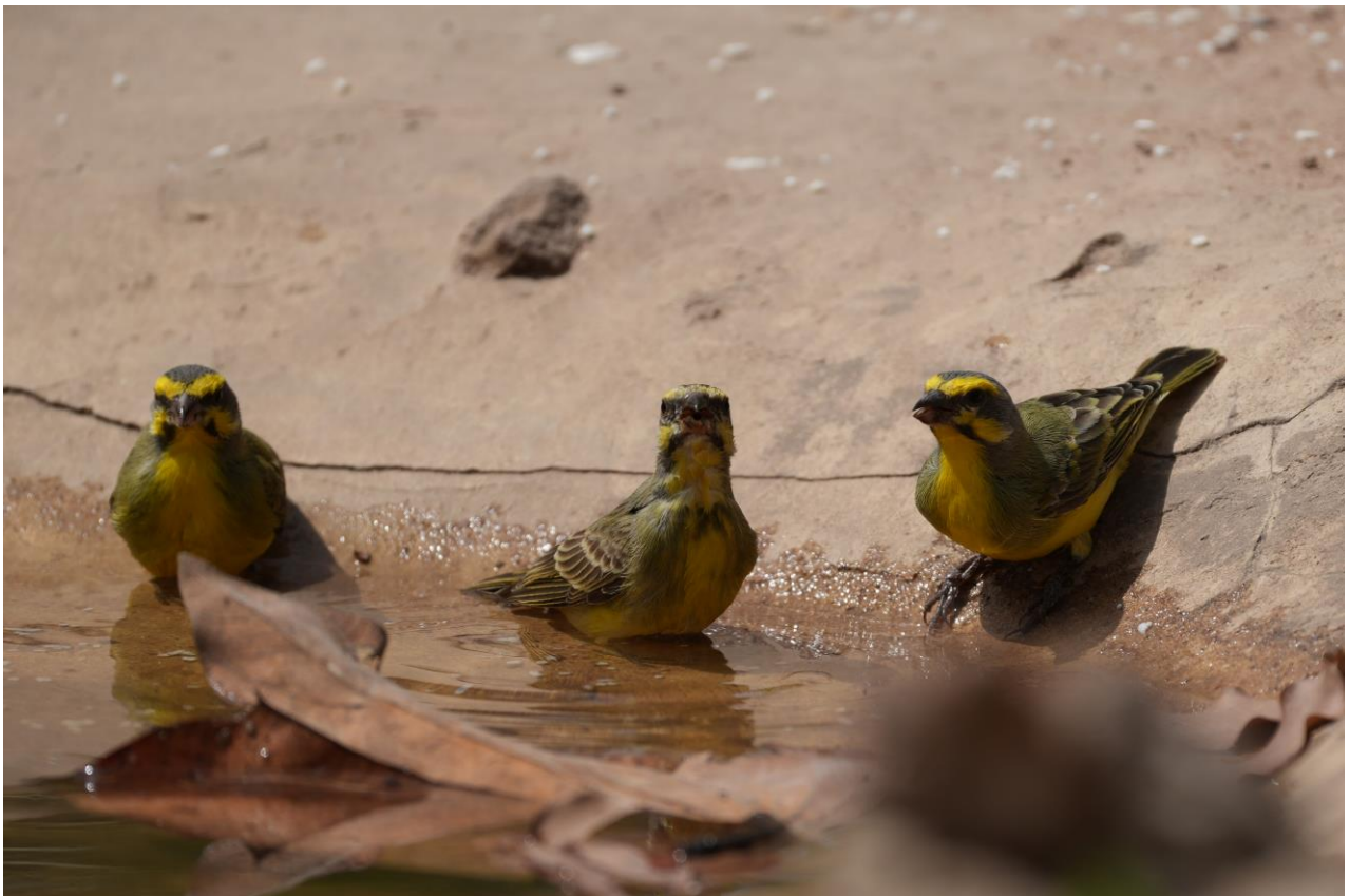
Yellow-fronted Canary bij de fotohut

We starten niet ver van onze accommodatie en zien een aantal soorten die we eerder hebben gezien en nemen de tijd om ze nog eens goed te bekijken. Grey-headed Kingfisher, Violet Turaco, African Golden Oriole, Fork-tailed Drongo en Bruce's Green Pigeon . Stuk voor stuk prachtige soorten waar we geen genoeg van kunnen krijgen. We rijden verder naar de Killy Woods waar een mooie hide is, hier hebben we gisteren uitvoerig tijd doorgebracht. Omdat de hut goede fotokansen biedt onder het genot van een koud drankje bezoeken we die nogmaals. We maken een korte wandeling en zien tot onze verbazing een Rode Rotslijster . Dat is nummer 299! Helaas stijgt de temperatuur rap en de vogelactiviteit neemt dan ook snel af. We besluiten nog even een bezoekje te brengen aan de hide, maar helaas levert dit ook geen nieuwe soorten op. We besluiten rustig richting de lodge te gaan en genieten van de heerlijk relaxte omgeving.