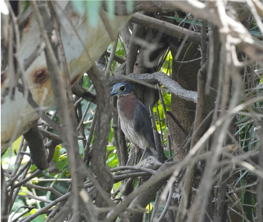
White-backed Night Heron (Tim Werdler)

Omdat we nog een stukje terug moeten rijden en kans hebben om te stranden in de beruchte traffic-jam van Serrakuda besluiten we op tijd terug te gaan. Zo kunnen we ons nog even opfrissen, voordat we naar ons restaurantje van vandaag vertrekken. Op onze laatste avond in Serrakuda gaan we eten bij de African Queen, wat wederom een succes is. Na een avond Libanees en Indiaas maken we nu kennis met de lokale Gambiaanse keuken. Domoda, Benachin en Yassa zijn populaire gerechten vaak op basis van vlees, kip of vis aangevuld met rijst of pindasauzen.