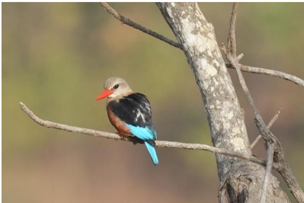
Grey-headed Kingfisher (Tim Werdler)