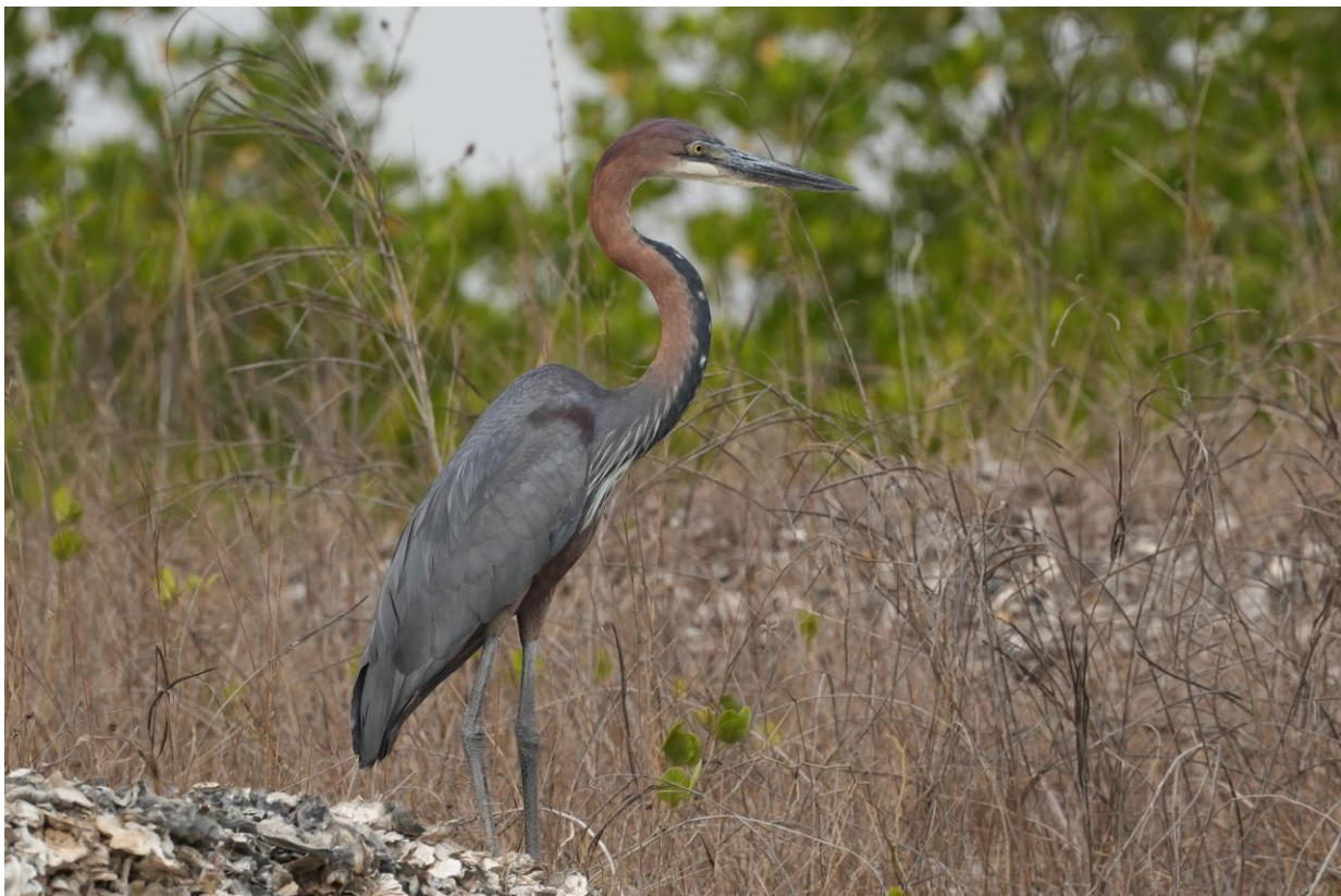
Goliath Heron / Reuzenreiger (Tim Werdler)

We vervolgen onze tocht opzoek naar de doelsoorten en niet veel later zien we een enorme verschijning langs de oever staan, Goliath Heron . Deze soort kan wel 1,5 meter worden van top tot teen en een volwassen mannetje kan een spanwijdte van 2,4 meter bereiken! Ter vergelijking, dat is even groot als onze Zeearend. De vogel werkt zeer goed mee en laat zich prachtig fotograferen en iedereen is zeer in zijn nopjes met deze gave waarneming. Toch zijn we nog niet klaar en hebben we nog een target voor vandaag. Niet veel later hebben we ook die in beeld. De prachtige African Fish Eagle , hoewel de soort in Afrika redelijk algemeen is blijft het een geweldig beest. Als we terugkeren bij de lodge is het inmiddels 17:30 en besluiten we terug te gaan naar onze accommodatie. We hebben nog wat tijd om ons op te frissen en sluiten dan aan voor het buffet wat voor ons klaar staat. Een geslaagde dag en morgen gaan we up-river richting Tendaba voor wederom een nieuwe Gambia beleving.