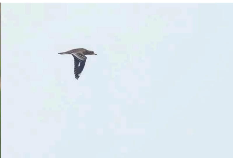
Griel in vlucht