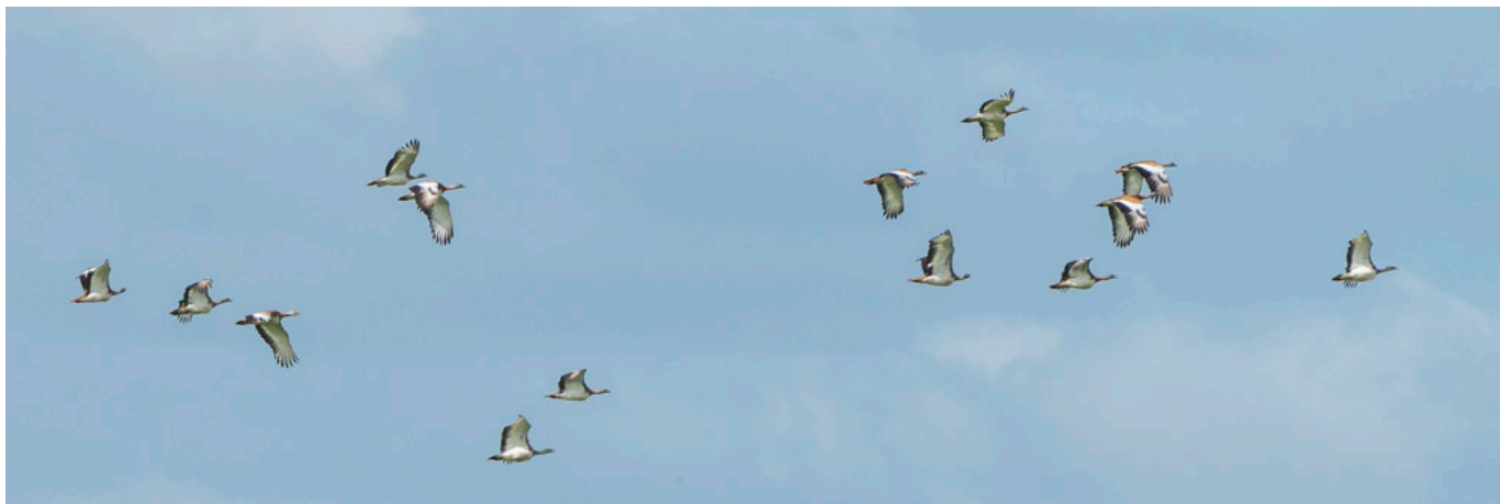
Groep grote trappen in vlucht