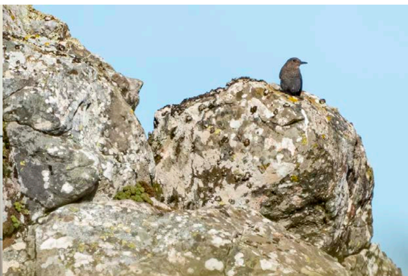
Blauwe rotslijster (onvolwassen)