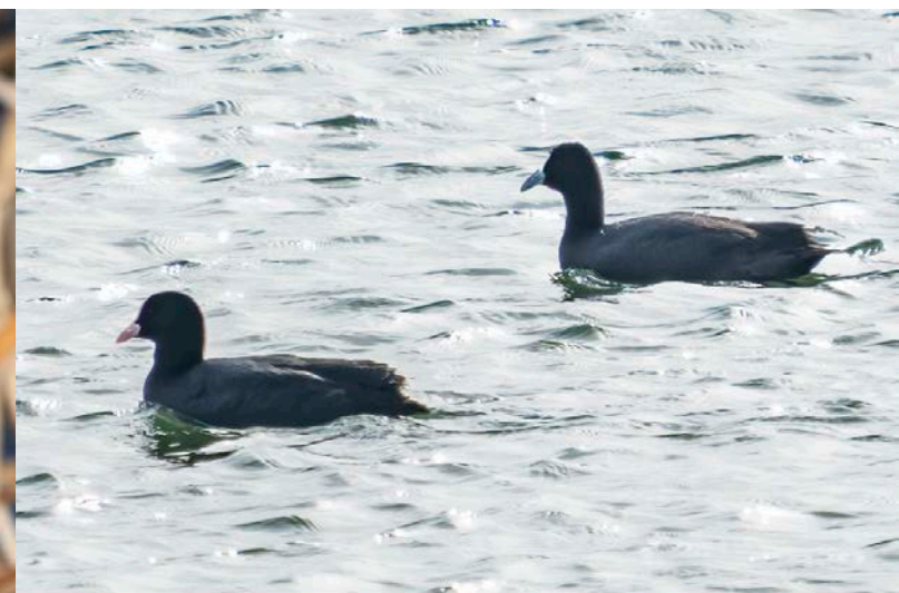
Knobbelmeerkoet (rechter vogel)