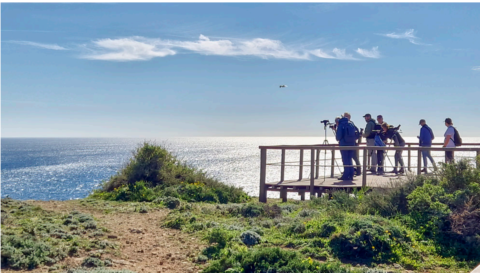
Vogels kijken bij Sagres