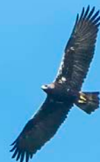
Volwassen Spaanse keizerarend