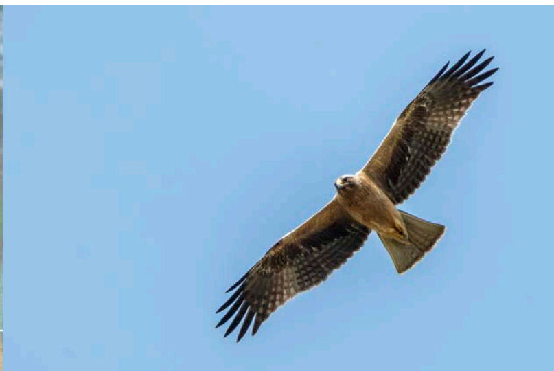
Dwergarend (intermediaire vorm)