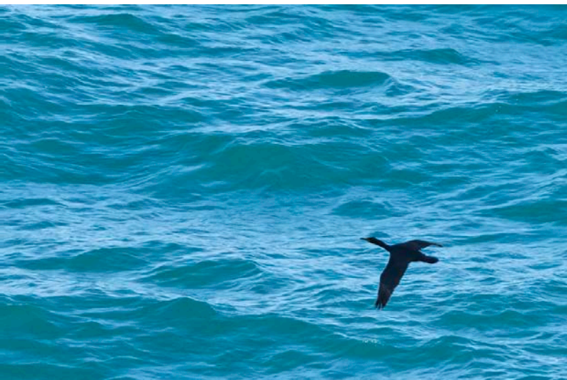
Kuifaalscholver (ondersoort desmarestii )