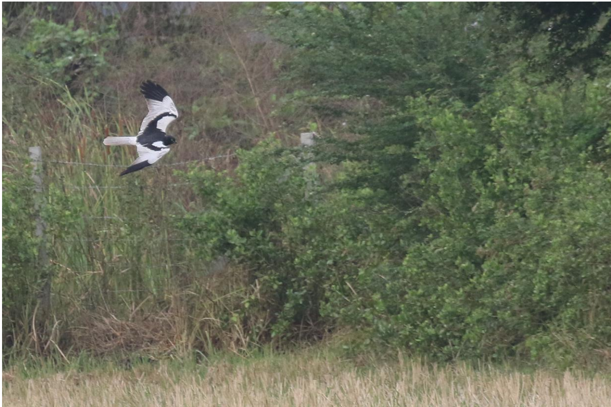
Mannetje Pied Harrier

Bij een nieuw zoutpannengebied kunnen we Taigastrandloper toevoegen aan de lijst van waargenomen steltlopers en later op de middag stappen we in een bootje om door de mangrove naar een eiland met zandstrand te varen voor enkele leuke soorten waaronder de zeldzame White-faced Plover en Malaysian Plover. Beide soorten krijgen we te zien. Op de terugweg door de mangrove zit iedere honderd meter wel een Collared Kingfisher.