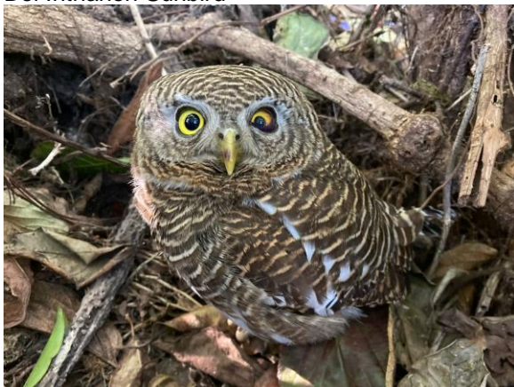
Asian Barred Owlet