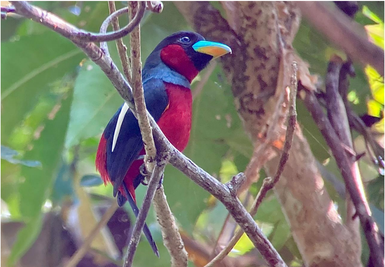
Black-and-Red Broadbill is bijna futuristisch gekleurd.