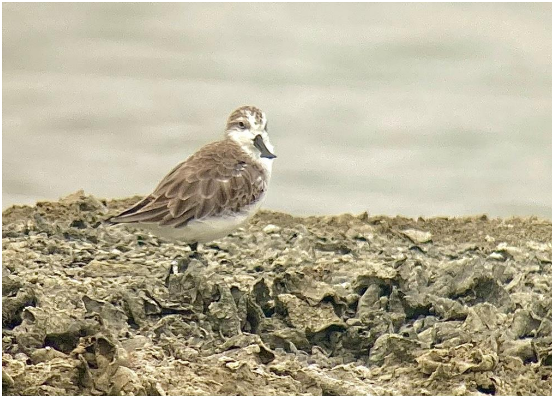
Lepelbekstrandloper op mooie afstand