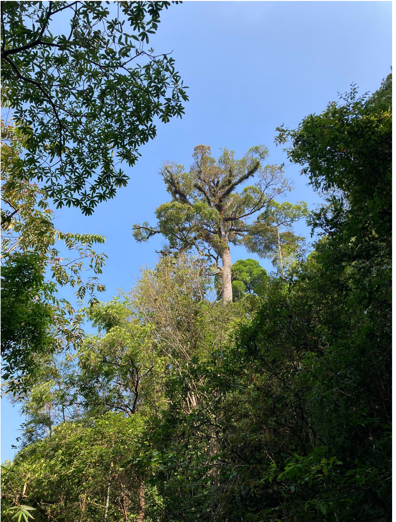
Na drie dagen nemen we afscheid van Kaeng Krachan NP