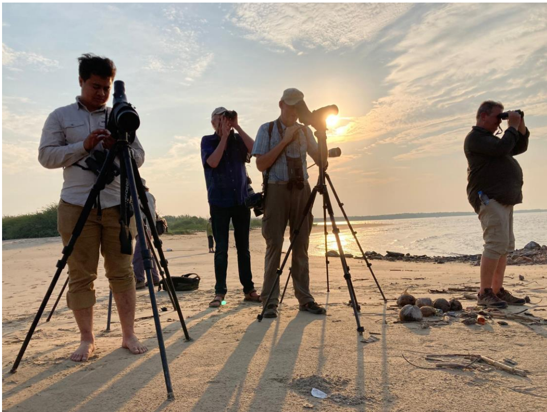
Vogelen in het avondlicht

Bij een nieuw zoutpannengebied kunnen we Taigastrandloper toevoegen aan de lijst van waargenomen steltlopers en later op de middag stappen we in een bootje om door de mangrove naar een eiland met zandstrand te varen voor enkele leuke soorten waaronder de zeldzame White-faced Plover en Malaysian Plover. Beide soorten krijgen we te zien. Op de terugweg door de mangrove zit iedere honderd meter wel een Collared Kingfisher.