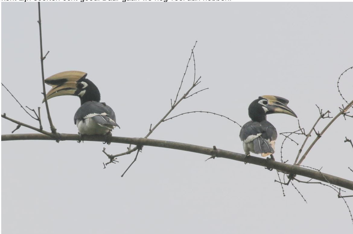
Oriental Pied Hornbill

Een gerichte stop langs de weg levert een Vinous-breasted Myna op. Mooi! In het NP rijden we gelijk mooi bos in en bijna alles wat we zien is nieuw voor de trip. Het is hier roadside birding maar gelukkig is de weg heel relaxt. We zien o.a. Ruby-cheeked Sunbird, Crimson Sunbird, Blue-bearded Bee-eater, Blue-winged Leafbird, Square-tailed Drongo-Cuckoo, Green-billed Malkoha, Pin-striped Tit-Babbler en veel meer. De oren van onze lokale gids hebben hun dienst al bewezen. Hij is ongelooflijk scherp en kent zijn soorten écht goed. Daar gaan we nog veel aan hebben!