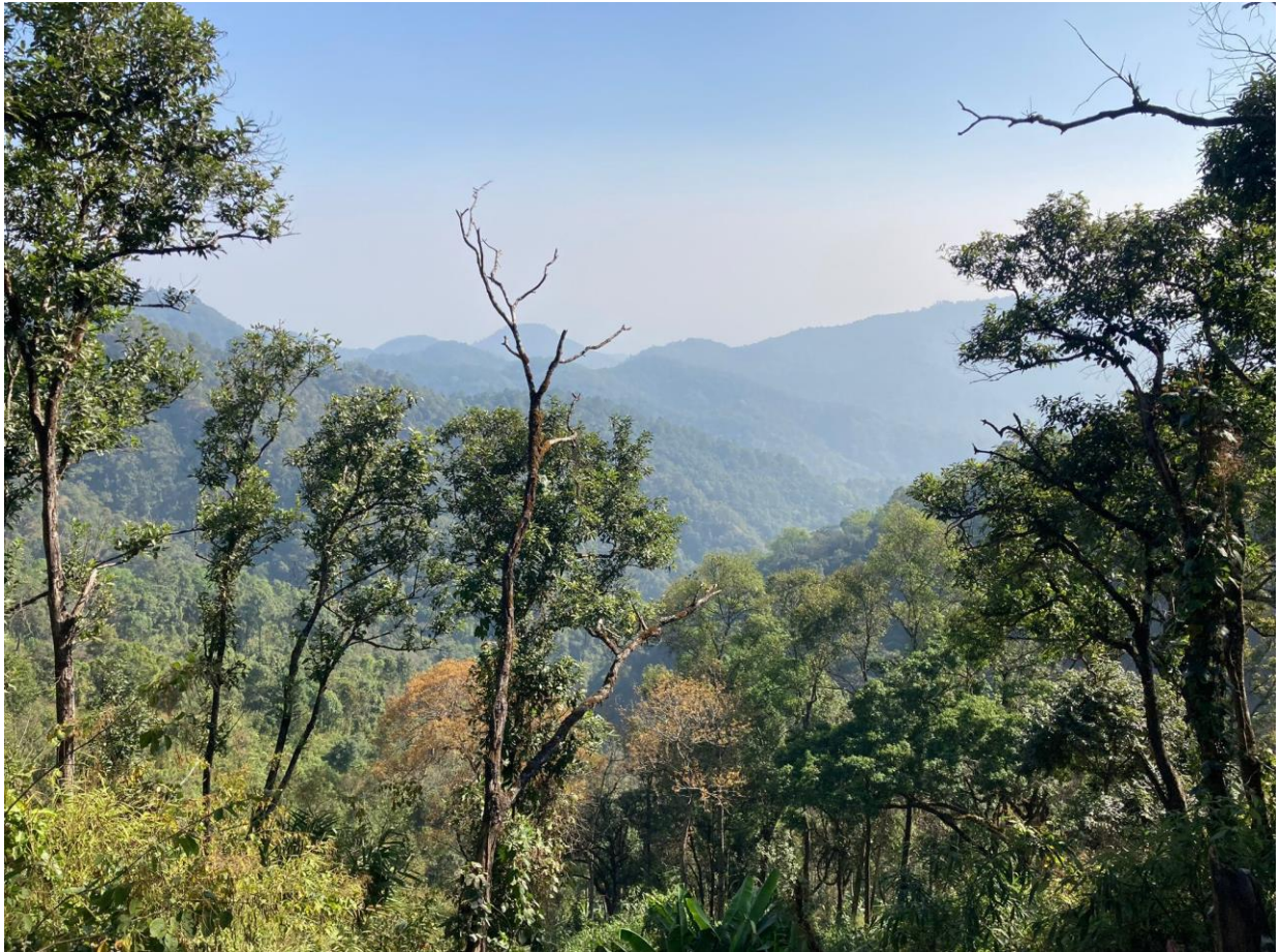
Scenery bij Doi Angkhang

In de ochtend verlaten we de stad op naar de beboste bergruggen van Doi Angkhang/Mae Phang NP. Met een mooie Scenery vogelen we langs de weg. Bij een kleine vuildump hoort Don Spot-breasted Laughingthrushes roepen. We tapen even en ze komen op ons af en sommigen van ons krijgen ze zelfs in beeld! Het blijft weliswaar bij een schim maar dit is wel een hele goede soort waar we zéker niet op gerekend hadden. Andere soorten hier zijn Grey-sided Thrush, Vale lijster en Black-Breasted Thrush.