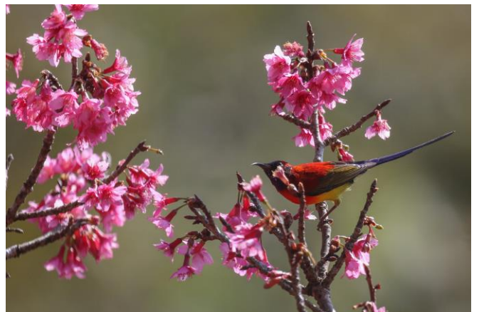
Mrs. Gould's Sunbird