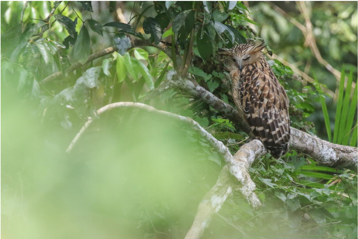
Buffy Fish-Owl achter het restaurant.