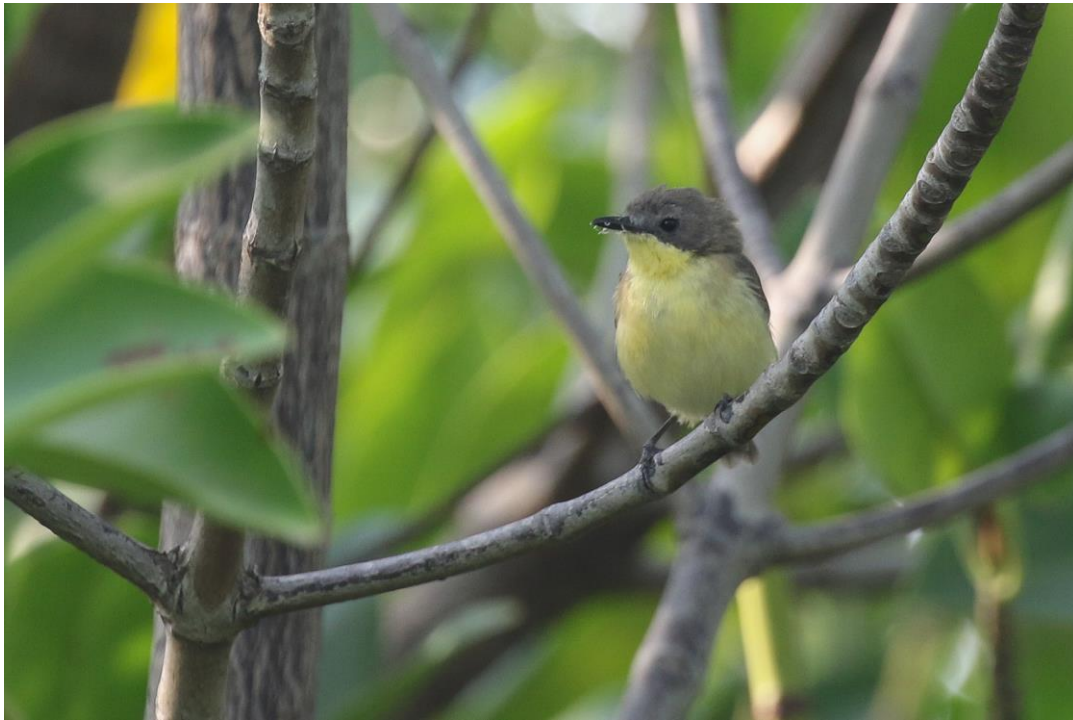
Golden-Bellied Gerygone is bij uitstek een mangrovebewoner