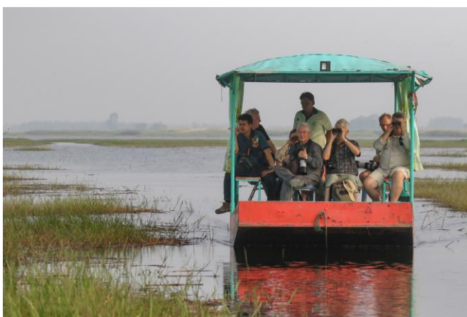
Bootje varen op Bueng Boraphet