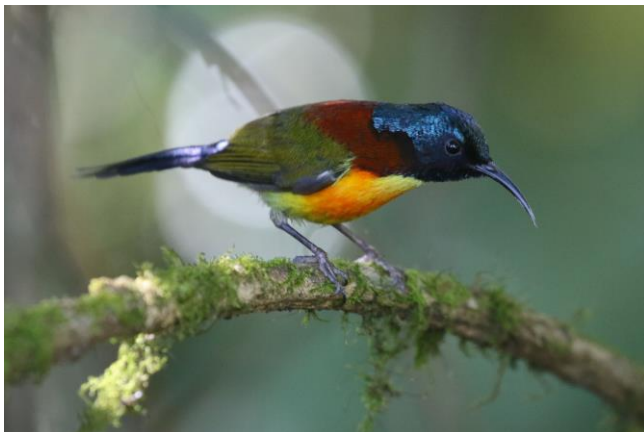
Doi Inthanon Sunbird

Doi Inthanon is het hoogst gelegen National Park van Thailand (2500m). Vandaag vogelen we er de hele dag en dat betekent weer vroeg uit de veren. Na een ontbijt in het prettige hotel rijden we omhoog. De eerste stop is bij een beekje met White-crowned Forktail, Plumbeous Water Redstart en de door vele geliefde White-capped Redstart. Een lekker begin kun je wel zeggen! Maar we gaan door en zien langs de weg o.a. Clicking Shrike-babbler en Bar-throated Minla. En dan komen we bij de broadwalk. Dit is echt een sprookjesachtig vlonderpad door het bos vol hangende mossen en orchideeën op het hoogste deel van Thailand. Vogelen is hier fenomenaal en we zien hier te veel om allemaal op te noemen maar enkele highlights zijn Slaty-bellied Tesia, Himalayan Shortwing, Dark-sided Thrush en Pygmy Cupwing. Even verderop zijn een aantal vogels enorm aan het alarmeren. Er blijkt een Asian Barred Owlet in het bosje langs de weg te zitten, waarschijnlijk aangereden, en zangvogels reageren daar érg fel op. Dat geeft ons de mogelijkheid om wat mooie plaatjes te schieten.