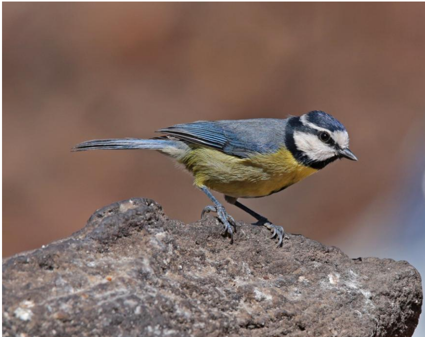
Tenerife Pimpelmees