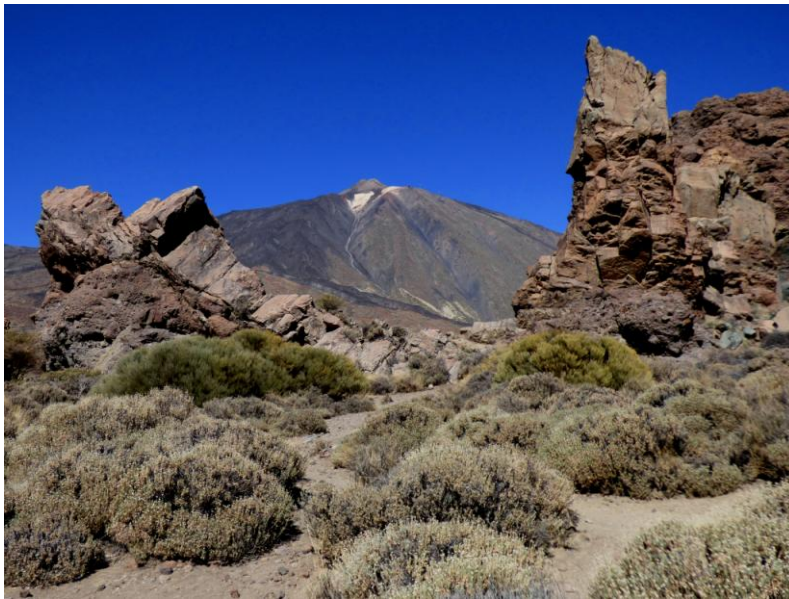
Vulkanisch landschap met de Teide op de achtergrond

als toetje. Bij één van de golfbanen ontdekten we Barbarijse Patrijs, Hop, Koereiger, Grote Gele Kwikstaart, Wintertaling, Watersnip en als vreemde eend in de bijt een luidruchtig Bont Boertje!