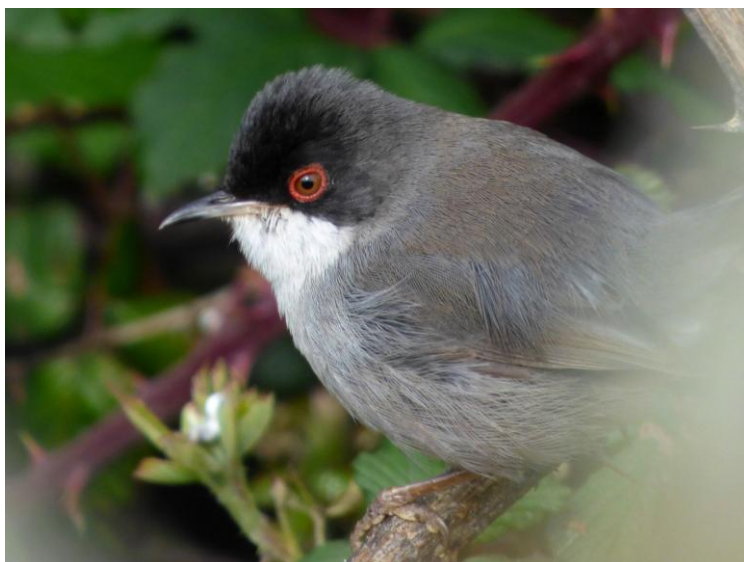
Kleine Zwartkop, mannetje

Vandaag zijn we naar de noordwestelijke punt van Tenerife gereden via een mooie, kronkelige route. De eerste stop maakten we bij Erjos voor een wandeling bij een paar meertjes. De Kleine Zwartkop liet zich mooi zien.