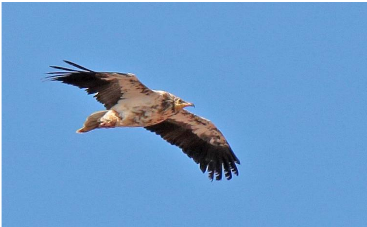
Aasgier, derde kalenderjaar

We besloten om 's ochtends vroeg nog even wat te vogelen voordat we naar het vliegveld vertrokken. We wilden nog eens terug naar het gebiedje waar we de eerste keer de endemische roodborsttapuit hadden waargenomen. We zagen ze wederom, en ditmaal met beter licht. Aasgier, Casarca, Baardgrasmus, Woestijnvink en Palmtortel vormden de "bijvangst". Bovendien vloog hier het groene marmewitje in behoorlijke getale. Niet slecht allemaal! Leuk vogelen hier! Zo kwam een einde aan het vogelgedeelte van deze bijzondere reis.