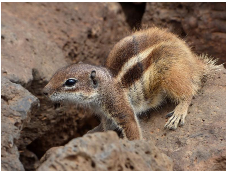
Barbarijse Grondeekhoorn

Op hetzelfde plekje waar gisteren de Barbarijse Valk waargenomen werd keerden we terug om te proberen hem nogmaals te zien en nu voor de hele groep graag. We klommen een heuvel op waardoor we beter zicht over de klifkust verkregen. En daar vloog hij inderdaad. Uiteindelijk zagen we er zelfs twee. En op een gegeven moment vloog er een Barbarijse Valk met prooi. Top! De Barbarijse Grondeekhoorns waren overigens ook heel gaaf.