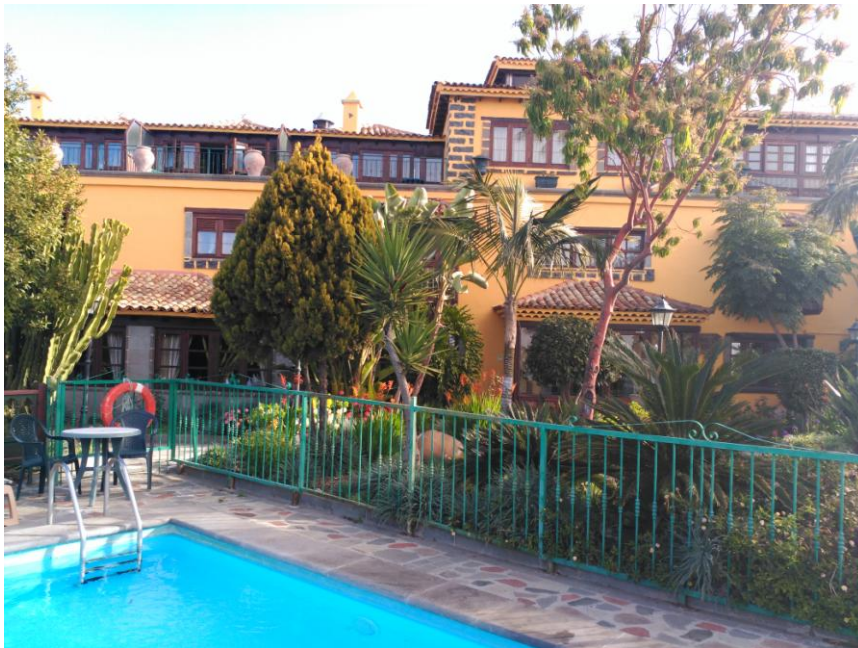
Ons mooie hotel op Tenerife