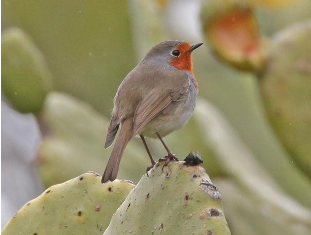
Tenerife Roodborst

Bij de Punta de Teno zochten we naar de Barbarijse Valk en de gelijknamige Patrijs. De laatste werd meerdere malen gespot maar de Valk gaf niet thuis. We genoten bovendien van de indrukwekkende kliffen aan zee. Wat een spectaculair landschap! Bij de vuurtoren speurden we over zee met een formidabel resultaat: uiteindelijk werden een tiental Kleine Pijlstormvogels waargenomen. Dat is heel veel voor zo'n super-zeldzame soort!