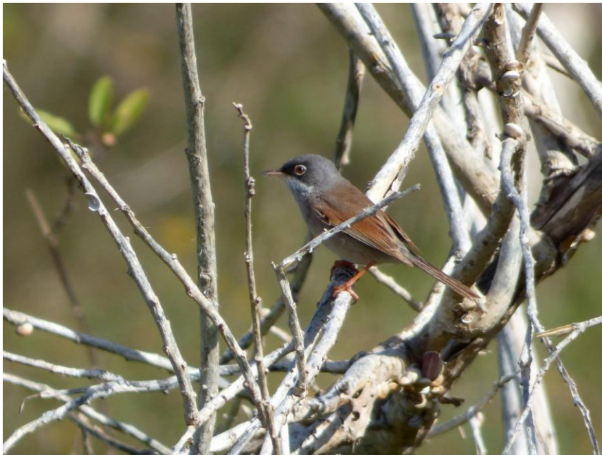
Brilgrasmus, mannetje

Een bezoek aan de halfwoestijn bij La Oliva stond op het programma. We speurden de open, dorre vlakte af op zoek naar zgn. steppevogels. We zagen o.a. Westelijke Kraagtrap, Renvogel en Kleine Kortteenleeuwerik, maar allemaal net iets te ver weg om mooi te kunnen waarnemen. Hoppen zagen we wel bij bosjes en de waarneming van brilgrasmus was ook voortreffelijk.