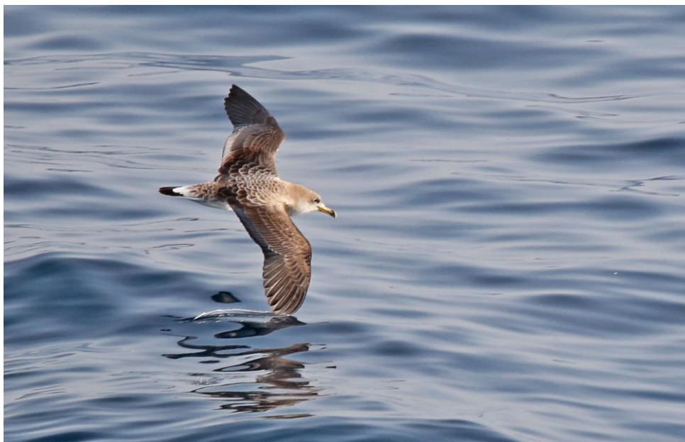
Kuhls Pijlstormvogel

gelegd. Op de terugweg naar de haven van San Sebastián stond een mooie orchidee in bloei, de Canarische Nachtorchis (met dank aan Henk)! En in de haven van de ferry werd een bijzondere vis ontdekt, een Trompetvis. Op de ferry terug naar Tenerife werd wederom gespeurd naar zeevogels en -zoogdieren. Ook dit keer waren de Kuhls Pijlstormvogels weer massaal aanwezig.