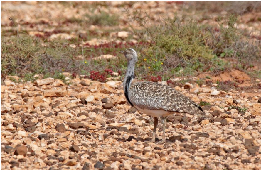
Westelijke Kraagtrap

De Palmtortel was eveneens van de partij. We dronken een kopje koffie bij een fijne bar/cafetaría en deden inkopen voor de lunch. Over onverhade wegen en paden reden we toen verder, maar het werd al behoorlijk warm en de vogels gingen in de dekking. Op weg naar de lunch werd nog wel een westelijke Kraagtrap vlak langs de weg ontdekt. Nu kon iedereen hem naar hartelust bewonderen.