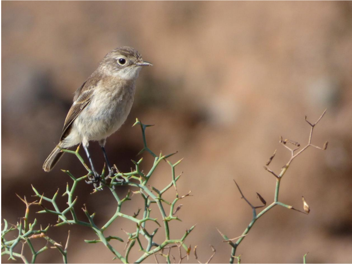
Canarische Roodborsttapuit

Maar nog nog meer interessante soorten zoals brilgrasmus en casarca werden opgemerkt. En over zee vlogen Jan van Gent en Grote Stern. Het logeeradres op Fuerteventura was heel anders dan ons voorgaande hotel. Dit was meer een appartementencomplex rond het zwembad. Het avondeten was type buffet, niet zo lekker als in het vorige hotel, maar wel sneller geserveerd!