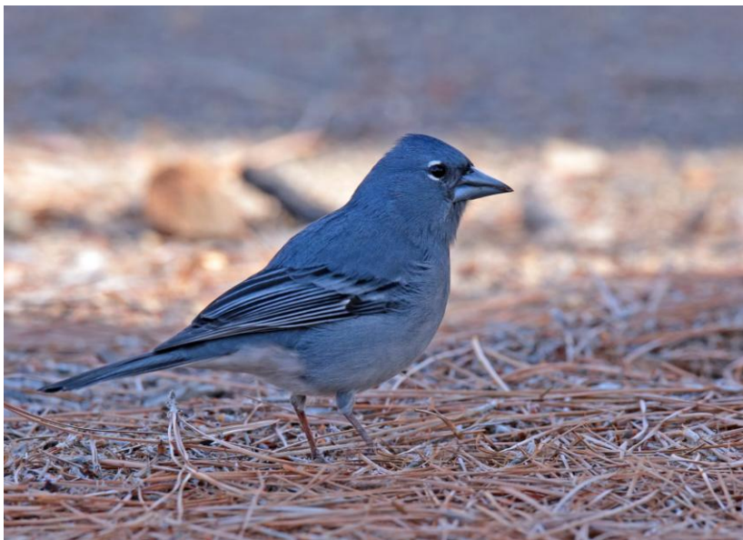
Blauwe Vink, mannetje

Na het uitgebreide ontbijt reden we naar een uitzonderlijk grote Canarische Den in het natuurpark van de "Corona Forestal". De kanaries vlogen ons om de oren en lieten in grote getale van zich horen. De Canarische goudhaan werd goed bestudeerd, want ook die is weer duidelijk anders, evenals de roodborst en de zwartkop klinkt ook anders. Vervolgens reden we naar een picknickplaats in hetzelfde dennenbos. Hier maakten we een korte wandeling. Ver kwamen we echter niet want al snel hadden we een Blauwe Vink in het vizier. Deze bijzondere endemiet liet zich uiteindelijk zeer goed zien en fotograferen.