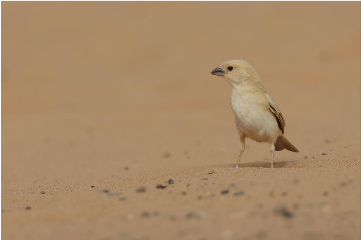
Figuur 15. Vrouwtje Woestijnmus.

De dag is dan nog lang niet voorbij! De volgende stop? Afrikaanse Woestijngrasmus. We lopen weer in linie door een stuk met wat meer vegetatie. Hoe hij het doet, doet hij het, maar wie anders dan Rudy vindt er uiteindelijk eentje, die zich na wat moeite mooi laat zien.