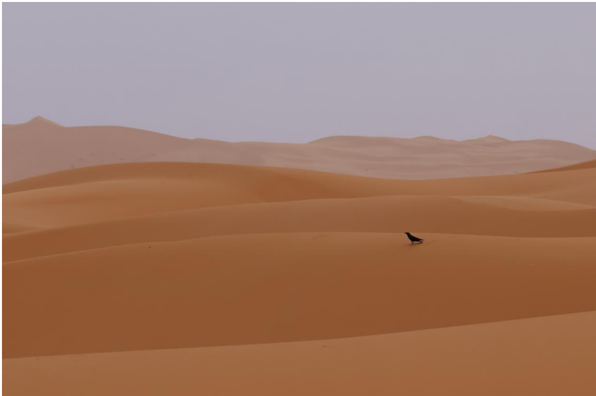
Figuur 8. Bruinnekraaf in de Sahara bij Merzouga