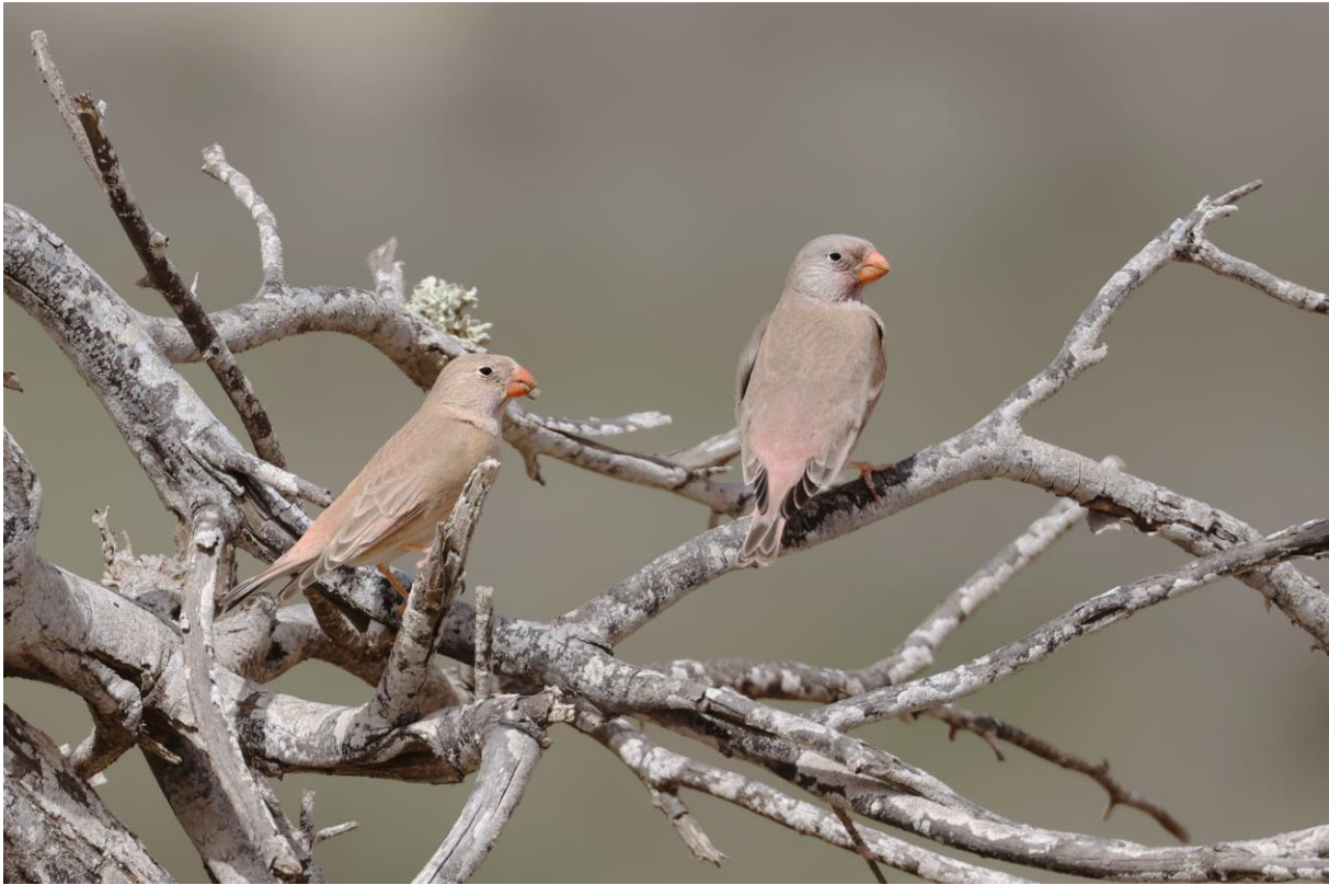
Figuur 26. Woestijnvinken: de beste waarneming van deze soort bewaarden we voor de laatste volle dag.