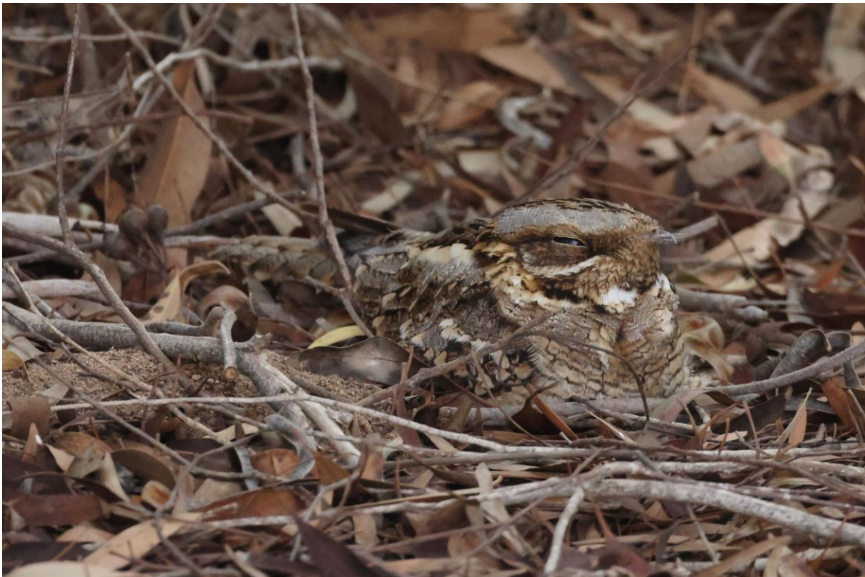
Figuur 25. Moorse Nachtzwaluw

het pad af mag. Hij dreigt met bekeuringen, 4000 Dirham bluft hij. Ik breng wat corruptie in de praktijk (foei) en geef hem een honderdje. Dan is het goed. We eindigen de wandeling op het strand, waar Hichem ons opwacht in het dorpje. Na de lunch (die een eeuwigheid duurt om te bereiden) meldt Rudy als we de bus instappen twee Renvogels. Ik til mijn verrekijker op en zie twee Grielen. Verwarring alom, maar uiteindelijk zijn beide soorten in hetzelfde kijkerbeeld te zien.