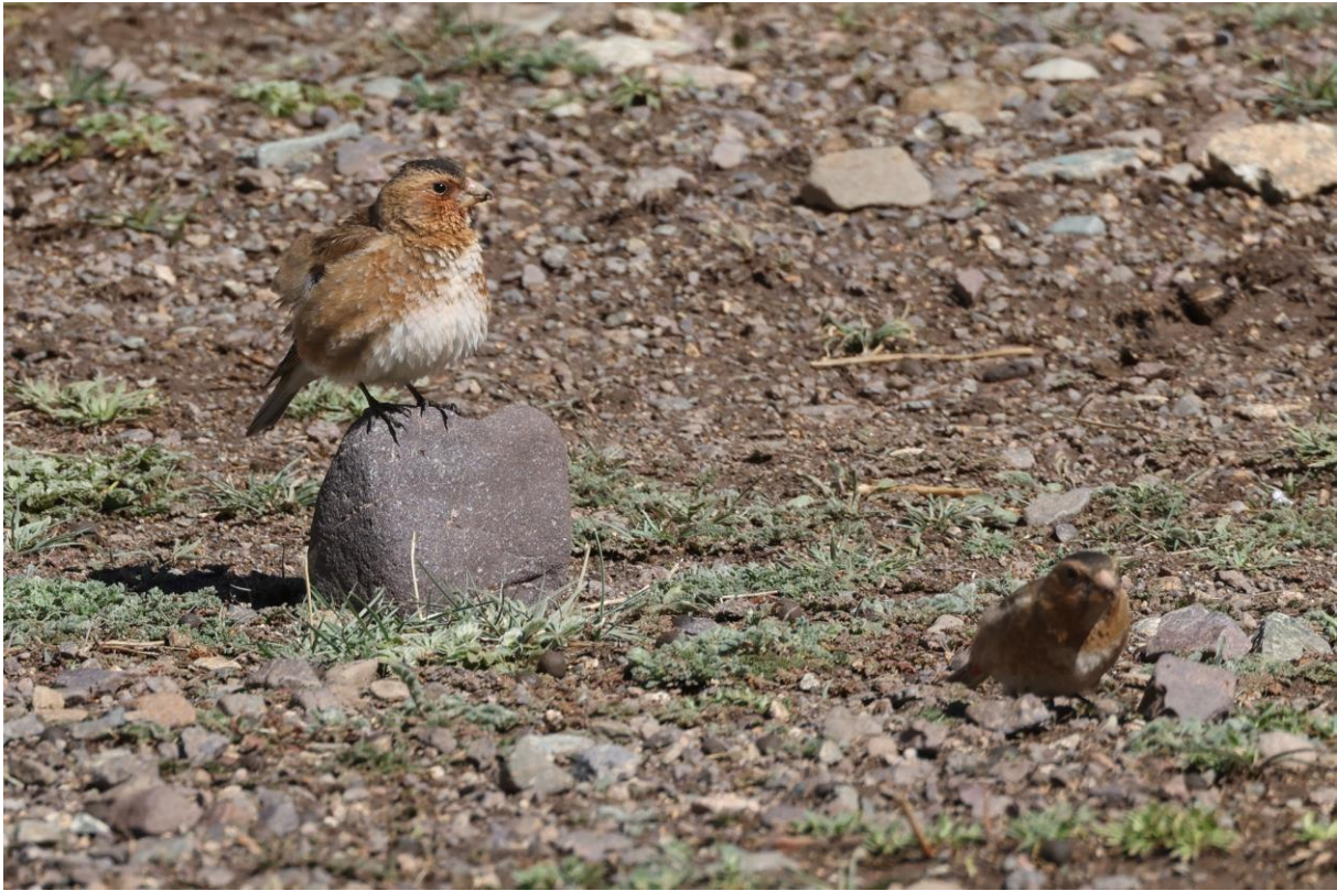
Figuur 3. Mannetje Afrikaanse Bergvink