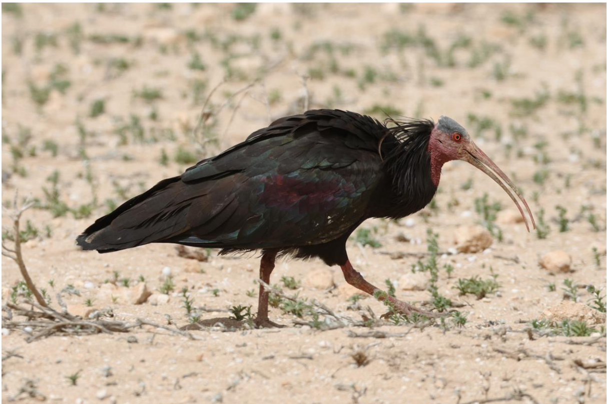
Figuur 23. Heremietbis. Niet moeders mooiste, wel een gaaf beest.

We kunnen nu vrij spelen en struinen de kust af. Maar niet voordat we koffie hebben gedronken bij wat vrije surfersgeesten. Die wordt geschonken vanuit de achterbak van een minimaal 30 jaar oud autootje. Iemand die een T-shirt van mijn stad draagt kan ik natuurlijk niet zo maar negeren! Lekkâh