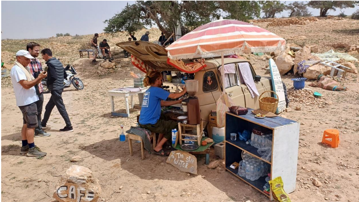
Figuur 24. Roadside koffie. Iemand met een T-shirt waar The Hague op staat, kun je natuurlijk blindelings vertrouwen.