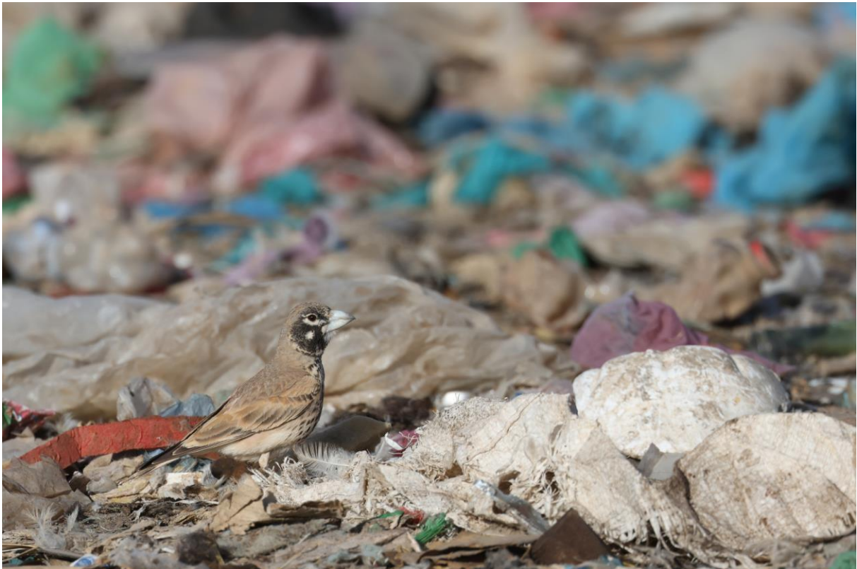
Figuur 7. Maar dit is hetzelfde mannetje, in een heel andere omgeving!

De laatste uurtjes van de dag vogelen we in de groene vallei in het hart van Boumalne, waar nog wat water door de rivier stroomt. Heerlijk om even de woestijn uit te zijn! En schaduw, pfff. Er zitten veel vogels, louter andere soorten dan in de woestijn ook. Er zitten zelfs Grote Bonte Spechten! Alles zingt. Westelijke Vale Spotvogels zijn het hoogtepunt, al duurt het even voordat we ze bevredigend zien en