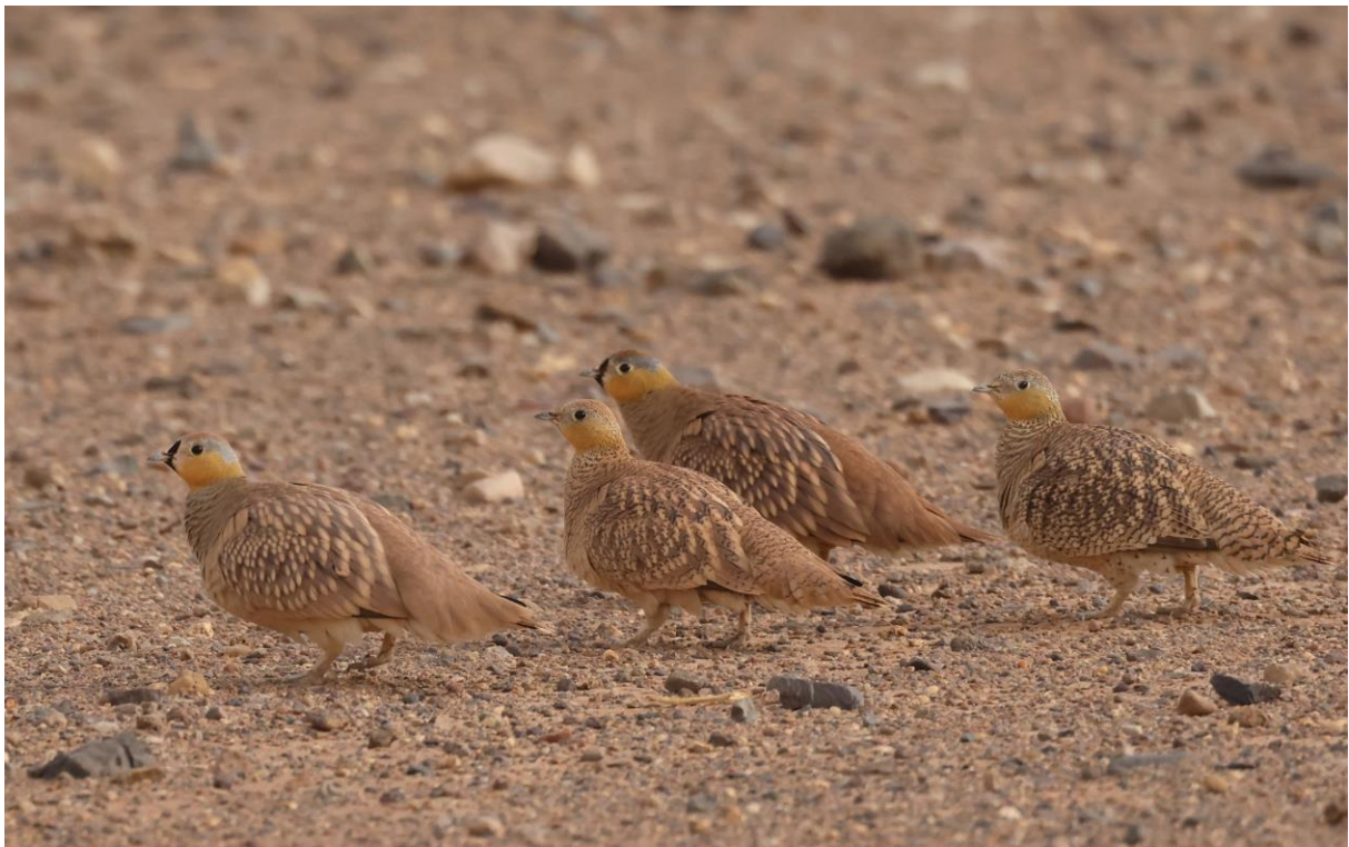
Figuur 10. Kroonzandhoenen, twee mannetjes en twee vrouwtjes.

Vandaag is De Grote Woestijndag. Misschien wel de beste van de reis. Met lokale gids Hamid trekken we met drie terreinwagens de zandbak in voor de Saharaspecialiteiten. Stop 1 is bij een poel waar zandhoenen komen drinken, die daar vele tientallen kilometers voor afleggen. Al snel is het raak. Sahel- en Kroonzandhoenen, laten zich prachtig zien én horen. Voor velen van ons (in elk geval voor mij!) het hoogtepunt van de reis. Opvallend is dat Sahel- in minder, maar veel grotere groepen voorkomt, en de Kroonzandhoen in meer, veel kleinere groepjes voorkomt. De Sahelzandhoenen zijn veel onrustiger. Regelmatig spreiden ze hun staarten en ze roepen vaak. We blijven tot ze allemaal vertrokken zijn.