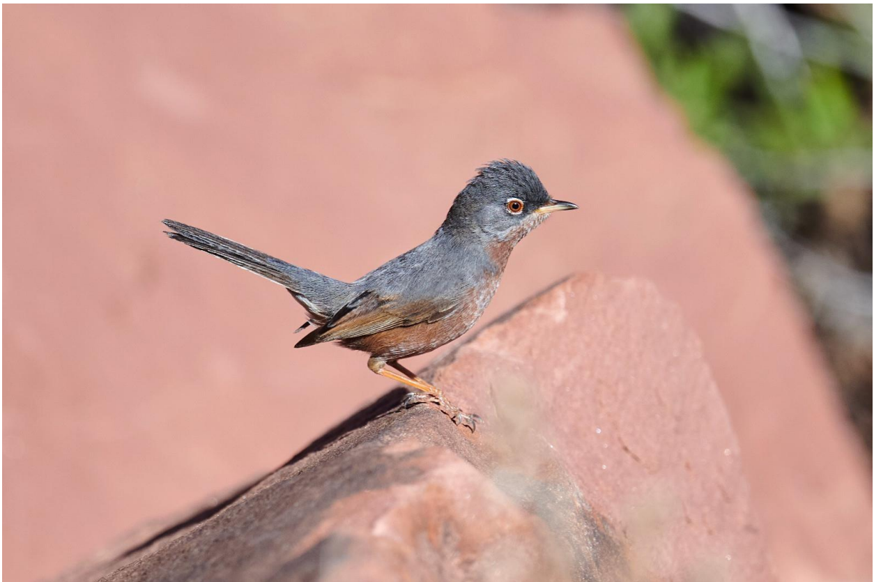
Figuur 4. Mannetje Atlasgrasmus (Jasper Lamers)