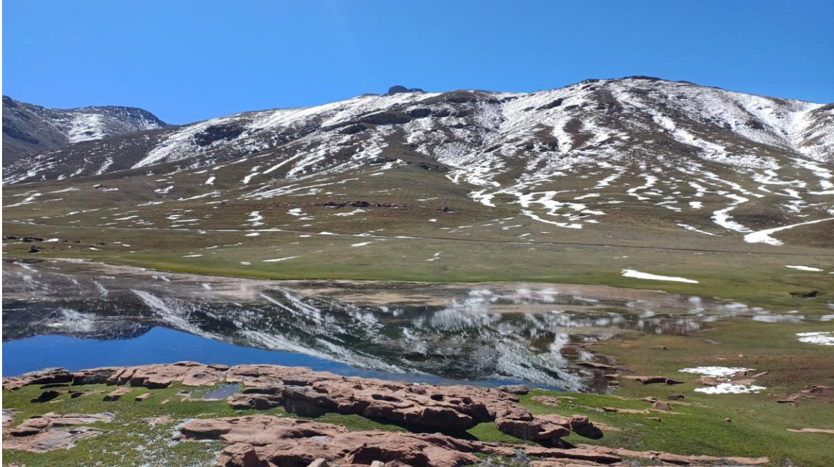
Figuur 2. Oukaimeden

Na een korte kennismaking verlopen de plichtplegingen op Schiphol soepel. Er blijkt echter iets mis met ons vliegtuig als we wachten bij de gate. Er moet een ander toestel komen en dat zorgt voor twee uur vertraging. Vogeltijd missen we gelukkig niet, het zou hoe dan ook donker zijn bij aankomst in Marrakech. We hebben een verlaat diner met de eerste van vele heerlijke tajineschotels. Nadat we allemaal naar tevredenheid hebben gegeten, proberen we zonder succes Maghrebosuil in een nabijgelegen stadspark te vinden. Daarna gaan we snel naar bed.