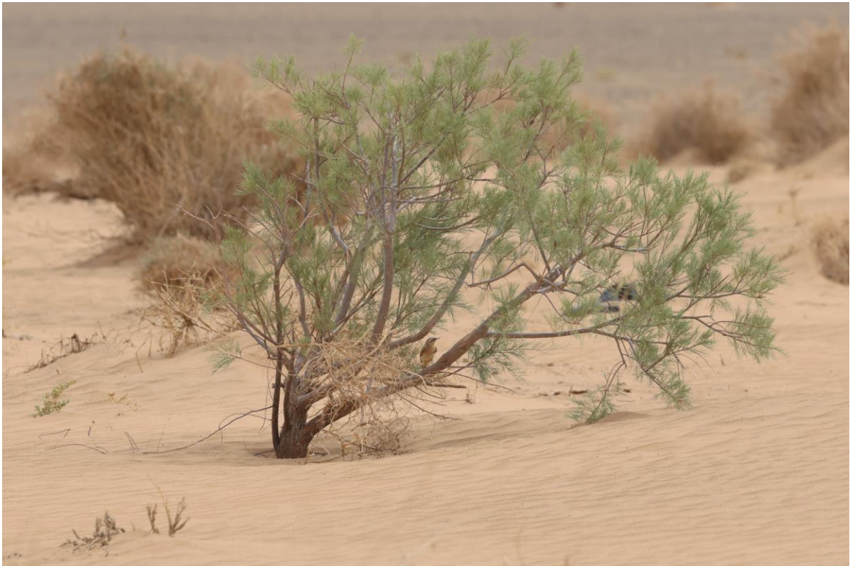
Figuur 18. Draaihals in het enige boompje op een zeer smalle strook met wat vegetatie, in een verder kale woestijn.

een Draaihals. Hier, aan de rand van de Sahara, wordt voor mij pas echt invoelbaar wat voor een keiharde tocht 'onze' trekvogels maken. We vonden een dag eerder niet voor niets ook al een dode Draaihals.