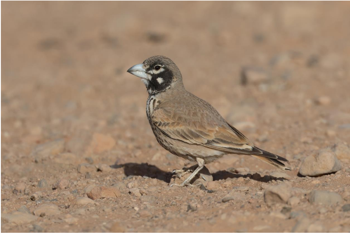
Figuur 6. Een mannetje Diksnavelleeuwerik in de woestijn van Boumalne Dades, 'zoals het hoort'.