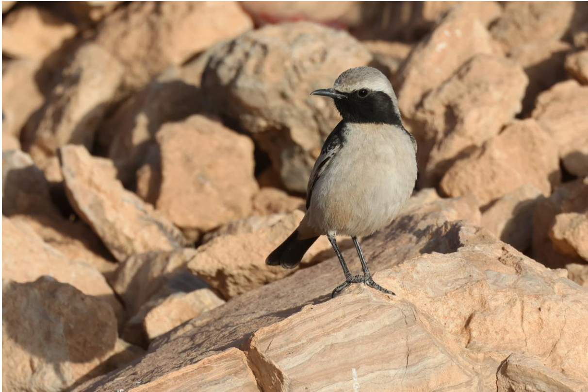
Figuur 1. Roodstuittapuit, mannetje: één van de doelsoorten van de reis.

Van de echte specialiteiten gaf alleen de Maghrebboosuil (ondanks pogingen) niet thuis. Atlasvliegenvanger was nog niet terug in de broedgebieden. Van de soorten uit 'de tweede lijn' misten we Brilgrasmus. Al met al zagen we dus nagenoeg alle specialiteiten.