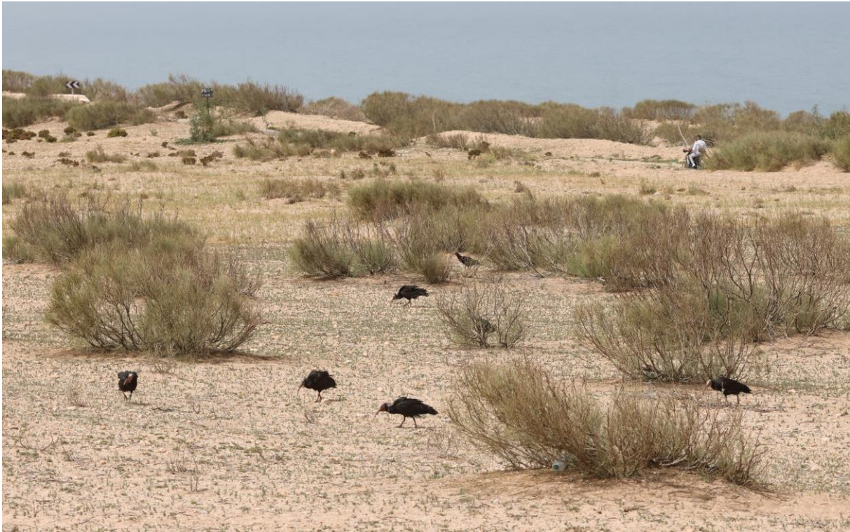
Figuur 22. Heremietibissen langs de weg.