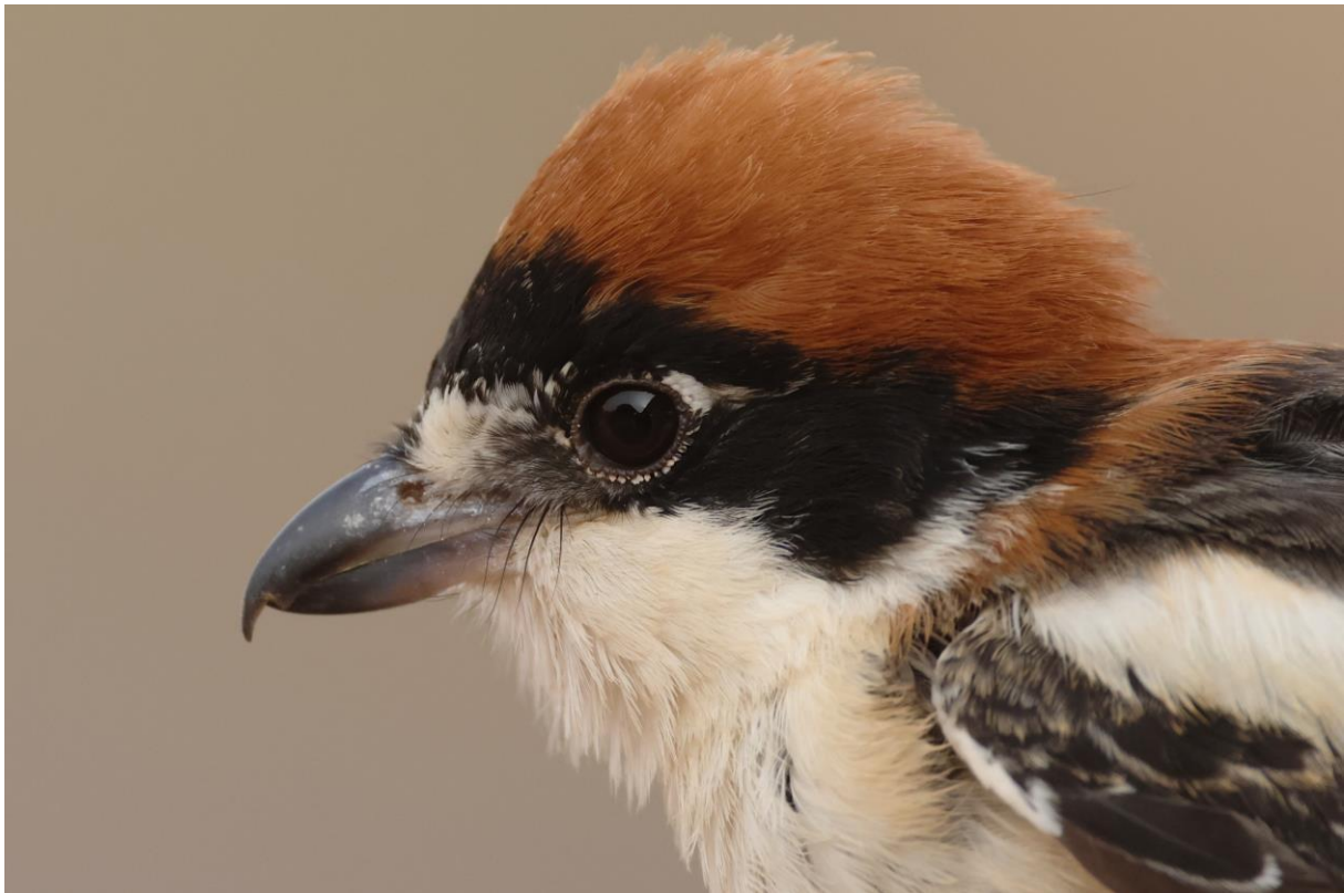
Figuur 21. Roodkopklauwier was één van de vogels die door de ringers in Merzouga werd gevangen.