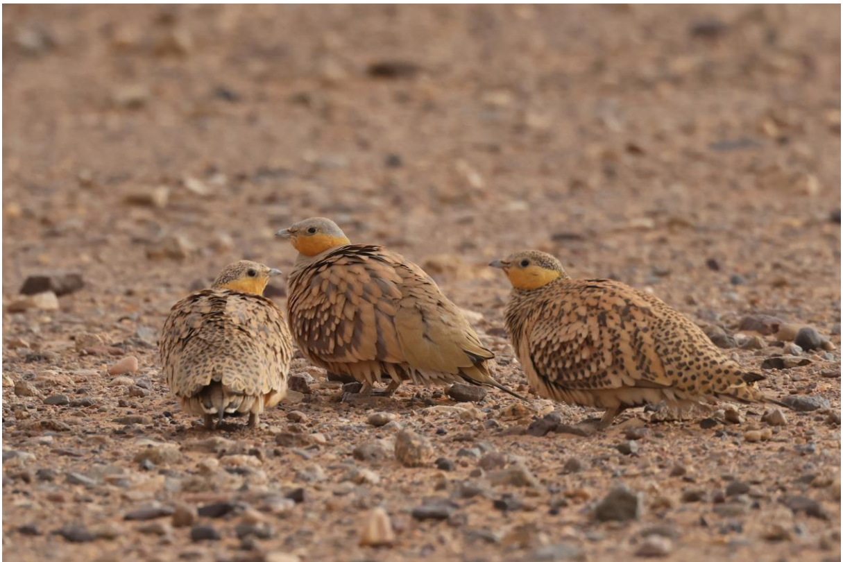
Figuur 12. Sahelzandhoenen, een mannetje en twee vrouwtjes.