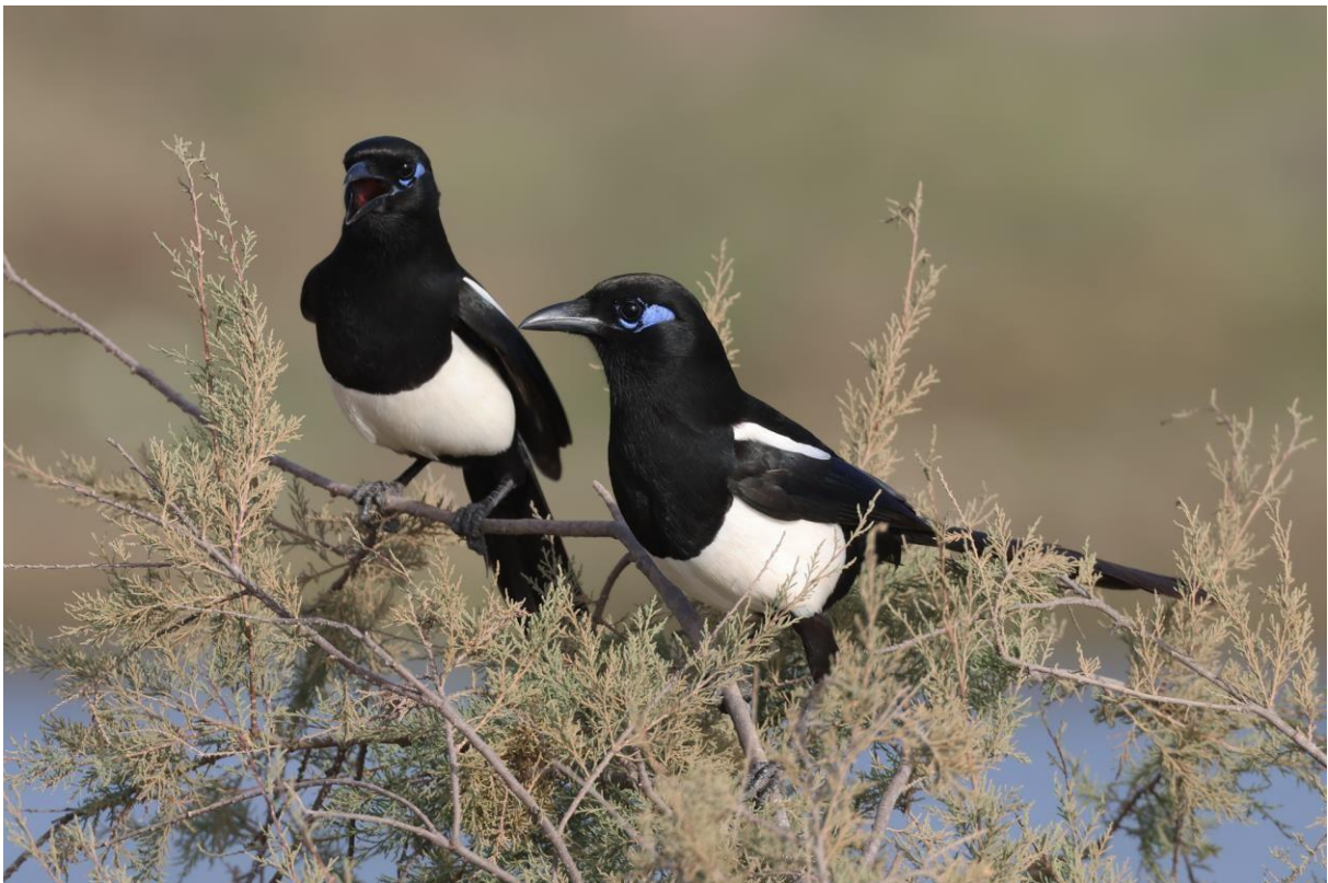
Figuur 27. De opvallende Maghrebekster wordt tegenwoordig als aparte soort beschouwd