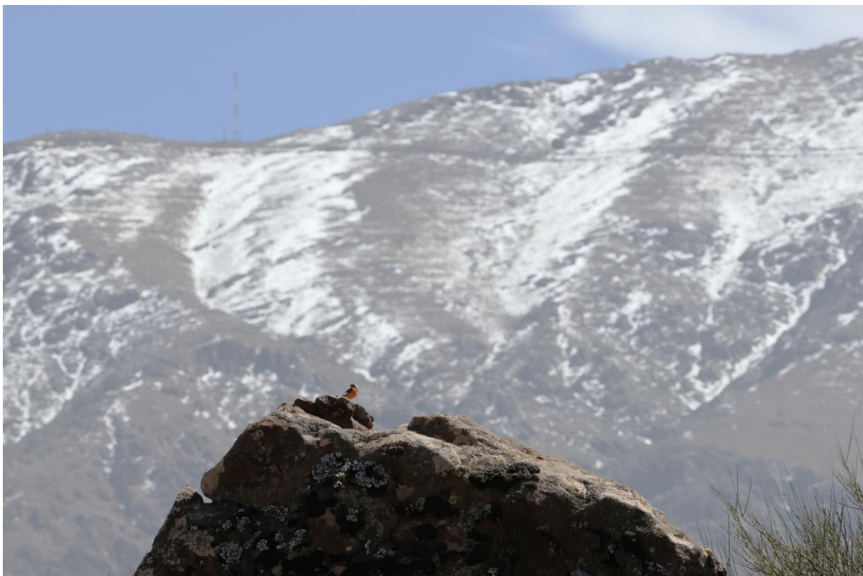
Figuur 29. Diadeemroostaart in de Atlas.