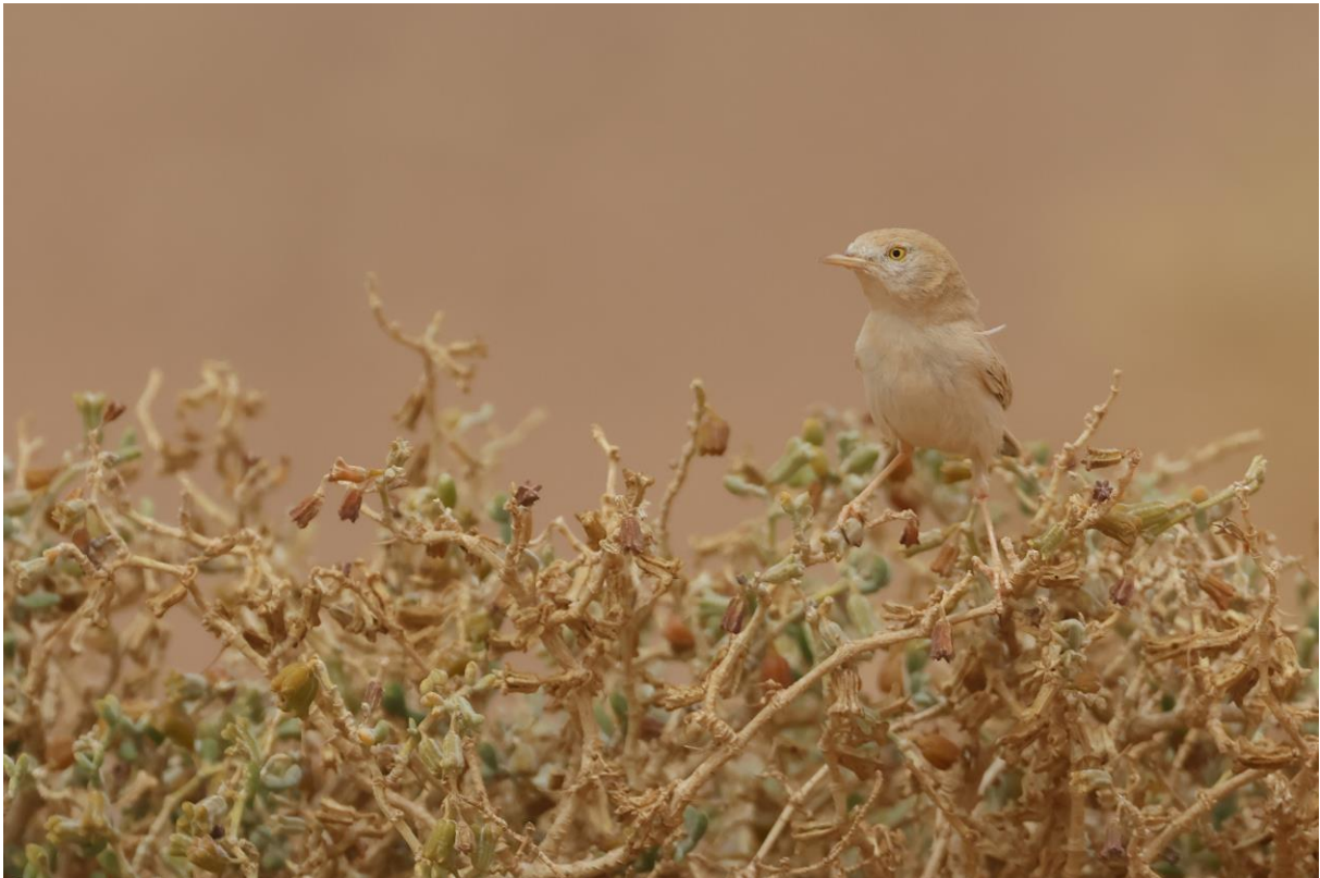
Figuur 16. Afrikaanse Woestijngrasmus.

De dag is dan nog lang niet voorbij! De volgende stop? Afrikaanse Woestijngrasmus. We lopen weer in linie door een stuk met wat meer vegetatie. Hoe hij het doet, doet hij het, maar wie anders dan Rudy vindt er uiteindelijk eentje, die zich na wat moeite mooi laat zien.