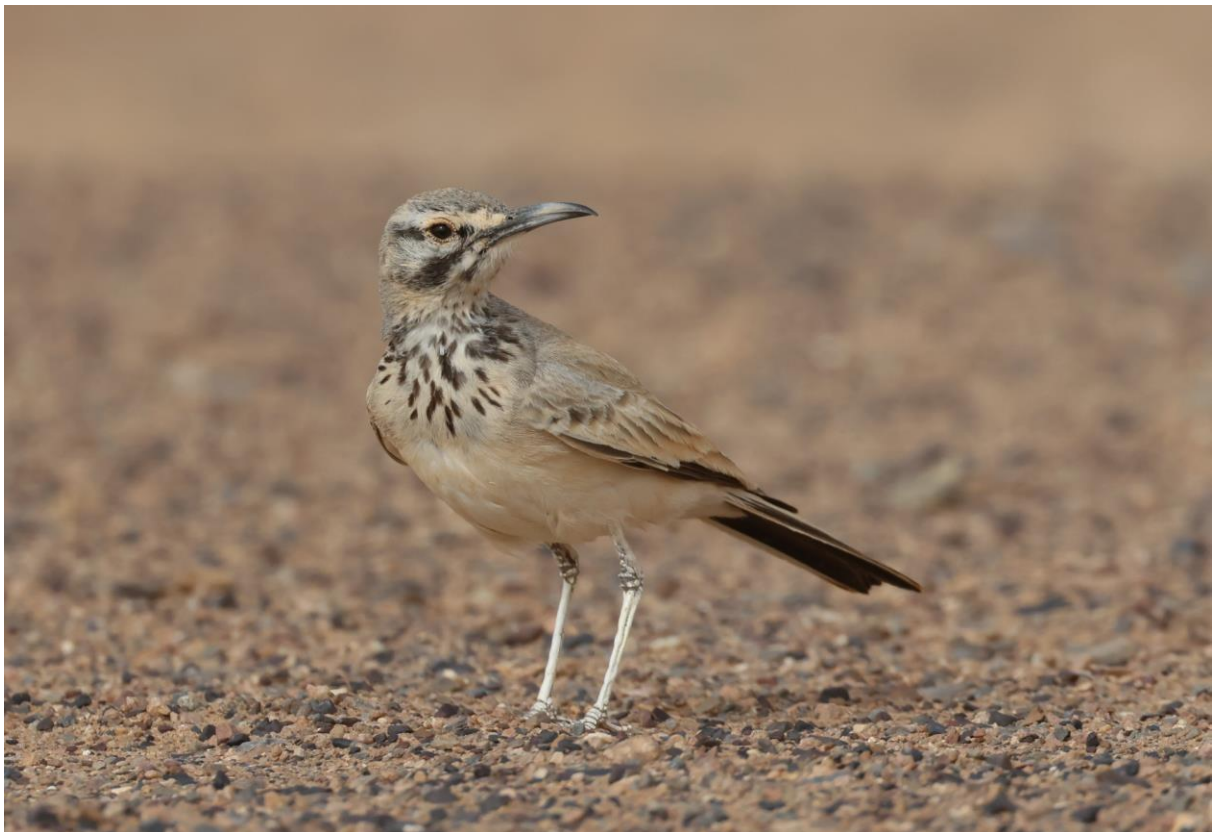
Figuur 14. Mannetje Witbandleeuwerik.

De volgende stop is bij een bedoeïenenhut. Een gesluisde vrouw gooit wat koek- en chipskrumels op de grond en opeens zitten we op soms slechts twee meter afstand naar drie Woestijnmussen en twee Witbandleeuweriken te kijken. Fantastisch! Als onze foto's genomen zijn, krijgen we nana (mierzoete thee) in de verrassend koele lemen hut. We kopen souvenirs en geven een passende fooi als dank.