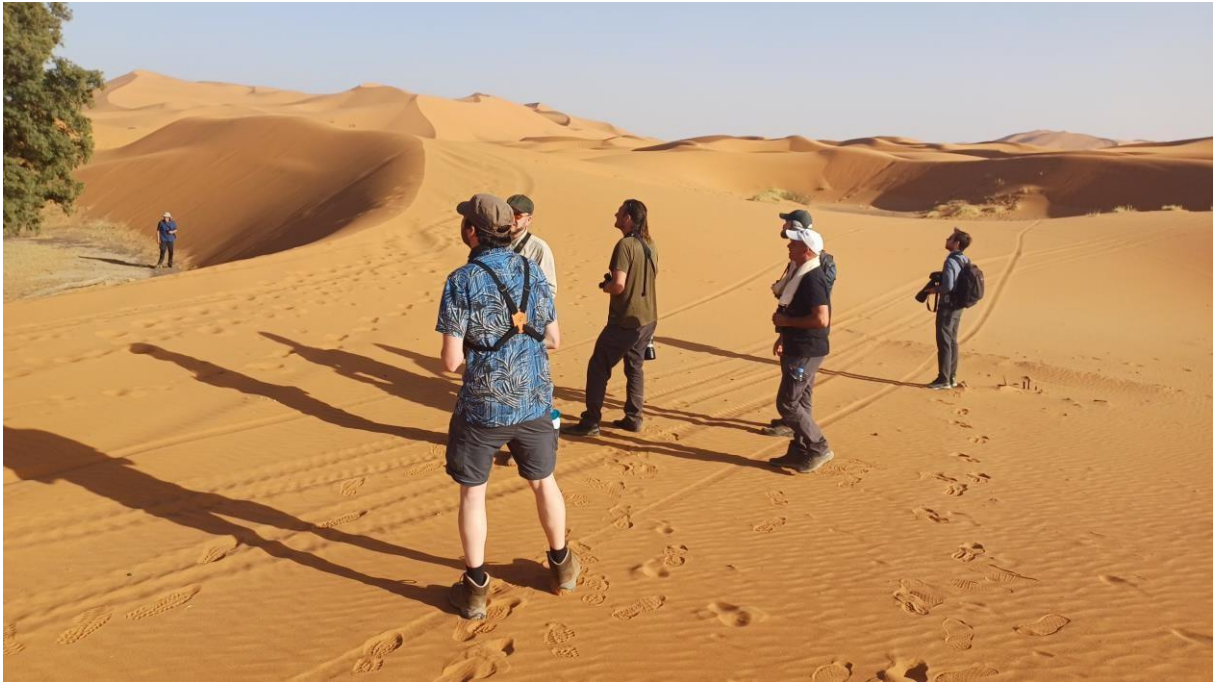
Figuur 9. Zoeken naar de roepende (in de) Woestijnmus achter ons hotel.