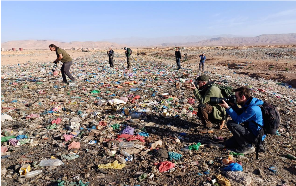
Figuur 5. Oké, we vogelden niet alleen maar in mooie habitats....