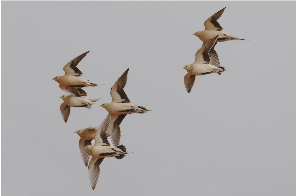
Figuur 13. Nog eentje dan, omdat ze zo mooi zijn: Sahelzandhoenen in de vlucht.

De volgende stop is bij een bedoeïenenhut. Een gesluisde vrouw gooit wat koek- en chipskrumels op de grond en opeens zitten we op soms slechts twee meter afstand naar drie Woestijnmussen en twee Witbandleeuweriken te kijken. Fantastisch! Als onze foto's genomen zijn, krijgen we nana (mierzoete thee) in de verrassend koele lemen hut. We kopen souvenirs en geven een passende fooi als dank.