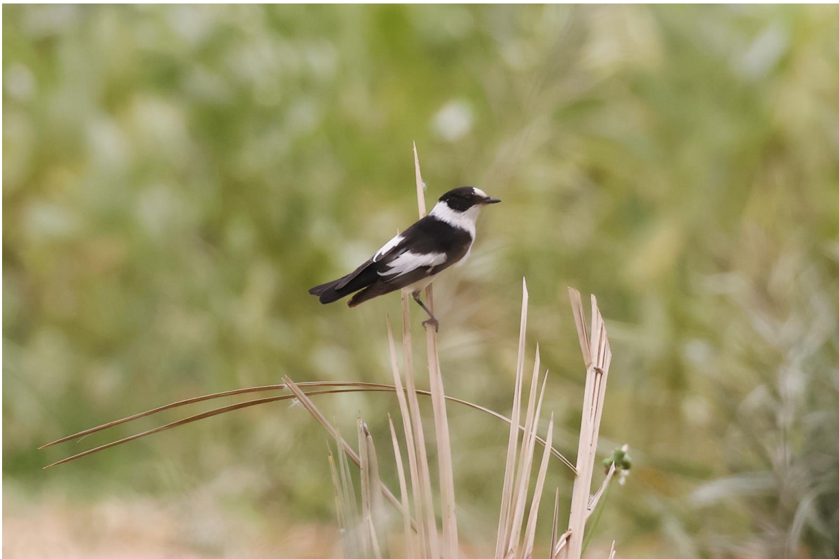
Figuur 19. Verrassing: een mannetje Withalsvliegenvanger, een zeldzaamheid in Marokko.