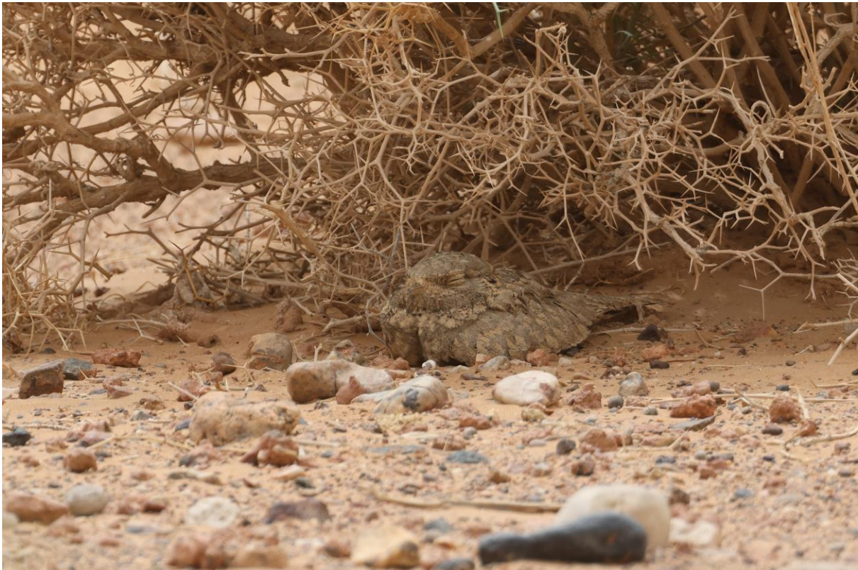
Figuur 17. Egyptische Nachtzwaluw. Met dank aan een lokale bewoner, die de vogels opspoot op dagen dat er vogelaars komen.

Tijd om uit te blazen en alles rustig te verwerken hebben we niet. Want we staan alweer bij een volgende plek. Een lokale bewoner zoekt de overdag slapende Egyptische Nachtzwaluw als er vogelaars langskomen. We kunnen zo aanschuiven.