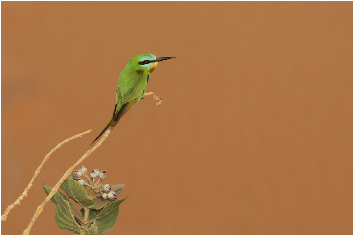
Figuur 28. Groene Bijeneter in de zandduinen van Merzouga, die voor de zachte achtergrond zorgen.