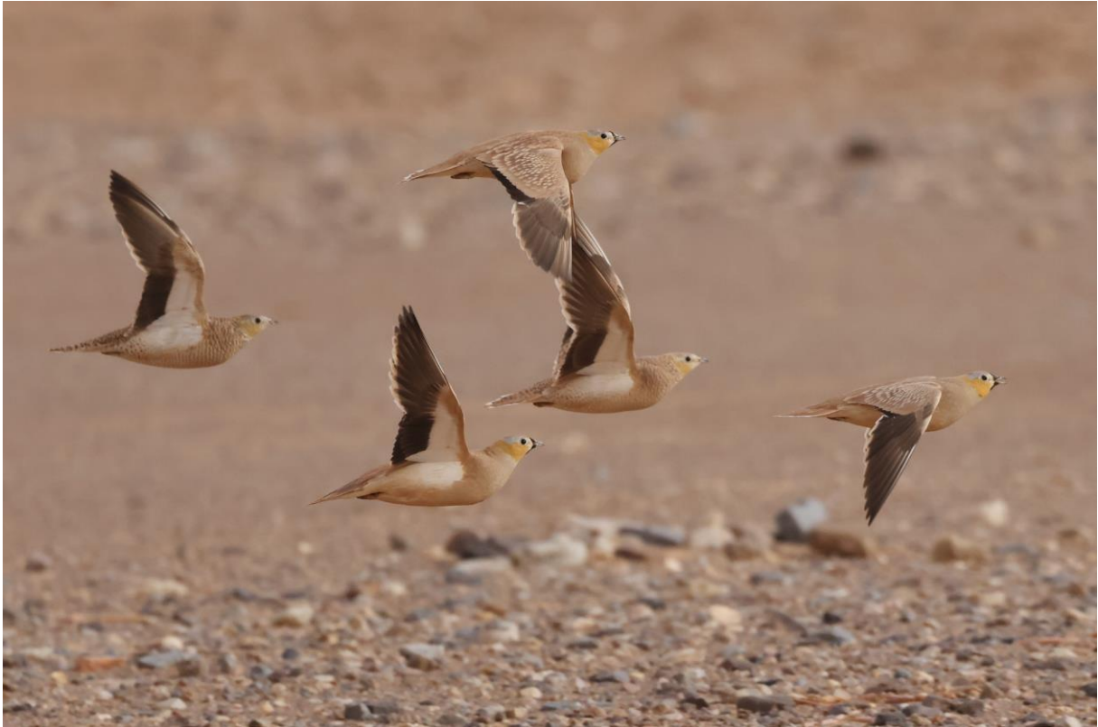
Figuur 11. Kroonzandhoenen