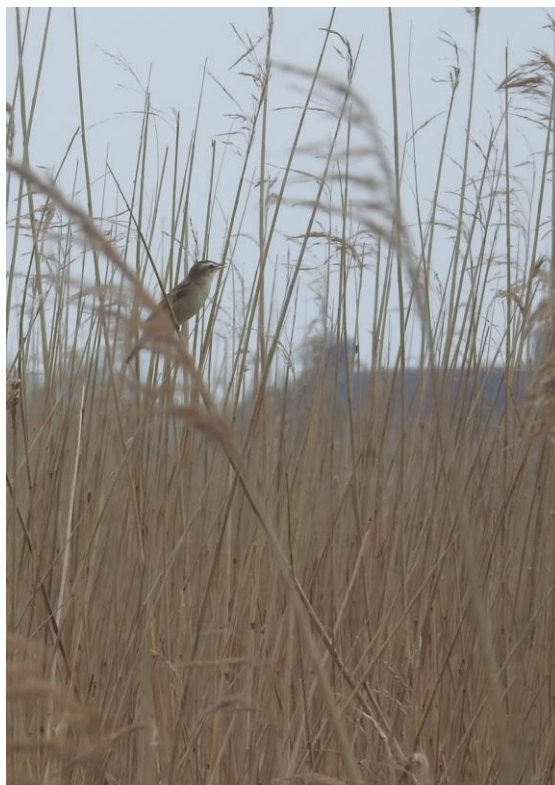
Rietzanger (Beb Martens)

Jaap Deensgat is het Groningse equivalent van de Friese Ezumakeeg. Het water is hier echter wat dieper, waardoor je er weer andere soorten tegenkomt. Bij aankomst zien we vrijwel meteen enkele mooie baardmannetjes rondscharrelen aan de rand van een slootje. Rietzanger en kleine karekiet zingen vlak naast elkaar, waarmee de zang van beide soorten mooi kunnen vergelijken. Vanuit de kijkhut zien we groepjes kleine en grote mantelmeeuwen, een enkele goudplevier die wegvalt tegen het korte gras aan de rand van het Deensgat en een groepje lepelaars. Bij een uitkijkpunt verder in het gebied kunnen we ons vergapen aan een zingende blauwborst door de telescoop. Ook wiekelt er op grote hoogte een zwarte wouw langs, een leuke verrassing!