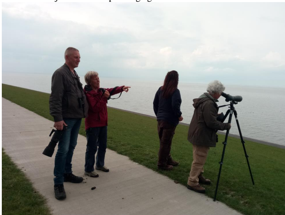
Vogelen aan de Noordkaap van Nederland (Paul van Els)

Bij het Ballastplaatbos hebben we deze ochtend meer succes met de wielewaal, en na een mini-expeditie binnen het populierenbos zien we uiteindelijk allemaal verschillende exemplaren, hoewel stilzittende vogels lastig zijn te vinden. In de haven van Suyderoogh vinden we in het zonnetje ook enkele prachtige geoorde futen.