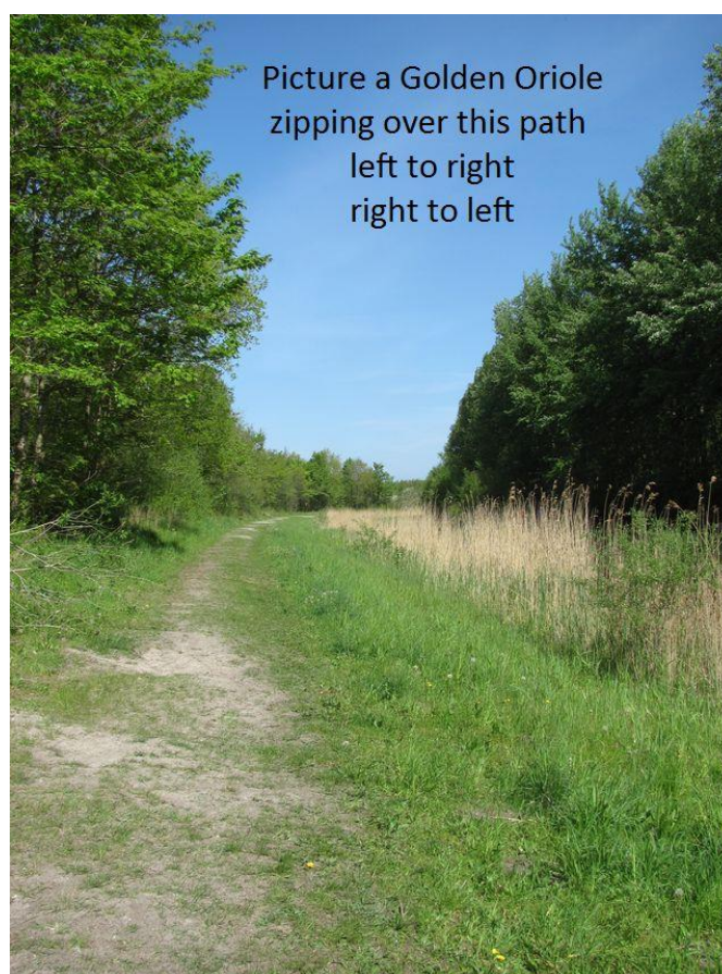
Ode aan de wielewaal (Leslie Hadlock)