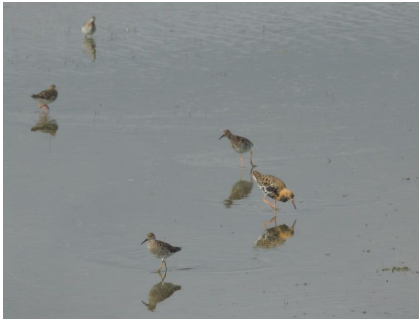
Kemphaan en -hennen in de Ezumakeeg (Beb Martens)

Hier worden we verrast door enorme hoeveelheden eenden, met leuke verrassingen als zomertaling, een viertal late toppers, en een brilduiker in eclipskleed. Bruine kiekendieven vliegen af en aan, en in de verte vliegt een zeearend over het populierenbos, een slechtvalk heeft het gemunt op een groepje bonte strandlopers. We worden verrast door steeds opnieuw invallende nieuwe soorten, waaronder kleine en Temminck's strandloper, wulp en groenpootruiter. Een rietzanger houdt ons even voor de gek met een meesterlijke imitatie van een baardmanneling. Inmiddels is het weer opgeklaard, schijnt het zonnetje en is het echt warm geworden. We proberen nogmaals de hut aan de noordkant, waar een tweede, dichterbij vliegende zeearend op ons wacht, en de aantallen steltlopers alleen nog maar meer zijn aangezweld. Een mannetje krombekstrandloper in vol broedkleed recht voor de hut roept de aandacht. Bij het terugkeren voor het avondeten zien we een enorme groep rotganzen in de Bantpolder staan, die nauwkeurig maar tevergeefs worden afgespeurd voor een witbuikig of zwart individu. Niet slecht voor een regenachtige middag in Nederland! Tijdens het avondeten vloeit de wijn en het bier al rijkelijk, en onder het eten van een heerlijk nagerecht nemen we onze lijst door.