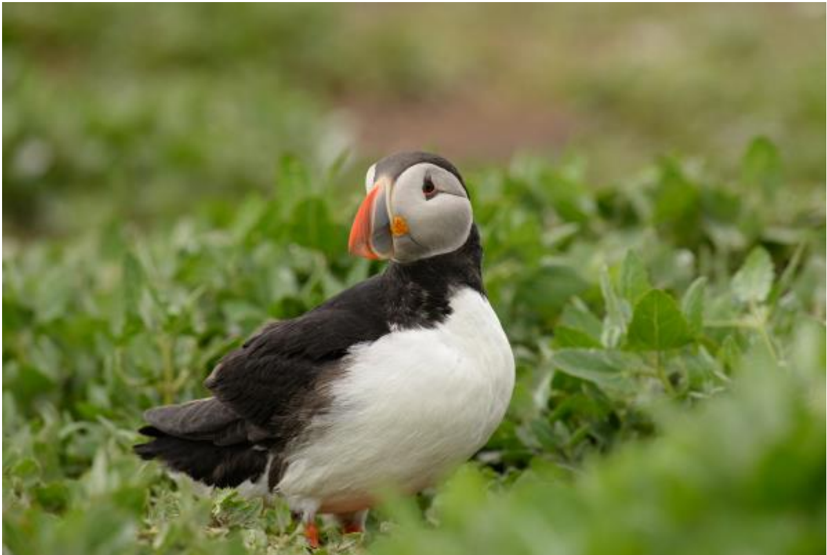
Foto: Papegaaiduiker tussen de vegetatie rond het nesthol.