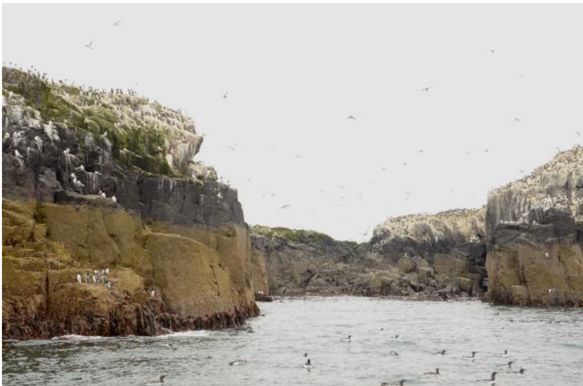
Foto: Kliffen met vele duizenden zeevogels.

Seahouses. Waardoor we moeten zoeken naar een parkeerplaats. De groep gaat zich alvast aanmelden voor de excursie, als de reisleader een oplossing zoekt. Uiteindelijk kunnen parkeren én een parkeerkaart kunnen regelen én op tijd bij de groep kunnen voegen bij de boot... Pfff! Al snel varen we het haventje uit, waar we de eerste eidereenden al tegen komen. Er zijn zowel mannetjes als vrouwtjes, sommige met jongen. Het duurt daarna niet lang voordat we de eerste zeevogels zien; zeekoeten, papegaaiduikers, Noordse stormvogels, aalscholvers, drieteenmeeuwen, van alles drijft op het water en scheert door de lucht. Naar mate we de eilanden naderen worden de aantallen steeds groter. De groep geniet zichtbaar. We varen via Inner Farne naar Staple Island om noordelijk te gaan naar Wamses en Longstone (de buitenste cluster eilanden). De schipper vaart ons langs slapende grijze zeehonden (ook wel Atlantische zeehond genoemd, tussen de 3000-5000 op de eilanden) en langs kliffen vol zeevogels. Vele, vele duizenden roepende, vliegende, broedende, stinkende, vissende en vechtende vogels! De camera's klikken en hoofden gaan van links naar rechts. Wat een overdaad!