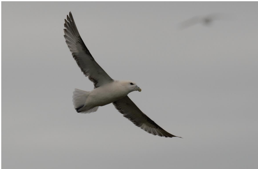
Foto: Een Noordse stormvogel in de vlucht

Sommige van de deelnemers zoeken op het grote water nog naar walvissen, dolfinen en zeevogels. Ondanks dat het 's avonds op het dek al snel afkoelde, zijn nog wel diverse Jan-van-Genten, Noordse stormvogels en meeuwen gezien. Walvissen helaas niet...