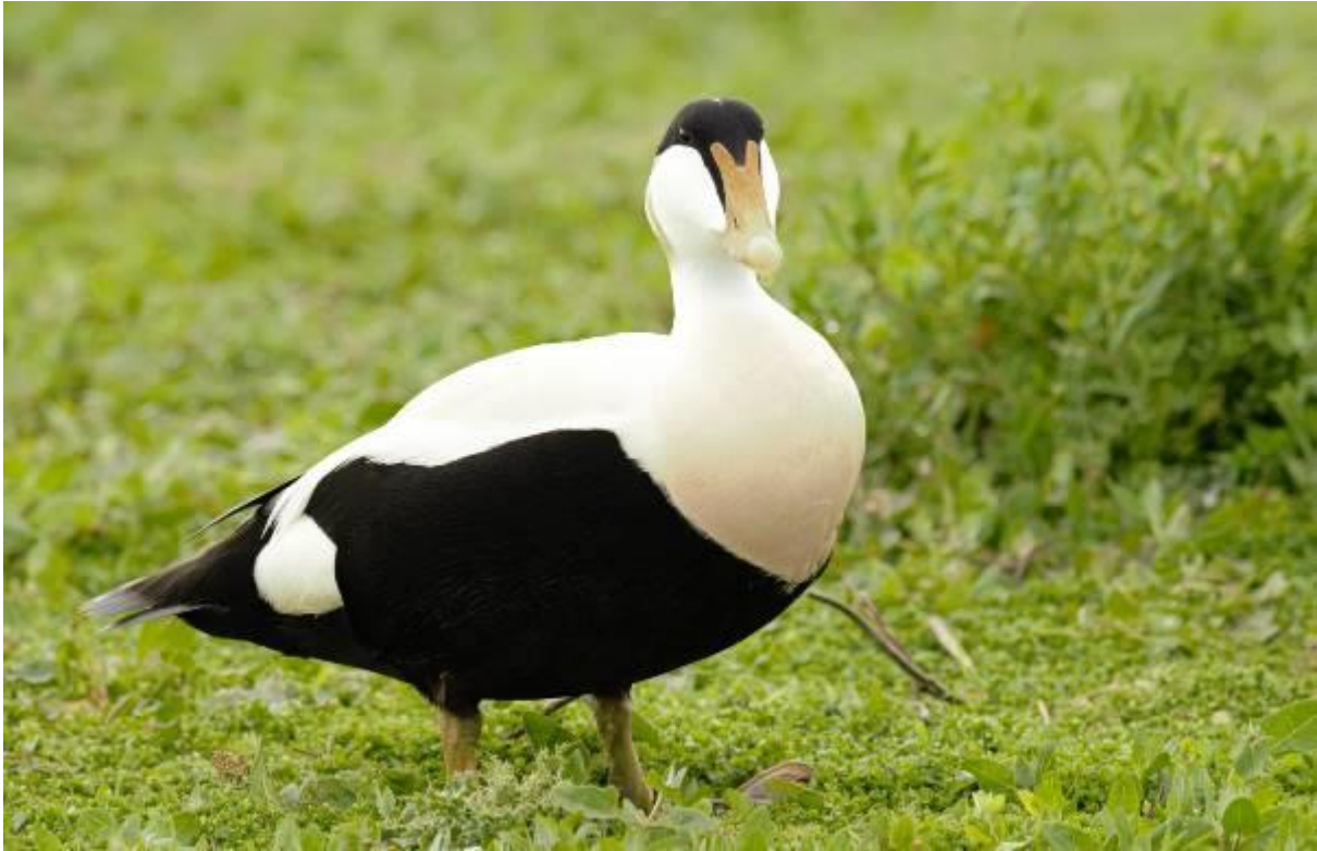
Foto: Er broeden ook eidereenden op de eilanden. Hier een mooi mannetje.