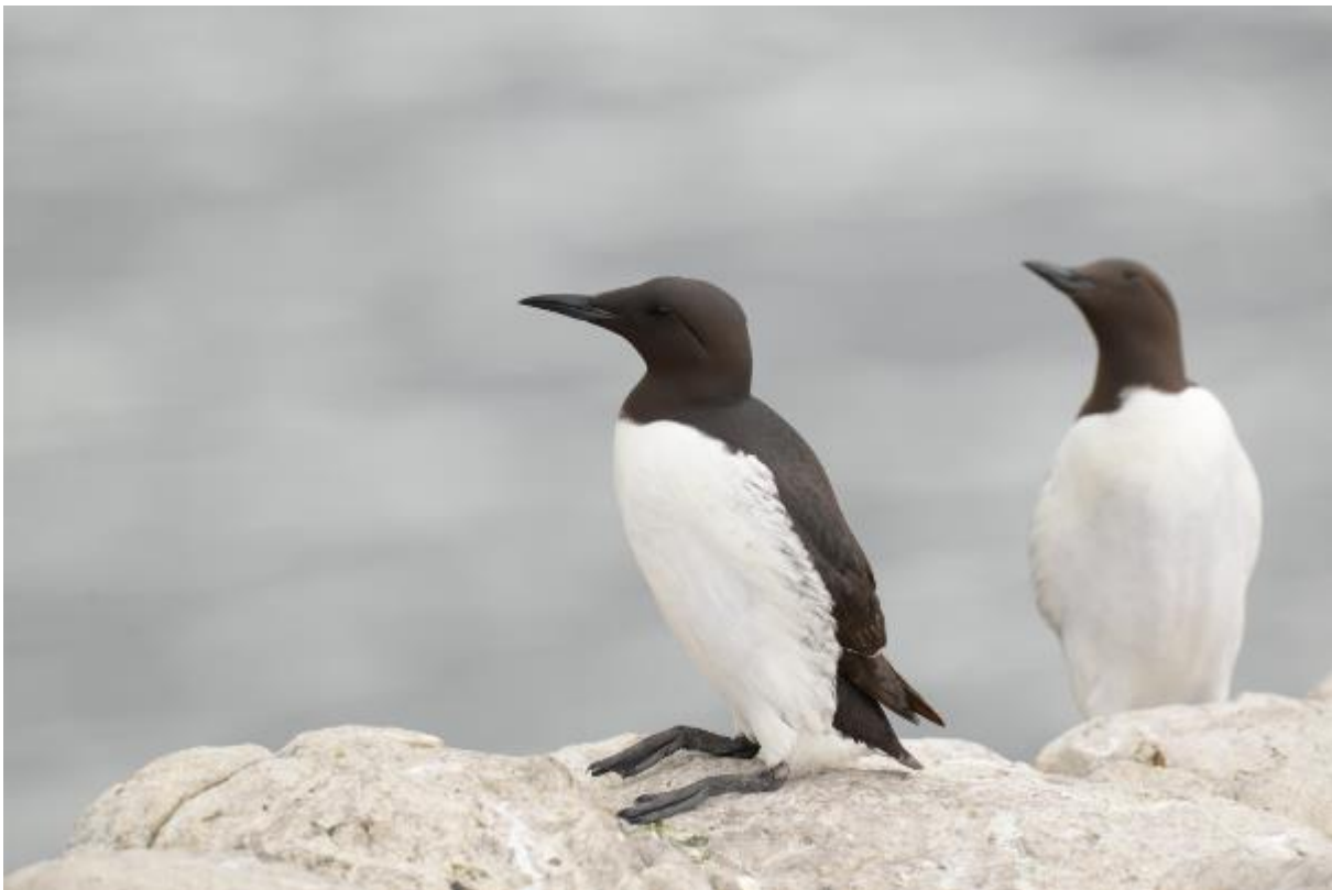
Foto: Een zeekoet op het kliffen ziet er soms wat onhandig uit...