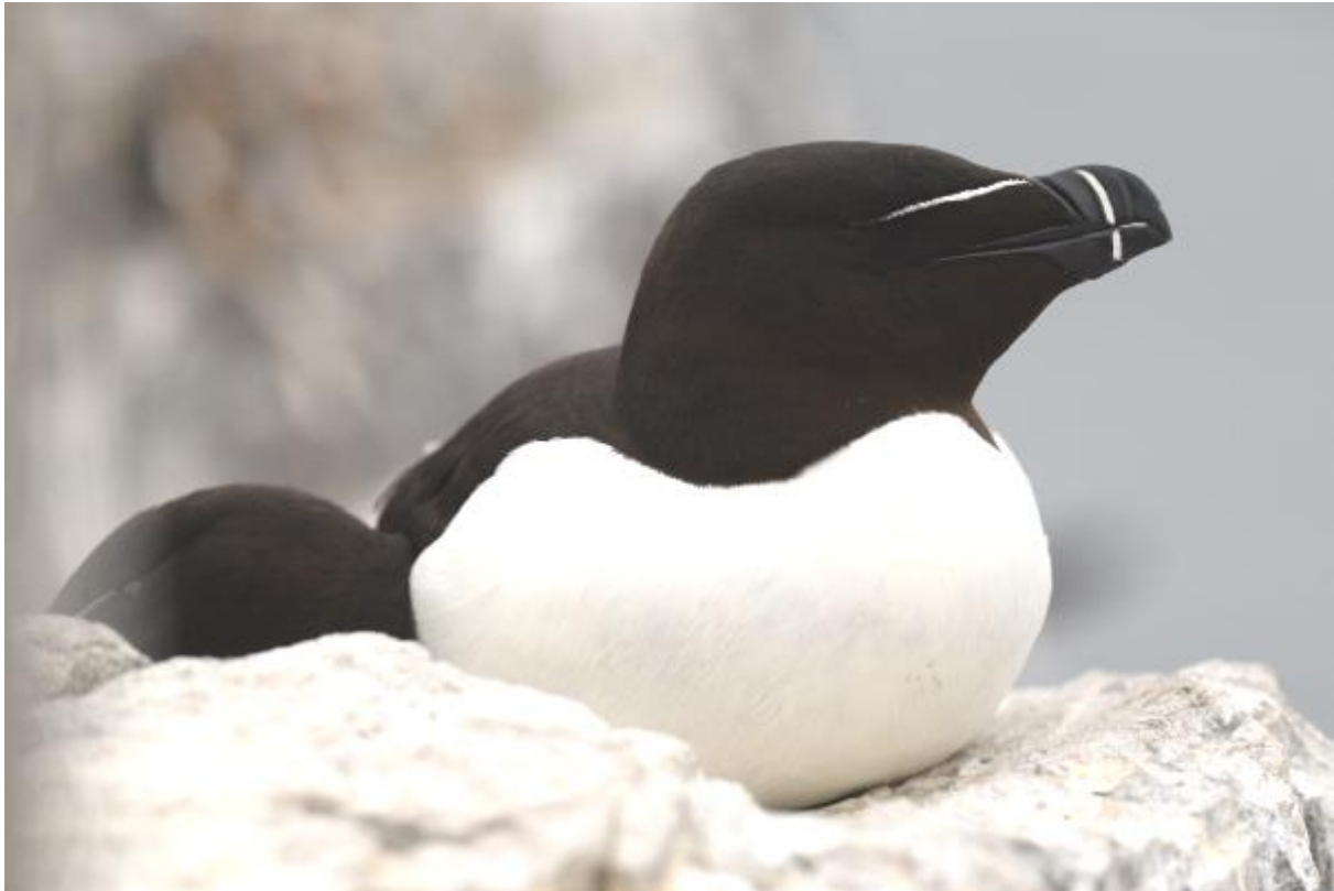
Foto: De alk is goed te herkennen aan zijn zwart-witte verenkleed, dunne witten tekening en de hoge snavel.