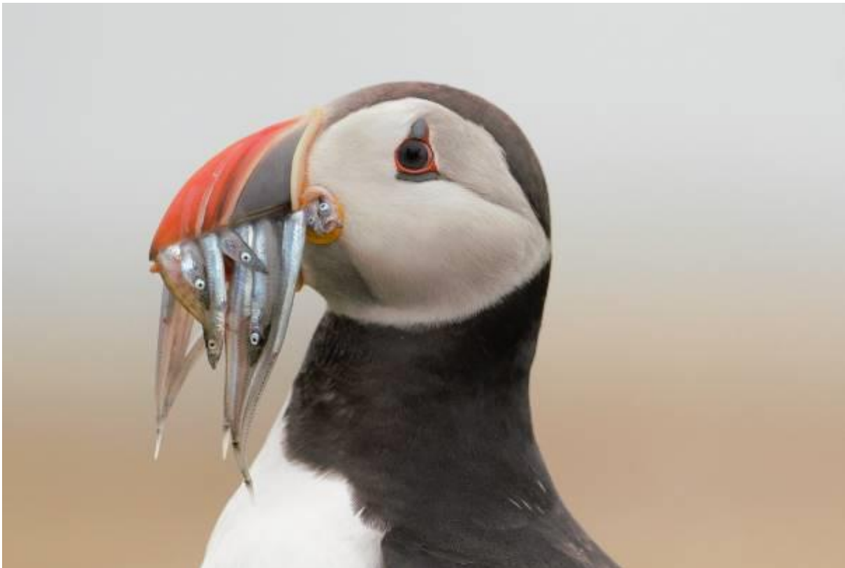
Foto: Een plaatje waar veel bezoekers van de Farne Islands voor komen: een papegaaiduiker met zandspiëring in de bek!

Het diner smaakt weer prima, met typische Engelse toetjes na als apple crumble en hot chocolade pudding... De soorten lijst telt na verwerken van vandaag een kleine zestig soorten.