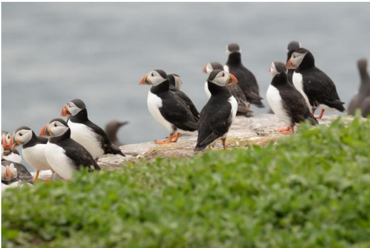
Foto: Een aantal papegaaiduikers verzameld aan de rand van de kliffen en hun broedveld

Om half vier gaat onze boot retour, samen met vele andere bezoekers. De boot zit goed vol, wat wel een wat massaal gevoel geeft. Het overtochtje duurt niet lang en we zijn al snel bij het haventje terug. We gaan onderweg naar het hotel, met nog een korte stop bij het meertje net buiten Seahouses. Dat levert onder andere nog dodaars, knobbelzwaan, oeverzwaluw en graspieper op. Dan langs het grote kasteel van Bamburgh naar het hotel, waar we rond vijven aankomen.