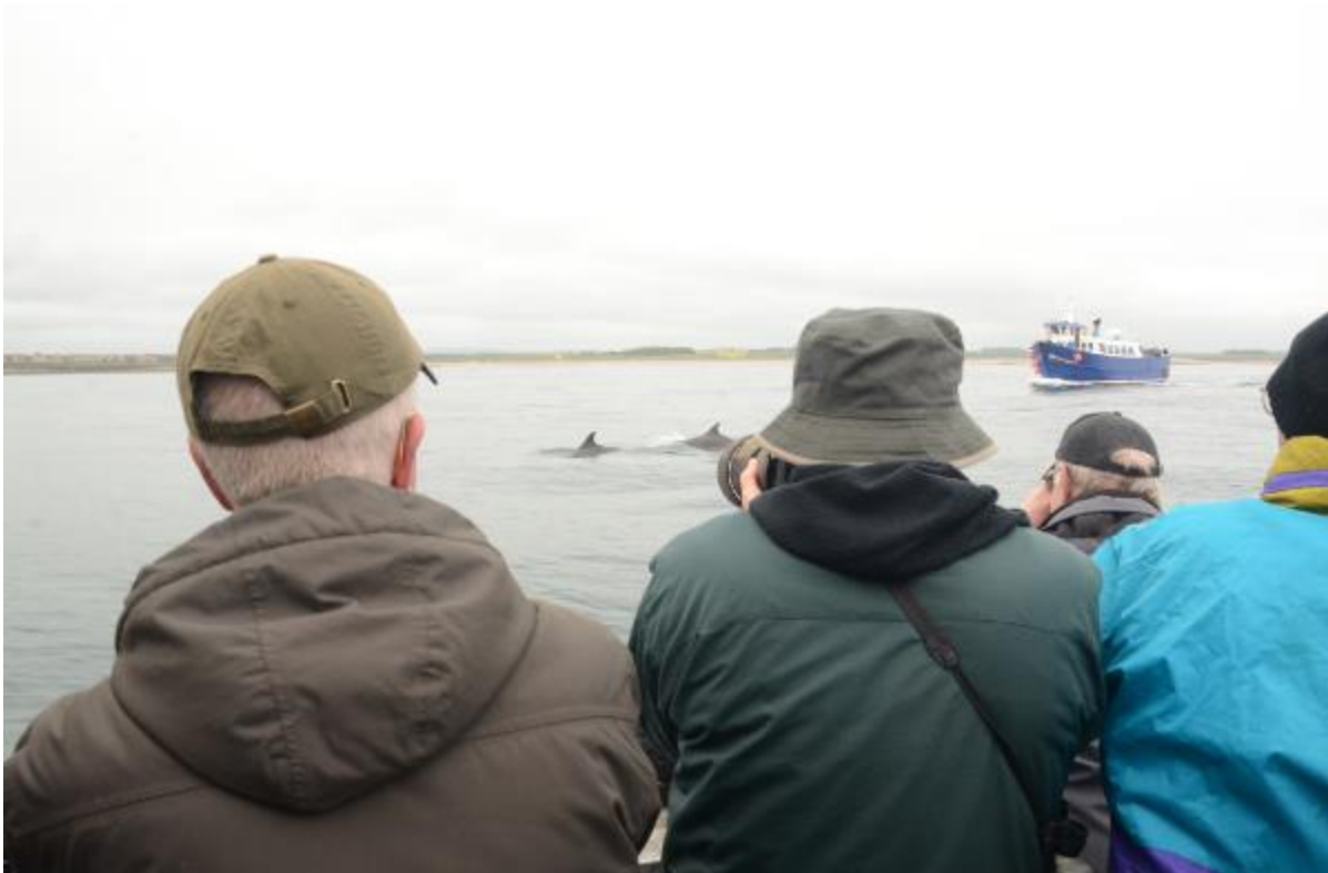
Foto: De tuimelaars laten zich goed zien aan alle boten! Wat een leuke extra!

Dan gaat toch echt de excursie beginnen, met een minder volle boot dan gisteren en een rustiger zee. We zijn nog maar een paar minuten onderweg als de dekmaat roept dat er 'bottlenose dolphins' te zien zijn. En inderdaad, we zien een stuk of zes tuimelaars voor de boeg van de boot nabij. De schipper stuurt zo, dat we de dolfijnen goed kunnen zien. Ze zwemmen dan weer links en dan weer rechts, en bij diverse boten. De dekmaat helpt zelf een oudere vrouw in de boot om ze te kunnen zien. Wat een leuke extra!!! Iedereen kan ze goed zien, omdat ze aan alle kanten en zowel dichtbij als verder weg zijn.