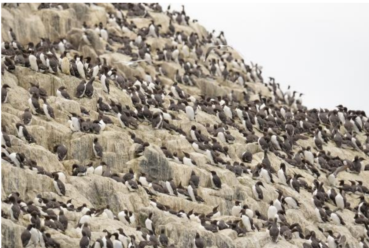
Foto: Een willekeurig beeld op de kliffen van sommige van de Farne Islands; de vele, vele broedende zeevogels.