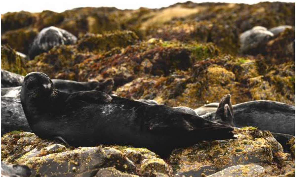
Foto: Grijze zeehonden komen veel voor op de Farne Islands.