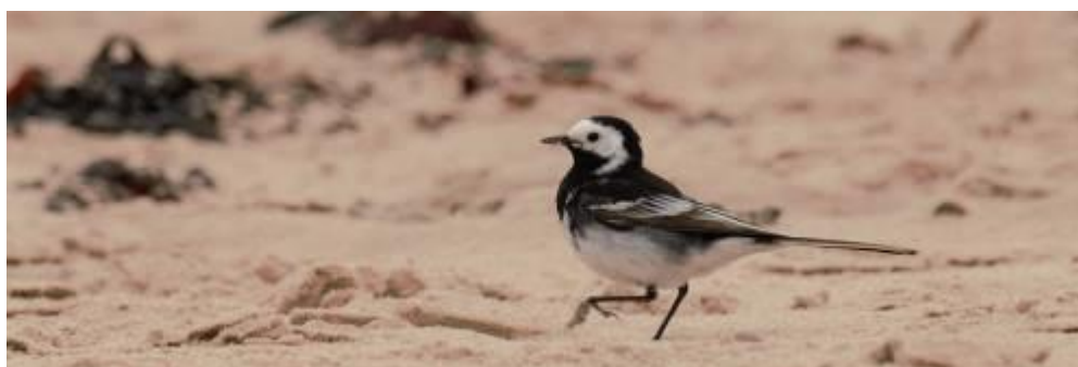
Foto: Een rouwkwikstaart foeragerend op het strand

Het is om 7:30 aantreden aan de ontbijttafel, want om 9:30 vertrekt de boot van de eerste excursie. Na het ontbijt vertrekken we vol verwachting. Na het parkeren van de bus wordt ons echter verteld dat de eerste excursie niet door gaat. Het National Trust heeft besloten Staple Island vandaag dicht te laten ivm de voorspelling van regen. We hebben dus de tijd tot 11:30 om nader in te vullen. Na een kort overleg gaan we nog even kijken bij het plasje net ten noorden van Seahouses. Gisteren leverde dit ook leuks op, dus we zijn benieuwd. We zien en horen daar onder andere graspieper, roodborsttapuit, dodaars, krakeend, slobbeend en oeverzwaluw. Vervolgens lopen we de duinen door en gaan nog even richting strand. Daar zien we nog steenloper, blauwe reiger, bontbekplevier en rouwkwikstaart.