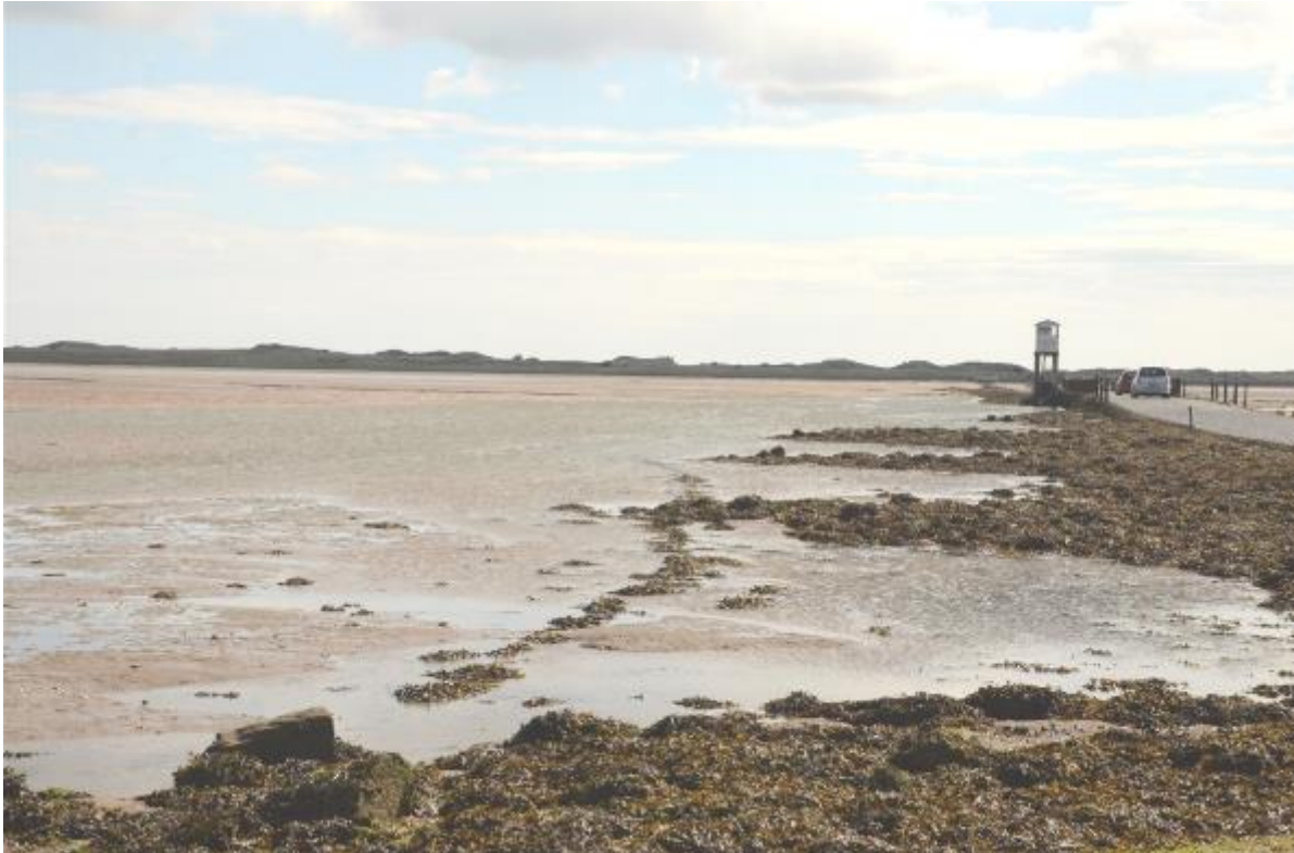
Foto: Het wad bij Holy Island valt droog bij eb. Rechts de weg die nu begaanbaar is met op de achtergrond Holy Island.

Wederom om half acht weer aan het ontbijt, waar we van ontbijtgranen, toast, 'bacon and egg's' en zelfs van poched egg genieten. We worden rustig wakker met flinke koppen thee en koffie. Rond kwart over negen is iedereen uitgecheckt en zijn we vertrek klaar. We rijden een kwartiertje noordelijk, en stoppen dan nog even bij het begin van de weg naar Holy Island (Lindisfarne). Holy Island is alleen met de auto te bereiken bij laag water, omdat bij hoog water de toegangsweg anderhalve meter onder water komt. De weg is nog niet geheel droog (wisten we door de getijdentabel), dus kijken we eerst langs de rand. Mooi is aan de vegetatie te zien hoe vaak en hoe lang het onder water staat. Het midden van het wad is kaal zand/ slik, aan de randen neemt de vegetatie toe.