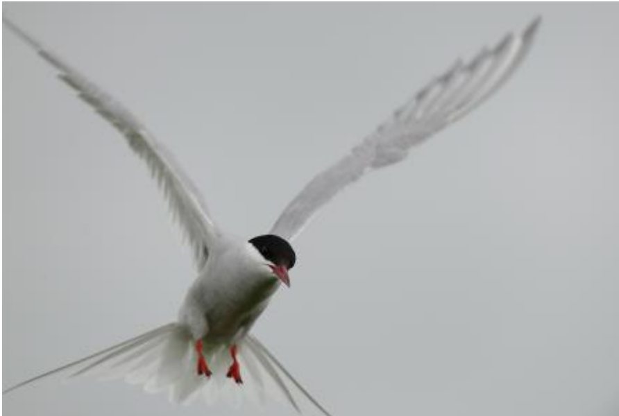
Een Noordse stern maakt duidelijk dat doorlopen gewenst is.

Af en toe vliegt er een zilver-, kleine mantel- of grote mantelmeeuw over om te kijken of er iets te halen valt. De rangers houden in de gaten of de mensen niet teveel verstoren of zich buiten de paden begeven.