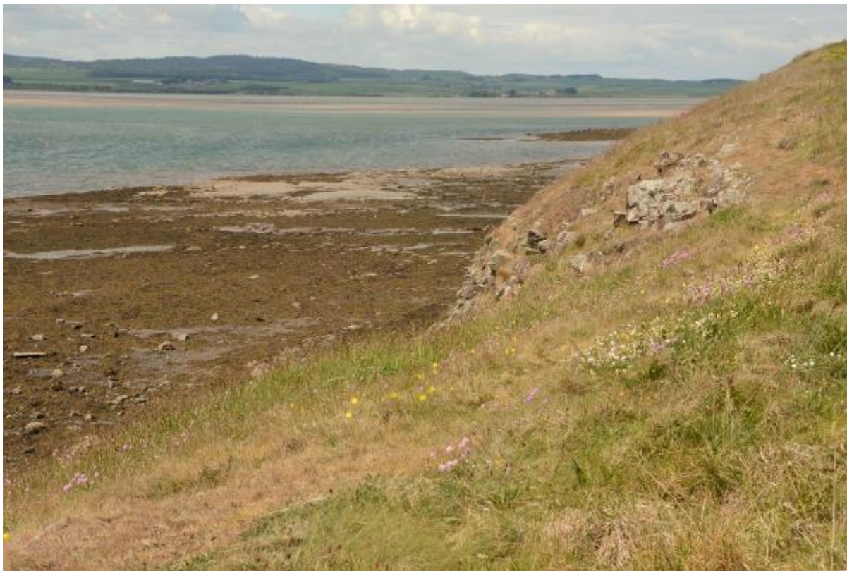
Foto: Holy Island; wadden, kustlijn, ruines, bloemen en mooi weer.

Dan rijden we een kleine anderhalf uur richting het zuiden, tussen de bloeiende gele gaspeldoorn struiken, weides met schapen en heggen er omheen en diverse landhuizen door. We komen keurig op tijd aan bij de boot om in te checken. Als we de hutten betrekken hebben en onze bagage hebben geïnstalleerd, varen we uit en zien we Engeland steeds kleiner worden. We genieten nog even van het lekkere zonnetje op het achterdek en zien op zee nog zeekoeten, enkele papegaaiduikers, drieteenmeeuw, een stormmeeuw, een noordse stormvogel en veel zilvermeeuwen. 's Avonds eten we met de hele groep in Little Italy, aan één tafel voor acht. Dit vraagt wat geduld en inspanning van de obers, maar het lukt. Er wordt weer lekker gegeten, veel gelachen en gezellig nagetafeld.