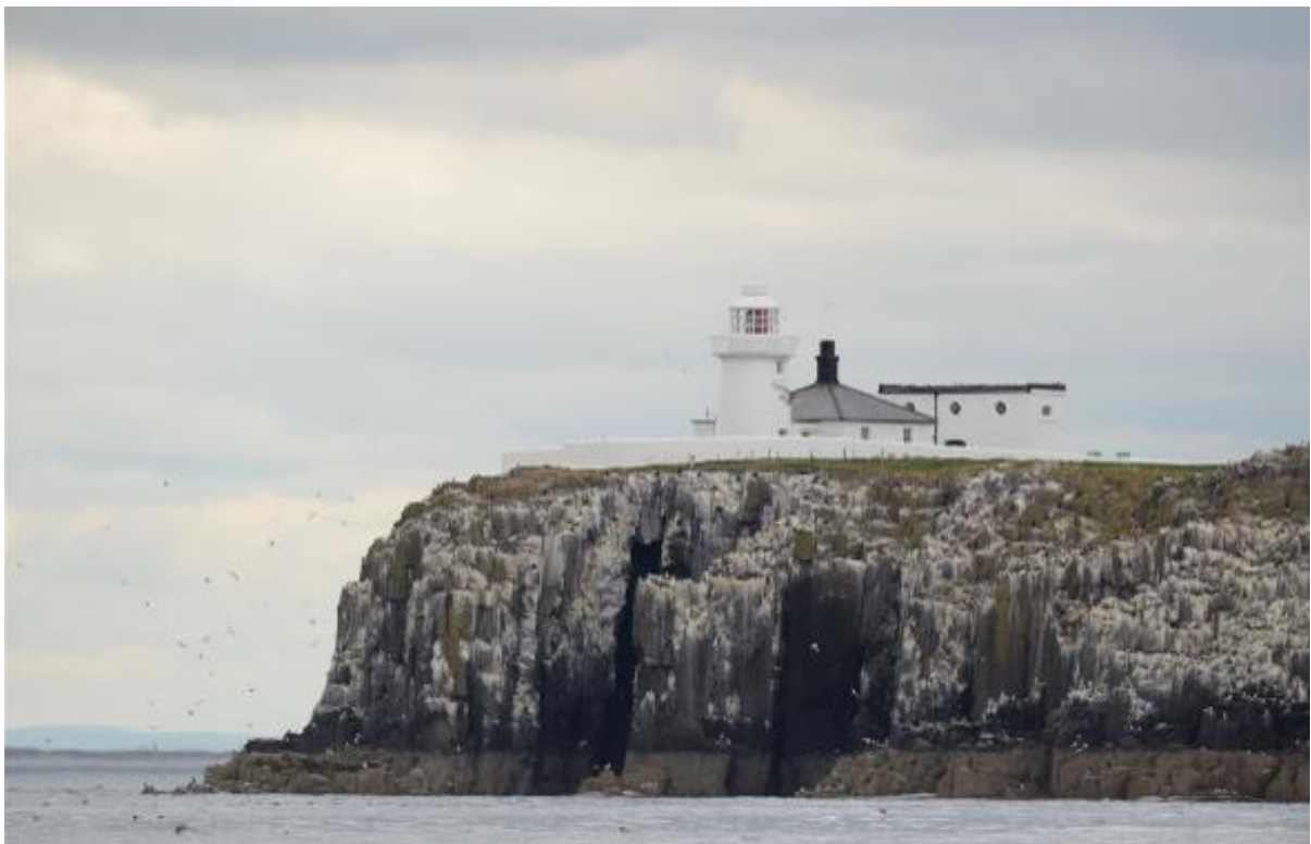
Foto: De vuurtoren van Farne Islands op de kliffen, omringd door de zeevogel kolonie.

Het is een bijzondere reis die we in samenwerking met Vogelbescherming Nederland hebben gemaakt! Bijzonder omdat we de dichtst bij Nederland gelegen grote zeevogelkolonie hebben bezocht. En bijzonder omdat de vogels zijn geholpen door mee te gaan met deze reis. Een deel van de opbrengst is namelijk afgedragen aan Vogelbescherming Nederland en gebruikt voor beschermingsdoeleinden.