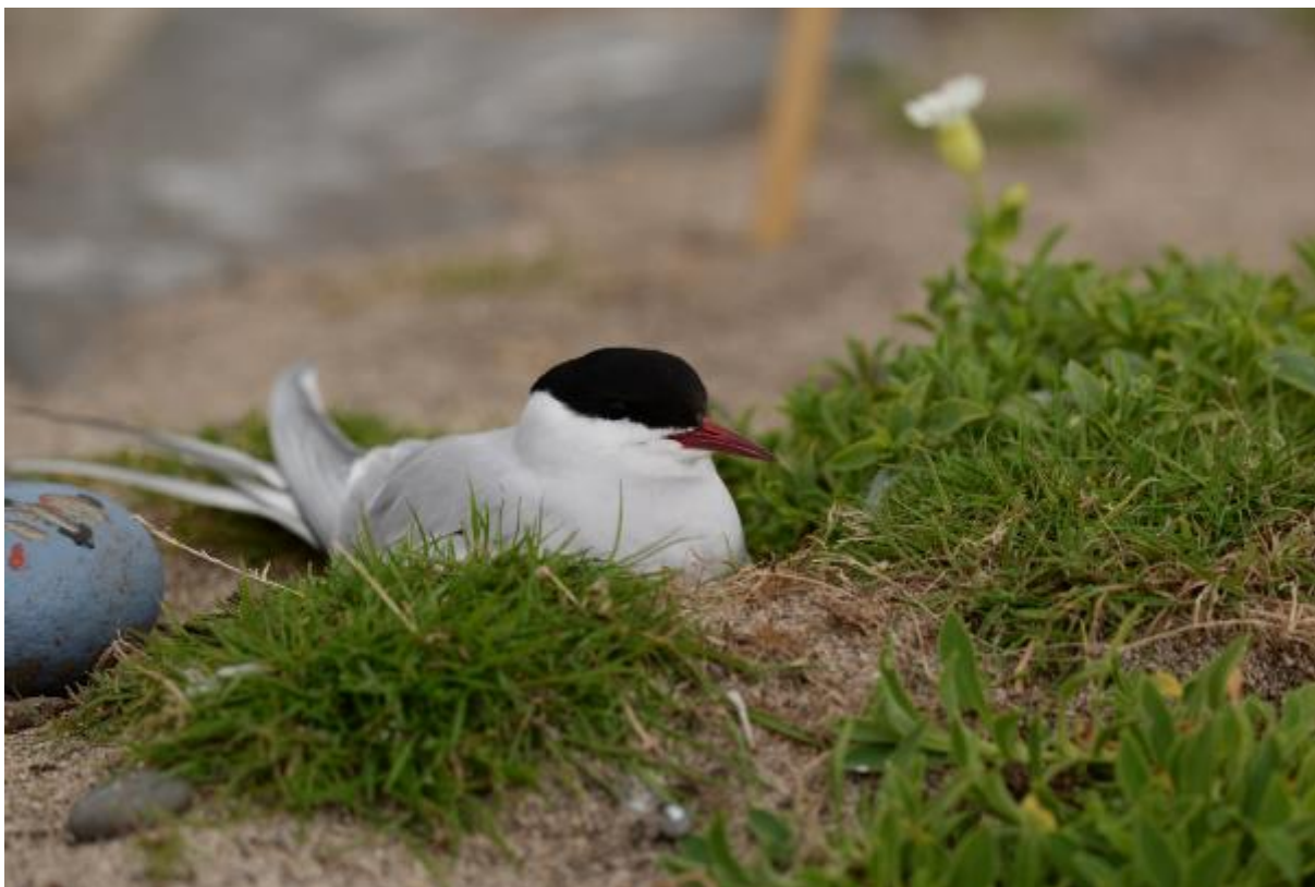
Foto: Een broedende Noordse stern. De nesten zijn gemarkeerd met een genummerde steen om de tel bij te houden...