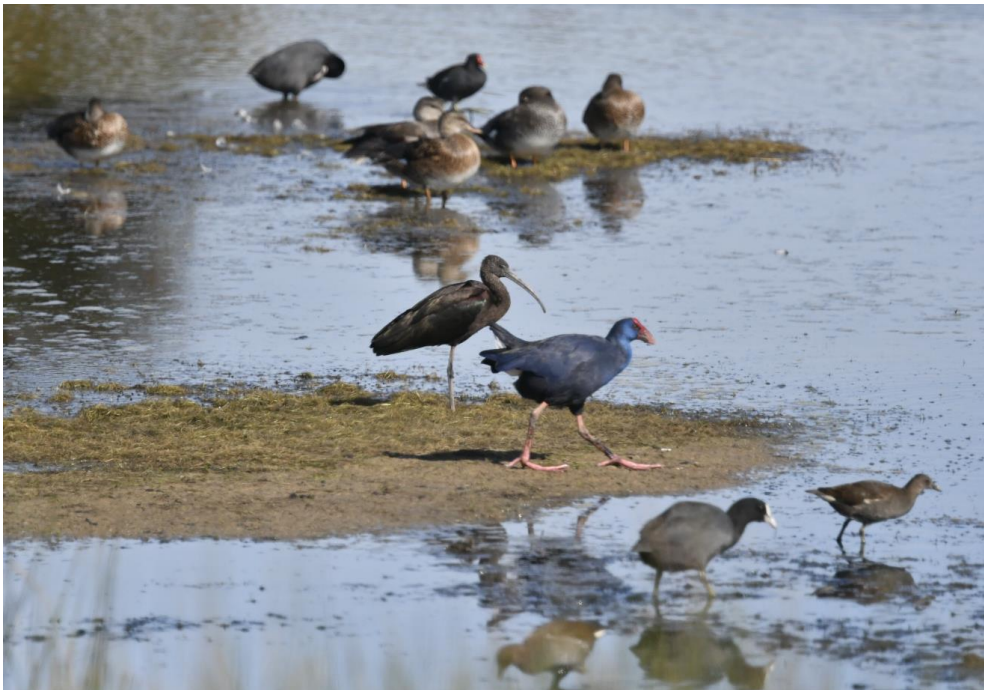
Typische beeld met Purperkoet, Zwarte Ibis, Krakeenden, Waterhoen en Meerkoet

De vlucht is laat dus konden we nog een laatste bezoek aan een charmant zoutwatermoeras doen. We zagen Hoppen op de parkeerplaats en konden weer genieten van wat steltlopers. Een Graszanger liet zich goed bewonderen en we namen afscheid van de Purperkoet en Zwarte Ibissen.