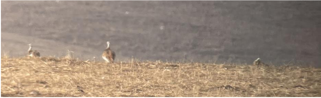
Grote Trappen op grote afstand

Andere leuke soorten die we tegenkwamen waren de Rode Patrijzen, Kalanderleeuwerik, Iberische Klapekster en een Steenuil. Einde ochtend zagen we in de lucht imposante Monniksgieren zwevend door de lucht op de thermiek.