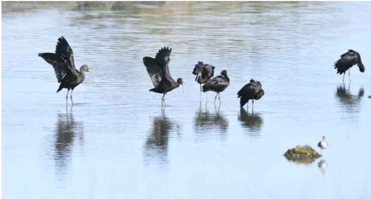
Zwarte Ibissen (en oeverloper)

Na een vruchtbare en diverse week met zeker 160 vogelsoorten, komt er een einde aan deze prachtige reis. We nemen afscheid bij het vliegveld en keren zonder al te veel rompslomp weer naar huis.