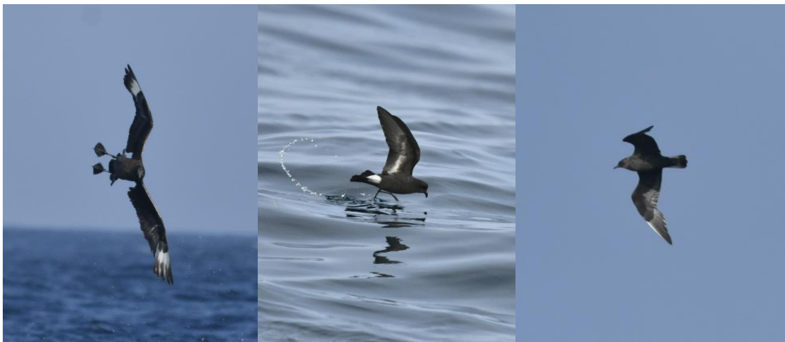
Grote Jager Jager