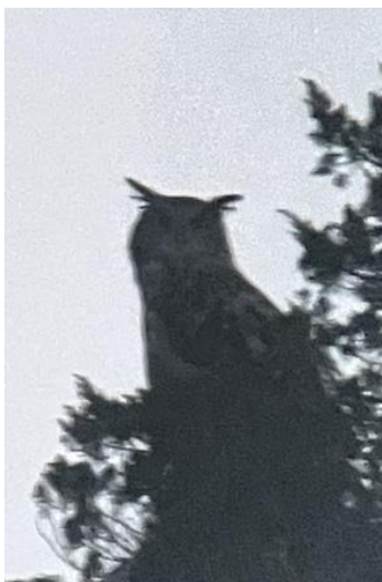
Oehoe in de schemering

Hoewel het de hele dag erg stil was qua vogels, volgde er een klapper van een waarneming, een absoluut hoogtepunt: een paartje Oehoes in de schemering. We observeren ze stilletjes, bijna in ademloze bewondering. Een Oehoe werd al gespot tegen de wand van een kloof en toen de zon steeds verder wegzakte, begon deze te roepen, "OEH" echode uit de kloof. Al snel zagen we de Oehoe vliegen naar een nabije boom en even later vloog deze door op een paal, waar we deze prachtig in silhouet konden zien. Niet veel later kwam de andere Oehoe ook langs vliegen en vlogen ze zo samen de nacht in. Toetje voor de maaltijd. We sluiten de dag af met een Braziliaans-Portugees buffet. Een perfecte avond.