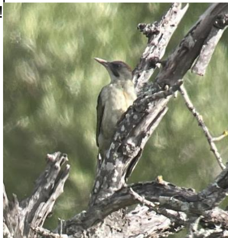
Iberische Groene Specht

Vrijdag begint verrassend zonnig, ondanks de voorspelde regen. We maken van de gelegenheid gebruik en genieten van een ontspannen ochtendexcursie dichtbij het hotel. Hier zagen we niet 1 maar 2 geweldige Iberische Groene Spechten! We hoorden hier een Boomleeuwerik, Appelvinken en kwamen later ook weer een Draaihals tegen. Ook goed zichtbaar!