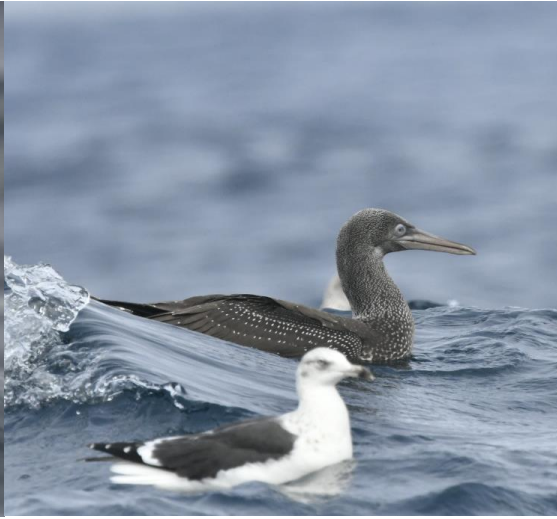
Juvenilele Jan van Gent