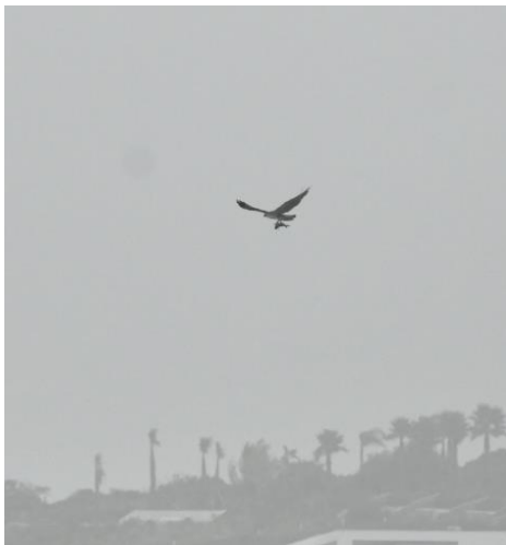
Visarend met vis