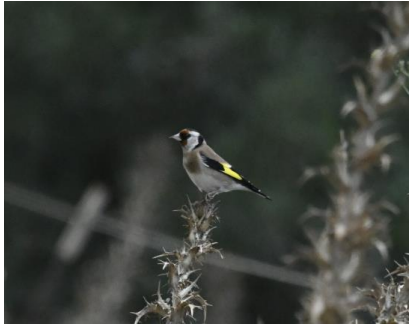
Putter op distel

Op zondag starten we bij een riviermonding, Boca do Rio, hier zoeken we naar zangvogels, maar het was verdacht stil. Het waaide aardig en dat was ook de reden om vandaag niet de zeetocht te doen.