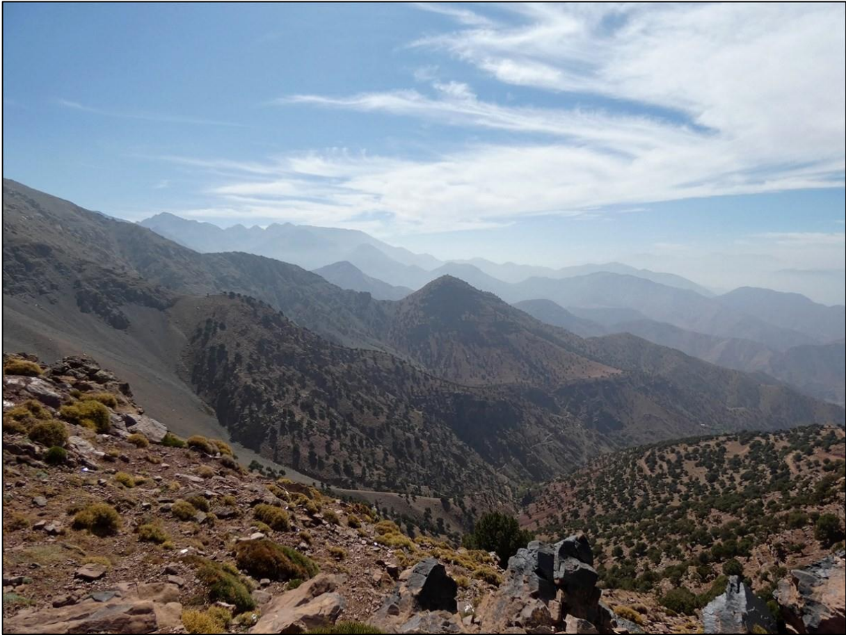
Imposant berglandschap in de Hoge Atlas.

profiteren van de verkrijgbaarheid van bier. Er wordt een bescheiden voorraadje ingeslagen. Alcohol is immers lang niet overal verkrijgbaar in dit land.