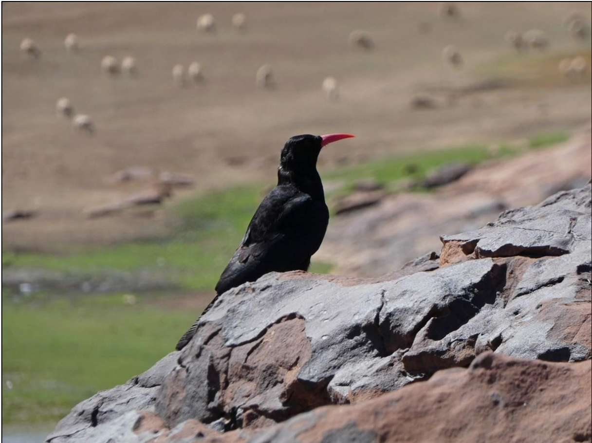
Rond Oukaimeden zijn Alpenkraaien makkelijk in de kijker te krijgen.

Op onze tocht omhoog naar het skidorp Oukaimeden (2600 meter) maken we diverse stops, onder meer in een cederbos waar we Vuurgoudhaan, Grijs Gors en onze eerste Atlasarendbuizerd zien. De lucht is blauw, we speuren naar een Waterspreeuw, die we uiteindelijk vinden bij een stuwmeertje waar we lunchen, samen met een paar Meerkoeten die zich tegoed doen aan het fonteinkruid.