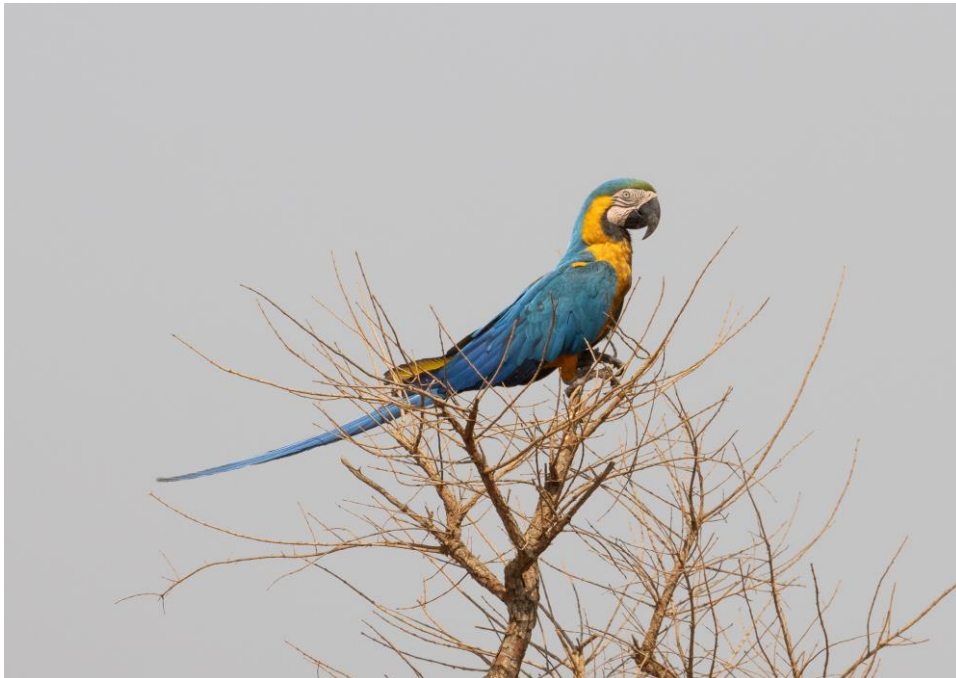
Blue and yellow Macaw