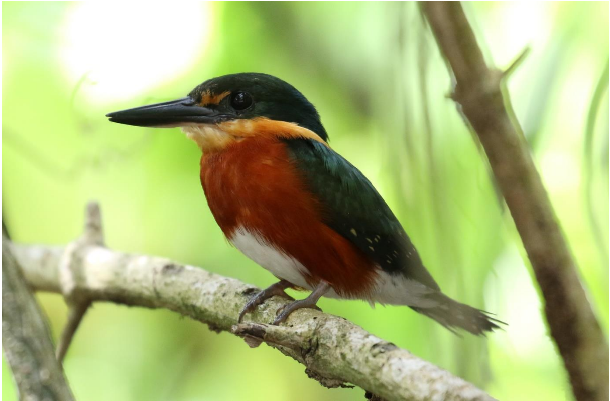
American Pygmy Kingfisher