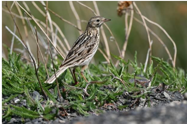
Guanacos zijn algemeen in Torres del Paine NP, rechts een Correndera Pipit

In de middag bezoeken we een ander deel van het park waar we op zoek gaan naar enkele specialiteiten zoals Patagonian Mockingbird. Deze is gelukkig vrij snel gevonden en we hebben hier ook mooie waarnemingen van Cinnamon-bellied Ground-Tyrant en Rufous-tailed Plantcutter. We rijden verder en stoppen bij een plek voor Band-tailed Earthcreeper, een soort die eerst endemisch was voor Argentinië maar toch net over de grens in Chili voorkomt. Aanvankelijk hebben we geen succes maar als we terugrijden vinden we toch een vogel die zich helaas maar kort laat zien. Onderweg terug blijven we scannen voor Puma maar helaas zonder resultaat.