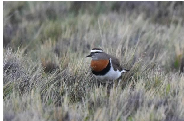
Lesser (Darwin's) Rhea en Rufous-chested Dotterel, Patagonia