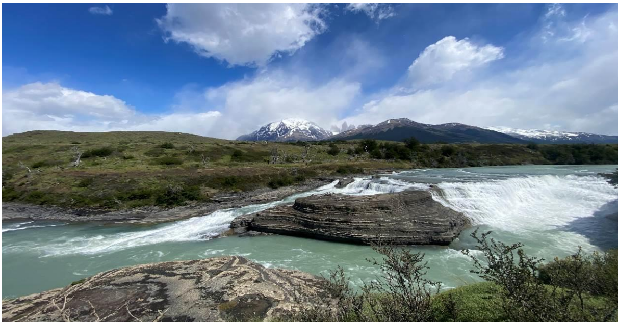
In de middag klaarde het op en waren de uitzichten in Torres del Paine fenomenaal!

Vandaag is de dag voor Torres del Paine National Park. Onderweg hebben we pittige buien en de wind is er ook nog altijd. Herfstweer! Maar ook (of juist?) in deze omstandigheden is het een waanzinnig mooi park met gletsjers, sneeuwbedekte bergen en adembenemende vergezichten. We maken wat stops voordat we bij de officiële ingang komen en scannen de omliggende heuvels voor Puma. We zien onder andere een snelle Scaly-throated Earthcreeper en Magellanic Snipe. Een check bij een meer levert een Flying Steamer Duck op, onze enige van de reis. Bij de ingang van het park doen we een poging voor Austral Rail die we al meteen horen roepen, dat is gaaf! Austral Rail is een heel zeldzame en lokale soort.