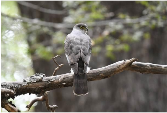
Chilean Hawk en Burrowing Parakeet

Maar nog altijd geen Chestnut-throated Huet-Huet, zou het al te laat zijn? We gaan een volgende trail lopen en daar horen we gelukkig eindelijk een vogel roepen. Maar helaas, de vogel blijft onzichtbaar in de dichte vegetatie, wat we ook proberen. In de middag bezoeken we een wetland met enkele leuke soorten zoals Spectacled Duck, Spectacled Tyrant en Upland Goose. We eindigen de dag bij een nestlocatie van Burrowing Parakeets, een prachtige (en grote) parkiet die nestelt in uitgegraven holtes. We zien zeker 20 vogels en kunnen ze lang bekijken in de telescoop als nieuwe groepjes arriveren.