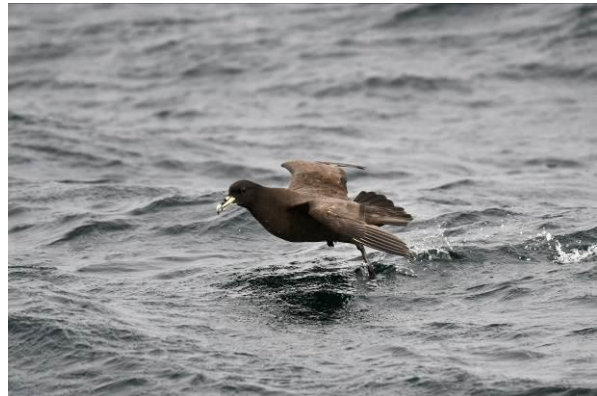
Northern Royal Albatross en White-chinned Petrel, pelagic vanuit Quintero Bay

We zien maar liefst 4 soorten albatrossen met Salvin's Albatross, Black-browed Albatross en Northern én een verdwaalde Southern Royal Albatross. De vogels komen echt super dichtbij en het lukt zelfs om met de iPhone prima filmpjes te maken! Daarbij zien we White-chinned Petrel, Wilson's Storm-Petrel, Pink-footed en Sooty Shearwater, en ook die kunnen we allemaal van dichtbij bewonderen. Weer terug bij de kust zien we groepjes Guanay Cormorants en zwemmen er enkele Humboldt Penguins. Echt een geweldig gave pelagic! In de middag bezoeken we de moerassen van Mantagua, een heel mooie plek met een heel divers soortenpallet: Black-headed en Lake Duck, Spectacled Tyrant, Stripe-backed Bittern (h), Kleine en Grote Geelpootruiter en Many-coloured Rush-Tyrant. Op het strand zien we veel steltlopers met oa Hudsonian Godwit (1) en Whimbrel (100-en), American Oystercatcher, Willet, Bairds Sandpiper plus enkele Grey Gulls. Onderweg terug naar ons hotel stoppen we langs de kust waar we van dichtbij Inca Sterns kunnen zien en fotograferen. Een heerlijke afsluiting van opnieuw een prachtige dag.