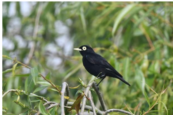
Rufous-legged Owl en Spectacled Tyrant, omgeving Puerto Varas