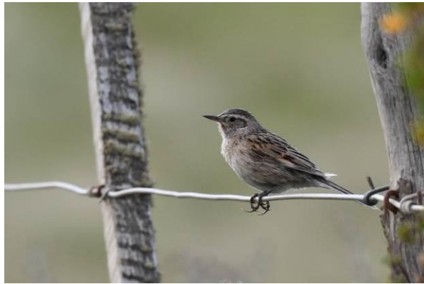
Imperial Cormorant en Austral Canastero, omgeving van Puerto Natales

De volgende stop is er kans op de bosrijke hellingen volgens de chauffeur. En nog geen minuut na het uitstappen ziet Orlando inderdaad Austral Parakeets, yesss! We kunnen de vogels goed zien in de telescoop en we vermoeden dat ze een nest hebben. We eindigen de rit bij Laguna Sofia waar we in een prachtige setting van besneeuwde bergtoppen en azuurblauw water nog een prachtige finale hebben met een show van Chilean Flickers.