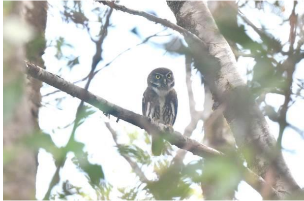
Chucao Tapaculo en Austral Pygmy Owl, Alerce Andino NP

In de avond hebben we een uilenexcursie met prachtige waarnemingen van Rufous-legged Owl en Austral Pygmy Owl. Heerlijke dag!