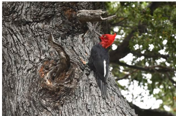
White-throated Treerunner en Magellanic Woodpecker