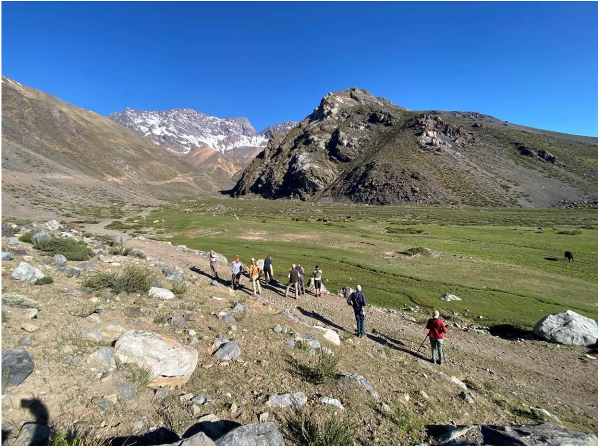
De plek waar we een grote groep Andescondors tegenkwamen