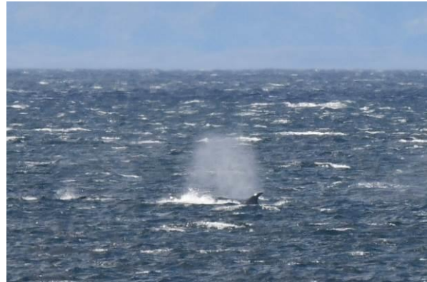
Ashy-headed Goose en Sei Whale, omgeving Punta Arenas