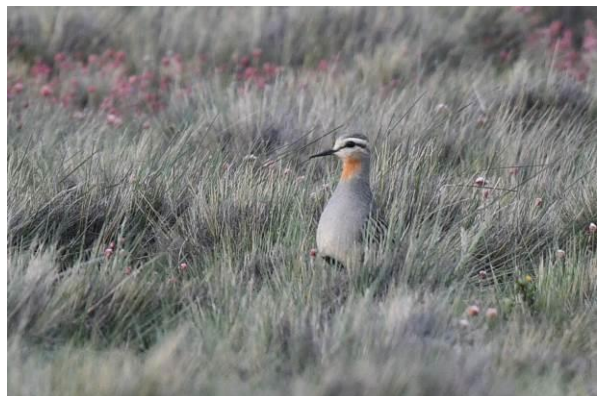
Two-banded Plover en Tawny-throated Dotterel, Patagonia