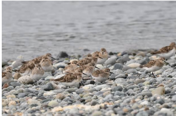
Hudsonian Godwit en Bairds Sandpipers op Chiloe Island