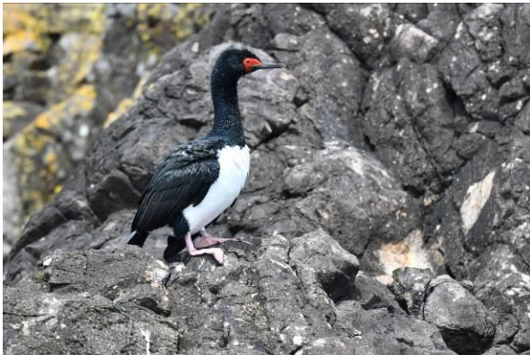
Rock Shag en Magellanic Penguins, Chiloe Island