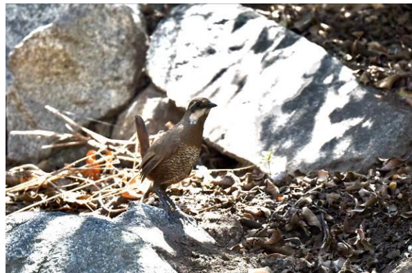
White-throated Tapaculo en Moustached Turca, PN La Campana