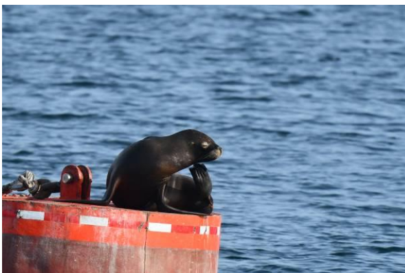
South American Sea Lion en Imperial Cormorant

We vertrekken op tijd naar Pargua waar we met de bus de boot nemen naar Chiloé Island, een overtocht van ongeveer 45 minuten. We gaan natuurlijk op het smalle dek staan om te speuren naar de pas net ontdekte en beschreven Pincoya Storm-Petrel.