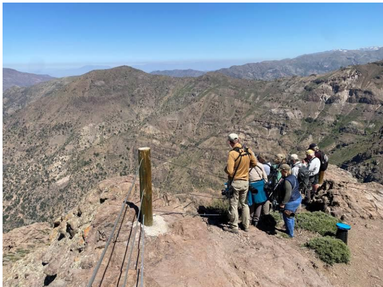
Magellanic Horned Owl, speuren naar Spot-billed Ground-Tyrant