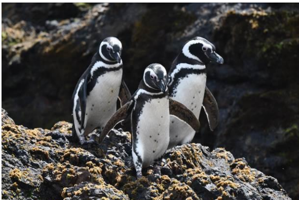
Magellanic Penguins en Marine Otter, Chiloe Island