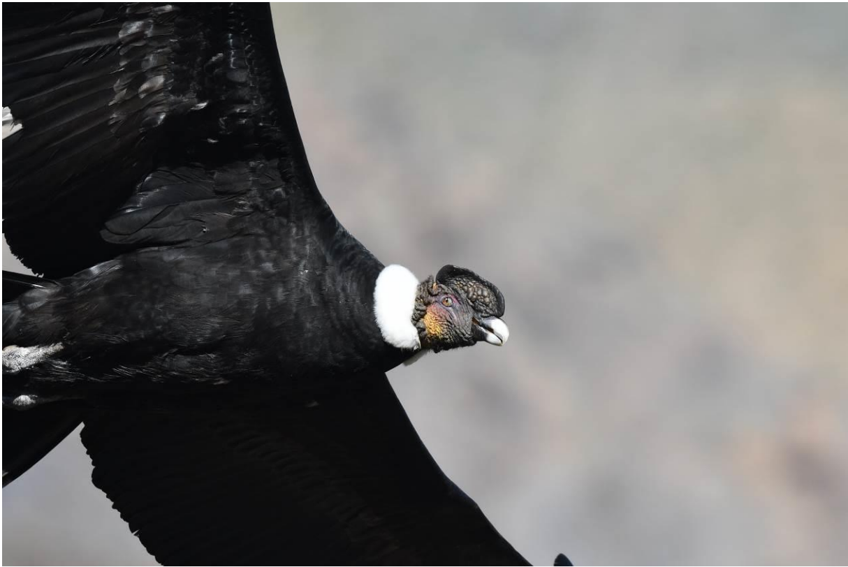
Eén van de ca 30 Andescondors die we zagen op de eerste dag in de Andes

In de middag rijden we in enkele uren naar de Pacifische kust waar we overnachten in Vina del Mar. Vogelen vanuit het hotel - wat pal aan zee ligt - levert meteen al een mooie reeks aan soorten op met onder meer Chilean Seaside Cinclodes, Inca Tern, Peruvian Booby en Pelican, Kelpmeeuwen, Neotropic Cormorants en een grote groep Franklins Meeuwen.