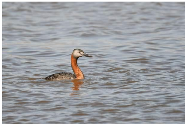
Burrowing Owl en Great Grebe, Batuco moerassen

Als we teruglopen naar de bus zit er een Aplomado Falcon een zojuist gevangen zangvogel te plukken in een boom, gaaf! Een volgende stop levert nog wat meer watervogels op met Pied-billed en Silvery Grebe, Rosy-billed Pochard, Wren-like Rushbird, Long-tailed Meadowlark en Yellow-winged Blackbird. Een heerlijke eerste verkenning van de vogels van Chili maar we merken nu ook wel dat we een nacht in het vliegtuig hebben doorgebracht, dus moet en voldaan rijden we naar ons mooie hotel in Santiago.