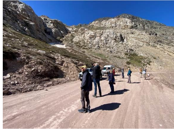
Crag Chilia – Chili endeem en (r) vogels kijken bij Valle del Yeso

De laatste specialiteit is een lastige: we zoeken naar Creamy-rumped Miner, een zeldzame en lokale miner met een heel beperkte verspreiding. We zien een paar Rufous-banded Miners maar vervolgens is het raak, juist als we besluiten om terug te lopen naar de bus! De vogel laat zich goed zien en fotograferen, geweldige afsluiting van een heerlijke eerste dag! Althans, dat dachten we. We maakten namelijk nog een sanitaire stop bij een koffietentje als we steeds Andescondors langs zien vliegen. Als we wat beter kijken blijkt er een grote groep van zeker 20 Andescondors bij een kadaver te staan, wauw! We besluiten wat dichterbij te lopen en worden vervolgens getraceerd op een fabuleuze show van Condors! De een na de ander komt aanvliegen, soms recht over ons heen op nog geen 10 meter afstand. We maken eindeloos veel foto's en video's om dit moment vast te leggen. Wat een finale! Het diner met bijbehorend biertje smaakten dan ook uitstekend deze avond.