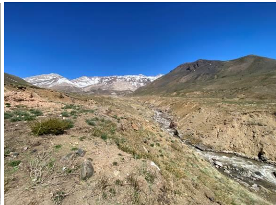
Grey-breasted Seedsnipe was algemeen bij Valle del Yeso waar we de hele dag konden genieten van prachtige vergezichten