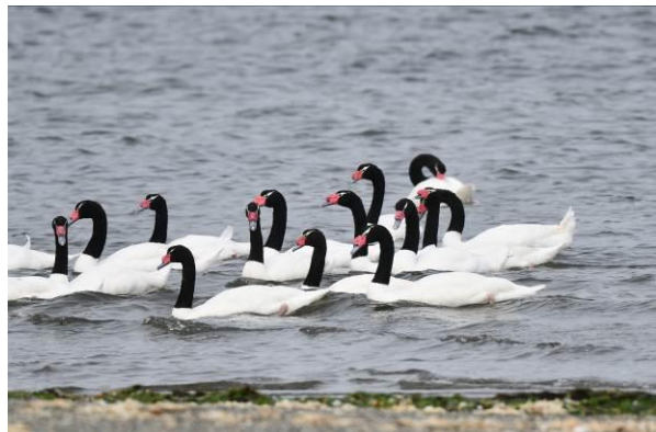
Flightless Steamer Duck en Black-necked Swans op Chiloe Island

Dan rijden we richting het westen waar we een bezoek brengen aan de enige gemengde broedkolonie van Humboldt en Magellanic Penguins in de wereld. En dat doen we met een boot die ons dicht bij de kolonie brengt, super leuk! We worden in een hoge kar naar de boot gebracht die al in de branding ligt en varen vervolgens naar enkele kleine eilandjes voor de kust. En daar zien we inderdaad al snel beide pinguïns, gaaf! Maar niet alleen dat, er broeden ook Kelp Goose en Rock en Red-legged Cormorant. Op het strand en in de zee zitten meer Fuegan (Flightless) Steamer Ducks en we zien zelfs tweemaal Marine Otter.