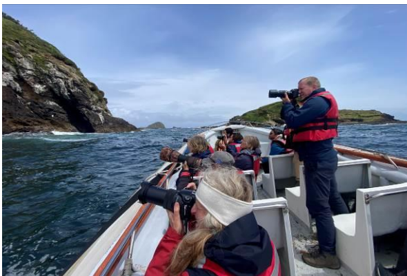
Het was geweldig fotograferen bij de Magellanic Penguins met rechts Red-legged Cormorant, Chiloe Island