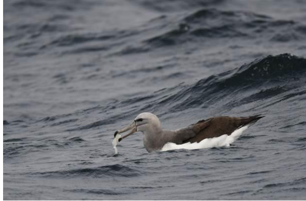
Pink-footed Shearwater en Salvin's Albatross, pelagic vanuit Quintero Bay

Als we iets verder de zee op zien we de eerste Peruvian Diving Petrels, wat een geweldig leuke soort! Het heeft het meeste weg van een kruising tussen een alk en een pijlstormvogel. Hoewel de wind meevalt is de deining stevig, dus het is een uitdaging om goede foto's te maken, ook al staan er bankjes op het dek. Gelukkig wordt deze wat minder als we verder op zee zijn en we kunnen genieten van een waar spektakel aan zeevogels!