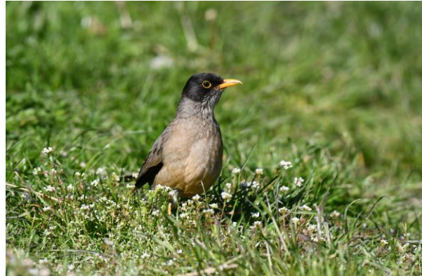
Chilean Flicker en Austral Thrush, omgeving van Puerto Natales

Dan zit het vogelen erop en rijden we via Puerto Natales terug naar het vliegveld voor de vlucht terug naar Santiago waar we nog een overnachting hebben in een fijn hotel bij de luchthaven.