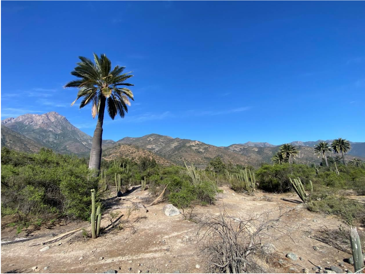
PN La Campana