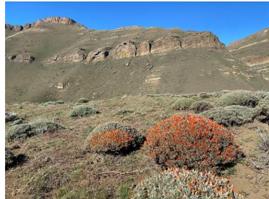
Patagonian Mockingbird en rechts het landschap wat grenst aan Argentinië, het oostelijk deel van Torres del Paine