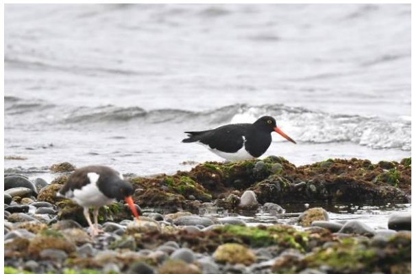
Silvery Grebes en American en Magellanic Oystercatcher, omgeving Puerto Montt