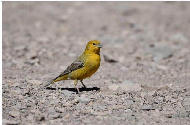
Schitterende landschappen in de Andes van Valle del Yeso en Greater Yellowfinch (r)