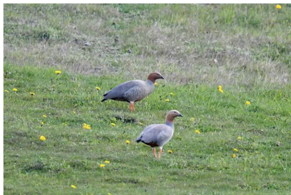
Uitzicht over Patagonië en de zeldzame Ruddy-headed Goose, omgeving Punta Arenas