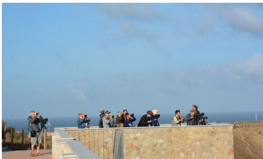
Afbeelding: Bij een van de telposten turend naar de lucht, zoekende naar vogels die richting Afrika gaan.

We begonnen deze dag, na het ontbijt, met tellen op trektelpost Cazalla. Dit omdat er westenwind is en de meeste trek dan aan de westkant wordt verwacht. Echter bij aankomst aldaar bleek veel mist/ laag hangende wolken. Hier hoeven we niet te verwachten veel te zien, dus door gereden naar trektelpost Trafico. De ligt nog iets lager en langs de kustlijn. De bewolking is hier dan ook minder laag en het zicht is veel beter. Als we even staan klaart het zelfs op. Deze post is bekend om z'n laag vliegende vogels, maar vaak lagere aantallen. Vaak zijn dat vogels die de oversteek in deze poging niet gaan halen, omdat ze niet genoeg hoogte hebben. We kunnen vele dwergarenden goed bekijken, zowel donkere als lichtere varianten.