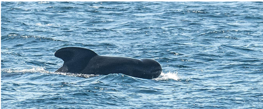
Afbeelding: Vanaf de boot konden wede kenmerkende stompe kop van de grienden goed herkennen.

Ondertussen gaat de trek gewoon door van dwergarend, slangenarend en ook aasgier. Als we even op weg richting het hotel zijn, stappen we nog 1 keer uit om een thermiek bel vol vogels te zien. Dan rijden we verder, het is warm en al later. Bij het hotel nog even uitpuffen en oprispen, en dan mogen we weer genieten van de lokale gerechten. Salades en pasta's als voorgerecht, gehaktballetjes, vis of kip als hoofdgerecht en flan , vijgentaart of ijs toe.