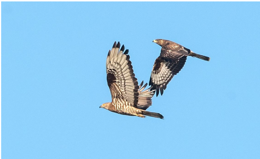
Afbeelding: Laagvliegende wespdierven, een adult dier (linksonder) en een juveniel.

Vanochtend wederom om 7.30 ontbijt om rond 8.15 weg te kunnen. Het weer is erg gunstig: windstil en helder. Daarom beginnen we bij het strand van Los Lances. Hier is het nu nog druk met vogels, en weinig toeristen, maar dat kan snel veranderen... Op het strand en de zandplaten zien we vrij veel steltlopers als drieteen strandloper, bontbekplevier, rosse grutto, strandplevier en bonte strandloper. Er is ook graszanger aanwezig en soms vliegen er gele kwikstaart en kortteenleeuwerik over. We kunnen alles goed en rustig bekijken. Boven zee zien we veel Kuhls pijlstormvogels vlak aan de branding en een aantal vale pijlstormvogels verder op zee. Ook Audouins meeuw en geelpootmeeuw zijn aanwezig. Als we langs het vlonderpad wat verderop gaan kijken, worden we aangenaam verrast door vier overvliegende wespdierven, zowel jonge als adulte, en erg dichtbij. Wat een mooie waarneming!