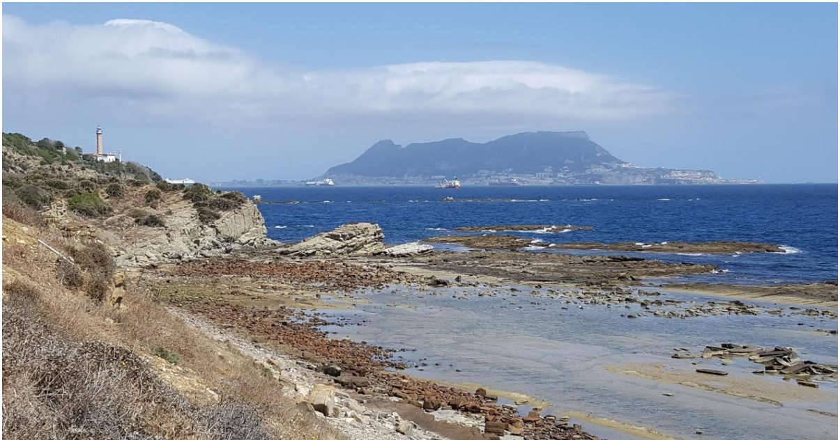
Afbeelding: Vanaf het strand bij Tarifa kun je Gibraltar zien liggen in de zeestraat.