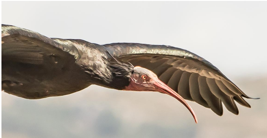
Afbeelding: De heremiet ibissen lieten zich goed zien!

We gaan dan per auto verder, naar La Janda (de rijstvelden), in hoop op alsnog krenten als grijze wouw, steppenkiek of Spaanse keizerarend. We stoppen alleen vooraan, en zien daar nog ooievaars, kuifleeuwerik, zwarte ibis en kleine zilverreiger. Ook gaat er een groep vale gieren door de lucht bij de achterliggende heuvels. Om de andere beoogde plekken te kunnen bezoeken, gaan we verder. Onderweg luncht de groep in het tonijnvissers dorpje Zahara de los Atunes. Met eetgelegenheden aan het strand en gerechten als calamares kunnen de deelnemers dit wel waarderen. Dan gaan we verder richting Barbate, waar in een zijarm van een rivier plassen zijn aangelegd. We zien meteen Heremiet ibissen vanaf de weg en stoppen. Als we gestopt zijn is er een man bezig met het maken van foto's van de paarden waar de ibissen tussen staan, en vindt deze blijkbaar storend. Hij klapt in zijn handen, tot irritatie van sommige van ons, en de ibissen vliegen op, maar landen tot ons geluk dicht bij ons! Nu kunnen we ze nog beter zien! We bekijken ze en maken foto's, totdat ze alle drie opvliegen en op een paal nabij gaan zitten. Als ze vervolgens nog een keer naar ons toe vliegen, kunnen we ons geluk niet op en ratelen de camera's.