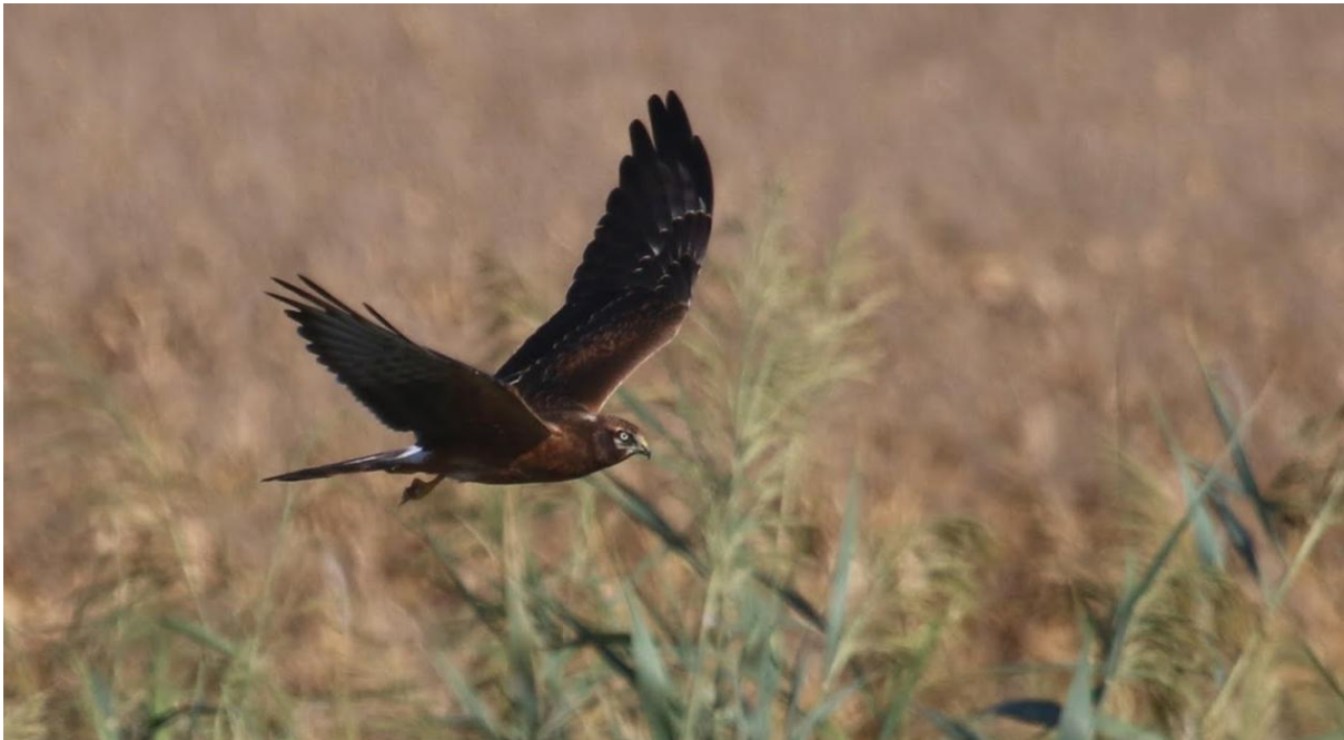
Afbeelding: Boven de velden hebben we verschillende kiekendieven gezien, zoals hier een grauwe kiekendief.

In de velden zien we honderden ooievaars in de natte velden, maar ook enkele duizenden koereigers op de velden die gemaaid worden. Grauwe kiekendieven jagen, evenals bruine, boven de velden en laten zich goed zien.