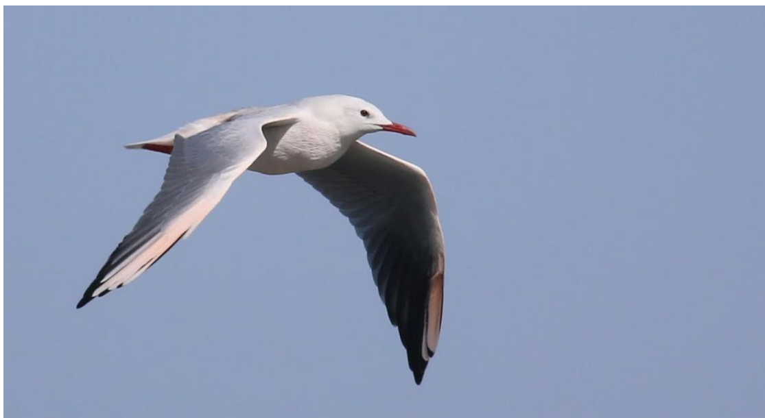
Afbeelding: De dunbekmeeuwen lieten zich goed bekijken, waardoor de roze kleuring goed zichtbaar was.

We vervolgen de dag bij de zoutpannen naast het park. Hier wordt zout gewonnen door ondiepe velden met zout water te vullen, waarna de zon het water verdampt en het zout over blijft voor winning. Dergelijke plekken trekken veel vogels door de aanwezigheid van veel kleine insecten. Op deze concentraties kleine vogels, komen roofvogels af. Een goede plek om te spotten dus. Zo zien we kleine en bonte strandloper, krombekstrandloper, reuzenster, oeverloper, dwergster, kemphaan, wulp en vele meeuwen. Niet alleen geelpootmeeuw, maar ook kokmeeuw en vele honderden dunbekmeeuwen. Vooral op de laatste plek waar we staan zien we erg veel! Regelmatig vliegt er een ijsvogel over of een groepje kleine kortteenleeuweriken. Er is een grote groep grutto's in winterkleed aanwezig en druk met foerageren, gemengd met bontbekplevieren, bonte strandlopers en flamingo's. Af en toe komt er een of enkele dunbekmeeuwen over vliegen, waardoor hun roze kleuring in de voorvleugel, staartbasis en borst goed te zien is.