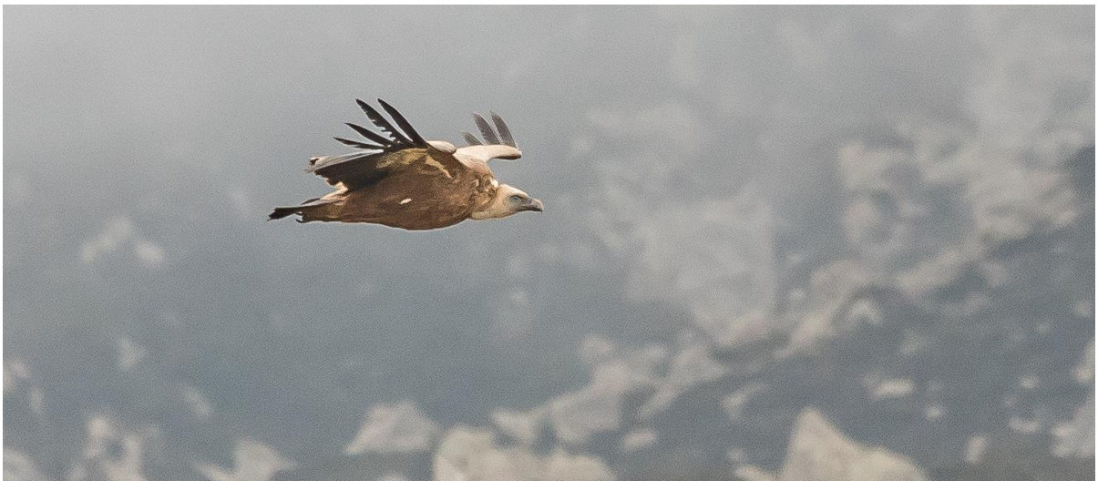
Afbeelding: Een veel waargenomen soort: de vale gier.