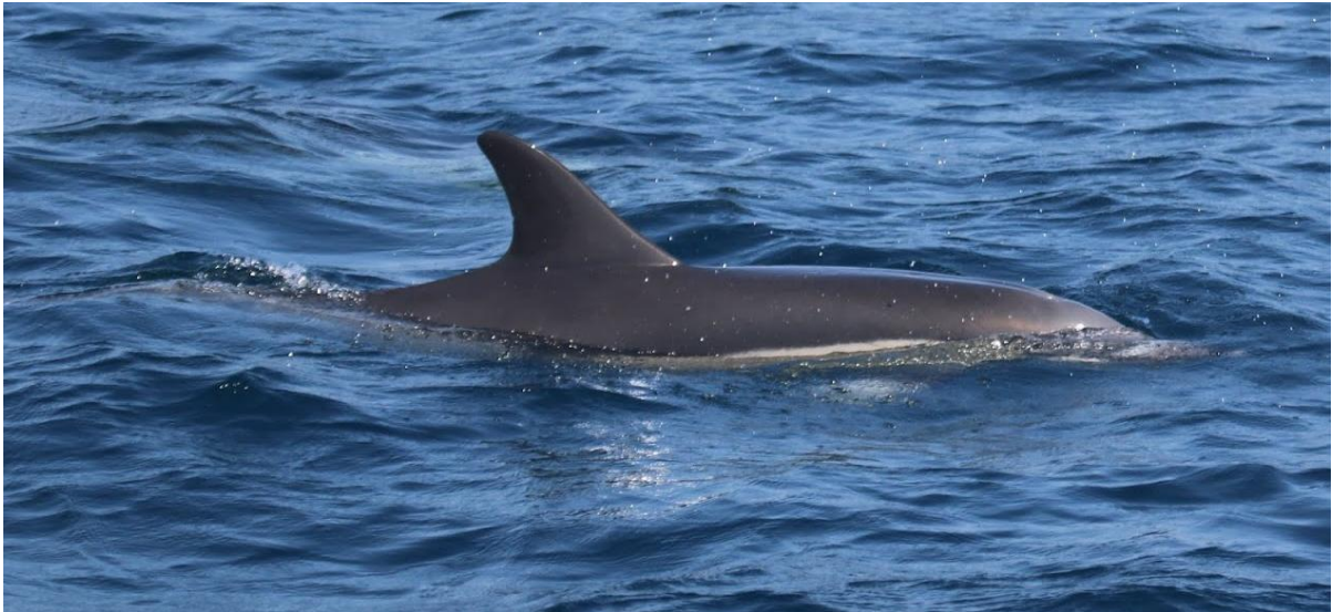
Afbeelding: Tijdens de bootexcursie is de soort gewone dolfin meerdere malen waargenomen.