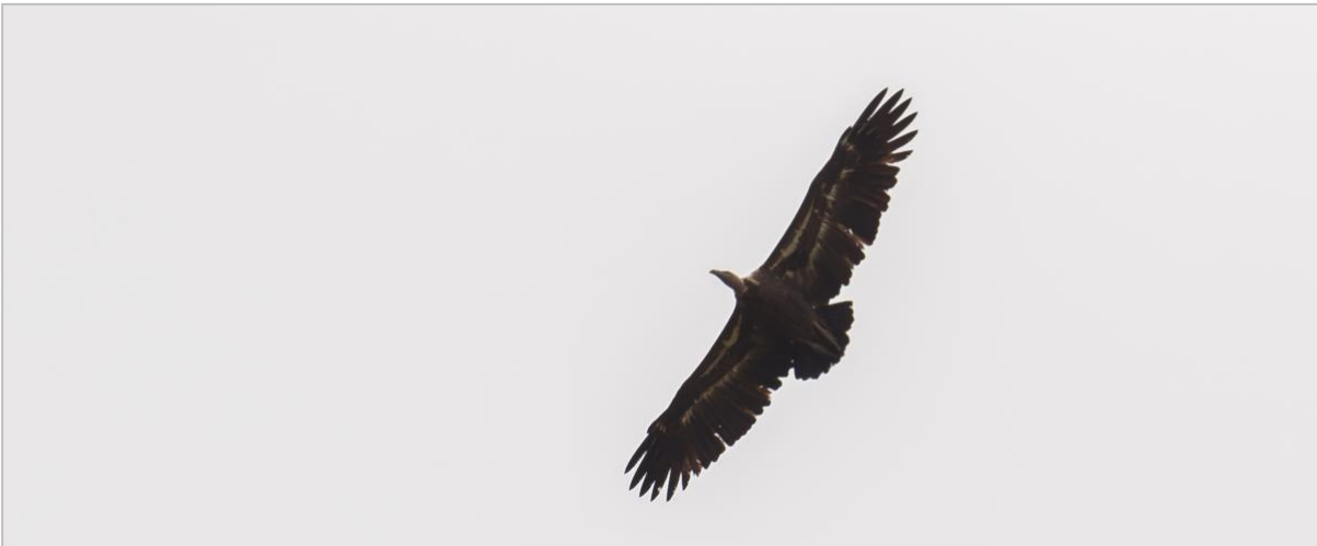
Afbeelding: We hebben meerdere Afrikaanse soorten gezien in zuid Spanje, waaronder deze Rüppels gier.