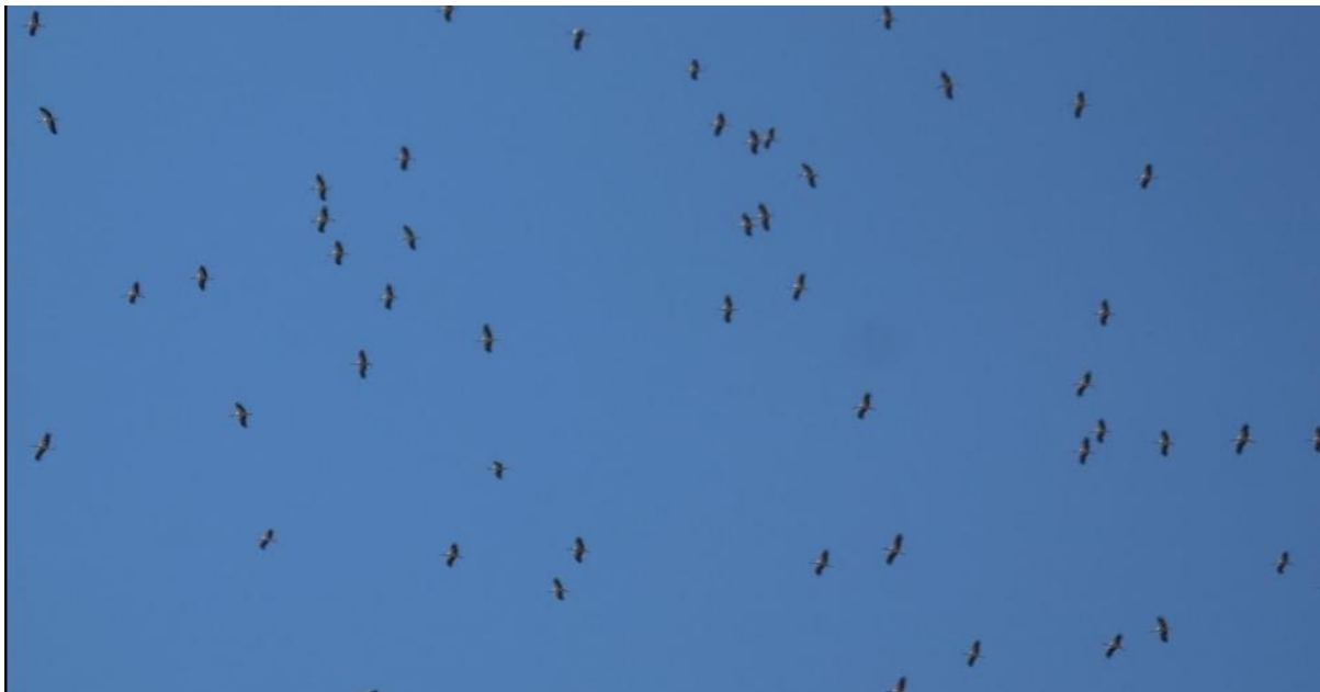
Afbeelding: De meeste trek wat waargenomen is betref kleine aantallen, maar we hebben ook wel grotere aantallen vogels gezien in de lucht. Zoals hier een lucht vol ooievaars.