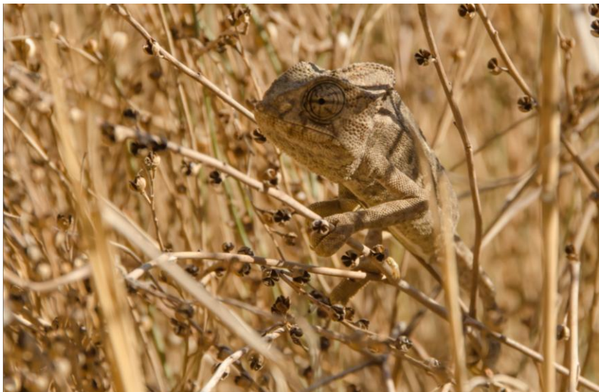
Afbeelding: Na enig zoeken konden we toch nog genieten van dit bijzondere reptiel; de inheemse kameleon.

Om acht uur gaan we aan tafel en genieten we nog één keer van een Spaanse maaltijd.