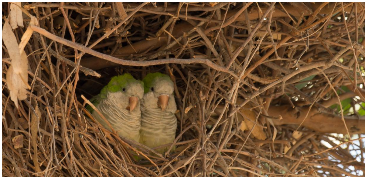
Afbeelding: Nog enkele uren voordat we opstegen hebben we nog een nieuwe soort waargenomen voor de reis, de monniksparkiet.