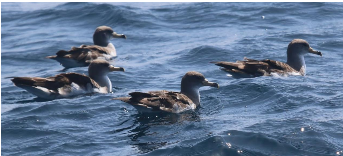
Afbeelding: De Kuhls pijlstormvogels hebben we herhaaldelijk waargenomen.