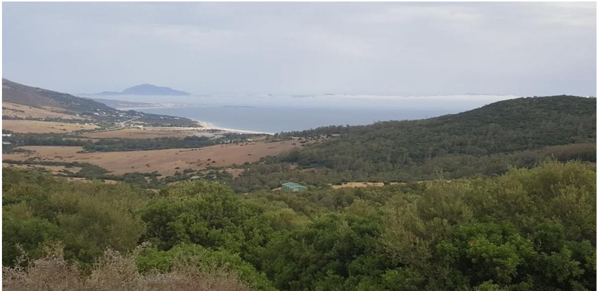
Afbeelding: Door de korte oversteek en de enkele valleien rond Tarifa is dit een bijzondere geschikte plek om de vogeltrek waar te nemen.