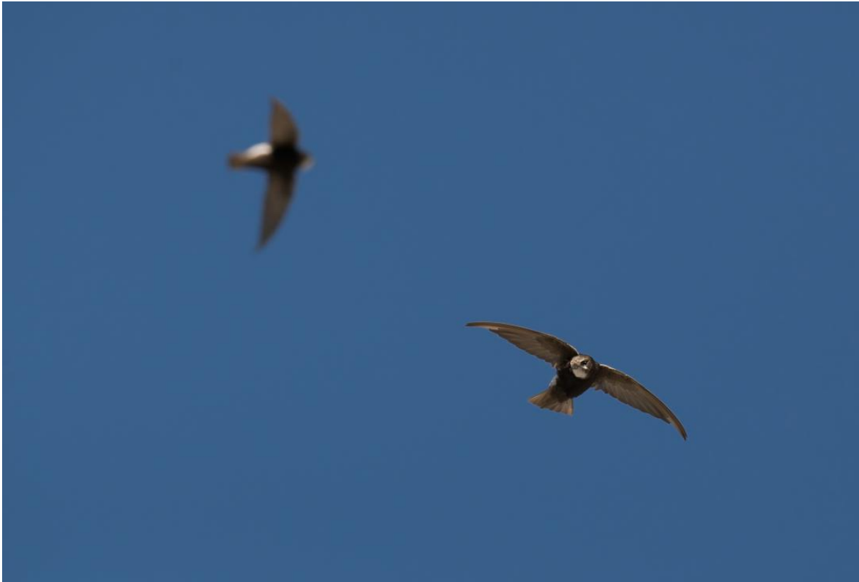
Afbeelding: Door het bezoeken van de enige kolonie huisgierzwaluwen in Europa heeft iedereen de soort mooi kunnen waarnemen.

Als we na het lijsten om acht uur aan tafel gaan, zien we een Spaanstalige menukaart liggen. Als deze vertaald wordt zodat er gekozen kan worden, wekt dit enige weerstand. Er blijken allemaal typisch lokale gerechten op te staan als 'bloed met ui', koeienwang, rog en haai... Als er dan gekozen is en de bestelling is opgenomen, komt de ober terug met de mededeling dat 'dat het menu van de lunch' was en brengt de goede menu kaart. Hierop staan gerechten die meer bekend klinken en we kunnen er hartelijk om lachen.