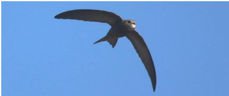
Afbeelding: Er zijn diverse soorten gierzwaluwen gezien tijdens de reis: de 'gewone' gierzwaluw, huis-, Kaffer-, Alpen- en (zie links) de vale gierzwaluw.

Bij de lagune lopen we over het vlonderpad, wat omgeven is door struiken. Hierin zitten enkele zangvogels, als grasmus, Cetti's zanger en bonte vliegenvanger. Ook vliegen er diverse zwaluw soorten; huis-, boeren- en oeverzwaluw en een enkele vale gierzwaluw die zich erg goed laat bekijken. Op de naastgelegen akker zien we tussen de bomen nog een paar rode patrijzen, een leuke aanvulling.