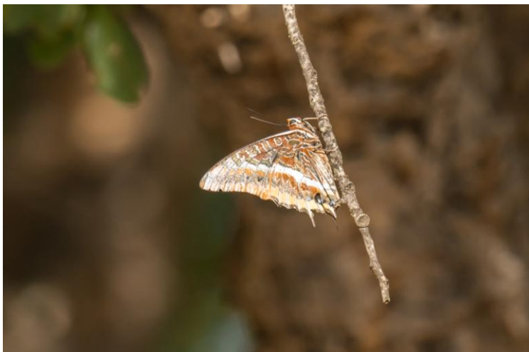
Afbeelding: tijdens de reis was er gepaste aandacht voor andere soortgroepen dan vogels. Zo stond het waarnemen van een Pasja vlinder hoog op het verlanglijstje.

Onderweg daar naar toe stoppen we nog bij een brug over een riviertje. We rijden door het kurkeikengebied (Los Alcornocales), waar het redelijk droog is. We zien dat de kurk van de kurkeiken is gewonnen, en dat dit al tientallen jaren gebeurd bij sommige bomen. We stoppen bij het riviertje en omdat hier nog water is, bied dit een nieuw biotoopje kansen op andere soorten. We zien hier oa libellen, vlinders (als de populaire Monarchvlinder) en een ree, terwijl de roofvogels hoog boven ons blijven door vliegen.