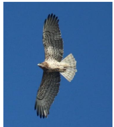
Afbeeldingen: Soorten die veel zijn waargenomen op de telposten zijn de dwergarend (links), de wespindief (midden) en de slangenarend (rechts).