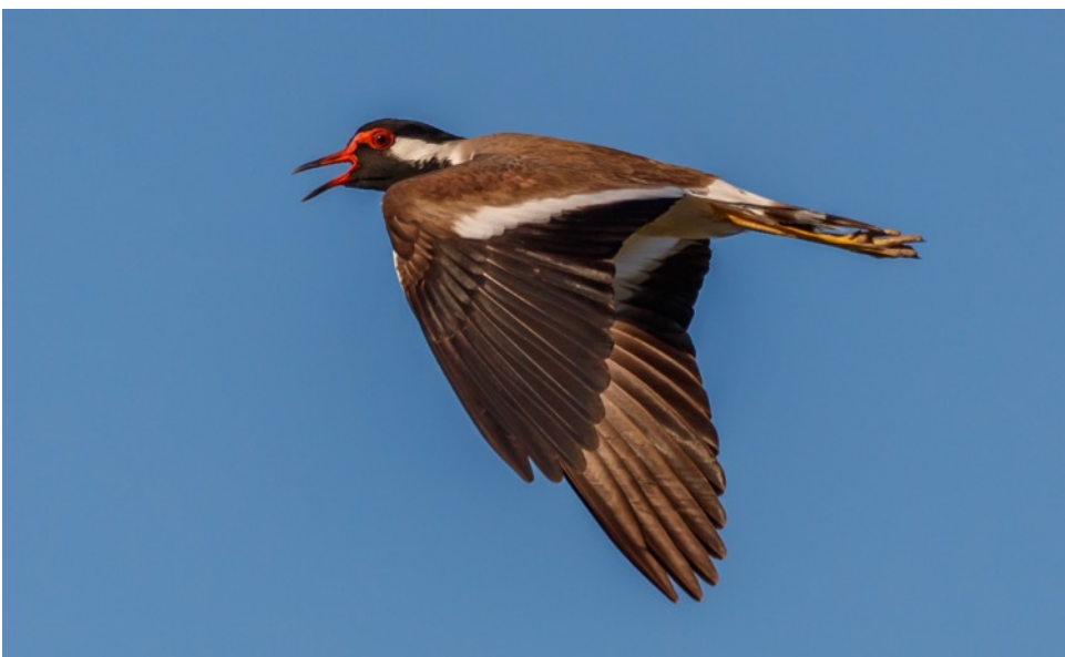
Indische Kievit (Willie)