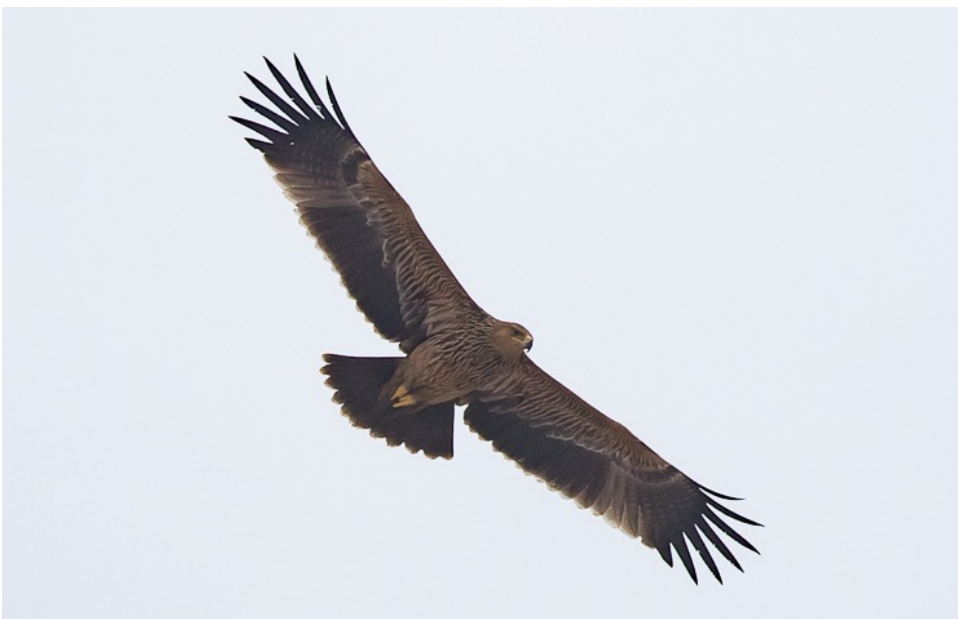
Keizerarend (Jos vdB)