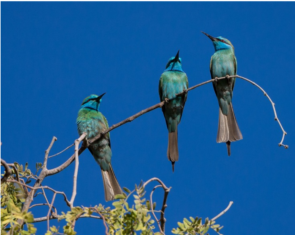
Kleine Groene Bijeneter (Joop)