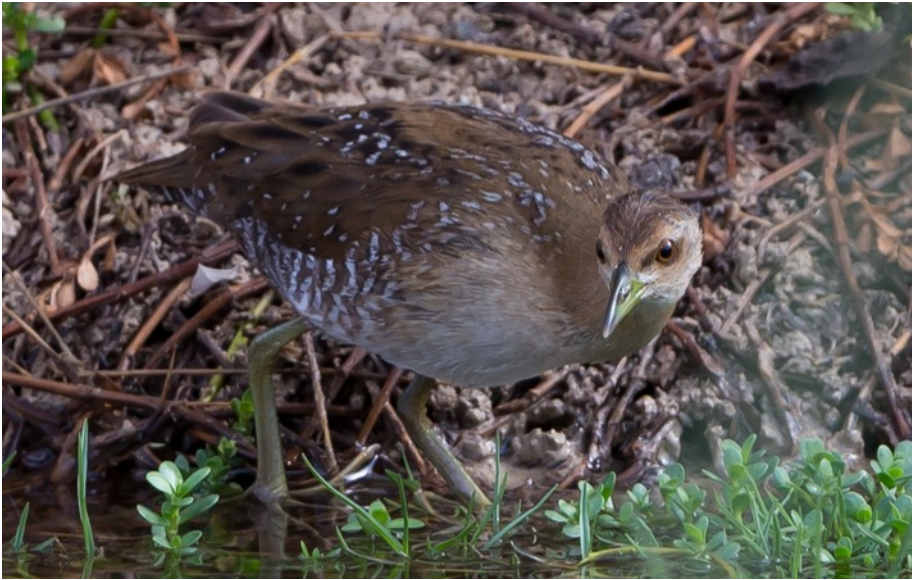
Klein Waterhoen (Joop)