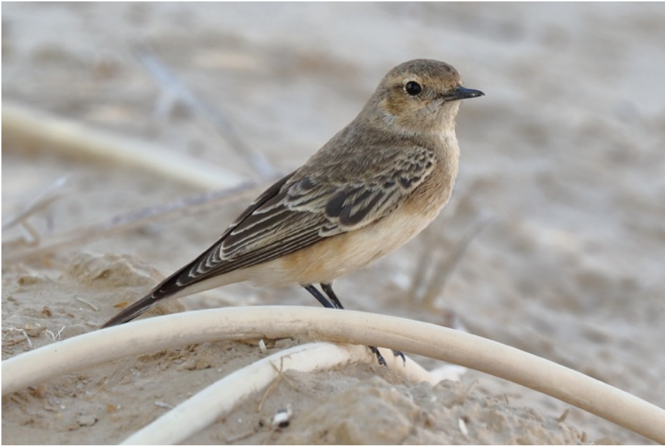
Bonte Tapuit (Gert-Jan)