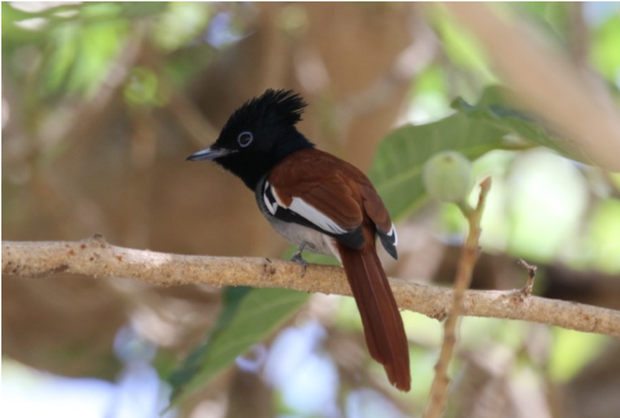
Afrikaanse Paradijsmonarch (Hans)