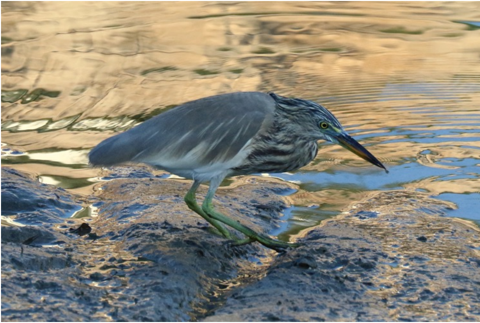
Indische Ralreiger (Gert-Jan)