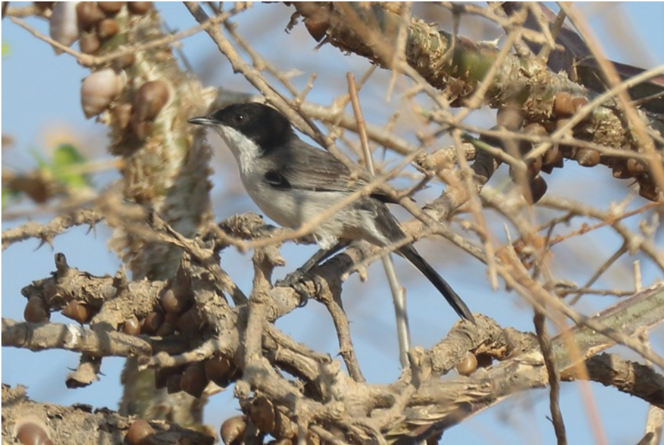
Arabische Zwartkop (Gert-Jan)