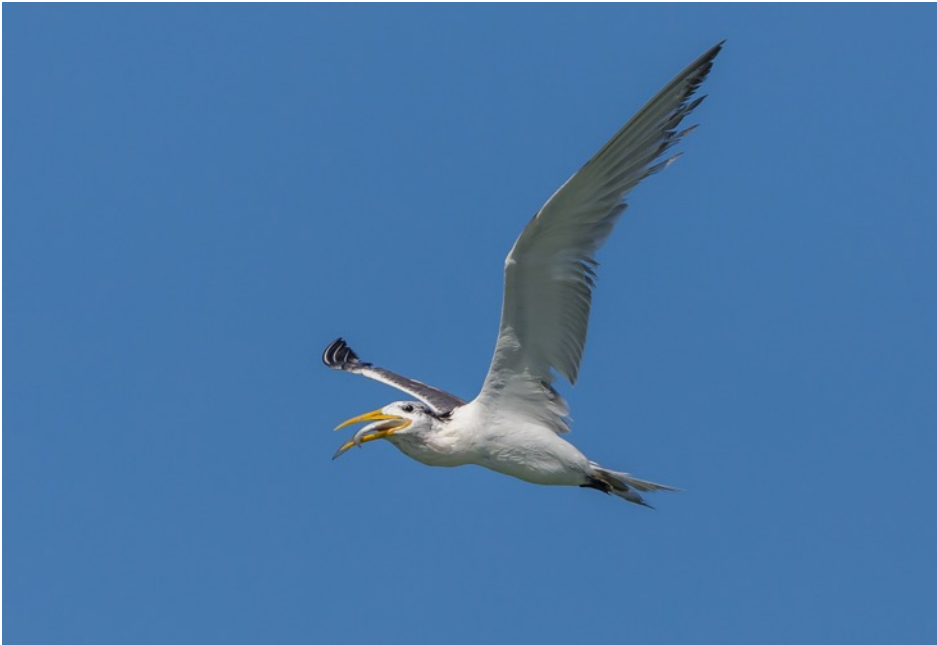
Grote Kuifstern (Joop)