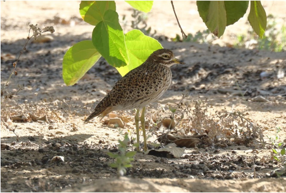
Kaapse Griel (Gert-Jan)