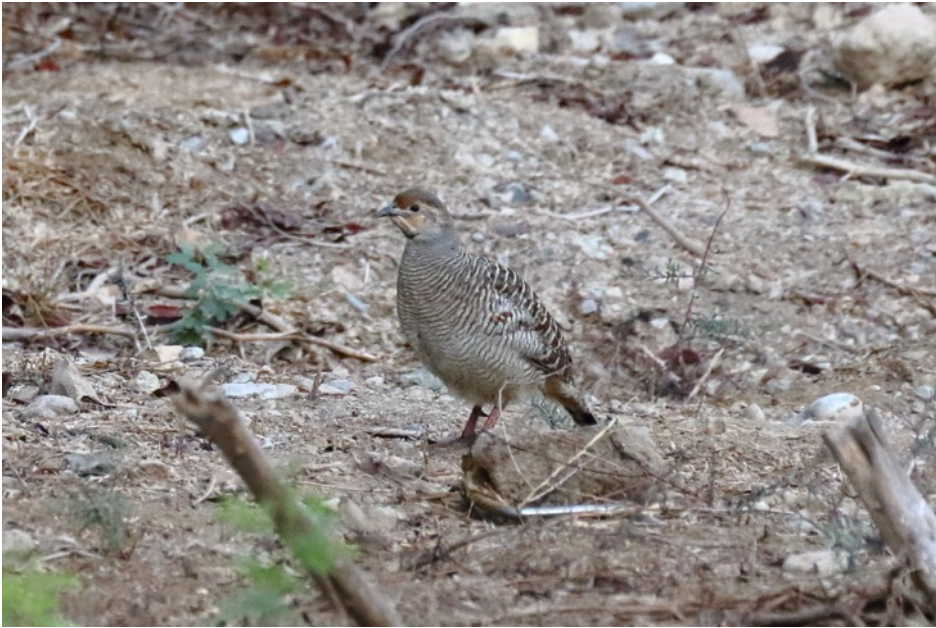
Grijze Frankolijn (Gert-Jan)