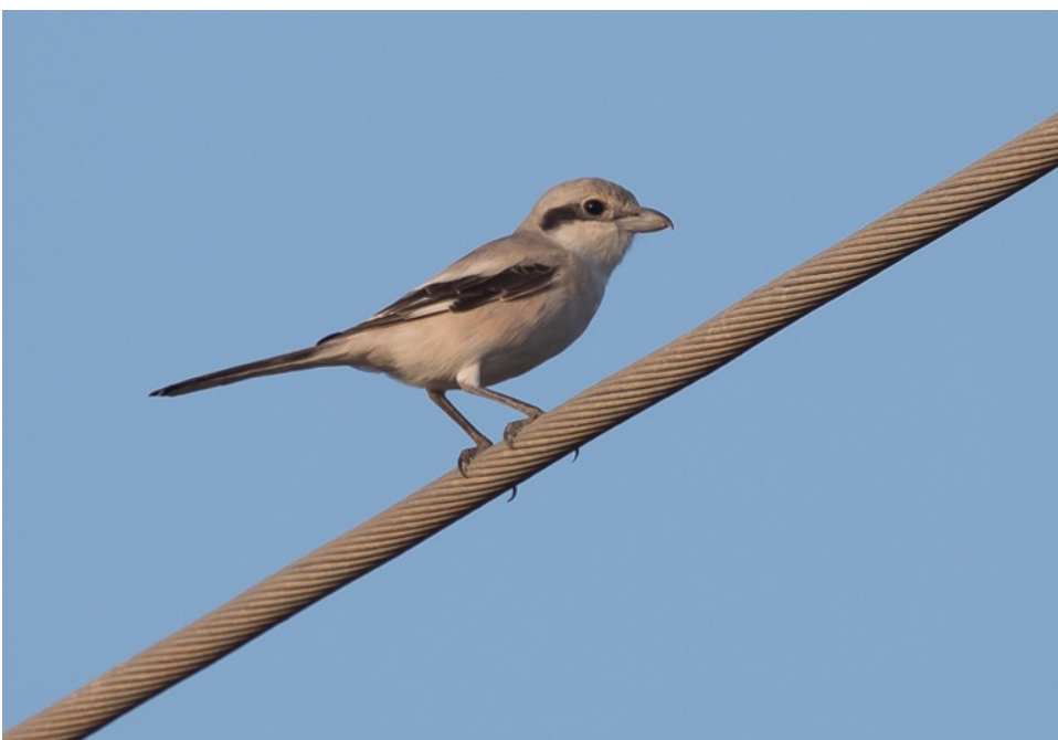
Steppeklapekster (Jos vdB)