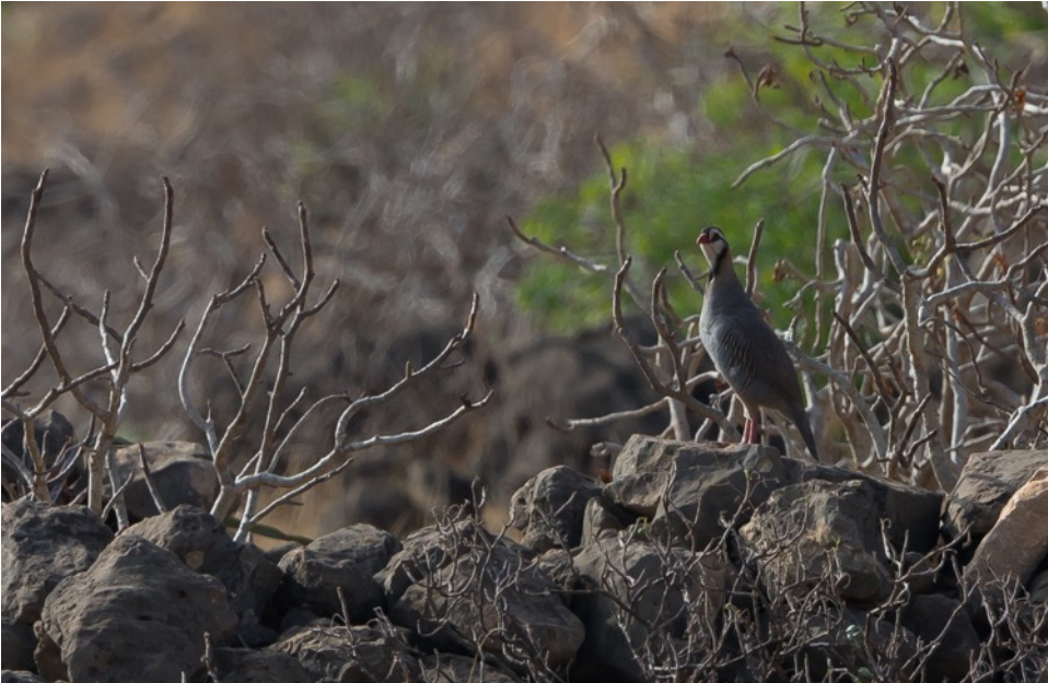
Arabische Steenpatrijs (Joop)