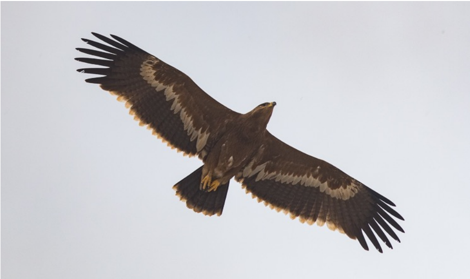
Stepparend (Jos vdB)