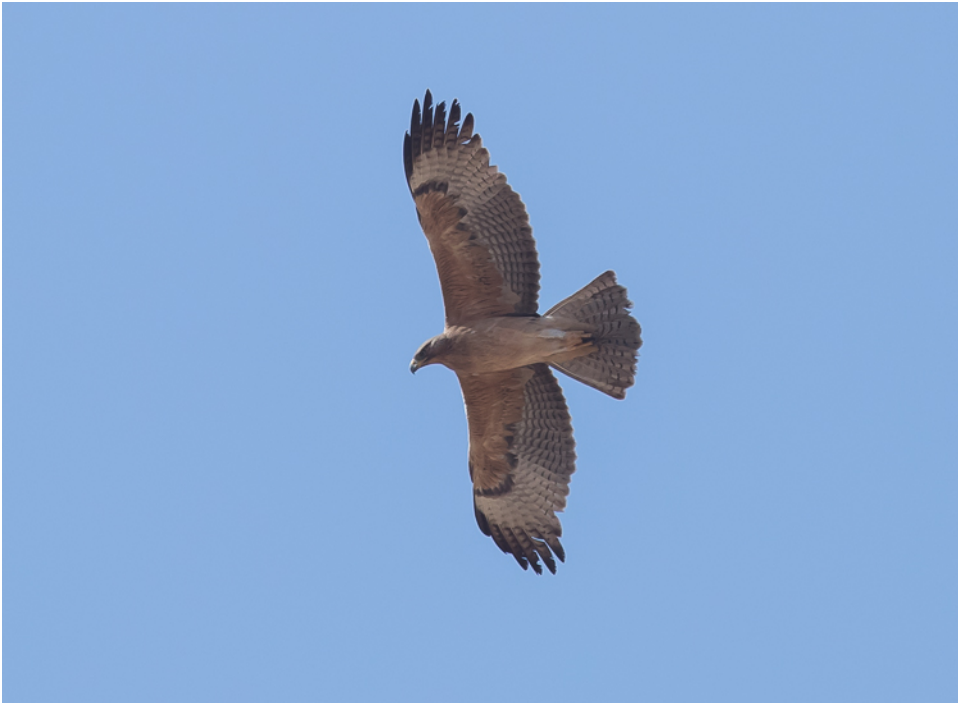
Havikarend (Jos vdB)