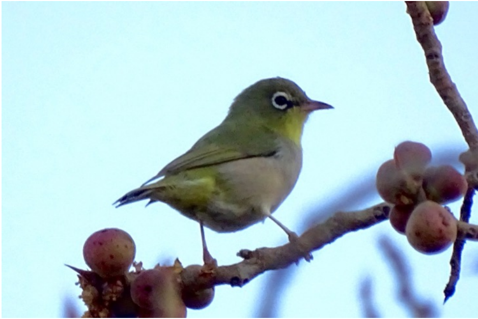
Abessijnse Brilvogel (Dorine)