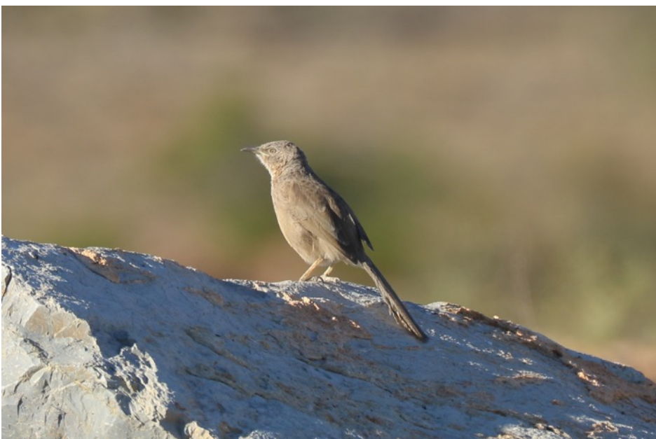
Arabische Babbelaar (Gert-Jan)