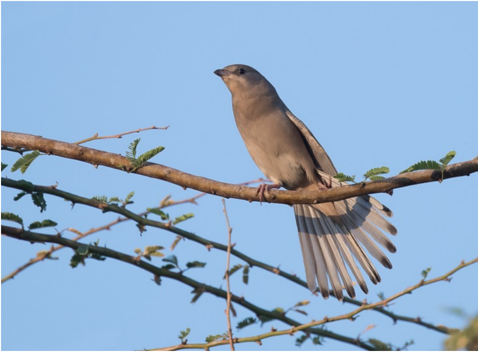
Zijdestaart (Jos vdB)