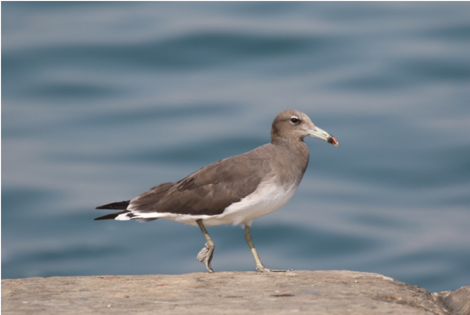
Hemprich Meeuw (Hans)