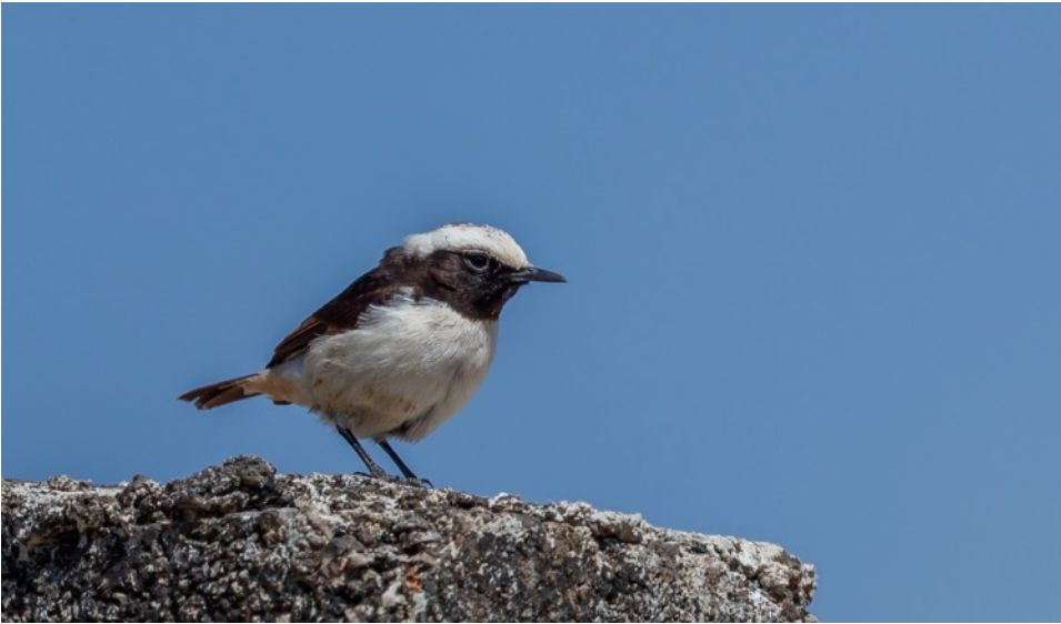
Arabische Rouwtapuit (Willie)