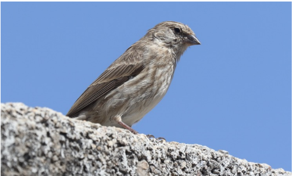
Jemenitische Kanarie (Gert-Jan)