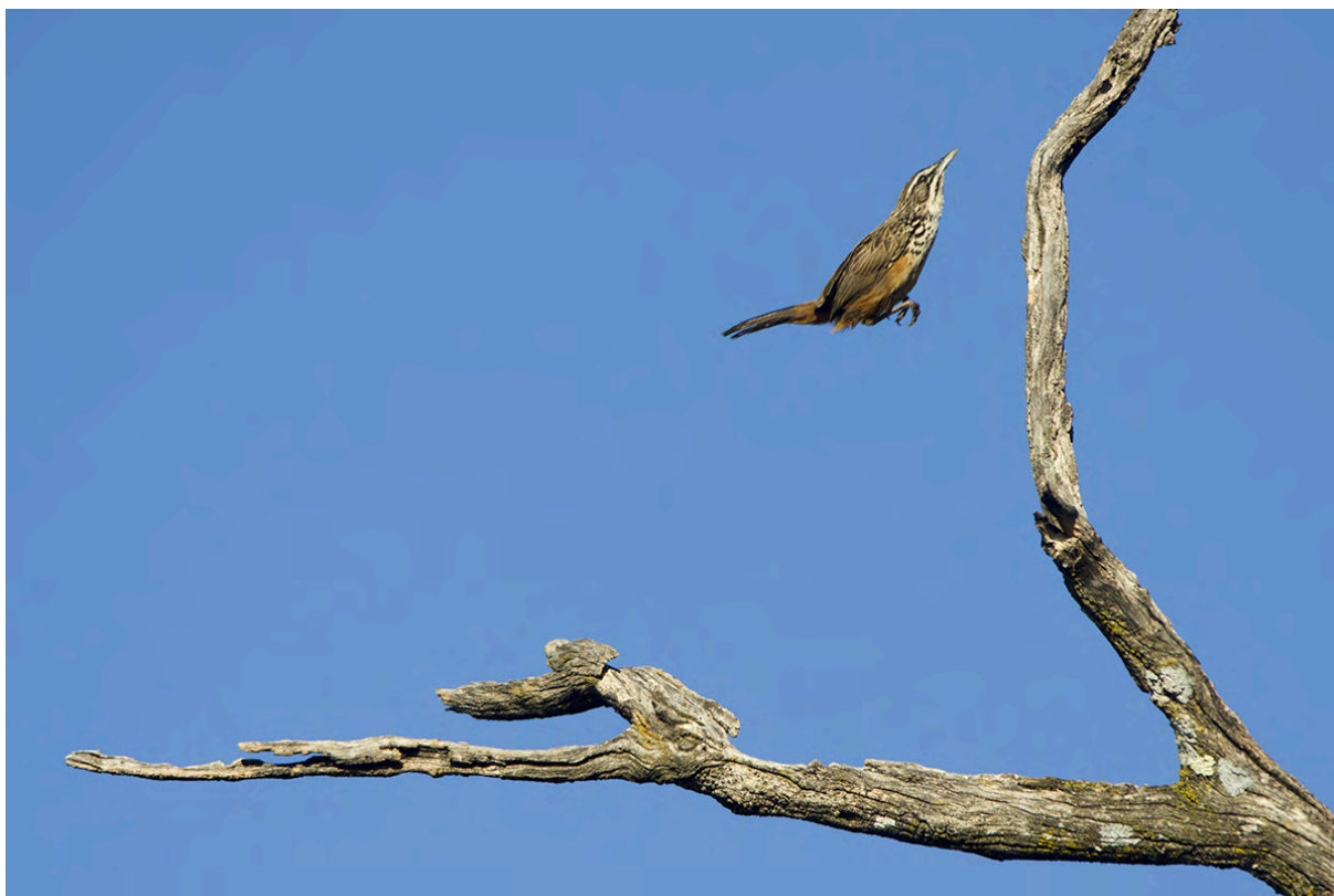
Damara Rockrunner, Waterberg