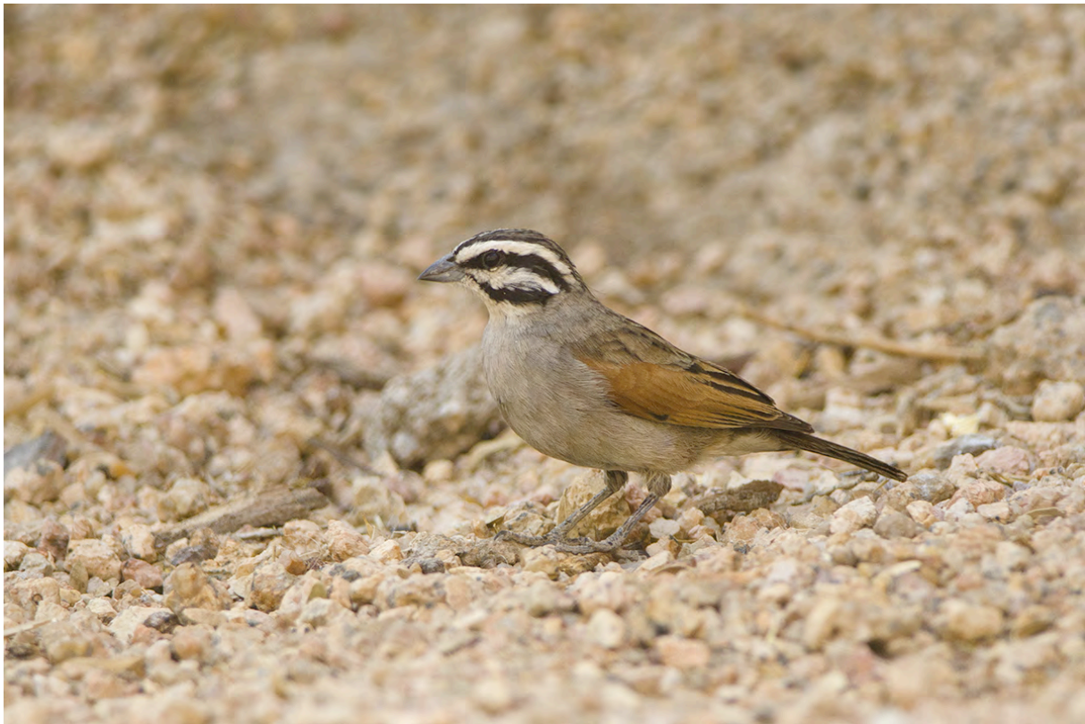
Cape Bunting, Spitzkoppe, Jacob Garvelink

Afrikaans moment. We lijsten bij het kampvuur en onder het genot van een wijntje of biertje. De eerste nacht kamperen verloopt goed. Een nachtexcursie levert niet een nachtzwaluw op helaas.