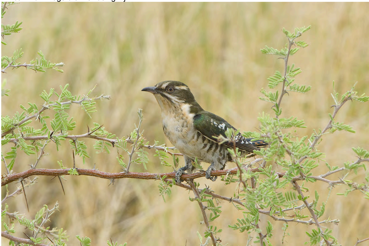
Dideric's Cuckoo, Etosha