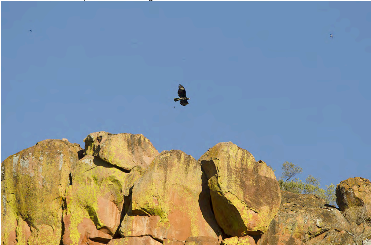
Verreaux's Eagle voor de Waterberg met Alpengierzwaluwen op de achtergrond, Jacob Garvelink