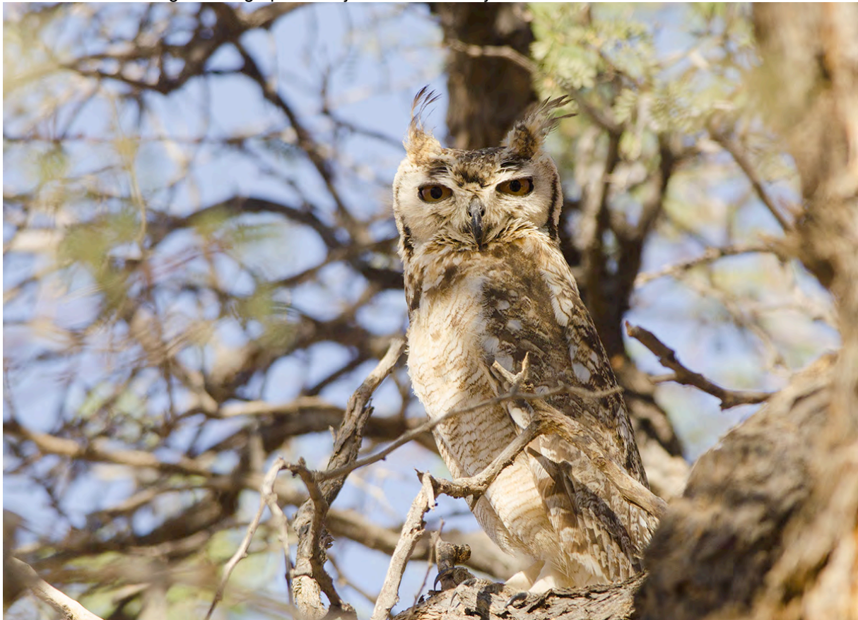
Spotted Eagle Owl, Sossousvlei, Jacob Garvelink

We hebben vroeg ontbijt omdat het hier al snel opwarmt. In de tuin van de lodge vliegen Cape Sparrows en Familiar Chats. We rijden richting de ingang van de beroemde Sossousvlei met zijn immense rode zandduinen. Deze kleuren mooi in het ochtendlicht. Onderweg stoppen we voor de eerste Spike-heeled Larks en een Pygmy Falcon laat zich mooi zien in de buurt van een groot Social Weaver nest waar deze soort zich vaak mee associeert. Bij Elim Dune beklimmen we het duin op zoek naar de Dune Lark. Deze laat zich hier niet zien, maar bij het terugkeren naar de bus wacht er een andere mooie verrassing op ons. In de boom boven de bus zit een prachtig paartje Spotted Eagle Owls! De ene vogel vliegt weg, maar de tweede laat zich schitterend bekijken en fotograferen. We rijden terug naar de hoofdweg, maar moeten al snel weer stoppen voor een mooie familie groep Bat-eared Foxes die langs de weg op zoek zijn naar hun ontbijt.