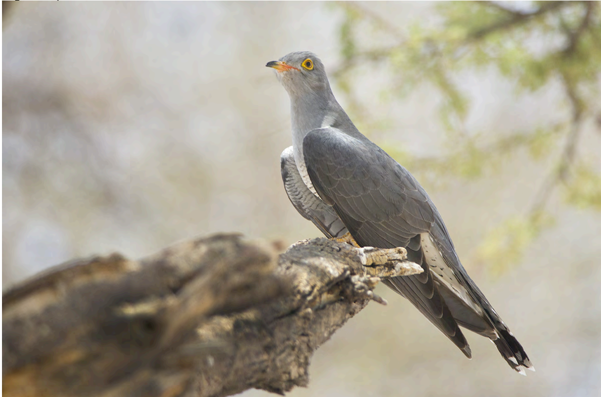
African Cuckoo, Etosha, Jacob Garvelink

gegeven moment de regen met bakken uit de lucht komt vallen. Een groep Zebra's geniet hier van. Een groep toeristen in een open safari voertuig minder! Als de regen is opgeklaard rijden we verder naar het waterhole. Hier aangekomen zijn we getuigen van het paren van twee Leeuwen aan de rand van het waterhole. Het waterhole zelf heeft Red-billed Teals en Bosruiters in de aanbidding, maar verder weinig wild. De terugrit is op een wat verhoogd tempo en we zien niet veel meer. Ondanks dat hebben we een prachtige dag Etosha achter de rug. We koken in de regen en ook gaan we met lichte regen slapen.