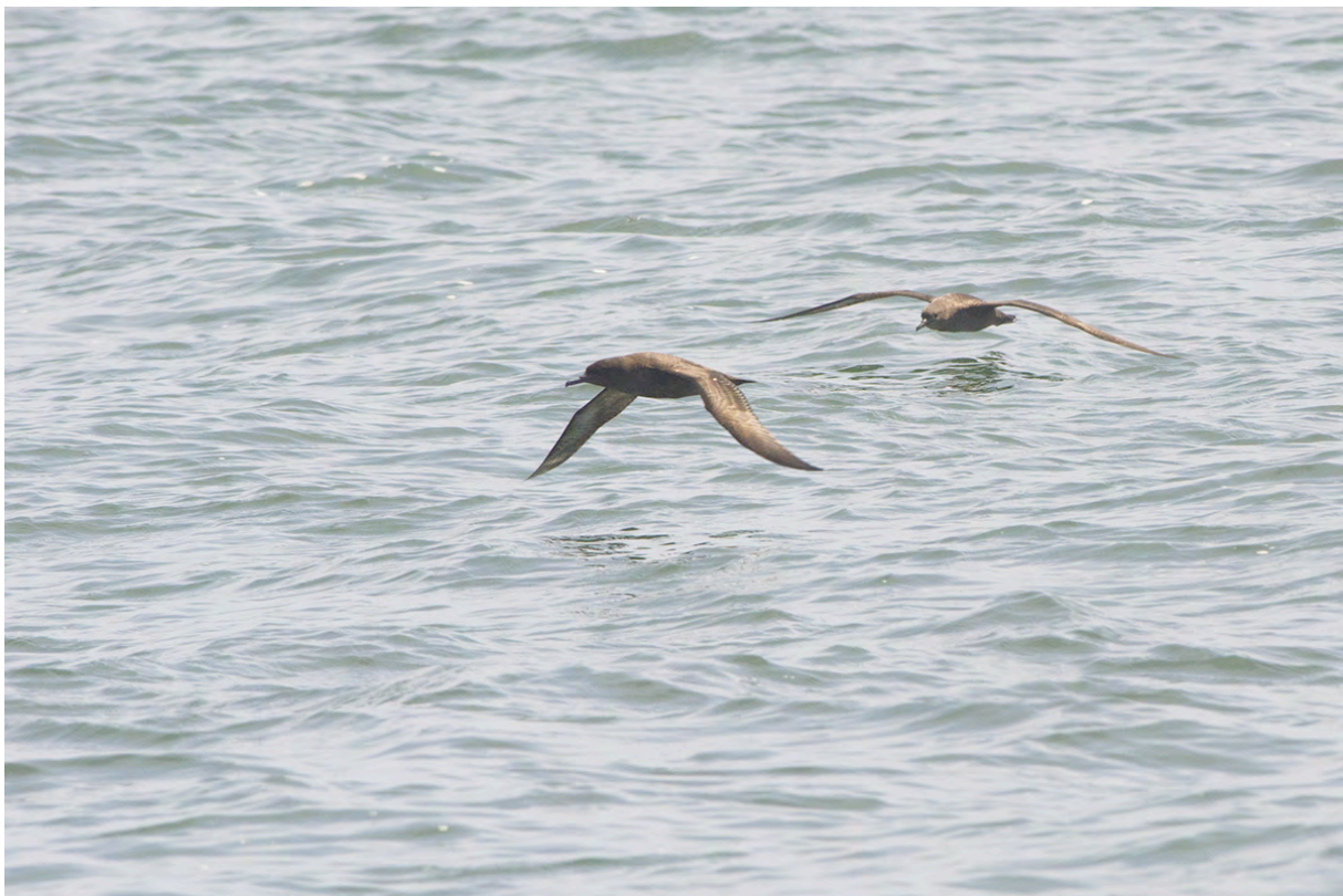
Sooty Shearwaters, Walvisbaai, Jacob Garvelink

We eten bij Ocean Basket niet ver van de riviermonding. Het heerlijke zeebanket smaakt hier goed! We lijsten in de guesthouse en de Sooty en Bokmakierie maken het tot soorten van de dag.