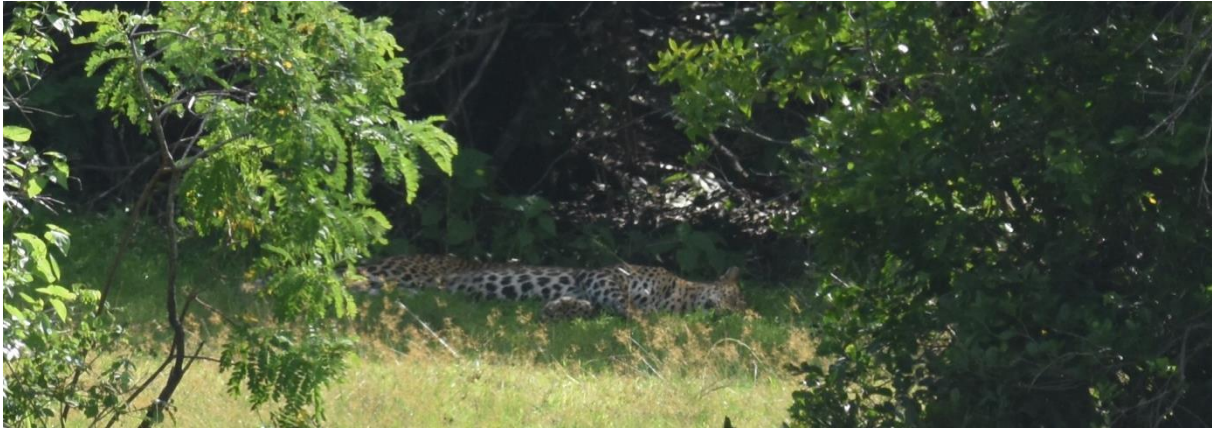
Luipaard in Yala NP, LS

Allerlei watervogels passeren de revue waaronder Ruddy Turnstone, Yellow-wattled Lapwing en Marsh sandpiper. Met een perfecte schutkleur, bijna onzichtbaar, zien we een Indian Nightjar zitten op een tak in het struikgewas.