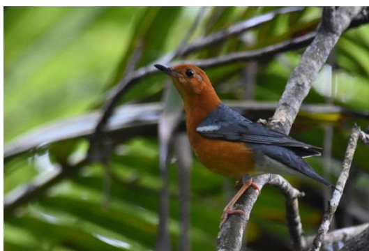
Forest Eagle Owl en Orange-headed Thrush, Tissa, LS