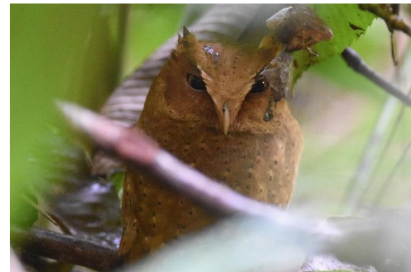
Sri Lanka Hanging Parrot en Serendib Scops Owl, Sinharaja, LS