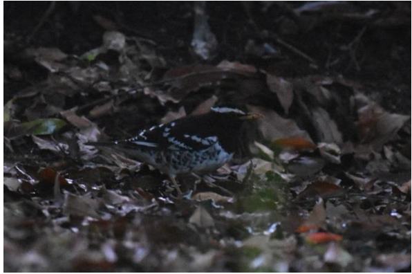
Pied Thrush vrouwtje (l) en mannetje, Victoria Park, Nuwara Eliya, LS

Dit gebied is ook bekend onder de naam Kelani Valley Forest Reserve en is qua habitat en soorten vergelijkbaar met het eerder bezochte Sinharaja Forest Reserve. Kitulgala is opgericht ter bescherming van de afwatering van de Kelani River. Onderweg stoppen we om de Sri Lanka Whistling Thrush te zien, maar die zien we helaas niet. Wel zien we de Black-lipped Lizard (vrouwtje); deze soort heeft zijn naam te danken aan het mannetje: hij heeft zwarte lippen.