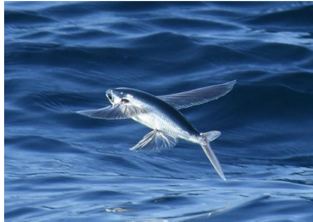
Arabische Stern, de 3 e voor Sri Lanka, en een vliegende vis tijdens de walvistorcht vanaf Mirissa, LS