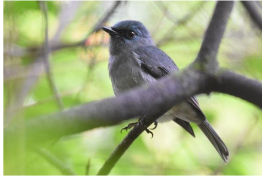
Sri Lanka Wood Pigeon en Dull-blue Flycatcher, endemen van het hoogland van Sri Lanka, Surrey Estate, LS

De reis richting Nuwara Eliya wordt na de lunch nog even onderbroken om op zoek te gaan naar de lastige Sri Lanka Whistlingthrush maar helaas zonder succes. Langs het snelstromende beekje vliegt nog wel een flock en gaf de gelegenheid om enkele soorten in te halen of nu wel goed te kunnen zien.