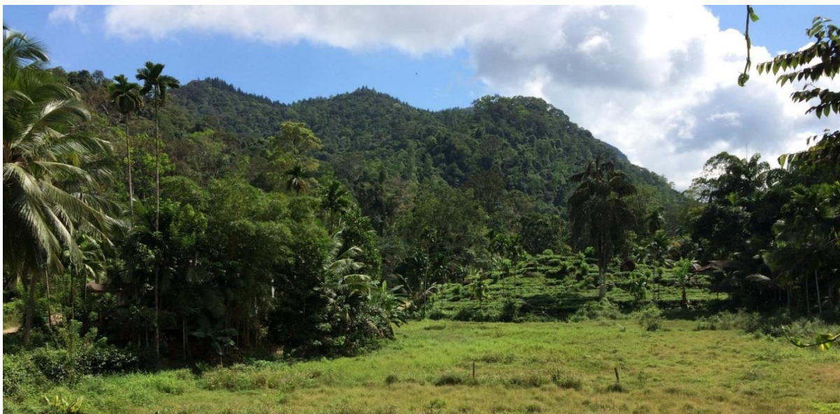
Uitzicht vanuit de Blue Magpie Lodge, LS

We verzamelen in de vroege ochtend op Schiphol om via Frankfurt naar Colombo te vliegen. Aankomst is om 04:30h de volgende ochtend en na enkele formaliteiten ontmoeten we Dhammi (gids) en Sunil (chauffeur) die ons de komende twee weken begeleiden, ondersteund door Dashan (assistent in de bus) en Rohanna (chauffeur van de bagage). Het is net licht geworden, we voelen de tropische warmte en zien al de eerste Large-billed en House Crows op het vliegveld. Het is ongeveer 4 uur rijden naar het centraal zuidelijk gelegen Sinharaja Forest Reserve waar we verblijven in de Blue Magpie Lodge. Vanuit onze comfortabele bus rijden we langs moeras-gebieden met veel Indian Pond Herons, maar ook Great, Intermediate, Little en Purple Herons. Enkele Oriental Darters vliegen langs, net als Little Cormorants. Brahminy Kites cirkelen in de lucht en bij de eerste theestop vliegen Sri Lanka Hanging Parrots over: de eerste endem is binnen! Even later laat een Shikra op een paal zich mooi bekijken. Onderweg naar de lodge zien we al enkele roofvogels: Oriental Honey Buzzard, Black Eagle en Crested Serpent Eagle.