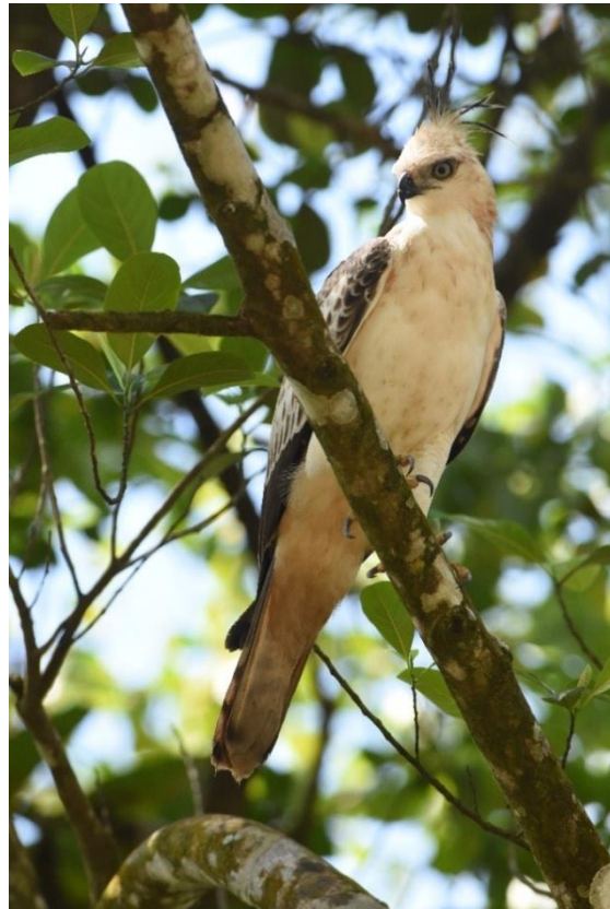
Asian Paradise Flycatcher en Crested Hawk-Eagle, Blue Magpie Lodge, LS