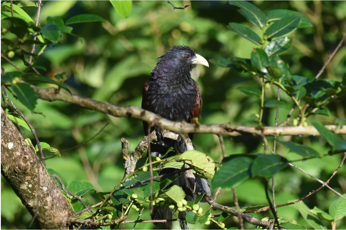
Green-billed Coucal, Sinharaja, LS

We vertrekken met de bus en stoppen bij Kalamatiya, een prachtig wetland langs de kust waar het alweer schitterend vogelen is. We zien er ook nog enkele restanten van de ravage die de tsunami er in 2004 aanrichtte. Pheasant-tailed Jacana's lopen over de plompebladeren terwijl langs de oevers Great en Indian Thick-knees zitten, naast vele Grutto's, Poelruiters, Mongoolse Plevieren en als klapper een Grey-headed Lapwing! Het blijkt pas de 4 e waarneming voor Sri Lanka te zijn, een echte dwaalgast dus...wauw!