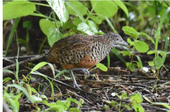
Grey-necked Bunting (2 e voor Sri Lanka!) en Barred Button-Quail, Yala NP, LS

Weldra komen we op een paradijselijke waterrijke locatie met Asian Elephant, Water Buffalo, Spotted Deer, Pintail Snipe, Lesser Sand Plover, Red-wattled Lapwing, Yellow Bittern, Lesser Adjutant, Pacific Golden Plover, en allemaal heel dicht bij onze voertuigen. Moeilijk zichtbaar tussen de takken zien we nog een Brown Fish Owl. We ontbijten aan een idyllisch zeestrand met zicht op Elephant Rock. Er staat ook een monumentje ter nagedachtenis aan de tsunami in 2004. In dit park alleen al kwamen 250 mensen om het leven door 6 meter hoge golven die via de riviermondingen tot 1,5 km ver landinwaarts reikten! Purple-rumped Sunbirds fladderen er in de bomen waar we ook de eerste Thick-billed Flowerpecker van de reis te zien krijgen.