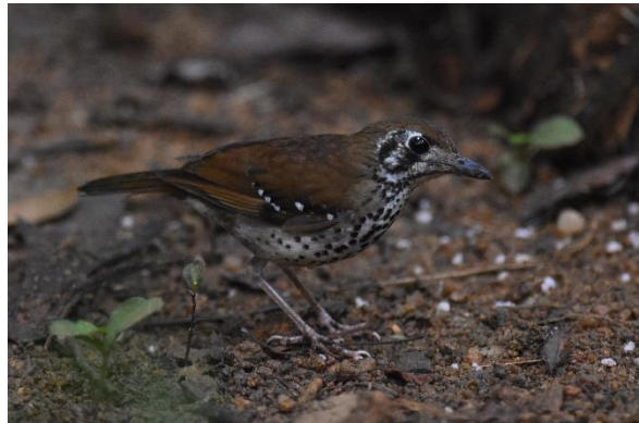
Sri Lanka Spurfowl en Spot-winged Thrush, Sinharaja, LS