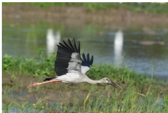
Pheasant-tailed Jacana en Asian Open-billed Storks, Waikkal, LS