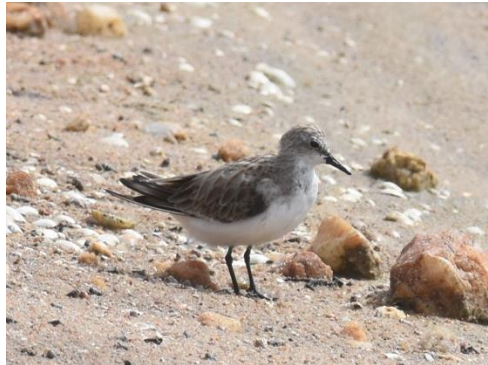
Yellow-wattled Lapwing en Roodkeelstrandloper, Bundala, LS

Terug bij Tissa hebben enkele jongetjes contact gehad met Dhammi: er blijkt een Forest Eagle Owl te zitten op nog geen 20 minuten rijden van het hotel...erheen dus! We zetten de bus neer in een bosrijke omgeving met woningen en volgen de aanwijzingen. De vogel is schuw dus we moeten heel voorzichtig zijn, niet meer dan 2 personen tegelijk. De eerste twee lopen erheen en zien de vogel hoog in de boom tussen de takken zitten. Maar binnen enkele seconden begint de vogel al te bewegen en vliegt de boom uit, naar de overkant van de rivier.....balen! Maar de vogel is geland dus misschien zit ie daar wel ergens zichtbaar. Omrijden dus en opnieuw zoeken. Het begint echter aardig te regenen zodat we een korte pauze moeten houden. Daarna kunnen we de vogel helaas niet meer vinden, een Orange-headed Thrush was een schrale troost.