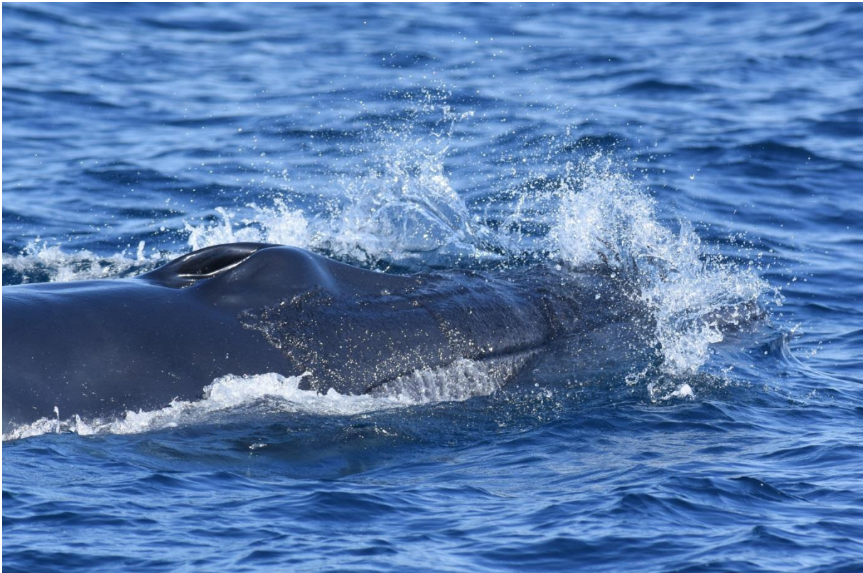
Bryde's Whale tijdens de walvistorcht vanaf Mirissa, LS

Op de terugweg zien we een mooie groep Spinnerdolfijnen maar qua vogels blijft het verder rustig. Na een heerlijk ontspannen middag in het hotel (zwembad én zee voor de deur!) zoeken we in de namiddag nog naar plekken voor roestende sterns. Na consult met Nils van Duivendijk wordt namelijk bevestigd dat de gefotografeerde stern een eerste winter Arabische is, de derde waarneming voor Sri Lanka! Het kan niet op deze reis... We proberen de haven omdat daar bij terugkomst veel Witwangsterns zaten maar zo laat in de middag zijn ze allemaal al vertrokken. In de verte zien we wel een rotseilandje liggen, mét sterns! Het is te ver om er iets van te maken zodat we een schipper vragen of hij ons tegen een vergoeding even daarheen kan varen. Nou, dat was geen probleem! Dus binnen 5 minuten zitten we in een professionele zodiac met een 150pk motor en zijn we binnen enkele minuten op de plek! We zien veel Kuifsterns maar ook enkele Bengaalse en Lachsterns. Door de kijker zie ik ook een visdiefachtige op de roost zitten en voor we er erg in hebben vliegt juist deze vogel