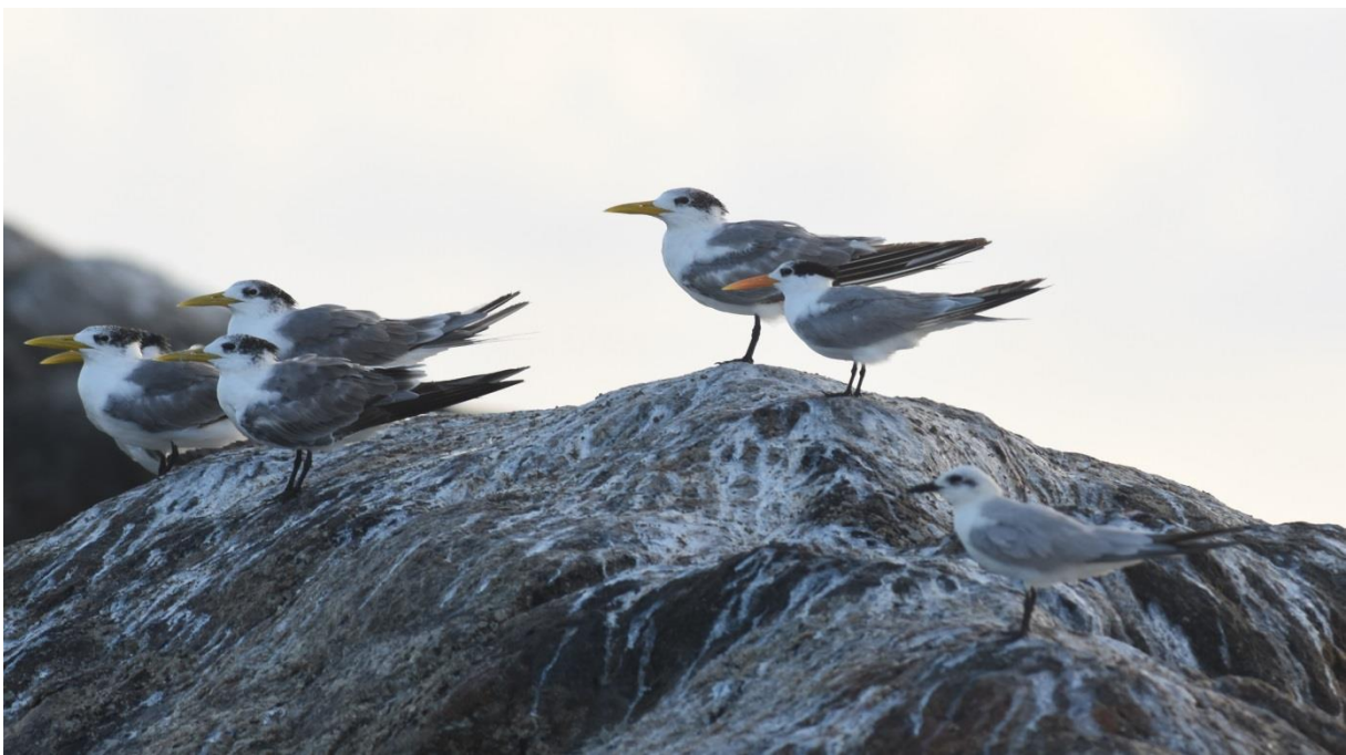
Kuifsterns, een Bengaalse Stern en een Lachstern, Mirissa, LS

van het eilandje af, in een rechte lijn naar ons bootje. Camera in de aanslag en snel foto's maken, de vogel komt fraai voorlangs vliegen, maar wat het is...? Dat zoeken we later dan wel uit. De Kuifsterns laten zich in ieder geval wél mooi zien op de rots. We varen terug naar de haven en rijden terug naar het hotel. In de avond stuur ik foto's van deze nieuwe stern opnieuw naar Nils maar dit kleed is toch een stukje moeilijker. Een 2 e -winter-vogel met kenmerken van zowel Arabische Stern als Visdief... daar komen we niet meteen uit.