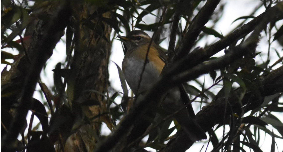
Een van de twee Eye-browed Thrush in Victoria Park, de 3 e en 4 e vogel voor Sri Lanka!