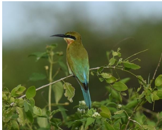
Grey-headed Lapwing (met Great Thick-knee) en Blue-tailed Bee-eater, Kalamatiya, LS

Resultaat vandaag: 110 soorten, met dank aan Dhammi, onze gids. Op de terugweg naar het hotel zien we in de schemering nog enkele Indian Nightjars die zich midden op de weg mooi laten bewonderen. Na een uitgebreid diner gaan we weer vroeg in bed want morgen starten we op tijd!