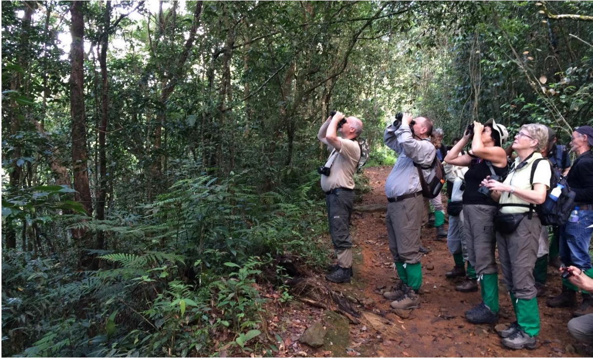
Een 'flock' komt langs in Sinharaja NP, LS

Als iedereen een voor een de vogels gezien heeft, lopen we verder door het regenwoud, op zoek naar de wereldberoemde flocks. Dhammi hoort een Sri Lanka Drongo, een van de soorten die zich altijd in flocks ophoudt. Even later zien we de vogel maar ook een scala aan andere soorten! Gelukkig beweegt de flock zich betrekkelijk langzaam zodat we de tijd krijgen om de soorten te zien én te determineren. We zien prachtige Red-faced Malkoha's maar ook Malabar Trogon, Sri Lanka Drongo, Lesser Yellownapes en Ashy-headed Laughingthrush laten zich goed bekijken. Even verderop doen we een poging voor Sri Lanka Thrush (split van Scaly Thrush) maar meer dan een opvliegende vogel zien we helaas niet.