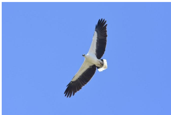
Spot-billed Pelican en White-bellied Sea Eagle, Yala NP, LS

Rond half twee zetten we onze jeepsafari voort. Nabij een stroomversnelling in een riviertje zien we verschillende grote Marsh Crocodiles. Al snel krijgt onze chauffeur een telefoontje met het bericht dat er een Sri Lankan Leopard gesignaleerd is in het park. In versnelde vaart rijden we ernaartoe. De verwachtingen zijn hooggespannen want voor vele bezoekers is een waarneming van deze toppredator het hoogtepunt van de dag. En ja, daar ligt hij (of zij), in de verte op een zij op de grond aan de bosrand. We zien 'm even op z'n rug draaien en z'n kop opheffen. Het is een ondersoort van het luipaard die enkel op Sri Lanka voorkomt.