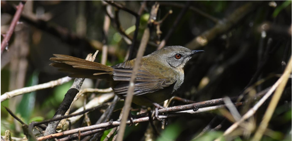
Sri Lanka Bush Warbler, Horton Plains, LS

We gaan verder de Plains op en zien dat een van de kenmerkende vogels hier de Pied Bushchat is. Bij een plek waar wat gebouwen staan en waar we van koffie en thee kunnen genieten zien we aardig wat Hill Swallows. We zien ook nogal wat Sambar Deers, zelfs een die handtam is en met brood gevoerd kan worden. Wanneer we wat verderop gereden zijn ziet Dhammi, onze gids, vanuit de bus een koekoek-achtige langs een bosrand vliegen. We stappen uit, vinden de vermeende koekoek niet maar wel een mooie specht, de Greater Goldenback. Achter ons langs zweeft een Buizerd, naar later blijkt de enige van onze reis. De vogel lijkt nog het meest op een vulpinus type, een subspecies die nog niet eerder is vastgesteld in Sri Lanka. Omdat de vogel van ons af drijft, lukt het niet goed alle kenmerken vast te leggen, zodat we het moeten houden op Buizerd, waarschijnlijk een Steppebuizerd ssp vulpinus.