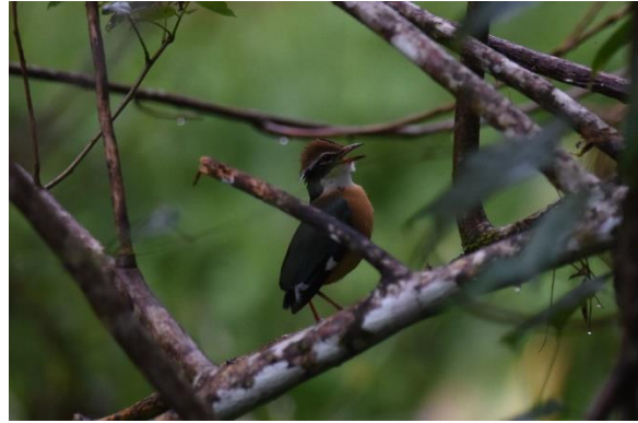
Sri Lanka Frogmouth en Indian Pitta, Sinharaja, LS

De middag wordt besteed in de buurt van de lodge. We wandelen tussen de kleinschalige akkertjes en rijstvelden en zien enkele mooie endemen zoals Green-billed Coucal en Crimson-fronted Barbet. Het volgende hoogtepunt dient zich alweer aan wanneer een Indian Pitta zich prachtig laat bekijken terwijl hij in een boom zit te roepen, heel fraai en een mooie afsluiting van een indrukwekkende eerste dag.