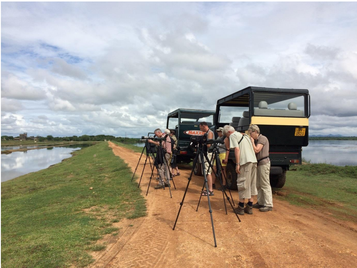
Vogels kijken in Bundala, LS

Vandaag bezoeken we vanuit Tissa het Bundala National Park, de eerste Ramsar site (een moeras- of watergebied van internationaal belang) van Sri Lanka. Bij de ingang wisselen we van voertuig en gaan we met mooie safarivoertuigen het park in. Al na enkele minuten stoppen we bij een lagune die vol zit met vogels. We zien Strandplevieren, Mongoolse Plevieren en Terek Ruiters, maar ook veel Middelste Zilverreigers en enkele Grey-headed Swamphens. Het is een savanne-achtig gebied waar we doorheen rijden, afgewisseld met uitgestrekte lagunes met brak water en zandduinen vlak achter de kust.