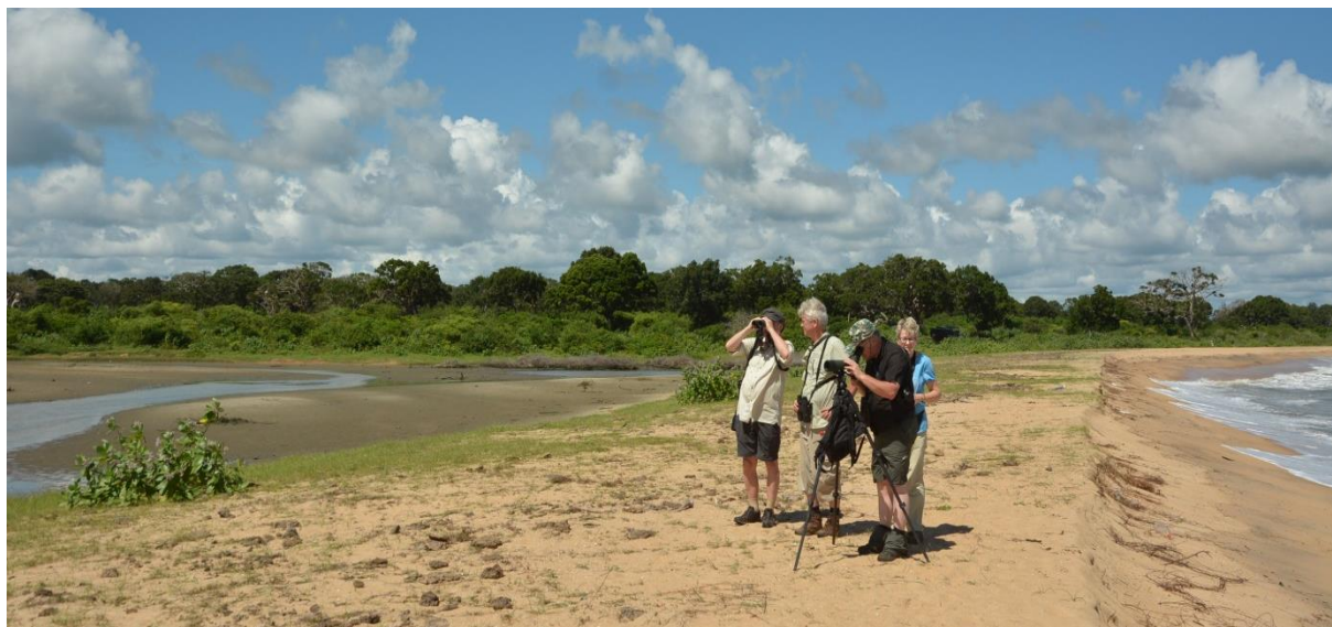
Vogelen bij de lunchplek in Yala NP, LS

Rond half twee zetten we onze jeepsafari voort. Nabij een stroomversnelling in een riviertje zien we verschillende grote Marsh Crocodiles. Al snel krijgt onze chauffeur een telefoontje met het bericht dat er een Sri Lankan Leopard gesignaleerd is in het park. In versnelde vaart rijden we ernaartoe. De verwachtingen zijn hooggespannen want voor vele bezoekers is een waarneming van deze toppredator het hoogtepunt van de dag. En ja, daar ligt hij (of zij), in de verte op een zij op de grond aan de bosrand. We zien 'm even op z'n rug draaien en z'n kop opheffen. Het is een ondersoort van het luipaard die enkel op Sri Lanka voorkomt.