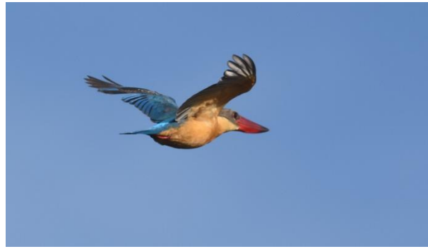
Blue-tailed Bee-eater en Stork-billed Kingfisher, Anawilundawa, LS

Vervolgens maken we een wandeling door het gebied over de onverharde weg. Wat een schitterend gebied is dit! Links en rechts van de weg liggen grote waterpartijen met bloeiende waterlelies, afgewisseld met fraaie oude bomen. Als we beter zicht krijgen op het water scannen we het meer af en vinden al snel Meerkoet en Dodaars, beide nog niet gezien deze reis. In het water staan oude bomen waarin zich grote broedkolonies bevinden van Asian Openbill, Intermediate Egret en Spot-billed Pelicans. Werkelijk overal waar je kijkt zijn vogels. Het park heeft wel wat weg van Keoladeo NP in Bharatpur, India. Andere soorten die we zien zijn Common Hawk-Cuckoo, Grey-headed Fish-Eagle, veel Lesser Whistling Ducks en enkele Cotton Teals, Indian, Little en Great Cormorants, Brown Shrike, Indian Roller, Loten's Sunbird, Stork-billed Kingfisher en veel Blue-tailed Bee-eaters.