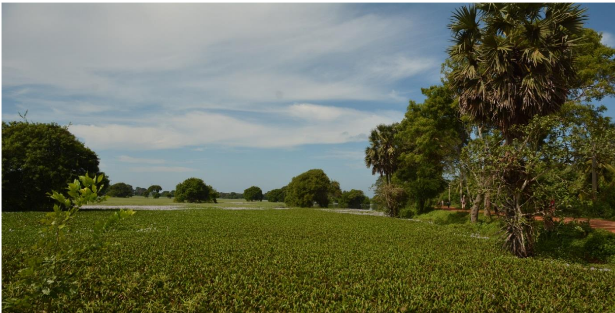
Veel waterlelies in Anawilundawa Ramsar Site, LS

Vervolgens maken we een wandeling door het gebied over de onverharde weg. Wat een schitterend gebied is dit! Links en rechts van de weg liggen grote waterpartijen met bloeiende waterlelies, afgewisseld met fraaie oude bomen. Als we beter zicht krijgen op het water scannen we het meer af en vinden al snel Meerkoet en Dodaars, beide nog niet gezien deze reis. In het water staan oude bomen waarin zich grote broedkolonies bevinden van Asian Openbill, Intermediate Egret en Spot-billed Pelicans. Werkelijk overal waar je kijkt zijn vogels. Het park heeft wel wat weg van Keoladeo NP in Bharatpur, India. Andere soorten die we zien zijn Common Hawk-Cuckoo, Grey-headed Fish-Eagle, veel Lesser Whistling Ducks en enkele Cotton Teals, Indian, Little en Great Cormorants, Brown Shrike, Indian Roller, Loten's Sunbird, Stork-billed Kingfisher en veel Blue-tailed Bee-eaters.