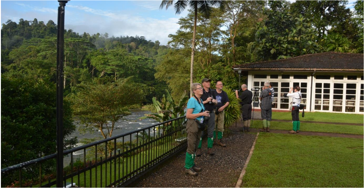
Vogelen vanuit de hoteltuin in Kitulgala, LS