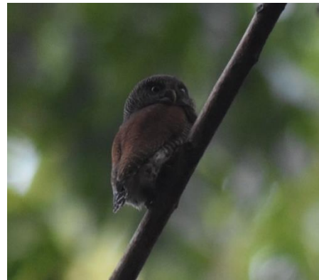
Sri Lanka Grey Hornbill en Chestnut-backed Owlet, Kitulgala, LS