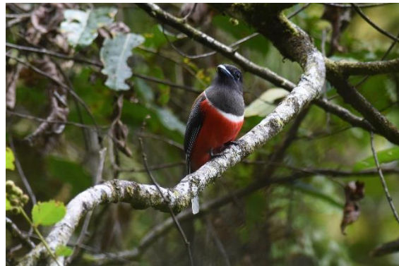
Red-faced Malkoha en Malabar Trogon, Sinharaja, LS

We hebben lunch bij de ingang van het park met uitzicht over het regenwoud en terwijl we daarvan genieten, vliegen er twee Sri Lanka Myna's over, gaaf! Een Brown-breasted Flycatcher zit op nog geen 5 meter afstand terwijl Golden-fronted Leafbirds zich tegoed doen aan de vruchten van kokospalmen. Gedrag dat gekopieerd wordt door een Giant Squirrel want even later zit deze reusachtige eekhoorn aan de vruchten te peuzelen.