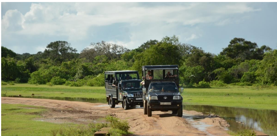
Op safari in Yala NP, LS

Weldra komen we op een paradijselijke waterrijke locatie met Asian Elephant, Water Buffalo, Spotted Deer, Pintail Snipe, Lesser Sand Plover, Red-wattled Lapwing, Yellow Bittern, Lesser Adjutant, Pacific Golden Plover, en allemaal heel dicht bij onze voertuigen. Moeilijk zichtbaar tussen de takken zien we nog een Brown Fish Owl. We ontbijten aan een idyllisch zeestrand met zicht op Elephant Rock. Er staat ook een monumentje ter nagedachtenis aan de tsunami in 2004. In dit park alleen al kwamen 250 mensen om het leven door 6 meter hoge golven die via de riviermondingen tot 1,5 km ver landinwaarts reikten! Purple-rumped Sunbirds fladderen er in de bomen waar we ook de eerste Thick-billed Flowerpecker van de reis te zien krijgen.