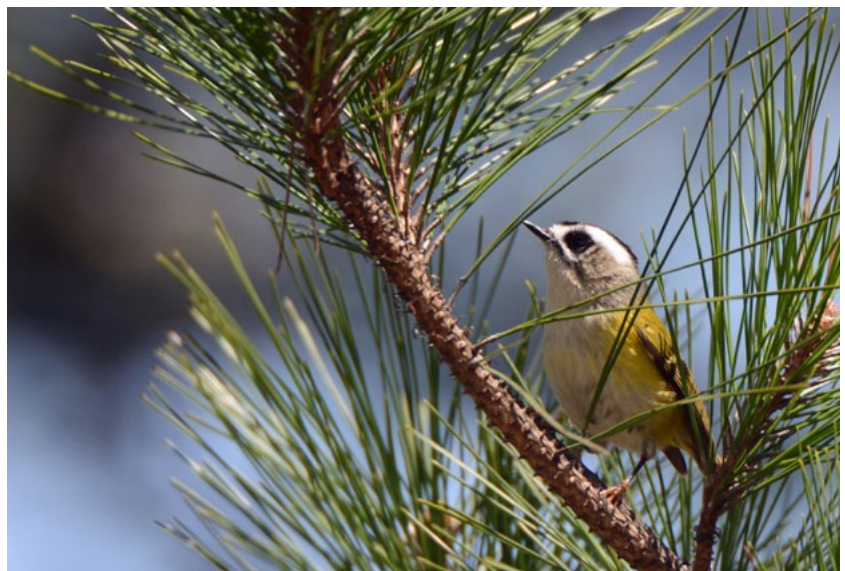
Flamecrest or Taiwan Firecrest ( Regulus goodfellowi )

Laatste stop vandaag is op de top waar we verschillende paden verkennen. Eerste nieuwe soort is de White-browed Bush Robin gevolgd door laag langsvliegende Silver-backed Needletails en enkele Flamecrests. We zoeken tevergeefs Golden Parrotbill, Little Forktail en Bullfinches maar laten wel White-whiskered Laughingthrushes uit onze hand eten en genieten van Collared Bush Robins en Yellow-bellied Bush Warblers. Tegen het eind van de middag verlaten we de berg en rijden in dik drie uur naar het zuiden.