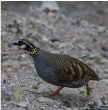
Taiwan Partridge ( Arborophila crudigularis )