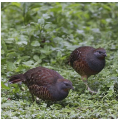
Chinese Bamboo Partridge ( Bambusicola thoracicus sonorivox )