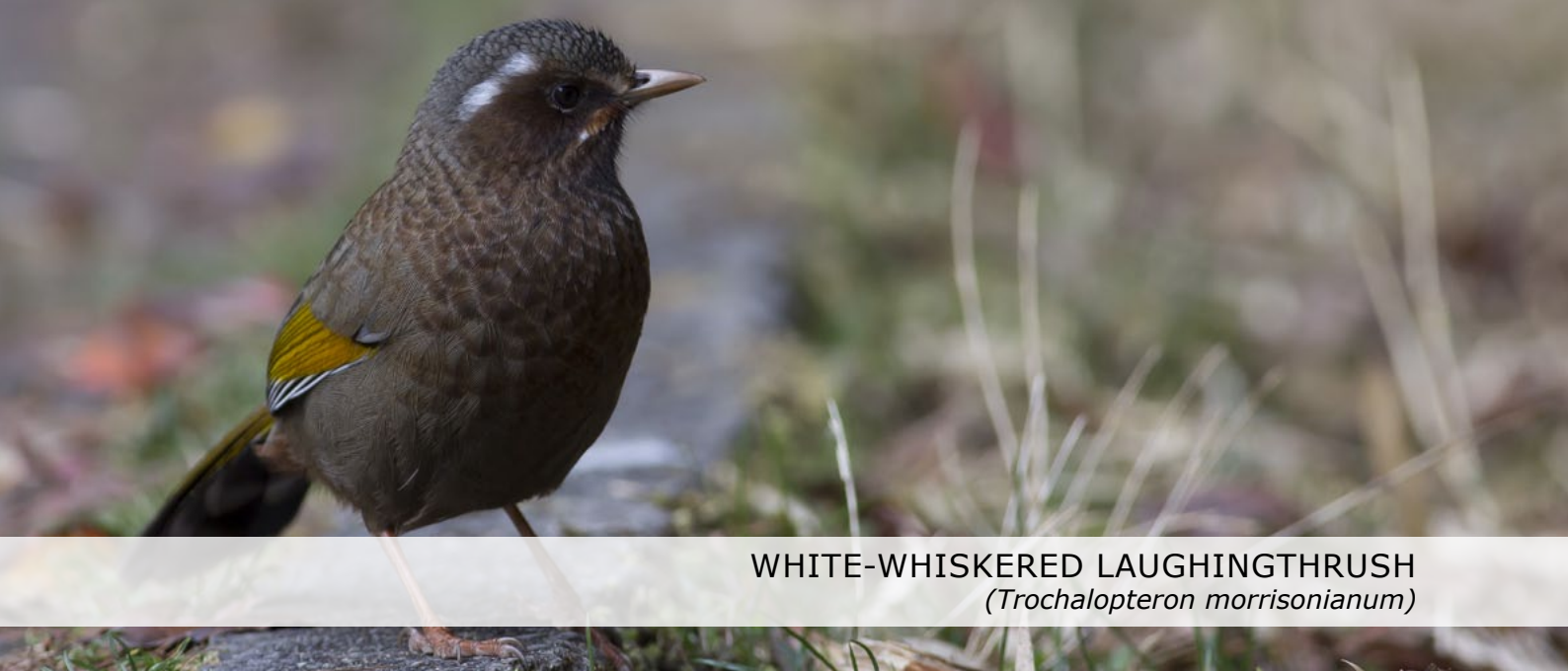
WHITE-WHISKERED LAUGHINGTHRUSH ( Trochalopteron morrisonianum )

Laatste stop vandaag is op de top waar we verschillende paden verkennen. Eerste nieuwe soort is de White-browed Bush Robin gevolgd door laag langsvliegende Silver-backed Needletails en enkele Flamecrests. We zoeken tevergeefs Golden Parrotbill, Little Forktail en Bullfinches maar laten wel White-whiskered Laughingthrushes uit onze hand eten en genieten van Collared Bush Robins en Yellow-bellied Bush Warblers. Tegen het eind van de middag verlaten we de berg en rijden in dik drie uur naar het zuiden.