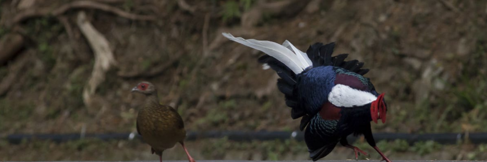
SWINHOE'S PHEASANT ( Lophura swinhoii )