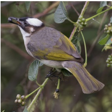
Styan's Bulbul ( Pycnonotus taivanu )