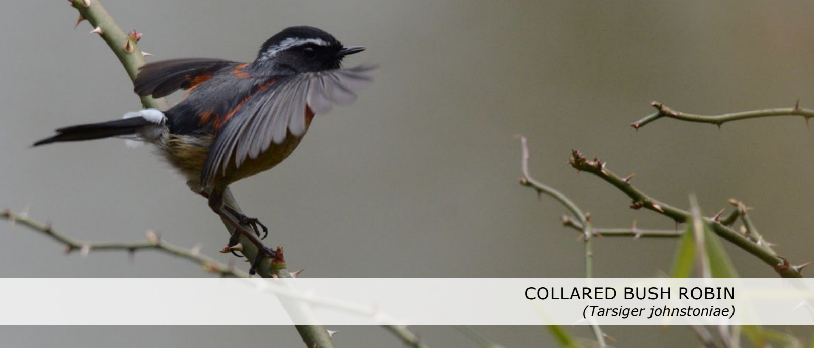
COLLARED BUSH ROBIN ( Tarsiger johnstoniae )

In de middag vogelen we veel lager op de berg. Dat levert naast een prettig temperatuurverschil ook duidelijk andere soorten op, nieuw voor de triplist zijn Grey-capped Pygmy Woodpecker, Arctic Warbler en, toppertje, de bijzonder fraaie Chestnut-bellied Tit (voorheen bekend als Varied Tit, maar gesplit, nu dus een endem voor Taiwan). Bronzed Drongo is opvallend algemeen. Vlak voor het donker bezoeken we nog een park nabij een tempel, goed voor Emerald Dove en Malayan Night Heron. In het donker rijden we terug naar het noorden, tot nabij Taipei.