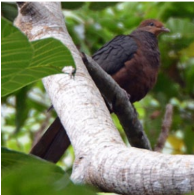
Philippine Cuckoo-Dove ( Macropygia tenuirostris )