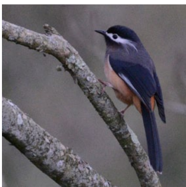
White-eared Sibia ( Heterophasia auricularis )

Dasyueshan Forest is een bosgebied in de bergen van Taiwan. Het mooie is dat er een weg loopt van 1000m boven zeeniveau tot boven op de berg, ongeveer 2500m. De komende twee dagen zijn we steeds langs deze weg te vinden, waar we op verschillende hoogten op zoek gaan naar endemen. We beginnen de dag bij kilometerpaal 23, een bekende plek voor de Swinhoe's Pheasant. We schuiven aan bij een aantal lokale fotografen die ook zitten te wachten. Al snel stapt er een vrouwtje uit het bos. Leuk, maar we willen natuurlijk wel een mannetje. We hebben zes vrouwtjes/onvolwassenen nodig voor er ook een schitterende man op het toneel verschijnt. Het dier laat zich 'afplaten' en jaagt wat achter de vrouwtjes aan. Ondertussen zijn we druk, want bijna iedere soort die we zien is natuurlijk nieuw. We zien bijvoorbeeld Grey-cheeked Fulvetta, Rufous-faced Warbler, Taiwan Whistling Thrush en White-tailed Robin. Al snel komen we er achter dat er twee endemen erg algemeen zijn hier: White-eared Sibia en Taiwan Yuhina. Bij kilometerpaal 35 is de officiële ingang van het Nationaal Park en hier zien we de eerste van de vele makke en vriendelijke White-whiskered Laughingthrushes.