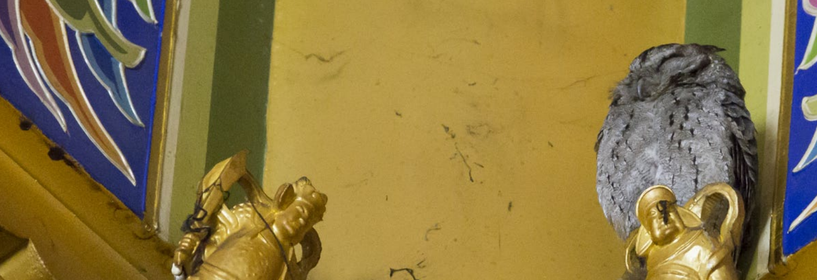
COLLARED SCOPS OWL ( Otus lettia glabripes )