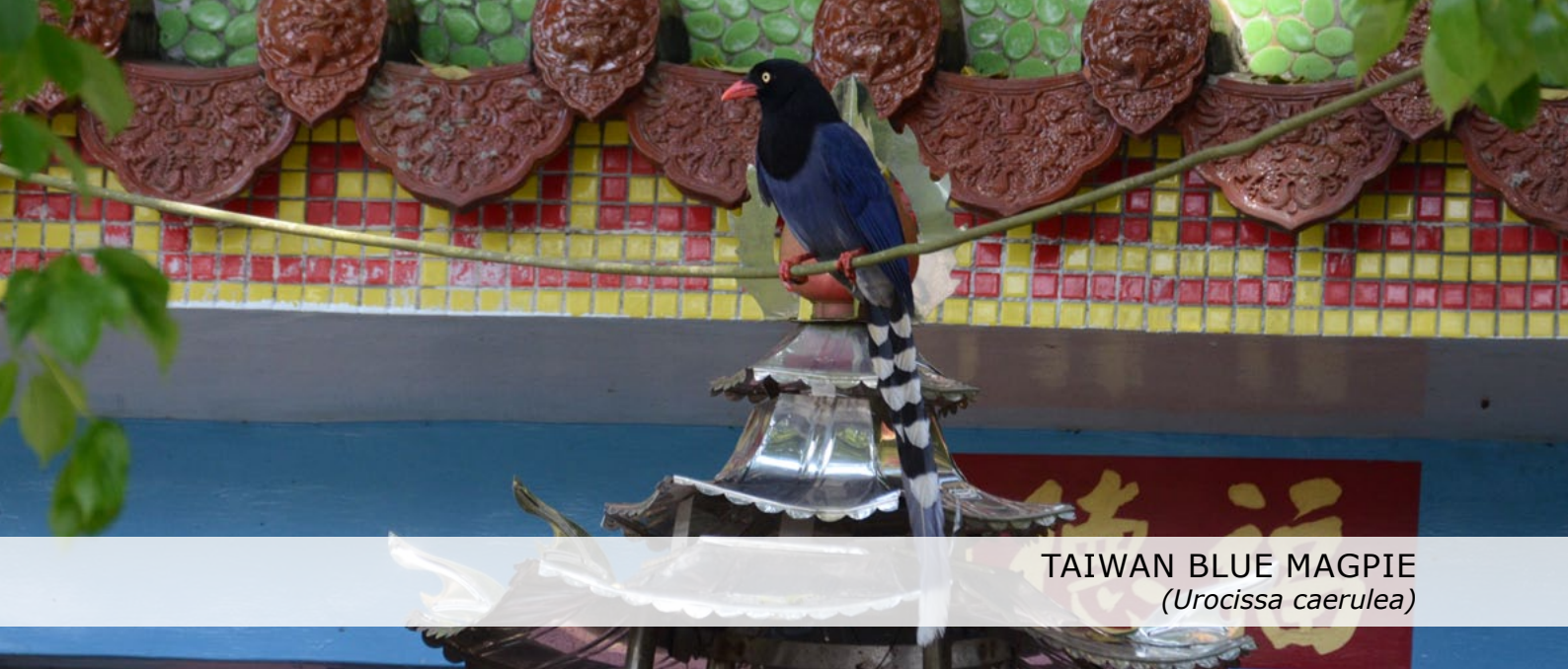
TAIWAN BLUE MAGPIE ( Urocissa caerulea )

heel prettig, Taiwan Blue Magpie. Tegen de schemer rijden we binnen een half uur naar het restaurant waar we wederom van een heerlijke maaltijd genieten. Het eten in Taiwan is even een stukje beter dan bij de Chinees in Nederland! Het met stokjes eten gaat de groep inmiddels overigens ook prima af.