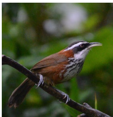
Taiwan Scimitar-Babbler ( Pomatorhinus musicus )

Een bijzondere dag. Reeds op dag 2 had Richard ons meegedeeld dat er een Siberian Crane overwinterde op het eiland. De vraag of wij die wilden zien hebben we als retorisch opgevat. Echter, qua route zou het toch het handigst zijn om de kraanvogel pas vandaag te bezoeken. Een prettig, maar ook wel spannend vooruitzicht. Het dier blijft toch wel gewoon zitten? Gedurende de reis bleven de updates positief, desalniettemin vanochtend in een rechte lijn naar de plek gereden: een wetland ten noordoosten van Taipei. Voor het uitstappen zien we al een grote witte stip in het rijstveld staan - bingo! Het betreft een jonge vogel die vorig jaar is geboren en nu al aardig op kleur begint te komen. Hij zit dichtbij op een ondergelopen akker en laat zich langdurig goed bekijken. Wat een bonus om deze critically endangered soort te zien! Toch wel typisch Taiwan: niet alleen goed voor endemen, de winter wil meestal ook wel een goede overwinteraars opleveren. Volgend jaar vast niet weer een Siberian Crane, maar misschien wel een Scaly-sided Merganser of Bear's Pochard? Het wetland is ook goed voor Black-faced Bunting, Eastern Spot-billed Duck, White-cheeked Starling en Golden-headed Cisticola.