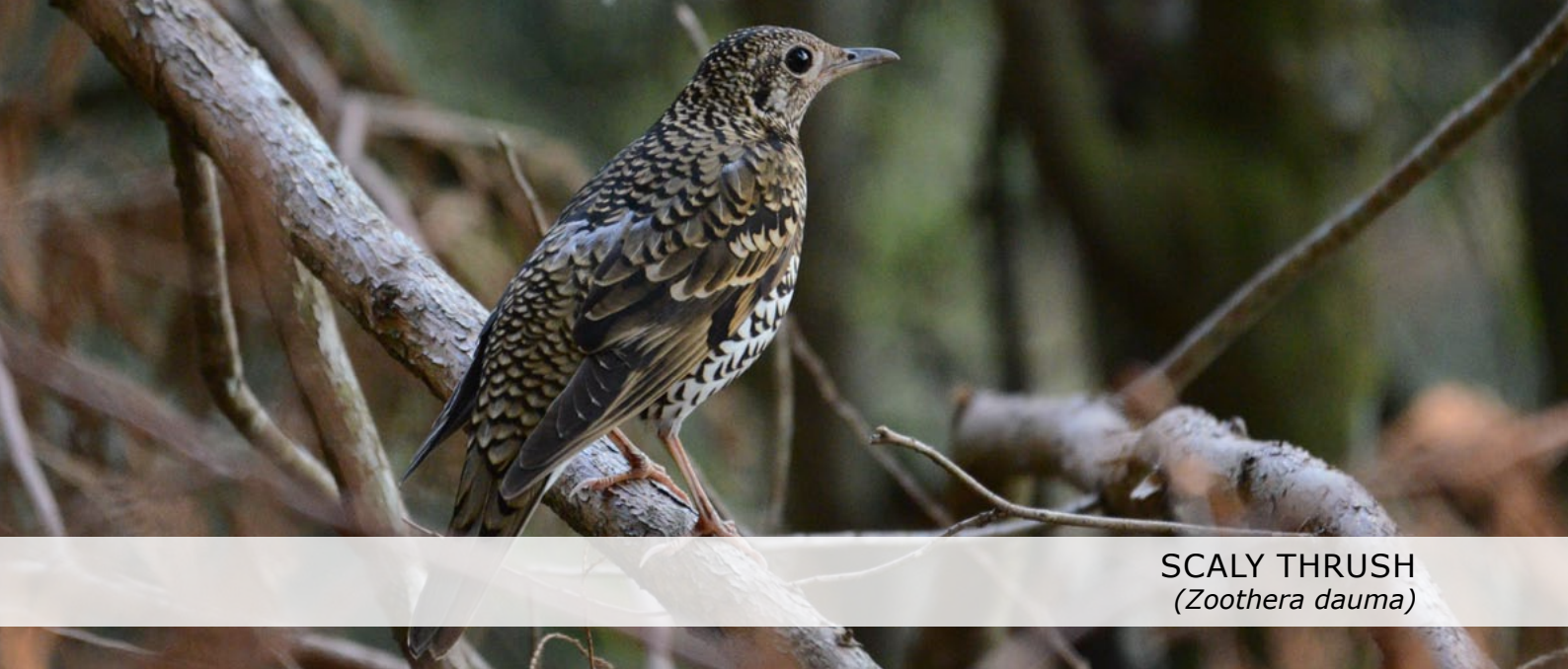
SCALY THRUSH ( Zoothera dauma )

Rond de rivier vogelen we een paar uur en vinden we als een van de eerste soorten Brown Dipper. We horen meerdere Chinese Bamboo Partridges, maar krijgen ze vooralsnog niet te zien. Andere nieuwe soorten voor de trip hier zijn roepende Yellow-browed Warblers, Black Eagle, Striated Heron en Plumbeous Redstart. We lunchen halverwege de weg en lopen over een bospad in de buurt. We genieten van Red-flanked Bluetail, Yellow Tit en Vivid Niltava. Eind van de middag rijden we naar kilometerpaal 43, hier is ons hotel voor komende nacht. Op het grasveldje nabij het hotel zien we een Scaly Thrush hippen. Het dier blijkt niet schuw en we schieten kaartjes vol op het fraaie dier, duidelijk een van de hoogtepunten van vandaag. Als we 's avonds naar het restaurant lopen spotlighten we een White-faced Flying Squirrel. Het enorme dier laat zien waar het toe is staat is en vliegt inderdaad een enorm eind naar een verder gelegen boom - spectaculair!