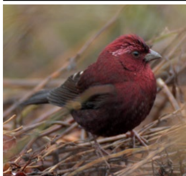
Taiwan Rosefinch ( Carpodacus formosanus )

Onze laatste dag in de bergen. We brengen de ochtend hoog door, boven de 3000m. Het landschap hier bestaat uit voornamelijk dennen en bamboe. In dit habitat zoeken we Golden Parrotbill en Grey-headed Bullfinch. Beide soorten willen ondanks intensief zoeken niet lukken. Wat dan weer wel lukt zijn Taiwan Rosefinch (eindelijk mannetjes!), Alpine Accentor, Taiwan Bush Warbler, veel Collared Bush Robins en Dusky Thrush. Het is koud (6 graden), mistig en het miezert voortdurend. Niet heel erg dus om rond lunchtijd weer naar beneden te rijden en ons op te warmen aan soep en koffie.