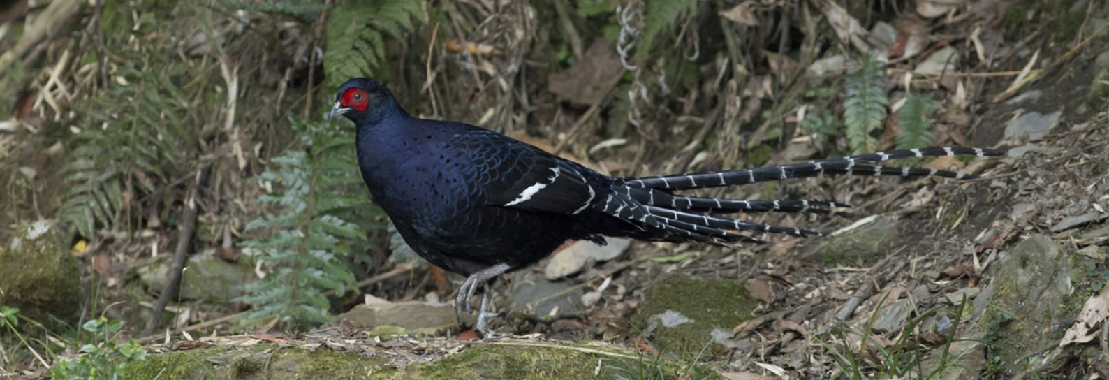
MIKADO PHEASANT ( Syrmaticus mikado )