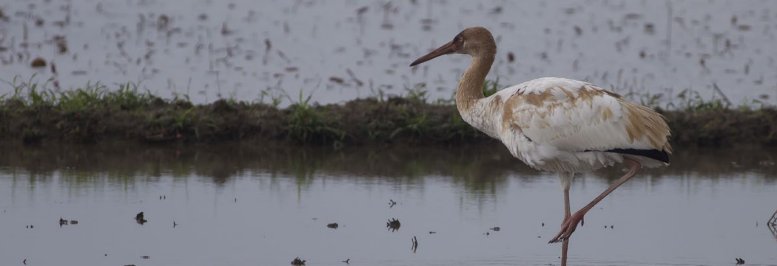
SIBERIAN CRANE ( Grus leucogeranus )