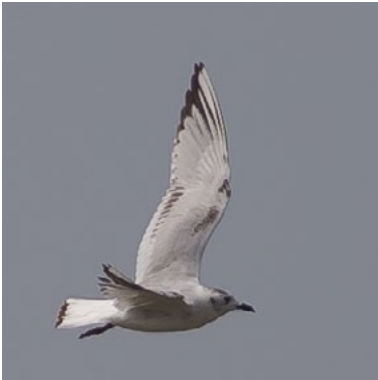
Saunders's Gull ( Chroicocephalus saundersi )