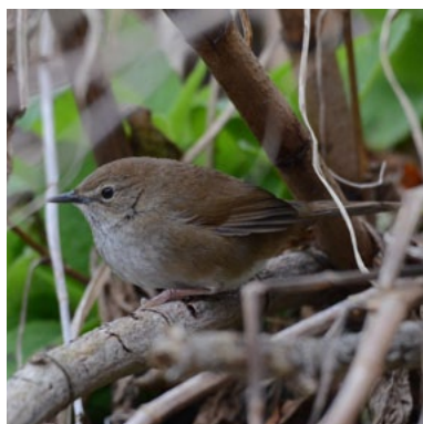
Taiwan Bush Warbler ( Locustella alishanensis )

Onze laatste dag Dasyueshan Forest. Voor het ontbijt lopen we een rondje en moeten we werken voor de soorten. We horen langdurig een Taiwan Shortwing dichtbij zingen, maar de skulker laat zich desalniettemin aan ongeveer slechts de helft van de groep zien. Verder moet de lokale gids alle zeilen bij zetten, maar lukt het uiteindelijk een paar Rusty Laughingthrushes boven ons te krijgen. Tezamen met de lokale ondersoort van Eurasian Jay (zonder petje) en een Taiwan Barwing wordt het een onderhoudend rondje. Tijdens de eerste stop na het ontbijt horen we Himalayan Cuckoo en Taiwan Pygmy Babbler. De laatste hebben we voorgaande dagen al vaker gehoord, maar te zien krijgen is wat anders. Dit keer zit ie in een wel erg overzichtelijk biotoop te zingen en ruiken onze kans schoon. En inderdaad, relatief gemakkelijk krijgen we het diertje fraai in beeld, het is een bizar schepseltje. De volgende stop is goed voor Taiwan Fulvetta en een Taiwan Bush Warbler, laatstgenoemde laat zich mooi zien, niet gebruikelijk voor deze in weelderige ondergroei levende soort.