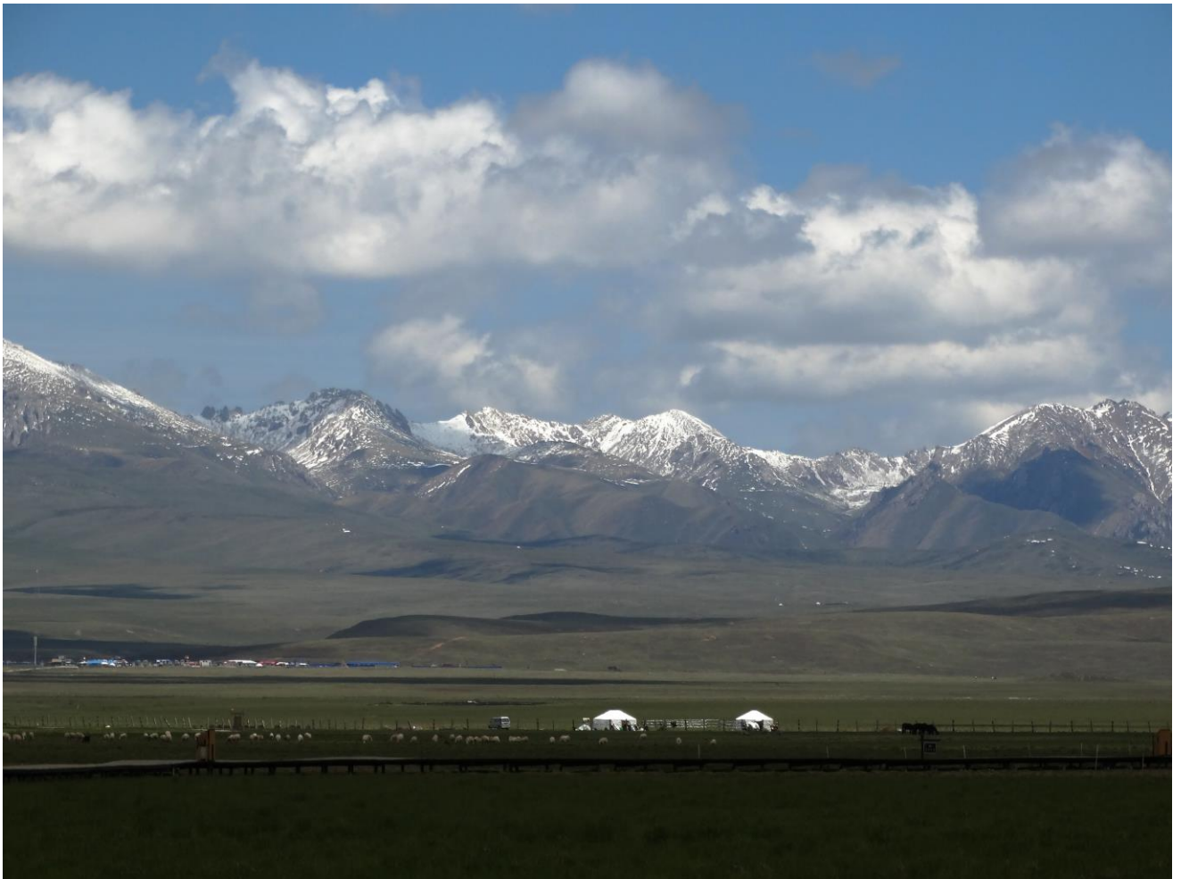
Tibetaanse hoogvlakte met yurths

Ah een heerlijke vogeldag! Heerlijk zonnig weer en veel nieuwe soorten op de grasvlaktes en bij het steppe-meer. Na het ontbijt in het dorp stoppen we ergens midden op de vlakte langs de weg. Eerst lijkt het een plek van niets maar al snel worden er Horned Larks, Oriental Skylarks en Upland Buzzards gezien. Maar de mooiste waren wel de Tibetan Larks! Grote zware leeuweriken die in hun baltsvlucht deden denken aan Grote Lijsters.