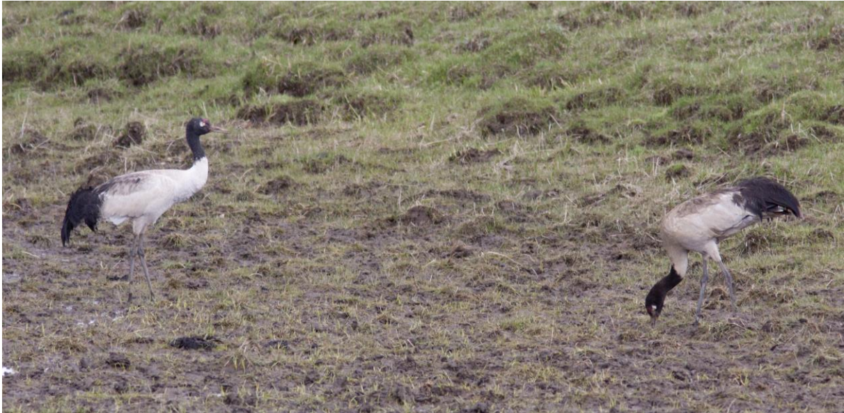
Black-necked Cranes vlak naast de bus.

Vanuit de rijdende bus werden de eerste Hume's Groundpeckers opgemerkt. Snel stilstaan op een te drukke weg...maar och wat waren ze leuk om te zien. Hoe druk ze steeds in de grond aan het pikken waren. Later werden er nog twee gezien die we wel helemaal konden afplaten.