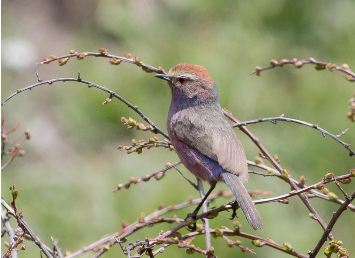
White-browed Tit-warbler (foto Wil Makkinje)

De volgende stop viel letterlijk en figuurlijk in het water. We dachten dat het wel droog zou worden maar het ging steeds harder regenen en zelfs onweren. Dus naar 500 meter snel weer terug via een glibberige modderige helling naar de droge bus. Gelukkig waren we binnen een uur in het luxe hotel in Juizaigou waar we fijn konden douchen en opknappen. Verder zagen we nog o.a. Blue Eared Pheasant, Black-necked Crane, White-browed Tit, Chinese Blackbird en White-throated Dipper. De soortenlijst staat nu op 250 soorten.