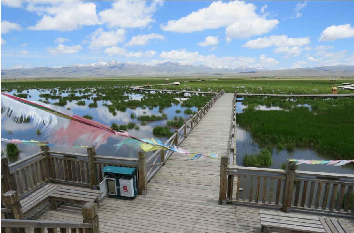
Flower lake, een ondiep steppemeer met goede boardwalks en leuke soorten.

De veldlunch deden we bij wat stenige heuvels en verder op een groeve. Het is vermakelijk hoe dichtbij en hoeveel Pika's er rondom te heen rennen. Daar tussen rennen en baltsen de White-rumped en Rufous-necked Snowfinches. Met de telescoop ontdekken we een nest van de Sakervalk in de kleine steengroeve. Terwijl we de lunch verorberen zien we hoe zij de drie jongen voeren. Schitterend om te zien. We lopen nog een rondje en zien Rock Sparrow en Little Owl. Dan blijkt dat Robbie nog een verrassing voor ons heeft. We gaan naar een plek waar recent een Pallas Cat was gezien! Dat is een zeer schaars beest van stenige stukken. We lopen een stuk richting wat stenige heuveltoppen en scopen de omgeving af. Ondertussen lopen de Pica's en Black-Necked Cranes om ons heen. Net als we er niet meer in geloven roept Robbie dat ie er een ziet! Het kost heel veel moeite om iedereen aan te duiden waar de kat relaxed ligt. Dan blijkt het niet een Pallas te zijn, maar een Chinese Mountain Cat, een endeem en nog zeldzamer! We zien allemaal dat de kat recht op gaat zitten en zich begint te uit te strekken en te poetsen. Waanzinnig, ook Robbie heeft dit nog nooit meegemaakt. Uiteindelijk loopt de kat uit beeld en sommige vallen elkaar in de armen na deze unieke waarneming. Als toetje zien we op de terugweg ook nog enkele Tibetan Foxes wat hun totaal op 11 brengt.