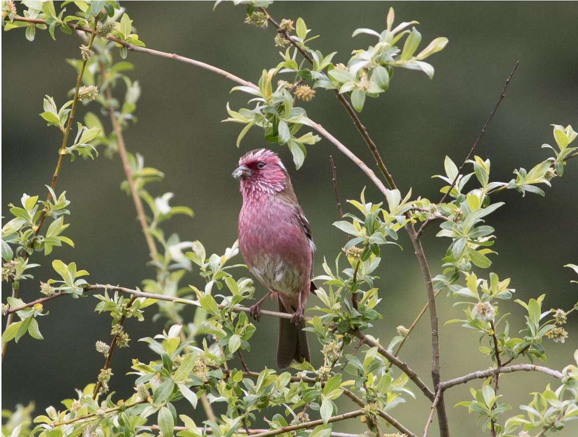
Beautiful Rosefinch