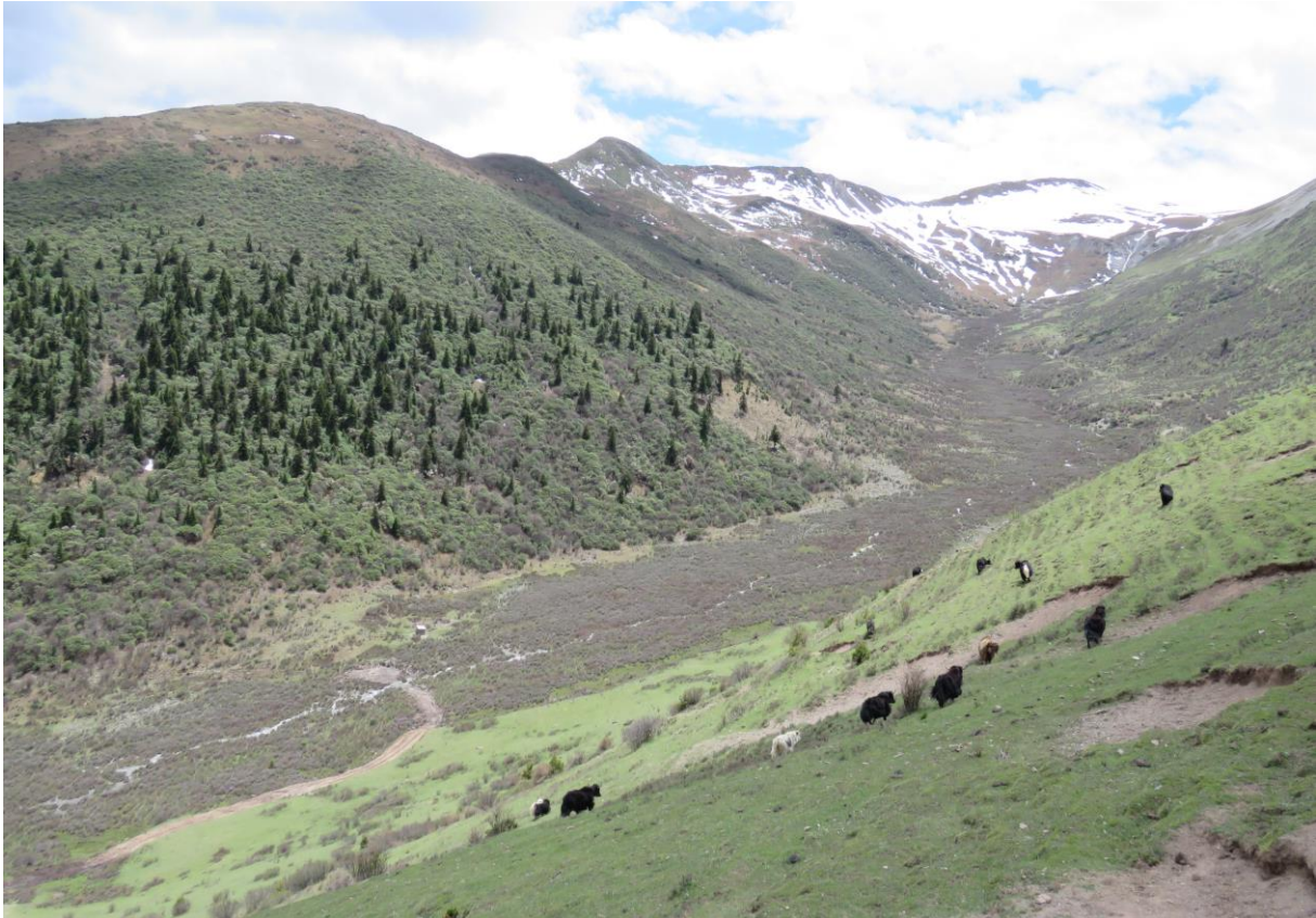
De bergen, bossen en jaks bij Mengbishaan

Na de veldlunch met heerlijke meloen, liepen we een mooi pad op de boomgrens. Direct de eerst honderd meter hoorden we al Tibetan snowcock, Monal Partridge en Chinese Monal. We genoten van de voorjaarsbloemen. In de toppen van de dennen zaten de Kesslers Thrushes te zingen en werd een rustende Koen door twee nieuwsgierige Buff-barred Warbels tot op een meter benaderd. De leukste vogels van de dag waren wel twee White-throated Needle-tails die door de lucht scheerden, Rufous-vented en Grey-crested Tits, Crested Tit-Warblers, Plain Laughing-thrush, Long-tailed Thrush, Slaty-backed Flycatcher, Tibetan Siskins en de Three-banded Rosefinch.