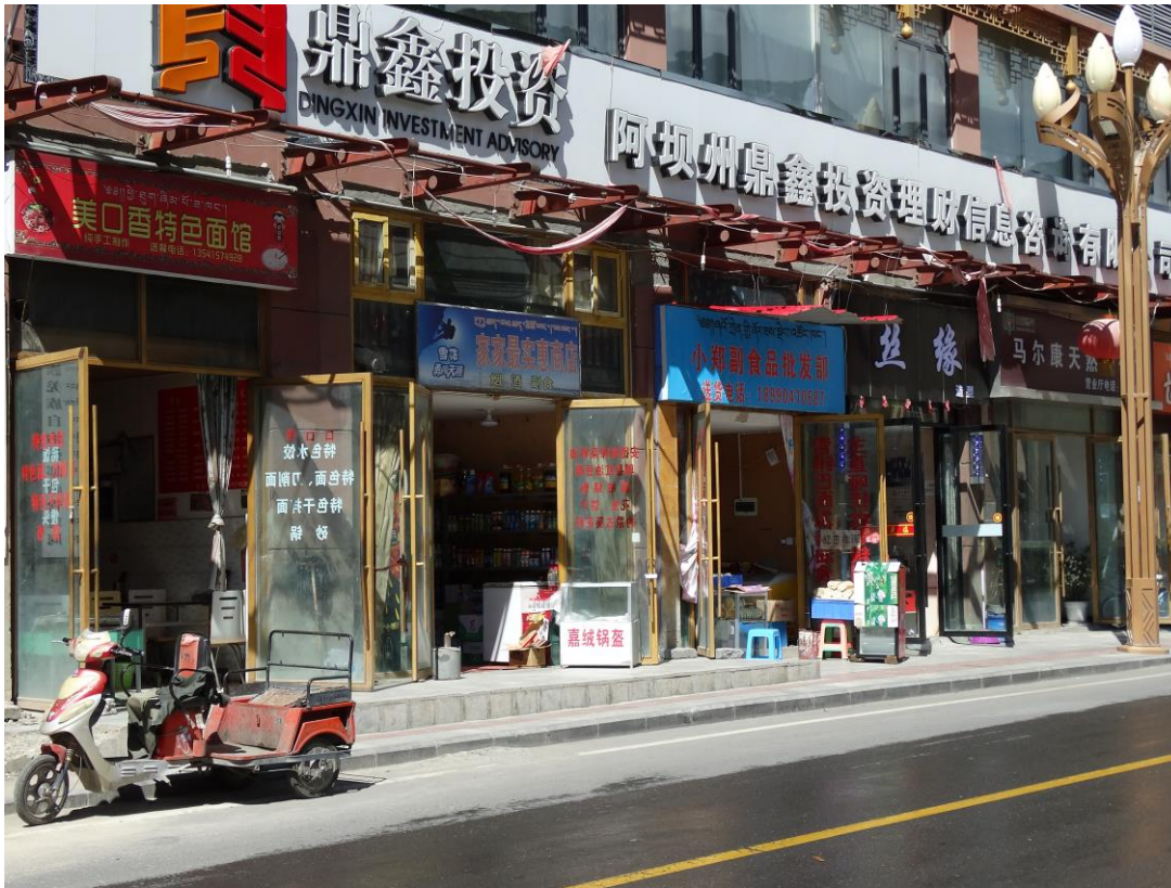
Straatbeeld onderweg.