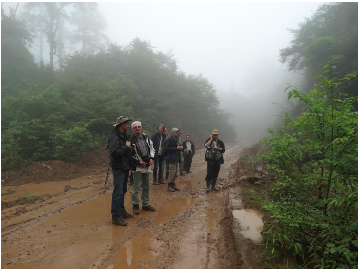
Het weer en de weg op Longcanggou (Wawu Shan) waren niet ideaal.

Robbie had zelf ontbijt voor ons geregeld. Terwijl we de koffie opdronken werd het langzaam droog, want het had aardig gegoten die nacht. Met twee kleine busjes rijden we de bergen in. Dichte begroeiing van varens en bamboe met daarboven primair bos, zorgen ervoor dat je niet diep het bos in kan kijken. Maar gelukkig zagen we al snel een Lady Amherst Pheasant, een mooi mannetje. Later nog een vliegend wijfje en een jong mannetje. Enkelen zagen ook het wijfje van de Temminck's Tragopan voor de auto langs schieten. De weg is erg slecht door de grote vrachtwagens en modderig.