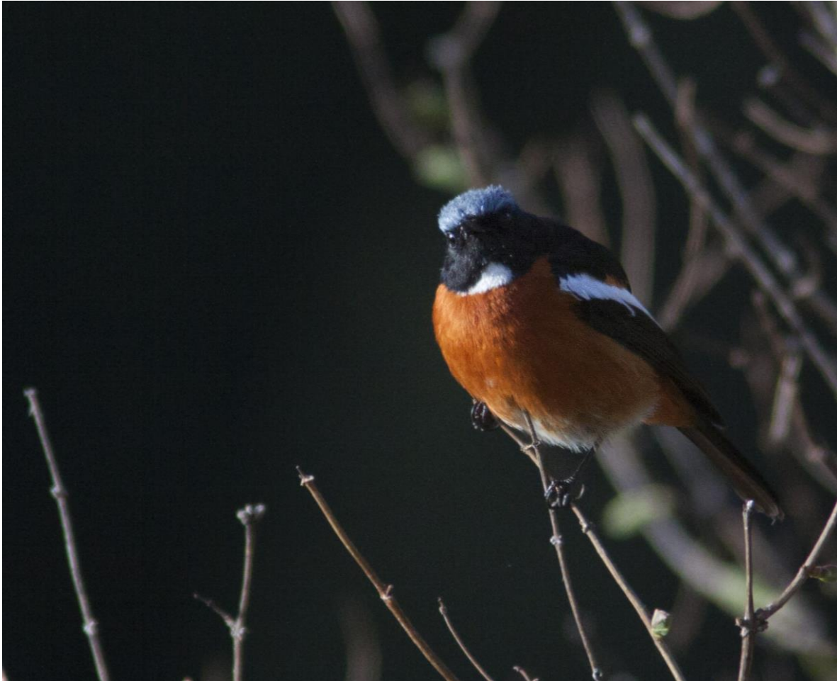
White-throated Redstart (foto Mark Zekhuis)