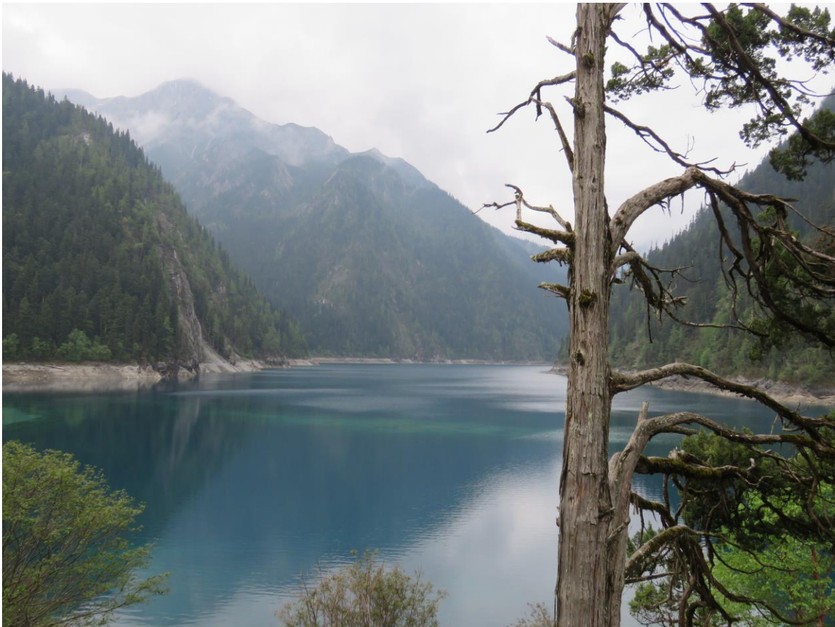
Het Juizaigou NP is bekend om zijn prachtig groen-blauw gekleurde meren, watervallen en mooie oude bossen.