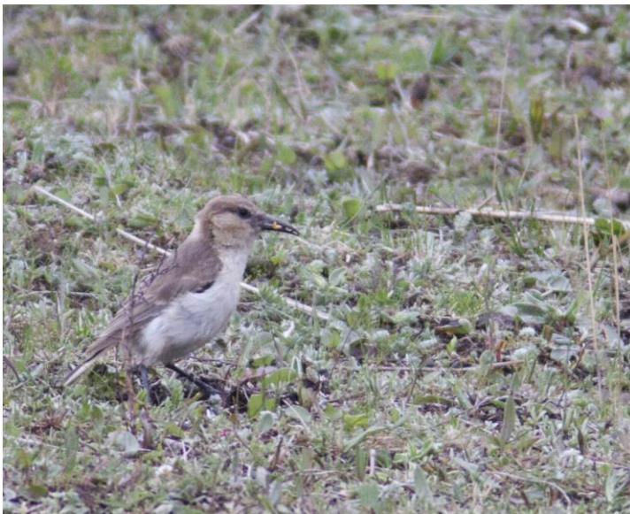
Hume's Groundpecker

Vanuit de rijdende bus werden de eerste Hume's Groundpeckers opgemerkt. Snel stilstaan op een te drukke weg...maar och wat waren ze leuk om te zien. Hoe druk ze steeds in de grond aan het pikken waren. Later werden er nog twee gezien die we wel helemaal konden afplaten.