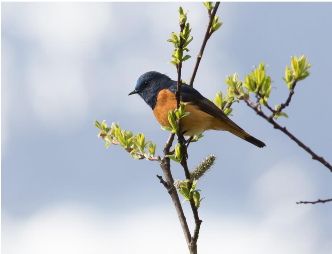
Blue-fronted Redstart

Het was wel heel vroeg nadat het gisteren laat was door de verkeersopstopping in het dorp. In het donker reden we naar de Balang Pas (4487 m). We luisterden even op de plek van de Woodsnipe (stil) en reden snel door naar de tunnel voor de Chinese Monal. Hier stonden nog twee groepjes vogelaars in het schemer te luisteren en zoeken naar deze topper. Als snel hadden we een baltsend mannetje in onze telescopen, wat een prachtig beest!! Belachelijke mooie kleuren! Hij stond te draaien en roepen. Later zagen we nog twee mannetjes. We liepen nog een stuk over een oude weg en later deden we verschillende stops tussen de 3500m en de top. De tweede topper van de dag, was wel de waarneming van de Gradalas. Een prachtig helder blauw mannetje (zo mooi dat de oculairs van opwinding waren beslagen..) en een wijfje hipten op een bloemrijk stuk gras. Er werden maar liefs vijf soorten roodmussen gezien, daarnaast ook Plain en Brandts Mountain Finch, Blue-fronted Redstart, White-tailed Rubythroat, Kesslers en Chestnut Thrush en Alpine Leaf Warbler. Het was een prachtige vogeldag met heerlijk warm zonnig weer! We zijn allemaal wat verbrandt in ons gezicht omdat we steeds omhoog keken naar de Himalaya Vultures, Alpenkauwen en af en toe een Lammergier.