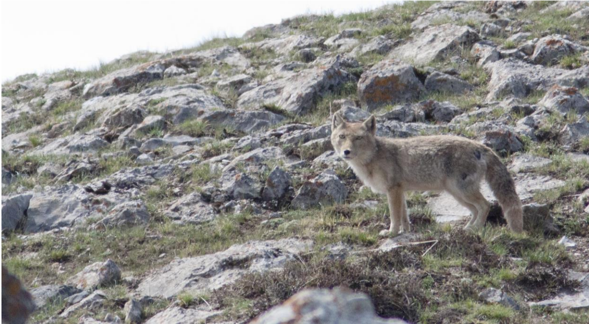
Tibetan Fox, waar we er maar liefst 11 van zien!