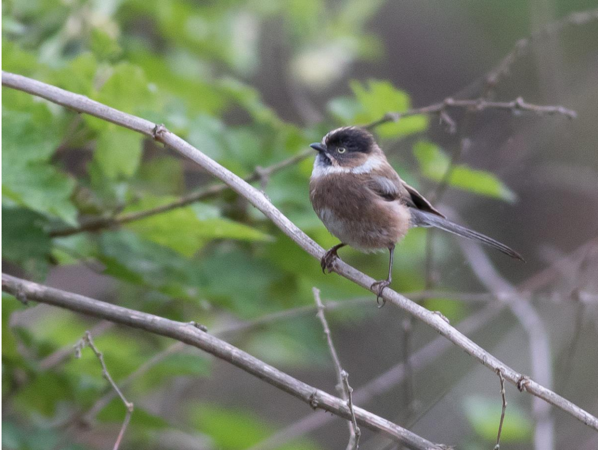
Black-browed Bushtit

Maroon Accentor. Bijzonder was de vondst van een vers dode Leopard Cat op de weg. Deze hebben we naar het bureau van het park gebracht. In Wolong namen we nog een route naar het Monasterio, met een oude tempel. We hoorden ze overal maar kregen de Goudfazanten helaas niet in beeld. Wel zagen we hier een Chinese Babax, Black-browed Bushtits en hoorden we nog een Indian Bleu Robin en een Black-Streaked Scimitar Babbler zingen.