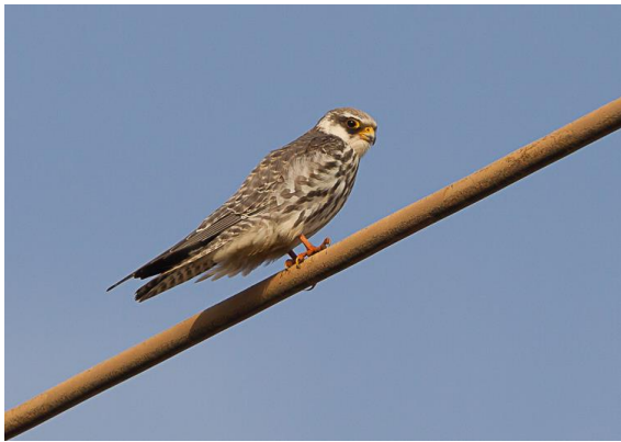
Amoerropootvalk (Jos vd B)