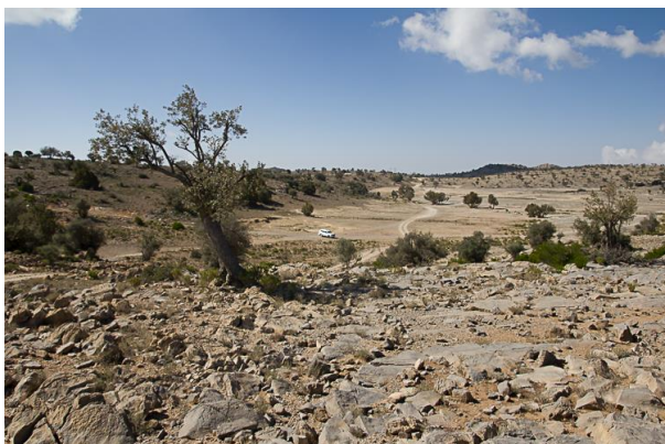
Wadi in Al Hajar gebergte

Vandaag hebben we de hele dag de tijd om de omgeving van Barr Al Hikman te verkennen. Op de gisteren zo succesvolle plek bij Filim staat 's morgens vroeg het water al te hoog. Een Velduil laat zich hier evenwel mooi bekijken. We verlaten Filim en gaan op zoek naar een andere locatie. Onderweg zien we op zeer korte afstand twee Amoerropootvalken langs de weg zitten. Uiteindelijk vinden we een goede hoogwatervluchtplaats met hoge aantallen steltlopers langs de weg naar de kust. Als de vloedlijn zich verder terugtrekt en daarmee ook de vogels voor ons steeds verder komen te lopen, rijden we door naar Shannah. Vanuit deze haven vertrekt een veerboot naar het eiland Masirah. We drinken op ons gemak koffie terwijl in de haven Grote Kuifsterns, Bengaalse en Grote Sterns rondvliegen. Na de lunch besluiten we nogmaals naar Filim te rijden. Met het opkomend water groeien de aantallen steltlopers gestaag. Naast de gisteren waargenomen soorten zien we nu ook enkele Poelruiters op korte afstand foerageren. Achter de fabriek zien we bij enkele zoetwaterplasjes minstens drie Stekelstaartsnippen en een Watersnip. Een Daurische Klauwier jaagt onverstoord op insecten. Ook zien we op deze locatie een van de weinige zoogdieren van de reis; Gordons Wilde Kat ( Felis silvestris gordonii ). Morgen verlaten we dit uitgestrekte en vogelrijke wadengebied en koersen af op de woestijn.