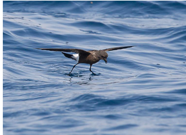
Wilson's Stormvogeltje (Jos vd B)

Na dit avontuur vertrekken we naar Al Mughsayl, een kustplaats ten westen van Salalah. We richten ons op de daar aanwezige wadi. Na een paar kilometer stoppen we bij een kleine plas met wat riet. Al snel zien we hier Witborstwaterhoen, Waterhoen en Indische Karekiet. De ontdekking van een Kleinst Waterhoen maakt in het bijzonder één deelnemer heel erg blij. Uiteindelijk laten twee vogels zich op deze plek erg fraai bekijken. Niet lang daarna zweeft een adulte Zwarte Arend gedurende een tiental seconden over de bergrug. Een andere wenssoort kan worden bijgeschreven. Als we terugrijden naar de hoofdweg zien we onze eerste Arabische Steenpatrijzen. Maar liefst een dertigtal vogels lopen al foeragerend aan de voet van de bergen. We hebben nog een uur voor de duisternis invalt en rijden richting Raysut. We rijden langs de vuilstortplaats en zien grote aantallen Abdimmooievaars naar hun slaapplek vertrekken. Met permissie lopen we nog twintig minuten rond op het terrein van de waterzuivering in Raysut. Dit levert geen nieuwe soorten op. Na het diner rijden we nog een keer naar Ayn Hamran in de hoop enkele uilensoorten te zien. We horen verschillende Arabische Dwergooruilen en slechts eenmaal kort een Afrikaanse Oehoe.