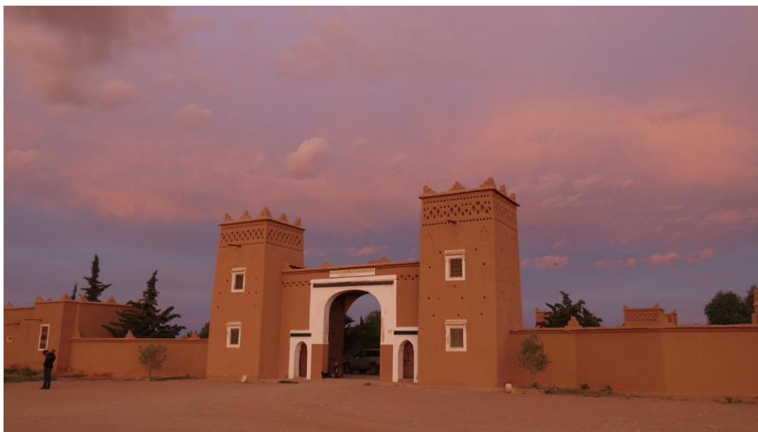
de kashba in Boumalne