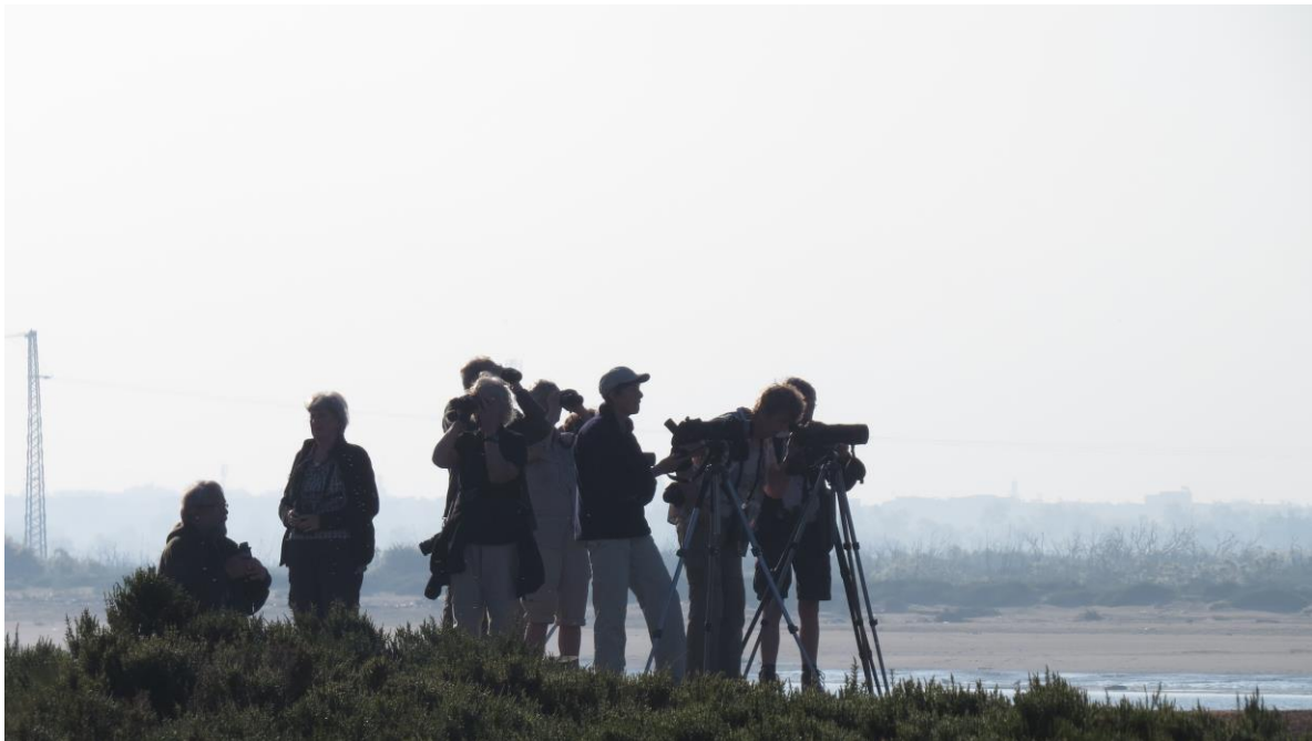
's ochtends langs de Oued Sous

Ons volgende doel was de Oued Massa. Daar zouden we een wandeling langs het water van –ook hier- de lange riviermonding maken. Over een afstand van 6 kilometer deden we 3 en een half uur! Het was er mooi: heerlijk weer, veel bloemen, veel activiteit. In de struiken langs de rivier zat van alles: o.a. Baardgrasmus, Iberische Tjiftjaf, gewone Tjiftjaf en Roodborsttapuit. Eén van de doelsoorten hier was de Zwartkruintsjagra. Deze Afrikaanse soort kent hier z'n noordgrens. We hadden 'm al een paar keer gehoord, toen we er uiteindelijk twee kort maar goed zagen. Verrassend was de Westelijke Rosse Waaierstaart, die we zagen, fouragerend in een droge sloot.