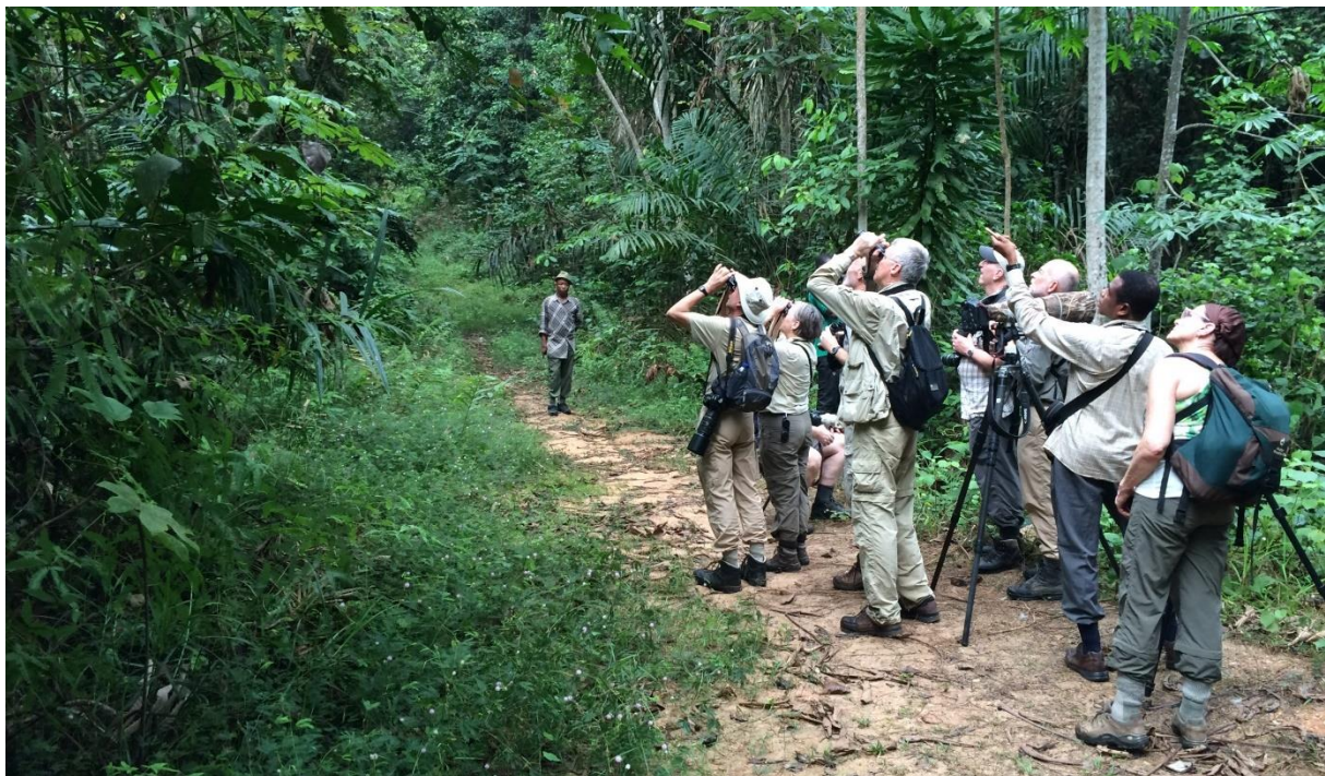
Vogelen in het regenwoud van Ankasa, LS