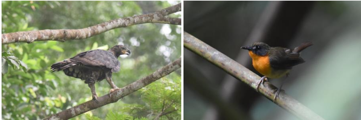
Crowned Eagle en Forest Robin, Ankasa NP, Ghana, LS

een Chocolate-backed Kingfisher maar de vogel zit in de top van de boom en laat zich niet zien.