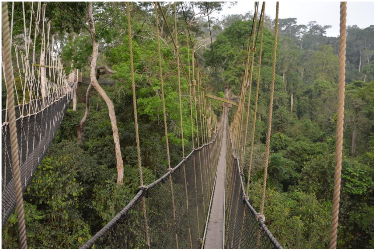
Canopy Walkway in Kakum, Ghana, LS

Onderweg naar de ingang van de canopy walkway zingt een Finsch's Flycatcher Thrush, maar we zien de vogel niet. Bij aankomst op het grote platform zien we direct een White-crested Hornbill op een afgebroken boomstam zitten, een mooi begin! Yellow-mantled Weavers zitten bij hun nesten en laten zich fraai zien. Een Black Dwarf Hornbill plukt vruchten van een boom. We zien het regenwoud langzaam tot leven en zien we in de komende uren African Cuckoo-Hawk, Palmtree Vulture, Red-fronted Parrot, Yellowbill, Sabines Spinetail, African Pied en Black Casqued Hornbill, Yellow-spotted en Hairy-breasted Barbet en Cassin's Honeyguide, Little Green en Fire-bellied Woodpecker, Sabines Puffback, Red-headed Malimbe, Tiny en Little Green Sunbirds. Black-winged oriole laat zich mooi op ooghoogte zien en fotograferen. Dan wordt het tijd om een trail te lopen en het duurde niet lang of onze gids hoorde een Rufous-sided Broadbill. Niet heel dichtbij we vonden een paadje wat precies in de goede richting liep waardoor we even later oog in oog stonden met een schitterende Rufous-sided Broadbill! Na de lunch weer terug naar de canopy walk en hoewel de middag activiteit duidelijk minder is, zien we toch enkele mooie nieuwe soorten zoals bijvoorbeeld Blue-throated Roller.