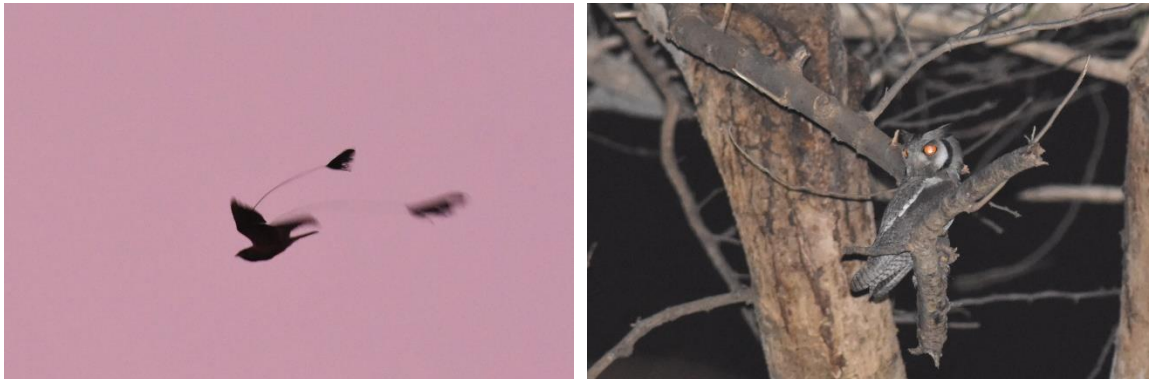
Standard-winged Nightjar en Northern White-faced Owl, Mole NP, LS

Na afloop van dit spektakel rijden we nog even naar een plek voor Standard-winged Nightjar, iets buiten het park. We stappen uit de bus en er vliegt onmiddellijk een schitterend mannetje – met verlengde pennen aan de vleugels – over ons heen. Het is nog aan het schemeren dus we kunnen de vogel prima zien als ie afsteekt tegen de lucht. Dan zien we er nog een mannetje en nog één! Het wordt helemaal mooi als er een uil uit de boom vliegt die zich even later goed laat zien: een Northern White-faced Scops Owl! Tevreden rijden we terug naar ons hotel voor het laatste diner hier.