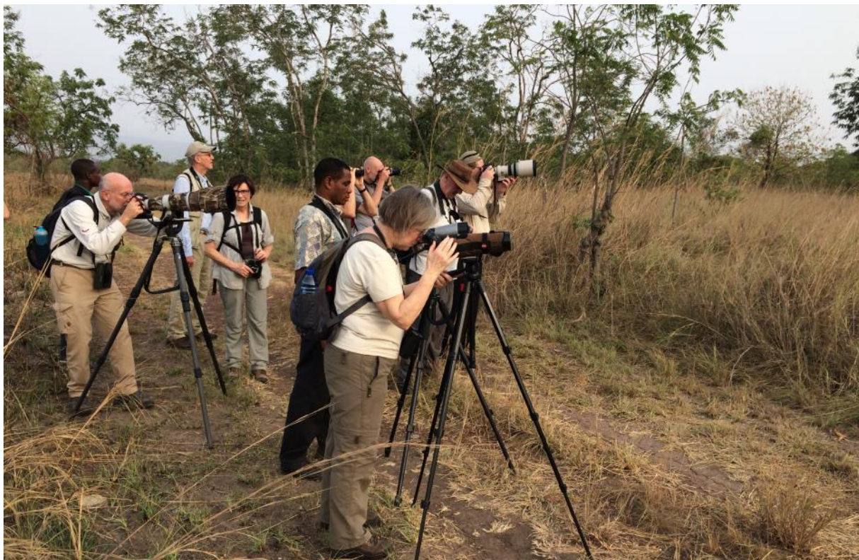
Vogelen bij de Shai Hills, Ghana, LS

Na een vroeg ontbijt maken we ons klaar voor de eerste dag in Ghana. We gaan op pad naar de Shai Hills, een uitgestrekt savannegebied met graslanden en bos. Het is hier meteen goed vogelen en we maken in rap tempo kennis met de eerste nieuwe soorten.