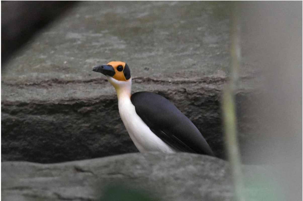
Yellow-headed Picathartes, nabij Nsuta, Ghana, LS

ontspanning te geven, maar rond 1745 is het dan wel echt raak. Eén vogel hipt op takken, op de bosbodem en later op de rotsen, even later gevolgd door een 2 e vogel. Het duurt al met al een minuut of 20 waarbij de vogels niet de hele tijd in beeld zijn.