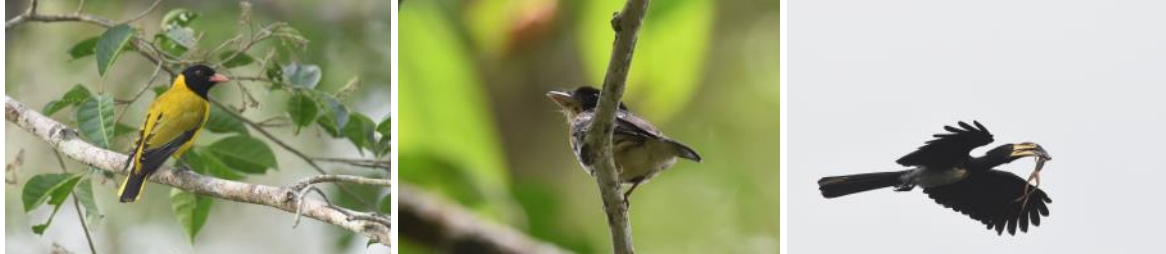
Black-winged Oriole, Rufous-sided Broadbill en African Pied Hornbill, Kakum National Park, Ghana, LS

Na een vroeg ontbijt rijden we in ongeveer een half uur vanaf de lodge naar de wereldberoemde Kakum National Park 'canopy walkways'. Er bevinden zich enkele grote platforms (een telescoop kan mee!) op ca. 40m hoogte zodat je een schitterend uitzicht hebt over het regenwoud. Het 360km 2 Kakum National Park beschermt een unieke habitat bestaande uit zogenaamd 'secondary upper guinea tropical rainforest' en de soorten die hier bij horen. We komen aan met het eerste licht waar een African Goshawk ons verwelkomde.