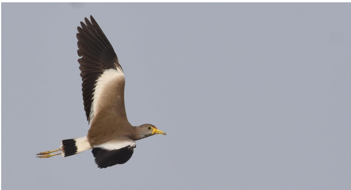
African Wattled Lapwing, Mole NP, LS