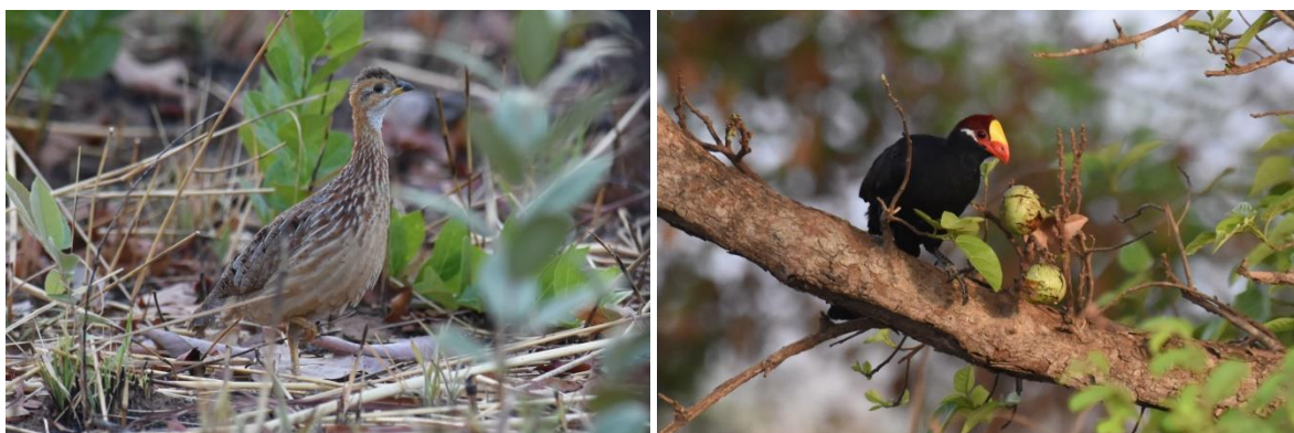
White-throated Francolin en Violet Turaco, Mole NP, LS

We rijden na het ontbijt meteen naar het 'vliegveld', wat al een aantal jaren volledig overgroeid is en dus ook niet in gebruik. We zien al snel enkele nieuwe soorten zoals Brown-rumped Bunting en Brown-backed Woodpecker. Dan begint er een White-throated Francolin te roepen die zich even later fantastisch laat zien, te gek!