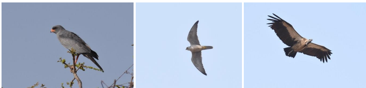
Dark Chanting Goshawk, Lanner en African White-backed Vulture, Mole NP, LS

Het hotel is prachtig gelegen aan de rand van de savanne met een schitterend uitzicht over enkele waterpartijen. Wat is dus een betere manier om de dag te beginnen dan gewoon bij je hotel?! We zien al snel Senegal Batis, Pygmy en Beautiful Sunbird, Grey-headed Kingfisher, Senegal Eremomela en Grey Woodpecker. Dan stappen we in de bus – een ranger gaat mee – voor een echte bush wandeling. Hoewel de meeste poelen droog zijn – het is een droger jaar dan anders – zien we toch een prachtige reeks aan typische savannesoorten met zelfs een paar bijzondere: Spotted Creeper en Oriole Warbler. Als het langzaamaan warmer begint te worden gebruiken de gieren de thermiek om hun vleugels uit te slaan: een mooie groep African White-backed Vultures komt over maar we zien ook twee White-headed Vultures, gaaf! Een Black Scimitarbill laat zich even kort zien en vliegt dan naar een volgende boom. Ook de volgende poel waar normaliter water in staat is opgedroogd zodat we uiteindelijk besluiten om terug te keren naar de lodge.