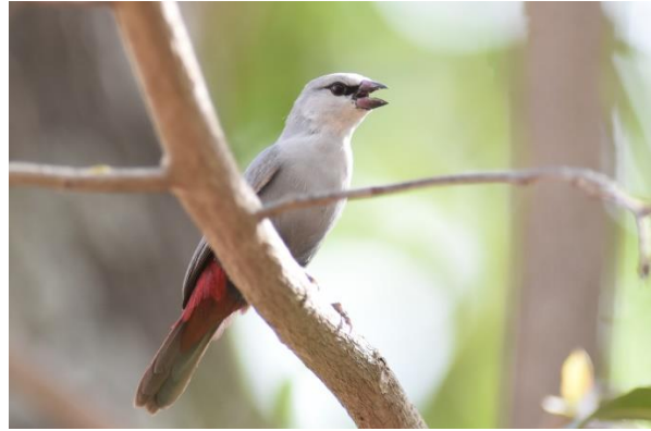
Senegal Batis met White-shouldered Black Tit en Lavender Waxbill, Mole NP, LS