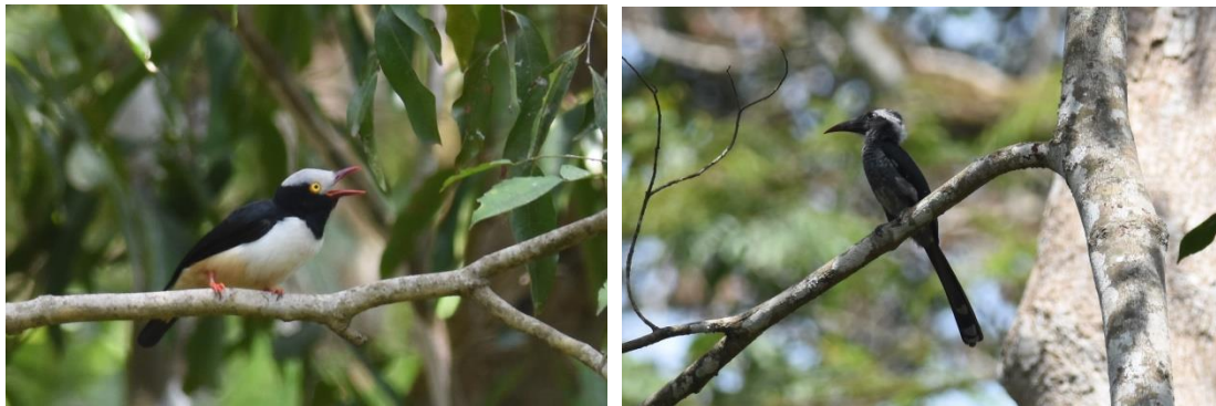
Red-billed Helmet Shrike en Black Dwarf Hornbill, Bobiri Forest, LS

takken. We rijden meteen door naar het open gebied waar we al snel 2 Grey Parrots in een boom zien zitten, prachtige papegaaien die we in Nederland vooral kennen als kooivogel (Grijze Roodstaart), heel gaaf want inmiddels flink zeldzaam geworden en het blijkt ook de enige waarneming van de reis te zijn. Een poging voor Brown Nightjar is helaas niet succesvol, we horen wel enkele Forest Francolins roepen en zien een groepje Tessman's Flycatcher.