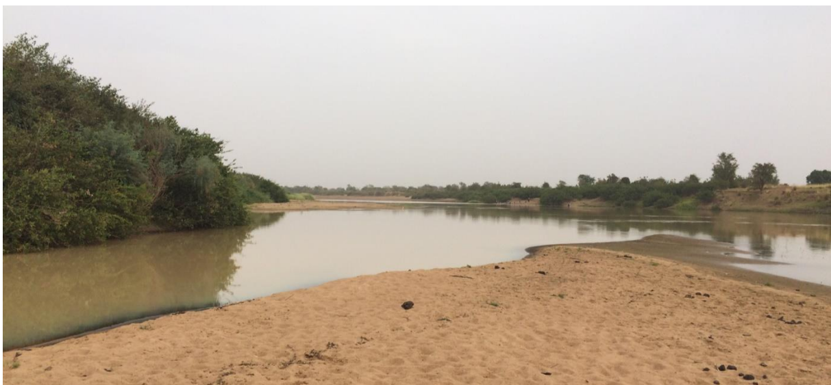
Habitat van Krokodilwachter bij Tamale, LS