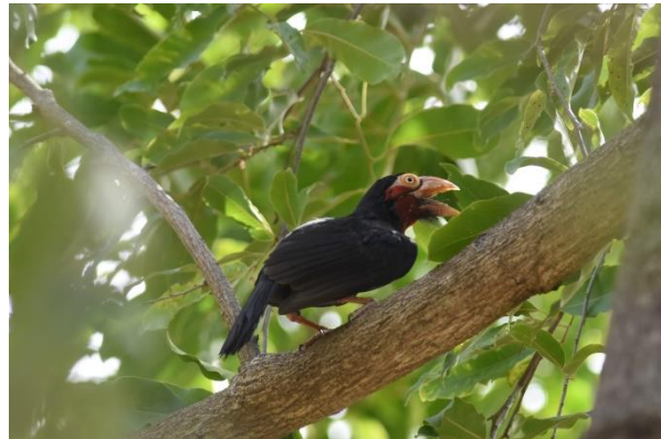
Nothern Puffback en Bearded Barbet, Mole NP, LS