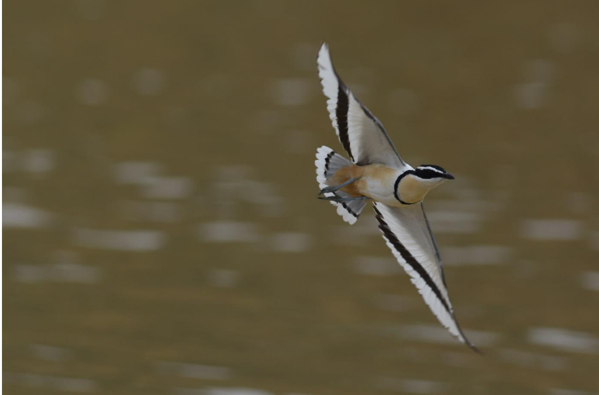
Krokodilwachter bij Tamale, LS