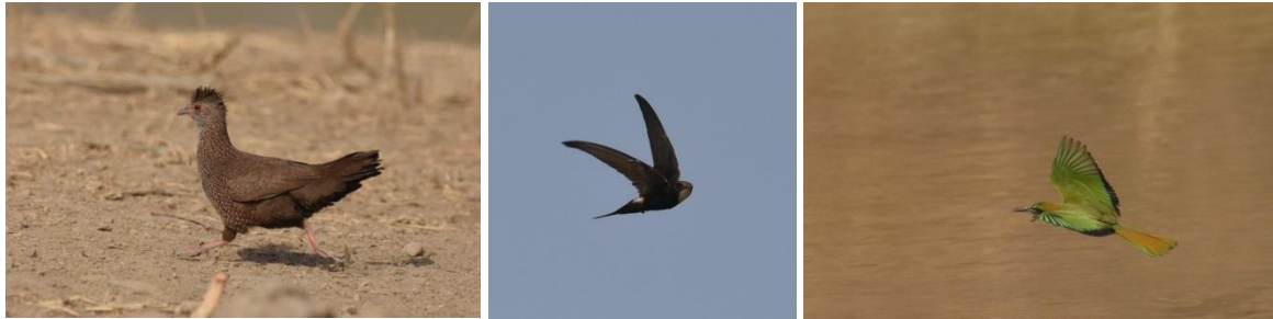
Stone Partridge, White-rumped Swift en Red-throated Bee-eater, Mole NP, LS

we naar een andere open plek, zonder resultaat. We keren dus maar terug naar de grote vlakke waar we begonnen zijn en daar loopt er zowaar één. Wat een gaaf beest! Meer een soort Morinelplevier die op droge, open vlaktes zit, terwijl de vogel qua uiterlijk natuurlijk veel weg heeft van Three-banded Plover.