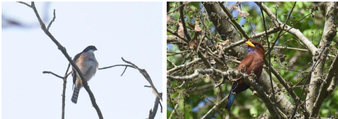
Red-thighed Sparrowhawk en Blue-throated Roller, Bobiri Forest, LS