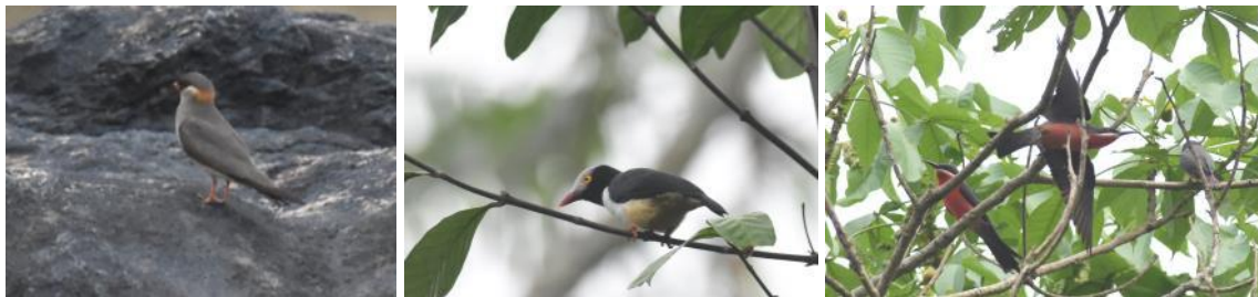
Rock Pratincole, Red-billed Helmet-Shrike en Rosy Bee-eater, Kakum NP, Ghana, LS

We hebben vandaag wederom een vroege start waarbij we weer andere delen van het zeer rijke Kakum National Park bezoeken. Het half open gebied was meteen aardig productief met Levallants Cuckoo, Pale Flycatcher, Purple-throated Cuckoo-shrike, Chestnut-capped Flycatcher, Western Nicator en Mottled Spinetail. Dan lopen we een bostrail op waar we meer horen dan zien. Maar gelukkig weet onze gids wel raad met geluiden. Een Black-capped Illadopsis blijft nog verborgen maar twee Red-billed Helmet-shrikes laten zich langdurig in de telescoop bekijken en ook fotograferen. We lopen het bos weer uit en genieten van een boom met enkele 10-tallen Rosy Bee-eaters, nu eens gewoon ter plaatse en niet hoog overvliegend.