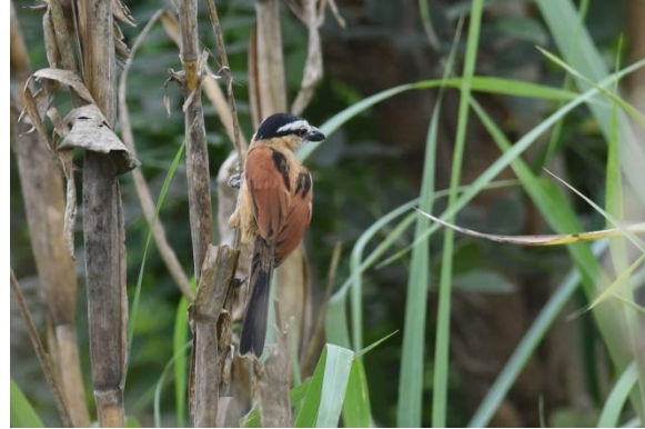
Black-throated Coucal en Marsh Tchagra, Atewa Forest Range, LS

Hierna was het spullen pakken en rijden naar het vliegveld voor onze terugvlucht naar Amsterdam, maar niet voordat we een heerlijk afscheidsdiner hebben bij een gezellig restaurantje bij het vliegveld. De vlucht verloopt probleemloos zodat we de volgende ochtend op tijd aankomen op Schiphol en terug kunnen kijken op een bijzondere en geslaagde reis door Ghana.