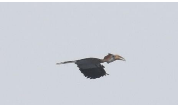
Chocolate-backed Kingfisher en Yellow-casqued Hornbill, Ankasa NP, LS

Dan is het spullen pakken, lunchen en terugrijden naar de Rainforest Lodge. Onderweg stoppen we bij een savanne-achtig gebied maar we staan nog niet buiten of het begint te waaien en even later hard te regenen. Een zwaar front komt overzetten wat prachtige wolkenluchten op levert. Vanuit de bus zien we nog wel Pied-winged en Ethiopian Swallow maar het weer wordt het niet beter op zodat we uiteindelijk moeten besluiten naar de lodge te gaan. We genieten weer van een heerlijke kamer, een warme douche en lekker eten na ons avontuur in Ankasa.