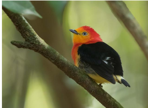
Band-tailed Manakin (Jos)