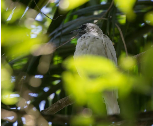
Bare-throated Bellbird (Jos)