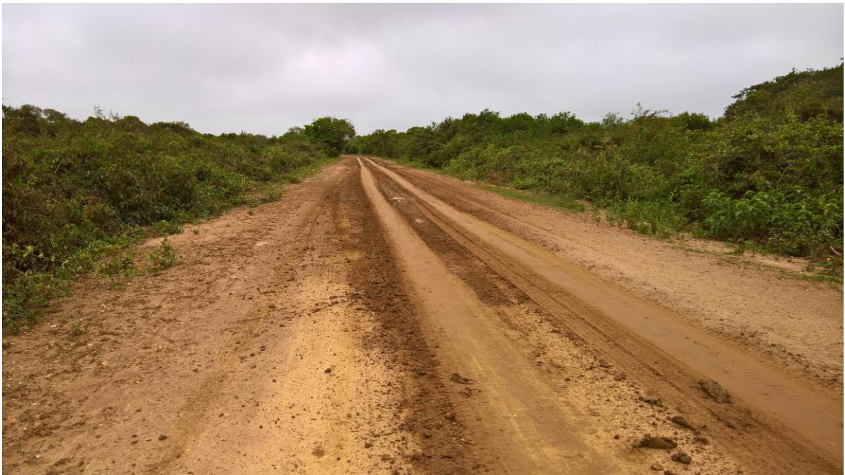
Weg door de cerrado in Chapada (Matthijs)