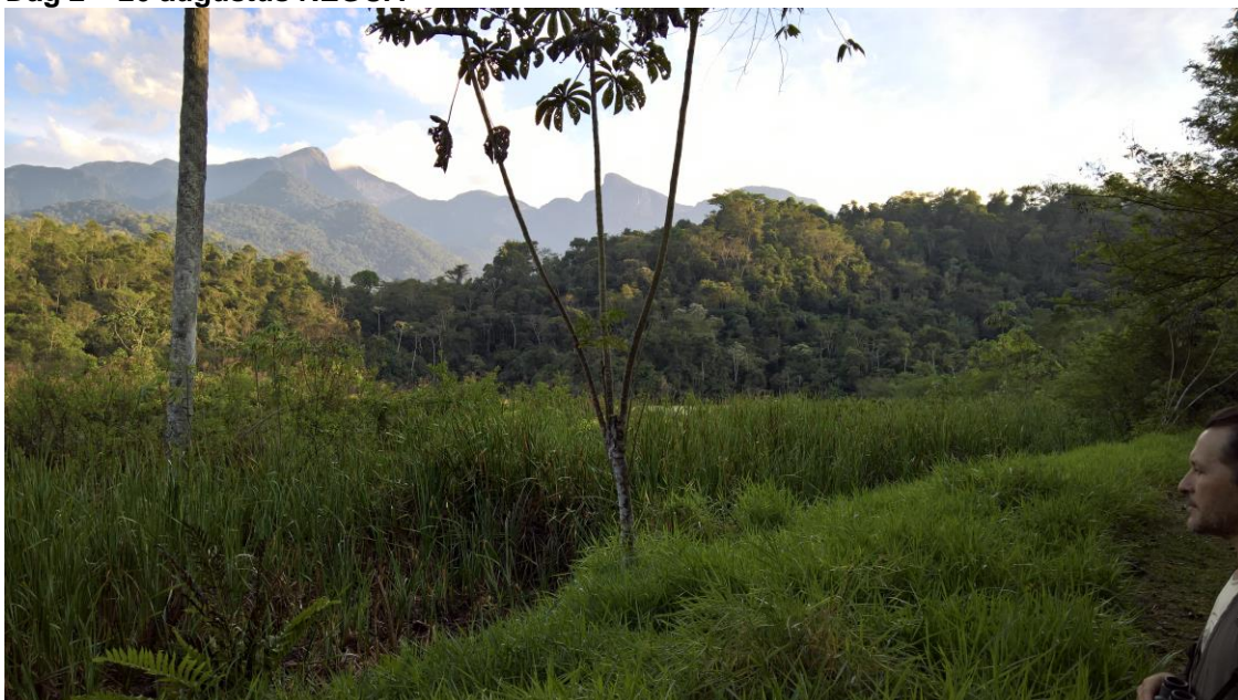
Reserva Ecológica de Guapiaçu en Adelei (Matthijs)