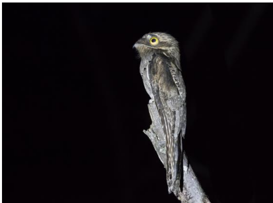
Common Potoo (Jos)

Als we terugvaren zien we in de schemer een reigertje invallen en horen vervolgens de roep van een Zigzag Heron. Helaas laat deze weliswaar minder kleurrijke maar moeilijk te vinden soort zich niet zien. Het is nu donker geworden en in het schijnsel van de zaklamp zien we een Common Potoo in de top van een dode boom.