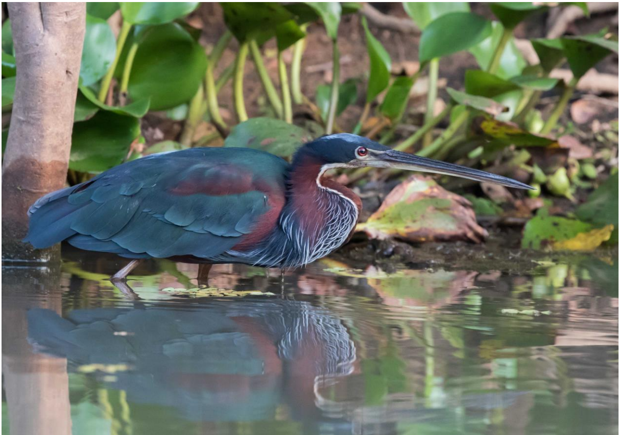
Agami Heron (Jos)