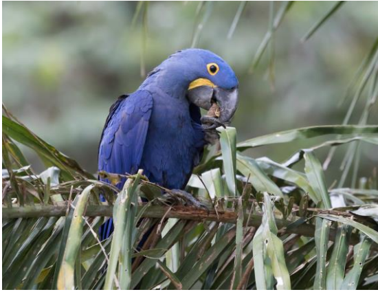
Hyacinth Macaw (Jos)