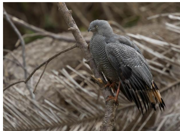
Crane Hawk (Jos)