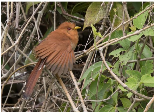
Little Cuckoo (Jos)