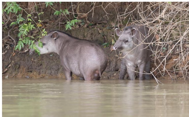
Lowland Tapirs (Jos)