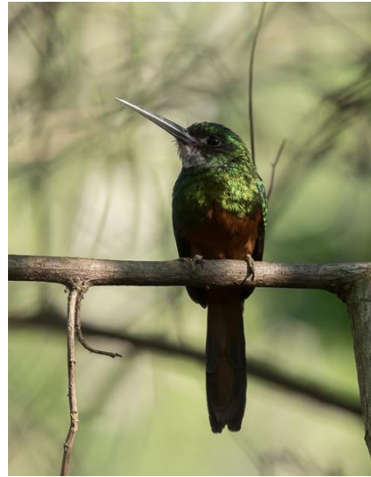
Rufous-tailed Jacamar (Jos)