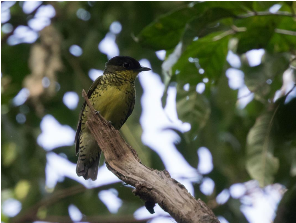
Shrike-like Cotinga (Jos)

De laatste dag in Regua is aangebroken. We maken in de morgen een wandeling over de forest trail. Dit blijkt een zeer vogelrijke excursie te zijn. Als we langs een kleine plas lopen zien sommige van ons een zeldzame Azure Gallinule. Ook laat een Rufous-sided Crake zich op korte afstand zien. Een zeker niet volledige opsomming van de vele nieuwe soorten die we voor de trip noteren; Reddish Hermit, Yellow-throated Woodpecker, Black-capped Foliage-cleaner, Lesser Woodcreeper en White-bibbed Antbird (e). Een mannetje Shrike-like Cotinga of Elegant Mourner (e) laat zich open en bloot bewonderen. Als we voor de lunch terugkeren in onze accommodatie hebben we maar liefst 95 soorten waargenomen. Na het middageten pakken we onze koffers en vertrekken rond 15.00 uur richting Rio. Door het druilerige weer en de avondspits duurt de busrit langer dan verwacht. We arriveren op tijd voor onze binnenlandse vlucht naar Cuiaba. Daar aangekomen worden we door chauffeur Milson en onze lokale gids Fabiano opgevangen en krijgen sandwiches aangeboden. Laat in de avond arriveren we op ons volgende logeeraadres in Chapada dos Guimarães zo'n 2.000 km ten westen van Regua.