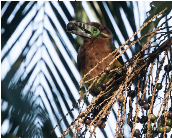
Spot-billed Toucanet (Jos)