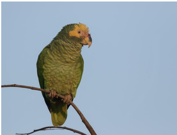
Yellow-faced Parrot (Jos)

De volgende stop is aan de rand van de Rio Claro vallei. We lopen over een schaars begroeide heuvel naar beneden en zien enkele King Vultures boven ons zweven. Grote groepen Biscutate Swifts scheren door de lucht. Een mannetje Blue Finch laat zich van dichtbij bewonderen. Bij een groepje bomen en laag struweel laat een Helmeted Manakin zijn rode 'Elvis Presley-kuif' zien. Een groepje Stripe-tailed Yellow-Finches foerageert op lage vegetatie. Bij een ondergaande zon vertrekken we voldaan richting Chapada. Als we het stadje bereikt hebben zien we in de schemer enkele jagende Nacunda Nighthawks.