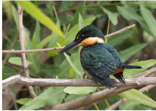
Green-and-rufous Kingfisher (Jos)