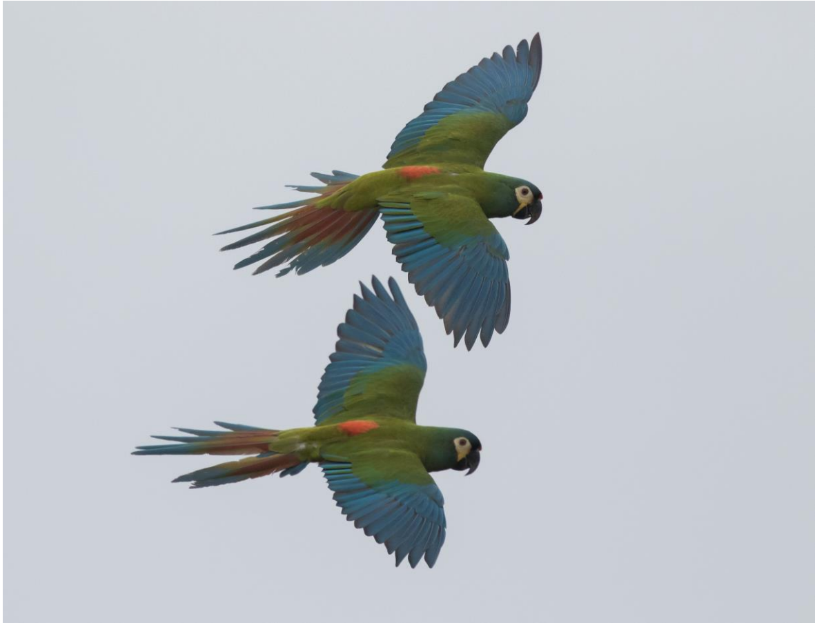
Blue-winged Macaws (Jos)