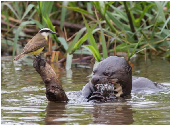
Great Kiskadee en Giant Otter (Jos)

Zoals enkele White-rumped Sandpipers (Bonapartes Strandlopers) die op korte afstand op een zandbank lopen te foerageren. Ook zien we enkele zeer fraaie spechtensorten zoals de Golden-green Woodpecker. Dit is een vrij kleine specht met een groen gestreepte onderkant en gele keel. Cream-colored Woodpecker, eveneens niet groot en zoals de naam al aangeeft grotendeels crème-kleurig met een lichte snavel. Het mannetje heeft daarnaast nog een rode vlek onder het oog. De derde soort is de Crimson-crested Woodpecker, een iets grotere soort met een vuurrode kop en donker gestreepte onderzijde.