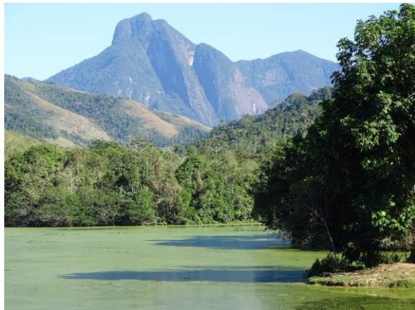
Reserva Ecológica de Guapiaçu (Hidde)