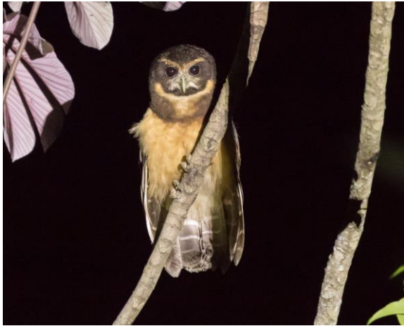
Tawny-browed Owl (Jos)