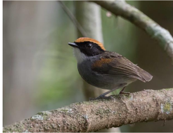
Black-cheeked Gnateater (Jos)