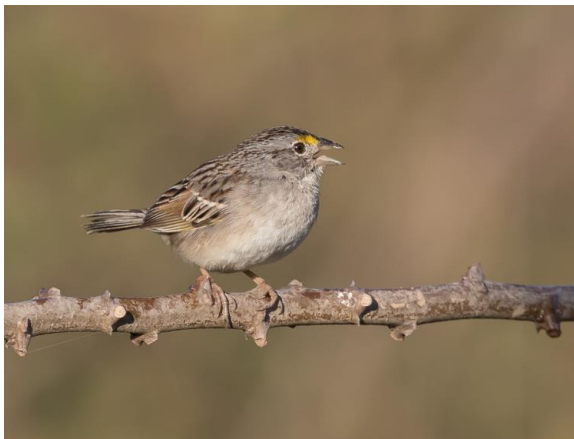
Grassland Sparrow (Jos)

Op grote afstand horen we de schaterende lach van onze eerste Red-legged Seriema van de reis. Even later krijgen we deze majestueuze vogel ook te zien. Firewood-gatherer en White-rumped Monjita vinden we naast elkaar. Een laatste stop op de terugweg bij enkele bloeiende struiken bezorgt ons nog Sapphire-spangled Emerald en Rufous-throated Thornbird. Als we 'thuiskomen' is de duisternis ingetreden.