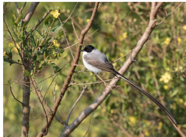
Fork-tailed Flycatcher (Jos)