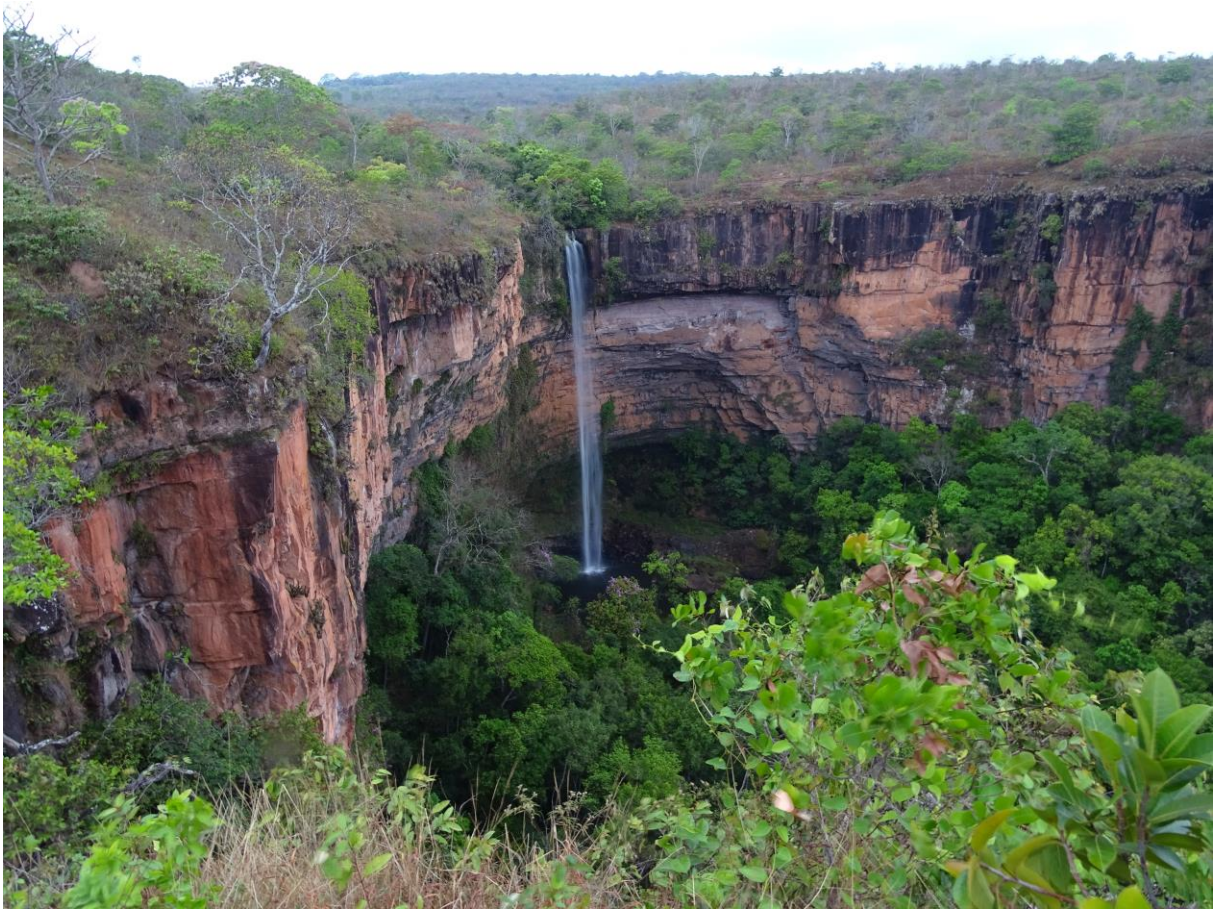
Waternival Véu de Noiva (Hidde)