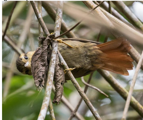
Buff-fronted Foliage-gleaner (Jos)