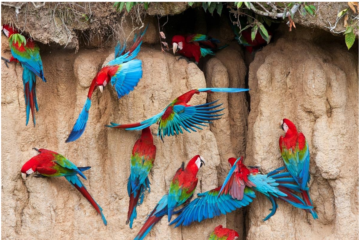
Red-and-Green Macaws, Manu NP, Peru, september 2015