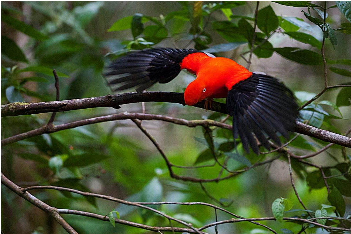
Andean Cock-of-the-Rock, Manu Road, Peru. September 2015.

We hoefden vervolgens nog een klein stukje te rijden totdat we bij de Cock-of-the-Rock lodge arriveerden. Prachtig gelegen aan de rivier en bekend onder de vogelaars vanwege de (kolibrie) feeders in de tuin. Vlak voor donker werden nog enkele kolibrie soorten waargenomen totdat het te donker was om nog vogels te kijken. De rest van de soorten moest tot morgen wachten. Om 19.00 werd het avondeten opgediend waarna iedereen moe maar voldaan zich terugtrok. Morgen weer een belangrijke vogeldag!