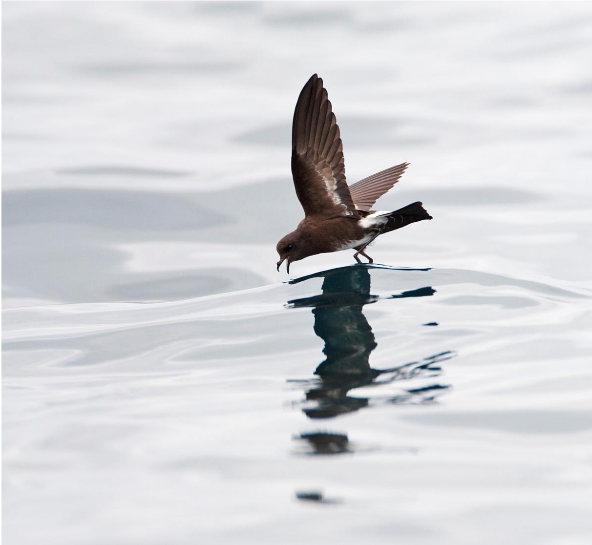
Sierlijke Stormvoetje, Pacifische Oceaan buiten Lima, Peru. September 2015

Na 1,5 uur wachtend bij het chum moesten we helaas al weer weg. Onderweg weer dezelfde grote aantallen zeevogels en dolfijnen, met daartussen diverse Waved Albatrossen en meerdere plakaten rustende zeevogels op het water - een prachtig gezicht, zo'n 'olievlek' met 100-den Grauwe Pijlstormvogels.