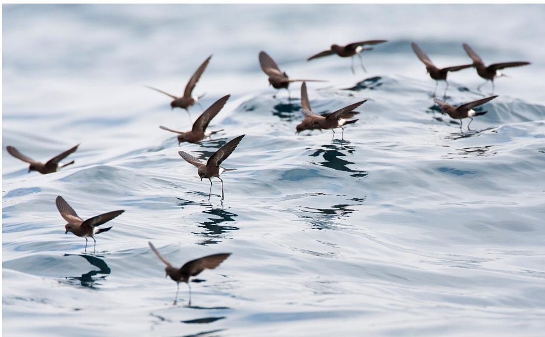
Sierlijke Stormvogeltjes, Pacifische Oceaan buiten Lima, Peru. September 2015 (Marc Guyt)

Om 11.11 hadden we onze geplande stop om te chummen, en in de 1,5 uur dat we hier stil lagen hadden we fantastische waarnemingen van supersoorten als Cook's Petrel, Ringed Storm-Petrel, Elliot's Storm-Petrel (100-den!), White-chinned Petrel en zelfs een zeldzame Galapagos Petrel.