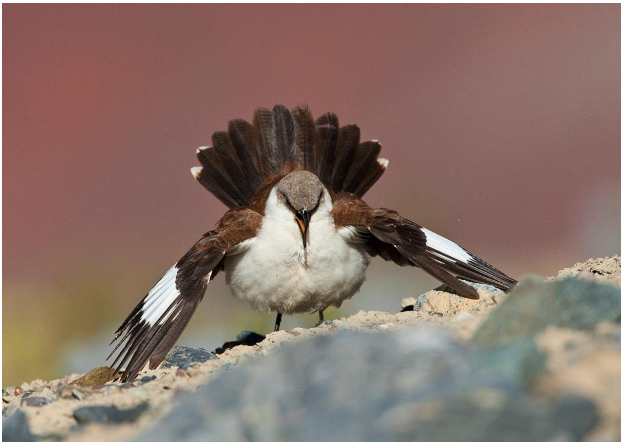
White-bellied Cinclodes, westelijke Andes, Peru, september 2015.

Nog vanuit de bus zag Marc de eerste vogel al staan - de superzeldzame en zeer fraaie White-bellied Cinclodes! De vogel vloog gelijk weg maar na 5 minuten zoeken werd de vogel een stuk terug langs de weg terug gevonden. Hierna werden al snel nog een aantal exemplaren gevonden met als absoluut hoogtepunt 5 baltsende vogels (2 paartjes en een los exemplaar). Wat een gaaf gedrag! Menigeen ging met zeer fraaie foto's terug naar de bus voor het welverdiende ontbijt.