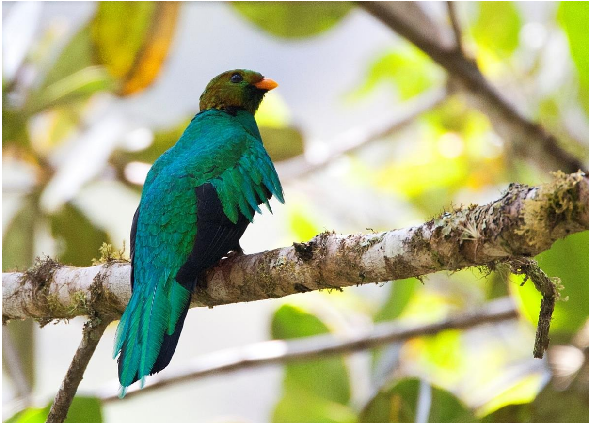
Golden-headed Quetzal, Manu Road, Peru. September 2015.

Wakker worden op de Manu road. Altijd een goed gevoel. Deze ochtend wel een hele vroege sessie, om 5.00 stonden de die-hards al te wachten bij de ingang voor een poging voor Swallow-tailed Nightjar, die regelmatig boven de lodge langs de weg wordt gezien. Helaas deze ochtend niet maar tijdens de wandeling terug weer een paar fraaie flocks met bij de ingang van de lodge een clubje fraaie Hooded Mountain-Tanagers. Na het ontbijt was het de bus inpakken en daarna langzaam naar beneden rijdend. Onderweg werden bij diverse geplande en ongeplande stops gemaakt, indien er een flockje werd opgemerkt uit de rijdende auto. Hoogtepunt voor de lunch was de Golden-headed Quetzal, samen met twee soorten Fruiteaters in dezelfde boom. Na de lunch was het de schaarse Black-streaked Puffbird die de show stal.